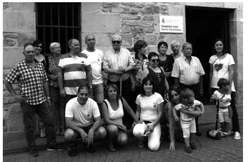
Eraildako senideak txupinazo egunean.