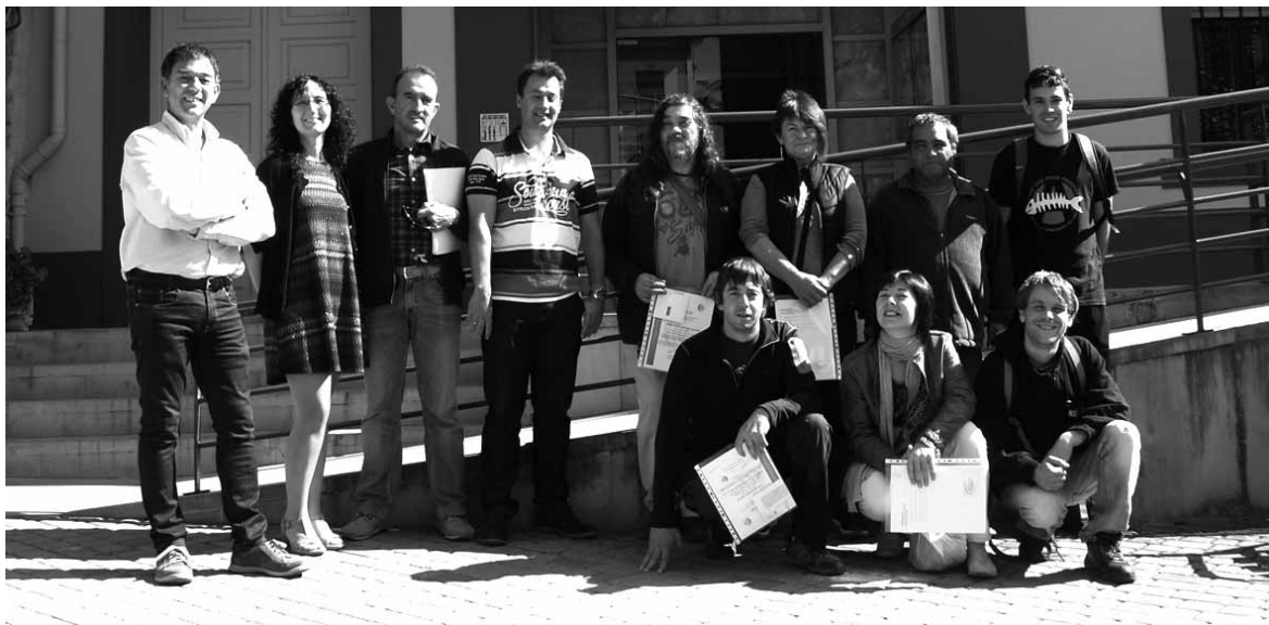
Lacunza Kalor Groupeko ikastaroagatik diploma jaso dutenak.