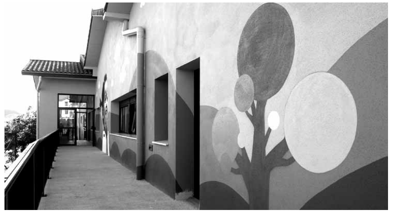
Kattuka haur eskolako fatxada nagusia.

Zerbitzua martxan jartzeko begiraleak behar ditu Arbizuko Udalak eta, horregatik, deialdia egin du. Izen ematea atzo despeditu zen.