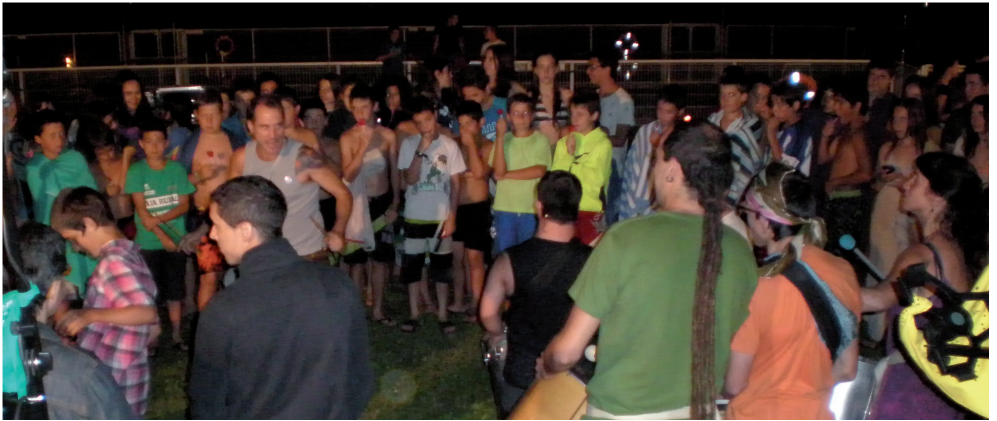
Batukadaren doinuekin dantzan. GOZAMENEZ PROGRAMA.