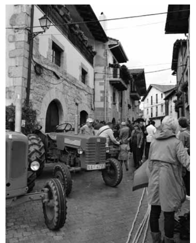
Irurtzungo Bertako Ganadu Azoka.

dago ikastaroa. Sei orduko ikastaroen bidez produktuen merkaturatze egokirako gakoak zein diren azalduko dira. Ikastaroa hilaren 17an eta 19an, astelehenean eta asteazkenean, izanen da, 16:00etatik 19:00etara Arbizuko industrialdean dagoen Utzuganen, Sakanako garapen gunean.