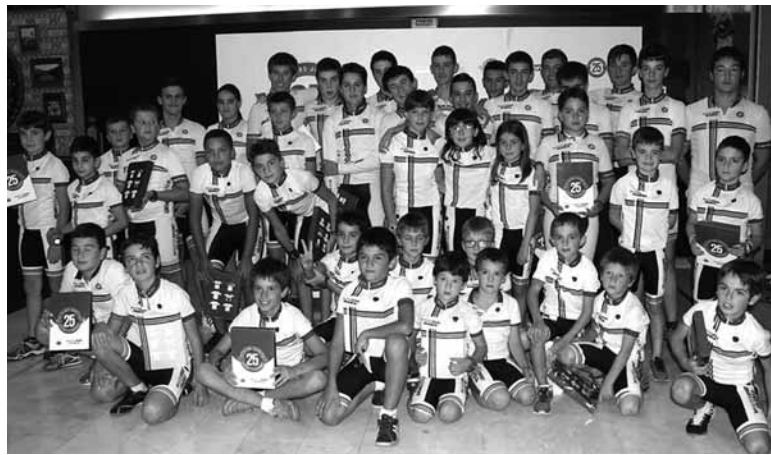
Egungo Aralar klubeko txirrindulariek talde argazkia egin zuten.