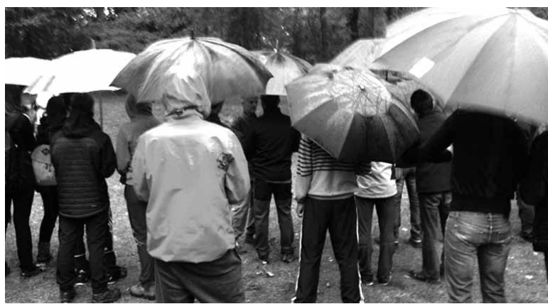
2016ko Gudari Eguna euripetan.