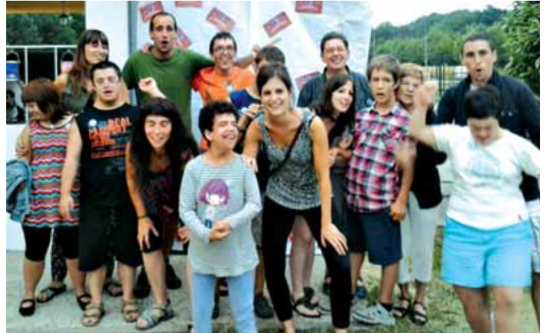
Mila kolore elkarteko kideak.