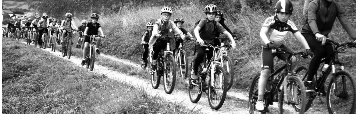
Sakanako Bizikleta Egunean bide, xenda eta toki ederretatik pasa ziren Irurtzundik atera eta Altsasuraino heldu zirenak.

da zeudenek goizean goiz hartu zuten autobusa, Irurtzuneraino joateko. Bizikletak kamioietan eraman zituen antolakuntzak.