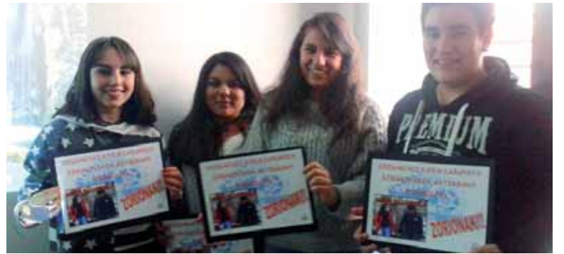
Film laburren saridunak.

tzeko asmoarekin. Aurtengoa gauza berezia eta handiagoa izanen da. Baina hemendik aurrera orain arte bezala, gauza xumeagoak edo antolatuko ditugu”.