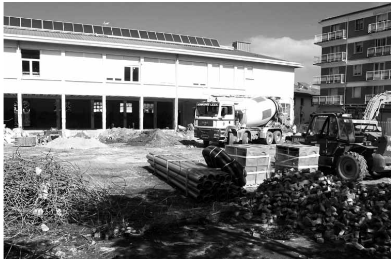
Hasi berri diren lanek ekarriko dute haur eskola.