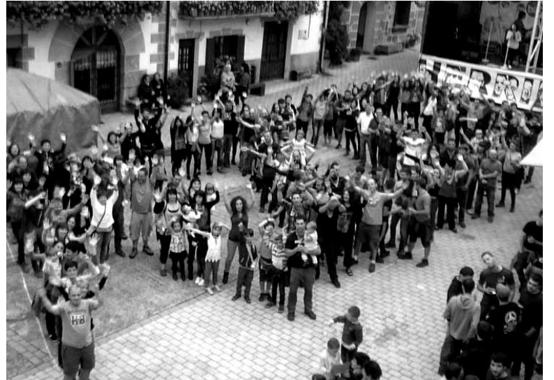
Giza mosaikoa Bakaikuko plazan, deialdia egiteko.

tzat dugu, eta hori lortu ahal izateko parte-hartze zabala behar beharrezkoa da", gaineratu dute.