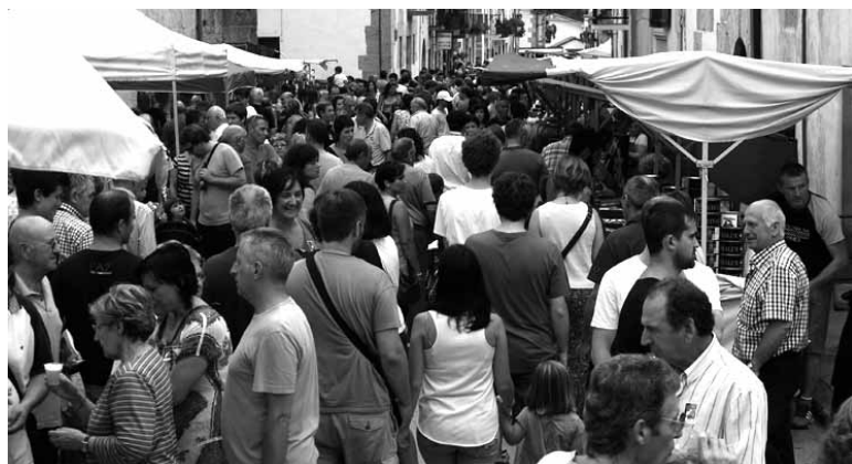
Uharteko Artzai egunak jendetza biltzen du urtez urte.