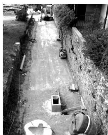
Zoru berriaren prestaketa lanak.

Kontu txiki batzuen faltan, despeditu Bakaikuko Udalak aurten egin behar dituen lanik handienak. Iriondo kaleari 185 metrotan porlanezko zorua jarri diote. Horrekin batera, euri urak hartzeko estoldak ere jarri dituzte kaleerdian. 30.000 euroko aurrekontua izan dute lanek. Hurrengo erauntsiak ez du kaleko kaxkailu guztia Elizpea kalean utziko, eta euritearen ondoren kalea ibiltzeko moduan geldituko da berriz, zulorik gabe. Hori baitzen orain arte gertatzen zena.