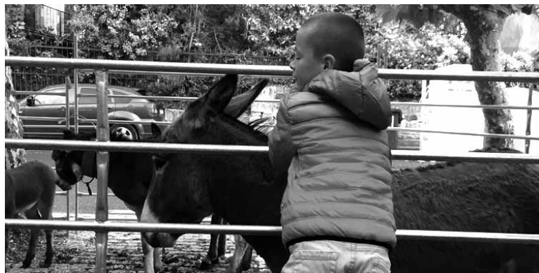
Joan den urtean nora begiratu bazegoen.