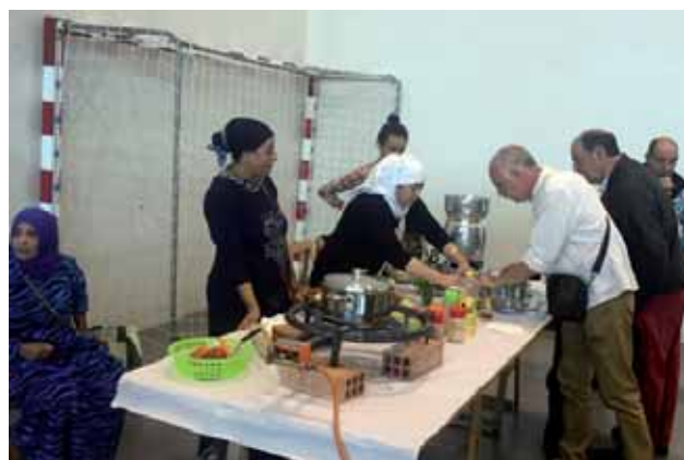
Olatzagutiko San Migel eguneko ferriako irudiak