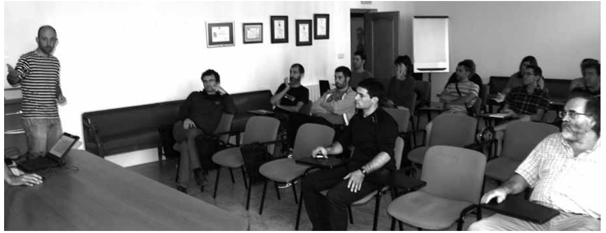
Sakanarako telekomunikazio proposamenaren aurkezpena.

Herenegun goizean bertan, bai SGako bai Guifineteko ordezkariak Nafarroako Gobernuarekin sei orduz bilduta egon ziren. Saka-