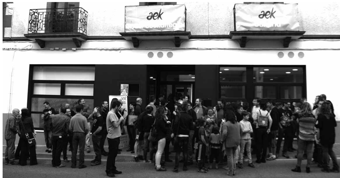
Altsasuko euskaltegiaren mustutzea hau berri ondoren.