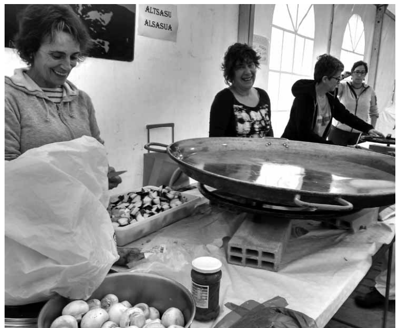
Parte-hartzaile guztiendako bazkaria izan zen dastaketaren ondoren.