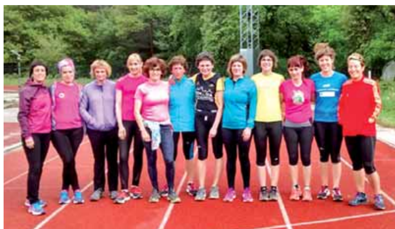
Aurreko denboraldiko Sakanako Emakumeendako Atletismo Eskolako kideak.

Izena ematea zabalik dago, urriaren 7ra arte, Mank-eko kirol zerbitzuan (948 464 866, kirolak@sakana-mank.eus).