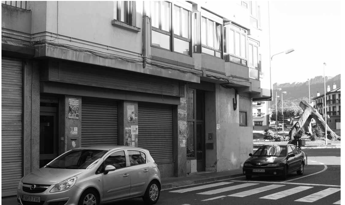
Banco Vasconia zen lokala har dezake beilatokiak.

Sinadura bilketaren sustatzaileek diotenez, "pertsona bat hiltzen denean, maitatzen dutenek giro lasaia, barea behar dutela lagun maitea agurtzeko ulertzen dugu". Trafiko gehien duen kale Nagusia baldintza horiek ez dituela betetzen uste dute. Aldi berean, inguruan nahikoa aparkalekurik ez dagoela nabarmendu dute. "Ez dago leku ireki bat non hitz egin,