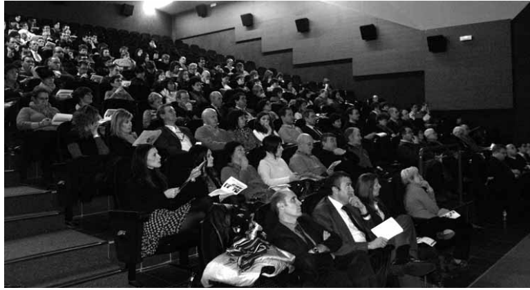
Industriako eragileak deituak izan dira asteazkeneko jardunaldira.

Jardunaldira joaten direnak beste eskualdeetako industrien elkarlan esperientziak ezagutzeko aukera izanen dute; "Sakanako enpresek ikusi dezaten nola gaiztatu dezakegun egoera hori.