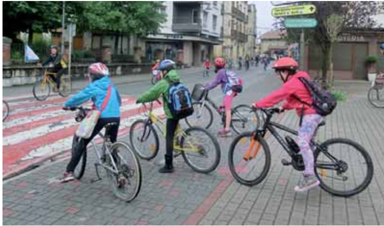
Iñigo Aritza ikastolako haurrak ikastetxera bizikletaz joaten.

izanik, 181 haur (3 gutxiago, %1,63ko jaitziera). LHn, estreina-koz, B ereduak matrikulazioa %5etik jaitzi da; zazpi hamarren jaitzita %4,5ean gelditu da, 61 haur (10 gutxiago, %14,08ko jaitziera).