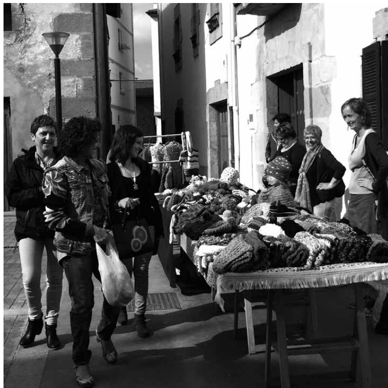
San Migel plazan denetarikoko postuak izanen dira.

San Migelen omenezko ospakizunak asteburua eta saindua eguna, osteguna, hartuko dute Olatzagutian. Igande goizean, ohiko artisau azokarekin batera, bi berritasun izanen dira. Batetik, Sakanako Mankomunitateko Immigrazio Zerbitzuak antolatutako Munduko Arrozak ekimena. Goizean zehar Marokon, Senegalen, Gambian, Brasilen, Bulgariaren eta Olatzagutian arroza nola prestatzen diren ezagutzeko aukera izanen da. Guztiak prest daudenean, 14:00ak aldera, prestatutako arroza dastatzeko aukera izanen dute azokara hurbildutako guztiak. Arroz aleen modura, nor bere zapoarekin, baina denak berdinak garela adierazi nahi du ekimenak.