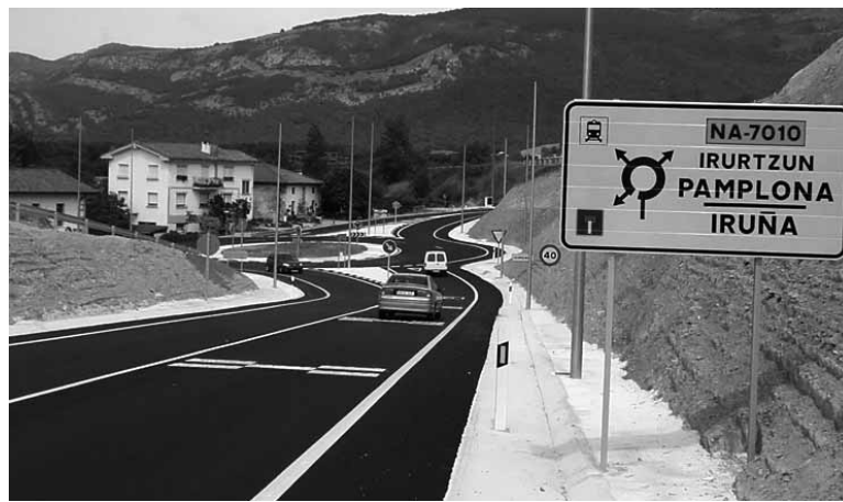
Galtzada berriaren itxura.

Ibilgailuek trenbidea ez dute zeharkatu beharrik, eta haren gainetik pasako dira oinezkoak. Horretarako metalezko pasabide bat eraiki da. Auzokideak kexu dira trenbide pasa kendu zenean pasabidea eraiki gabe zegoelako eta horrek buelta handiagoa emate