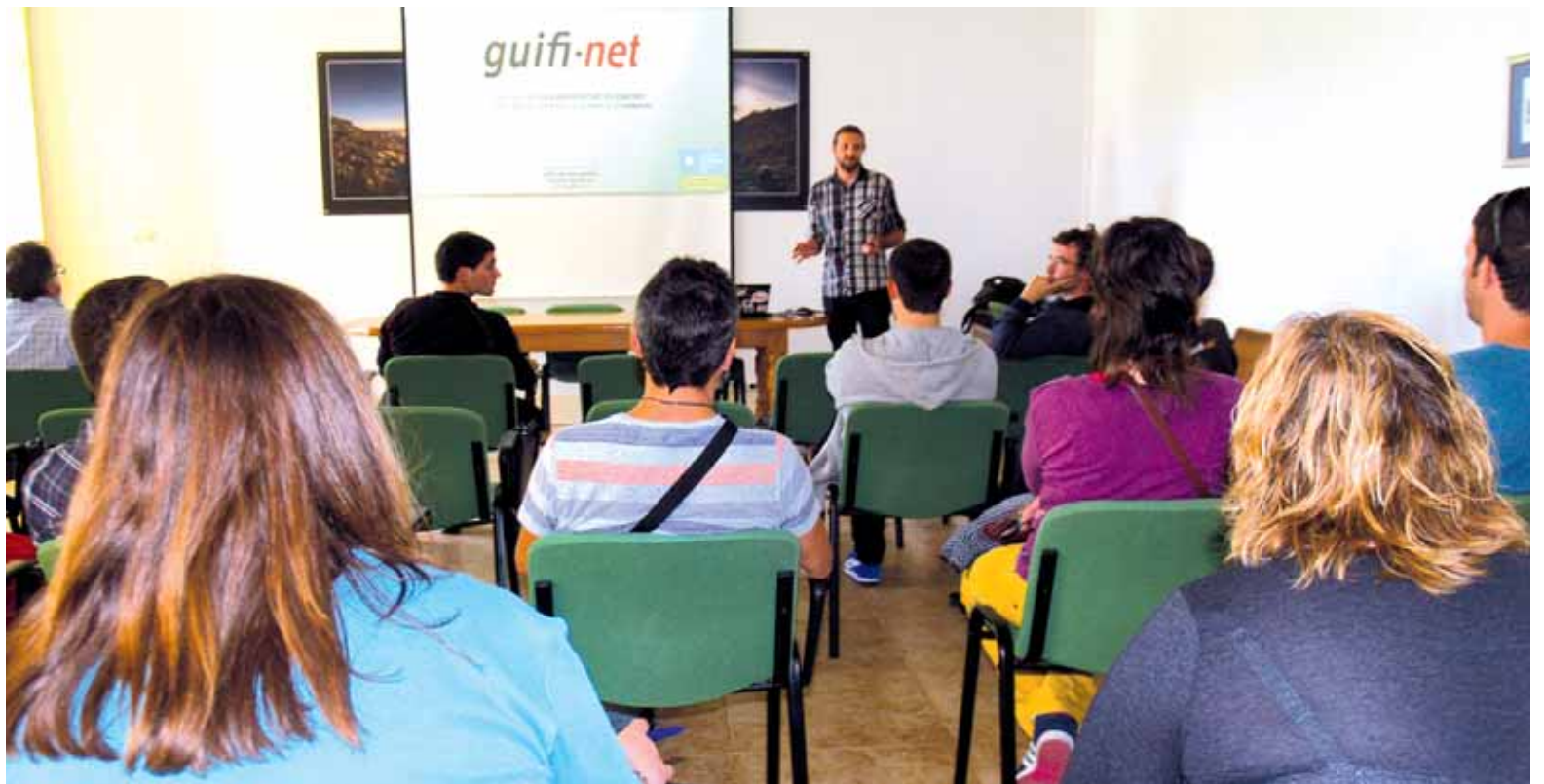
Sakanako Garapen Agentziak eta Guifinet fundazioak landu dute epe motz ertainerako telekomunikazio proposamena.

Etxarrin sinadura bilketa hasi dute >> 8