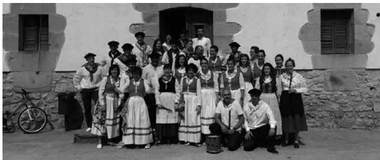
Ihabarren bukatutako festek oroimenenerako irudiak utzi dituzte.

Festetako argazki galeriak: www.guaixe.eus-en