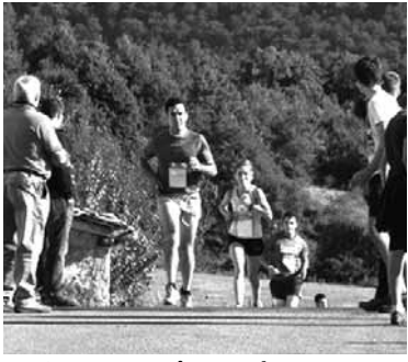
Aurten Dorraon izango da.