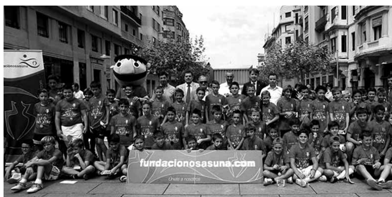
Etxarriko irabazleek irabazi dute 3x3 Futbol Plazako finala. OSASUNA FUNDAZIOA