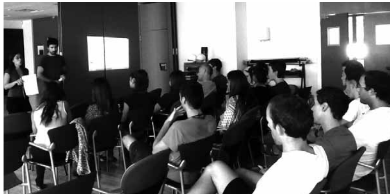
Monitoreak, euskara gehiago erabiltzeko erabili ahal dituzten tekniketan jantzen.

jardueretan euskararen erabilera sustatzea, eta, horretarako, hainbat estrategia eta tresna eskaini zaizkie monitoreei, neurri handi batean haien esku baitago entrenamenduetan erabiltzen den hizkuntza.