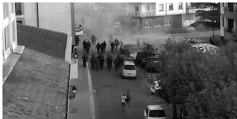
Debekuaren hitzetan gertatutako istiluak.

Debekatuta zegoela eta ezin zela manifestaziorik egin. Horixe esan zien Amnistiaren aldeko eta Errepresioaren kontrako Mugimenduko kideei (AEM) Guardia Zibilaren buruak larunbatean. 19:00ak ziren eta Guardia Zibilak kide ugariekin plaza hartua zuen. Etxarriarako bidean ere kontrolak jarri zituzten eta haietako batean, Altsasun, Bilbotik zetorren autobusa ordu erdiz geldirik izan zuten. Arbizun ere ibilgailuak geldirik izan zituzten. Deialdiak batutako pertsonak, batzarrean, manifestazioa egitea erabaki zuten. Plazatik ikastola zaharreraino joan ziren, 20:00etan. Bidean honako leloak oihukatuko