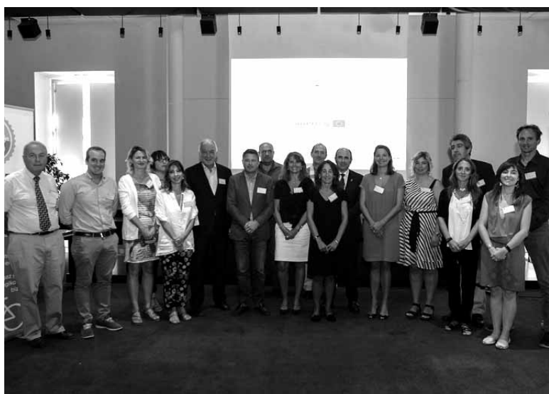
Baionan ospatutako lan bilera.

Iruña, Donostia eta Lapurdiko hiriburua bizikletaz ibiltzeko bideen bitartez elkartuko dituen egitasmoak Ederbidea izena du (238 km-ko sarea). Lotura hori Arakil eta Irurtzunen barna egingen da, Plazaolako bide berdearen bidez. Nafarroa, Gipuzkoa eta Pirinio Atlantikoetako ordezkariak Baionan 2016-2019 eperako bizikleta gaineko garraio iraunkorreko proiektua abian jartzeko ekitaldian elkartu ziren asteazkenean. Hiru urteko lanari hasiera eman zioten. Egitasmoak 9,4 milioi euroko inbertsioa du.