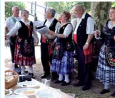
Extremadurako egunaren ospakizunak.