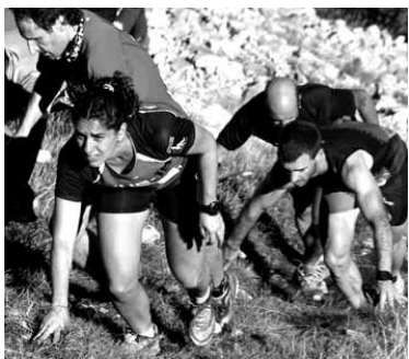
Korrikalariak, indar betean. ARLEGI