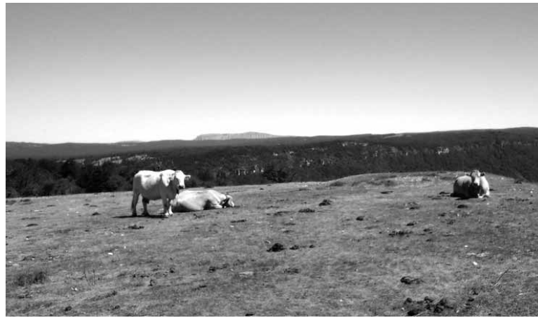
Lehorretan ezin egona.