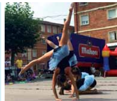
Intxostiako festak 5. aldiz ospatu ziren.