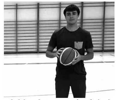
Zabalok Basket Navarran jarraituko du.

Zilarrezko mailan lehiatuko da Nafarroako taldean