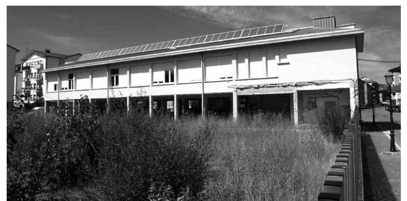
Navarro Villoslada zen eraikinak hartuko du haur eskola.

Bestalde, alkateak azaldu digunez, udal aurrekontuetan jasoak zeuden Zelandi eskolaren komun berritzea heldu den astean despedituko da. Lanak, azkenik, Gipuzkoako enpresa batek egin ditu, bertakoei prozedura negoziatu bidez eskaini eta hartu ez dutelako. 29.000 euroko inbertsioa izan da.