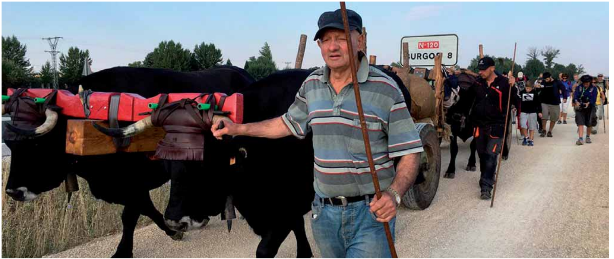
Bigarren etapak, Burgostik abiatu eta Pasaia helmuga.