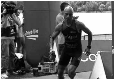
Igeriketa tartea bukatzen.