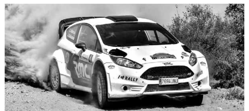
Berogatik, rally oso gogorra izan zen Cerverakoa.