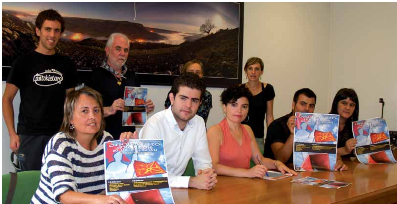
Otsoportilloko ekitaldia hamar udalen artean antolatuko dute aurrerantzean.

Mank-ek euskara ikasleendako diru-laguntza deialdia egiten du urtero. >> 5