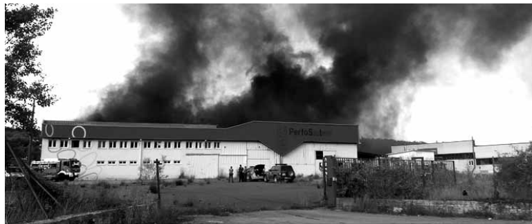
Bestalde, agorrilaren 8an Altsasun hutsik dagoen Perfo System lan-tegi zaharrean sua piztu zen. Garai batean koltxoak egiteko erabiltako materiala erre zen eta hura itzaltzeko lanetan Iruñea, Altsasu eta Aguraingo suhiltzaileak izan ziren. Bi ordu eman zituzten garrak itzaltzen.