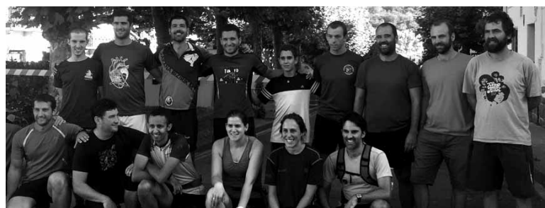
Guardetxe igoeran parte hartu zuten korrikalariak.

Zabalartek Lakuntzan antolatutako lasterketan 17 korrikalari lehiatu ziren