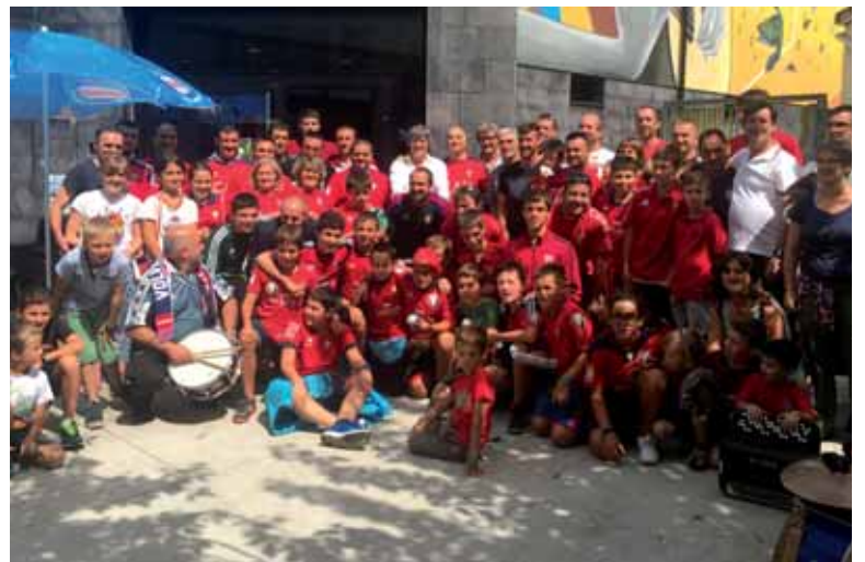
Goian, Osasunako zaleak Martinekin eta Oierrekin. Behean, Athleticceko zaleak.

Ekitaldiko argazki galeriak: www.guaixe.eus