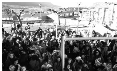
Aurreko lip-duba grabatzen.