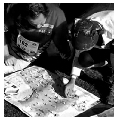
Egin beharreko bidea mapan zehazten.