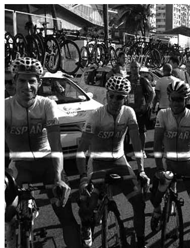
Erbiti Rion, proba hasi baino lehen.