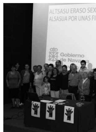
2015eko agerpen publikoa.