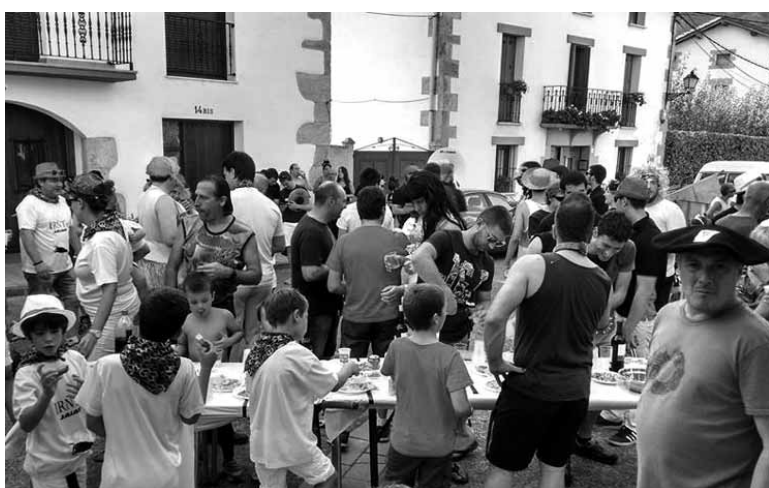
Irintarrak auzatean indarra hartzen.

Festetako argazki galeriak: www.guaixe.eus-en