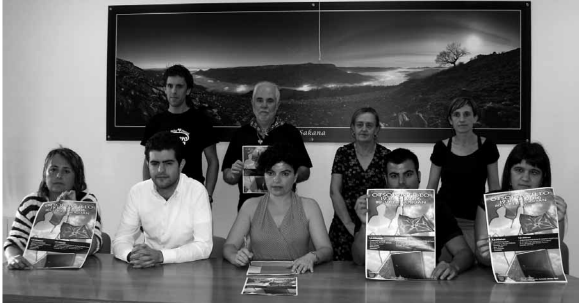
Otsoportilloko ekitaldia udal ordezkariak aurkeztu zuten.