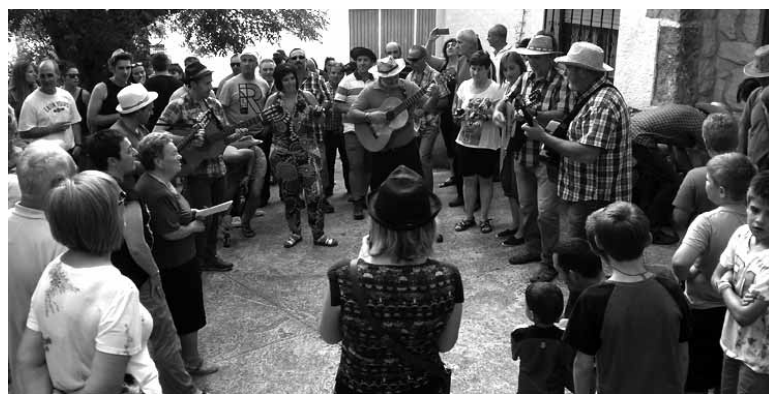
Dorrobarrak errondan kantari.