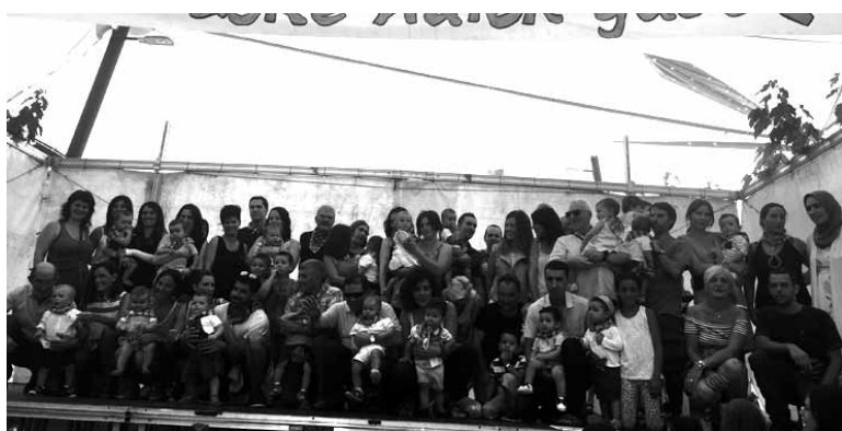
Aurtengo kintoak estreinakoz festetan elkartu dira.