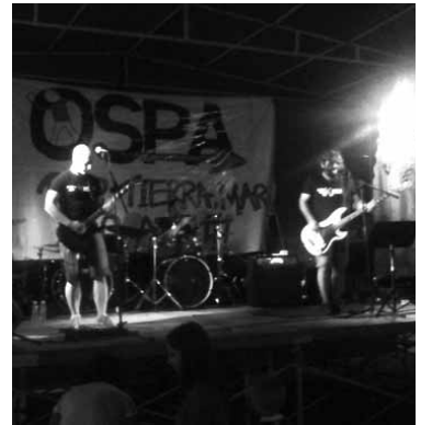
Txep taldearen kontzertua.

Ospa eguna larunbatean ospatu bazen ere, asteazkenaz geroztik Guardia Civilaren helikopteroa Altsasun bueltaka izan zen. Aurreko egunetan kalez jantzitako agenteak ere izan ziren. Egunean bertan herri sarreretan kontrolak izan ziren eta antolatutako kalejira gertutik zaindu zuen Guardia Zibilak. Kalejiraren ibil-