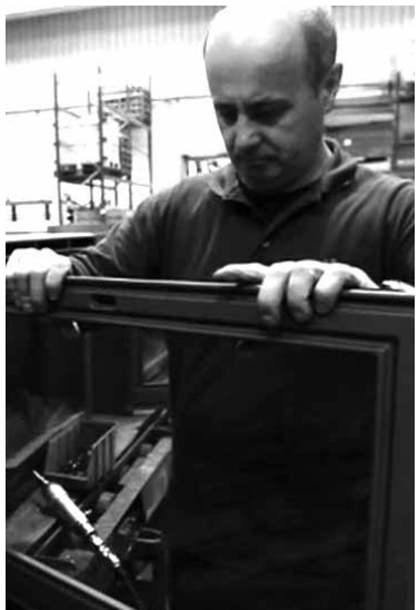
Lacunza Kalor Groupeko langile bat.

praktikak egin ditzaten. Guztia eskualdeko langabetuen garapena eta prestakuntza errazteko. Antolatzaileek argitu nahi izan dutenez, ikastaroko parte-hartzaileek ez dute enpresan lan egiten.