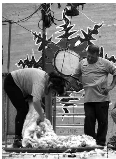
Ardi motzailleak lanean..