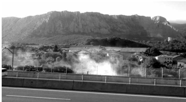
Ziordia suhiltzaileak belar sutea itzaltzen udan.

Zorionez ez dira sute handiak izan, baina agorrilean nahikoa lan izan dute suhiltzaileek Sakanan. Izandako temperatura altuek landaretza lehortu dute eta sua erraz zabaltzeko arriskua handia izanik, hala gertatu da. Hala, agorrilaren 6an suhiltzaileek Olatzagutian mendi sute txikia itzali behar izan zuten. 12an, berriz, Hiriberrin izan zen, Sakanako Autobiako (A-10) erdibitzailean. Ziordiarra agorrilaren 18an eta 23an joan behar izan zuten sute txiki pare bat itzaltzera. Eta azken irteera Etxarri Aranzera egin zuten, mendiko sute txikia itzaltzera, agorrilaren 26an.