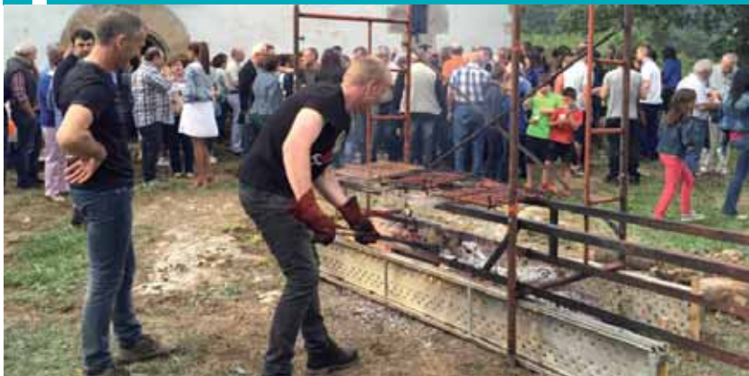
Bazkari ederra prestatzen.