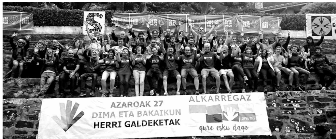
Dimoztarrak eta bakaikuarrek elkarrekin, herri galdeketa aldeko deia egingez.

Galdeketa data partekatzeaz aparte, dimoztarrek eta bakaikuarrek ere harremana badute. Horren adierazle Bizkaitik jasotako gonbidapena. Hala, 26 bakaikuar Dimako festetara joan ziren ostiral arratsaldean, alkatea tar-