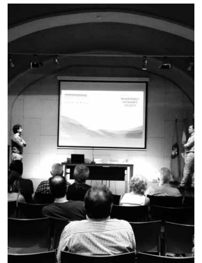
Banda zabalez Irunberrin aritu ziren.

Helburua lortzeko beharrezkoa da Nafarroako Gobernuaren, tokiko erakundearen, Cederna Garalurren eta telekomunikazio operadoreen arteko elkarlana. Nafarroako Mendialdean zulo digitala ekiditea da asmoa, populazioaren %92a 1.000 biztanle baino gutxiagoko herrietan bizi baita.