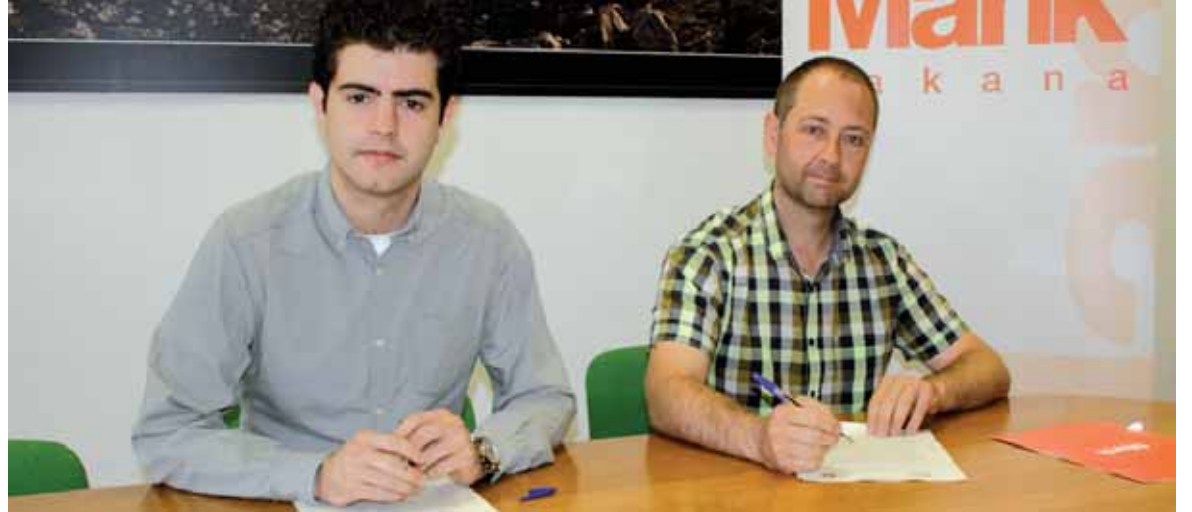
Altsasuko Udala eta Sakanako Mankomunitatearen ordezkariak akordioa sinatzen.

Bi erakundeen arteko gaikako bilketaren inguruko akordioan jasotzen denez, "egun herriak duen gaikako bilketaren datua ikusita", 2017ko abenduaren 31an hondakinen %65 gaika biltzeko helburua finkatu da. Era berean, hiri hondakinen bilketaren eta trataeraren entitate arduradun gisa, Mank-ek informazio kanpaina hasiko du hurrengo sei hilabeteetan. Hiru