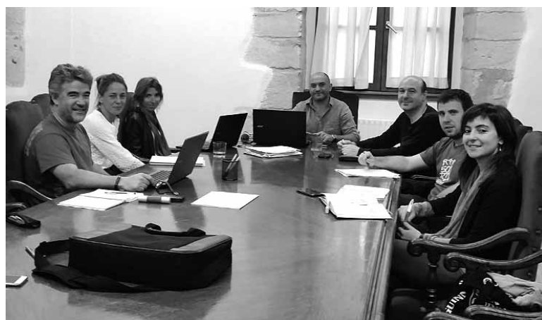
Udalbiltzakoek Gasteizko Udalarekin egin beharreko hitzarmena landu zuten.

Bilkura berean 2015eko Udalbiltza Partzuergoko eta Euskal Garapen eta Kohesio Fondoko kontuen kitapena onartu zen. Elkartutako erakunde osoko garapena eta beren arteko elkarlan instituzionala bultzatzea, ezarritako mugak gaindituz elkarrekin bate-