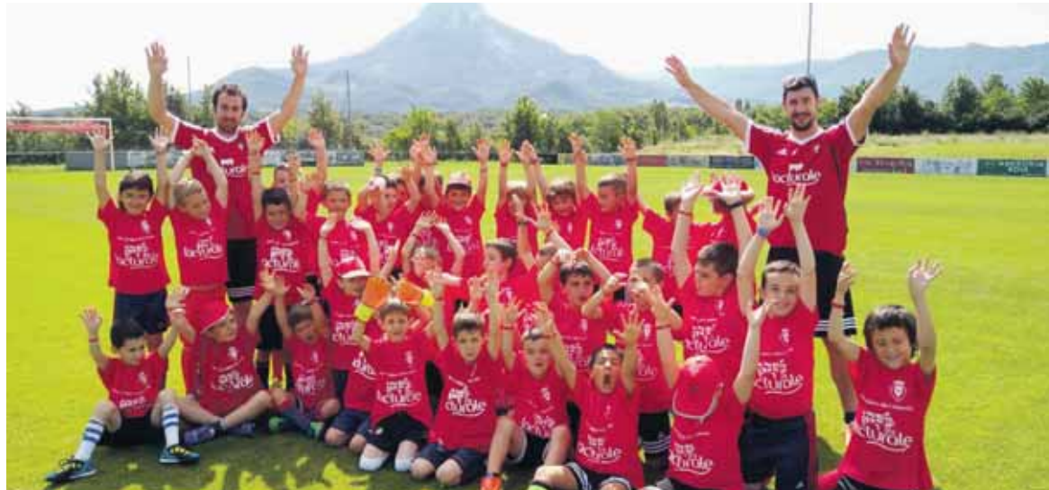
Etxarri Aranatzek antolatu zuen Osasuna fundazioak futbol campusa eta bikain pasa zuten 34 neska-mutikoek.