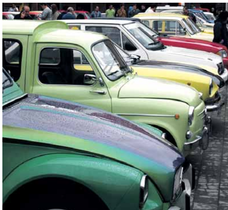
Mota guztietako auto klasikoak egon ziren ikusgai, motor zaleen gozamenerako.

30 urtetik gorako auto eta ibilgailuak hartzen dira klasikotzat. Altsasun bildutako asko 60 eta 80 hamarkaden artekoak ziren, Seat etxeako ugari: 600, 850, 1.430, 1:500... Renault etxeako R-8, R-5 eta Alpine autoak ikusi ahal izan ziren ere. Alpinean izan zen bildutako begiradak gehien erakarri zituen. Citroënen 2 zaldi auto mitikoa ere ikusteko aukera izan zen, etxe bereko beste hainbat auto bezala.