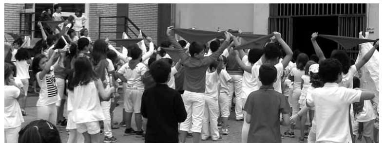
Herenegun sanferminak ospatu zituzten, txupinazo eta guzti.

Aisiaz blai programa astegunetako goizetan izaten da, 10:00etatik 13:00etara. Txikienak, 4 urtekoak, Txantxari ludotekan elkartzen dira. Gainontzekoek, berriz, Zelandi eskola dute topagune garilan. Agorrilean elkargunea ludoteka bihurtzen da berriro ere. Talde bakoitzak dinamika propioa baldin badu ere, aurtan Altsasuko euskalkiko hiztegia lantzen hasiko dira, ezagutzatik erabilerara pausoa emateko helburuz. Irteerak ere badituzte: Leitzako Peru Harri parkera, Donostiako hondartzara... Sanferminetako txupinazoa, kulturarteko festa, pintxo lehiaketa,