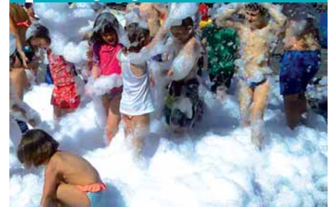
Haurrak aparraren festaz gozaten.