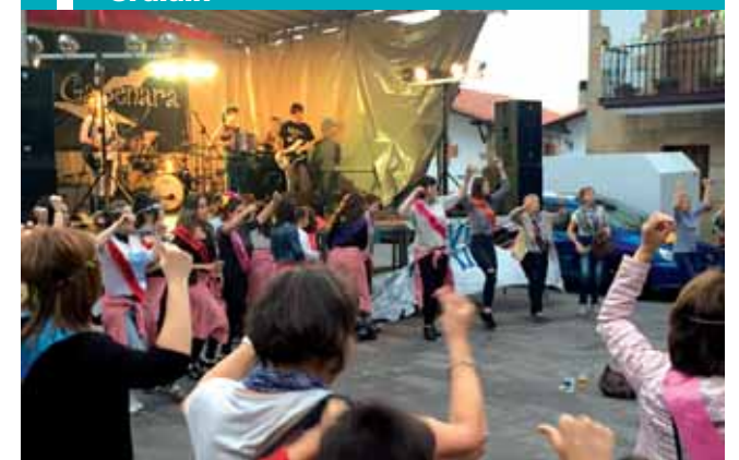
Musika eta dantzarako ordua.