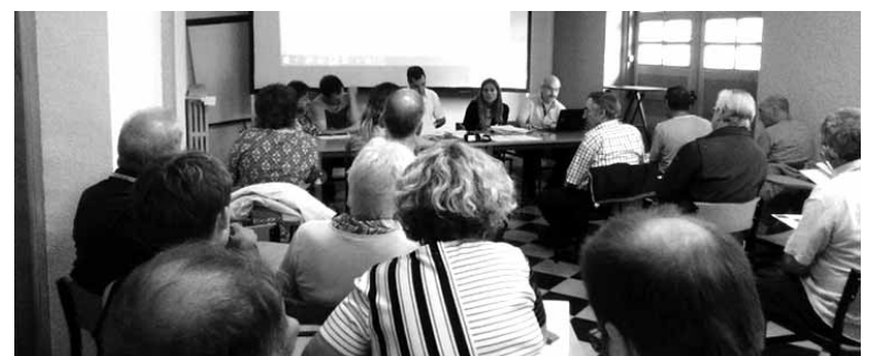
Heldu den ikasturteko plangintza onartu zen batzarrean.