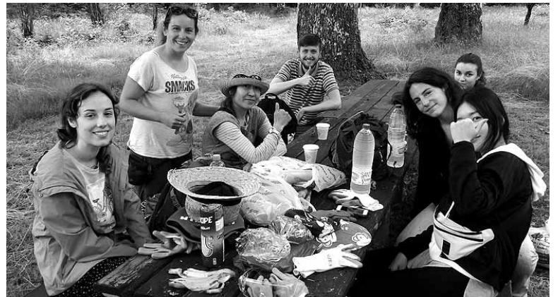
Atzerritik auzolandegira etorritakoak atseden hartzen. NEREA MAZKIARAN

Joan den urteko garilean ere GKE beraren bidez beste 15 gazte atzerriar lanean aritu ziren Sakanan. Bernoako galtzada azalaraztea izan zen haien egitekoa. Aurtan ere beste 10 edo 15 gazte atzerriar etorriko dira Bernoako galtzadan lan egitera. Etxarri Aranatzan, Bakaikun, Iturmendin eta Urdaian ariko dira agorrilaren 12tik 26ra. Egun horietan "Sakanako ondare zati bat berreskuratzeko aparte, sakandarrok gure historiaren ezagutzaile eta berres-