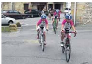
160 txirrindulari lehiatu ziren.

Larunbatean, festetan murgilduta zegoen Urdiainen kategoria txikiko lasterketak hartu zituen. 160 txirrindulari inguru lehiatu ziren, ginkanan eta lasterketetan