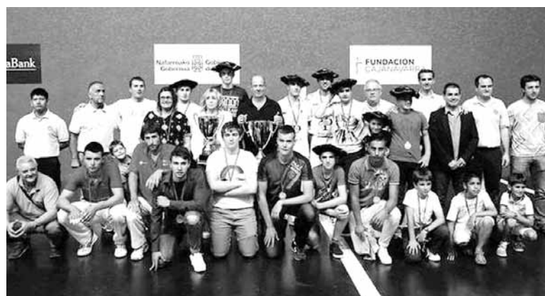
Erreka, Herrien Arteko Txapelketako txapelduna. Bakaikoa eta Gorriti tartean.

Doneztebek txapela lortzearen atzean bi sakanarrekin zeresan handia izan zuten. Izan ere, ber-