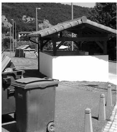
Sutea eta gero etxola berrituta.