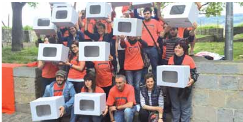
Herri galdeketa egingo direla Iruñian iragarri zuen Gure Eskuk.

Gure Esku Dagok iragarri du Irurtzunen, Lakuntza eta Altsasun heldu den urteko udaberriaren eginen dituztela herri galdeketa