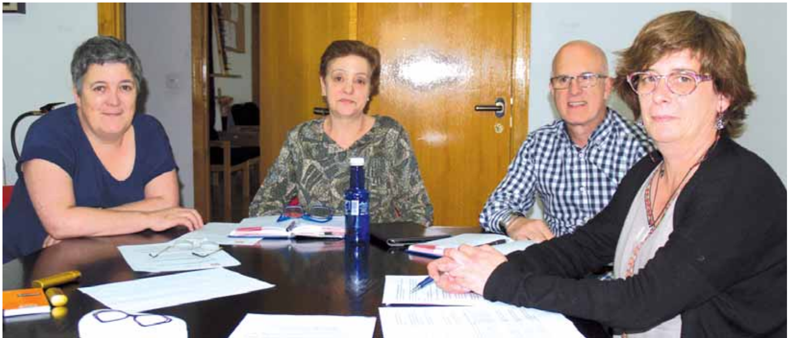
Altsasuko Emakumearen eta Berdintasun Batzordeak emakumezkoen eta gizonezkoen berdintasun plana parte-hartzearen bidez osatu nahi du.

1936koa gogoratzeko Arbizon ikuskizuna >> 15