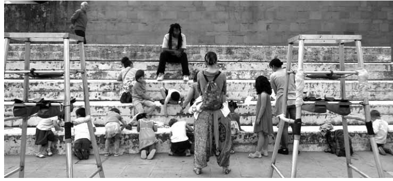
Irurtzongo konpartsa kideek erraldoiak biluztu zituzten.

Erraldoi eta buruhandi konpartsarik gabeko Irurtzongo festak ez dira irurtzundarren buruan sartzen. Baina hala izateko, konpartsa festetan izateko, jende askoren lana behar da eta konpartsa kideak laguntza beharrean daude. Interesa dutenek haiekin zuzenean harremanetan jar daitezke. Baina haien zeregina zein den erakutsi zuten ere. Igande eguerdian izan zen, Foru plazan.