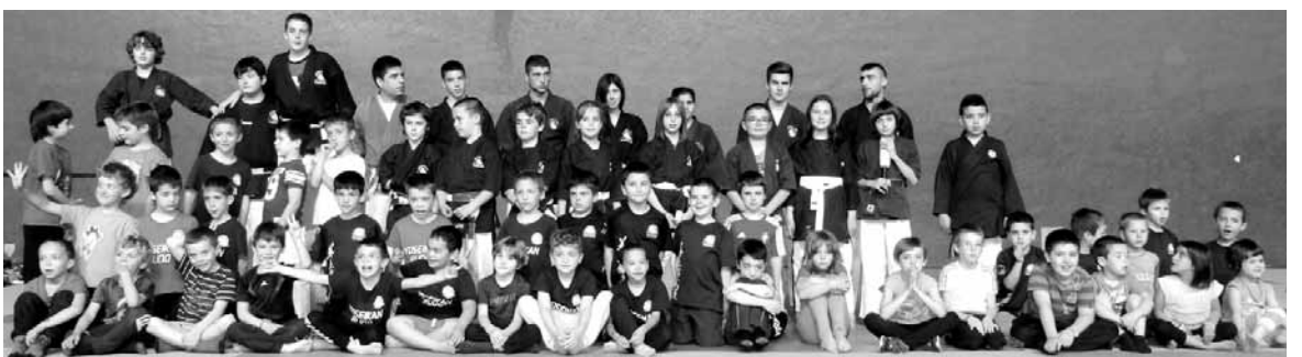
Amets-Txui xoo yoseikan budo taldeko kirolariek talde argazkia atera zuten. NEREA MAZKIARAN

Bihar, azkeneko egunean jarriko naiz. Orain debuta iristeko irrikitan nago, gogo handirekin.