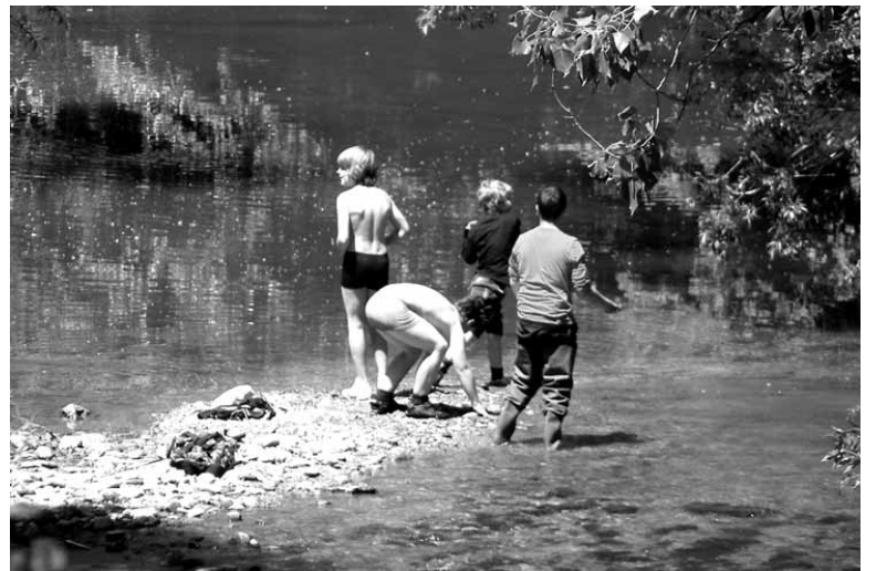
Haurrak ibaian jolasean.

edo tutorearen nortasun agiriaren kopia; udalekura joan denaren erroldatze agiria; udalekuaren ezaugarriak biltzen dituen antolatzaileen agiria; antolatzaileen asistentzia agiria eta ordain agiria. Guztia Mank-ek Lakuntzan duen egoitzan aurkeztu behar da. Baldintzak betetzen dituzten artean Mank-ek laguntzetan 5.000 euro banatuko ditu.