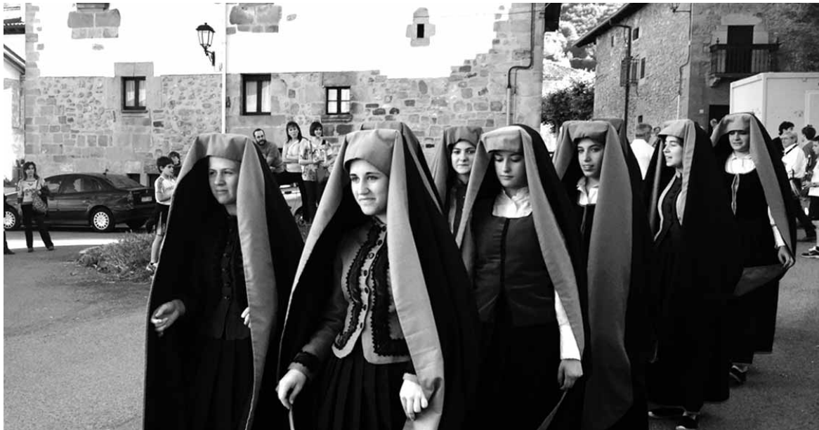
Urdiaingo neskek, San Joan basilizara bidean. Baselizan San Joan kantaita abesten dute, uzta ona eskatzeko.

Aurretik Arbizuk bi buruhandi zituen: soldadu frantsesa eta sua. Biek karga handia zuten eta, horregatik, berriak egitea erabaki dute. Hala ere, karga handiko bi buruhandi horiek ere ez dute aurtengo festak galduko. Batuta birziklatze laborategiko kideen laguntzaz buruhandi zirenak erraldoi bihurtu dira. Erraldoi bereziak, karga handia dutenez, gurpil