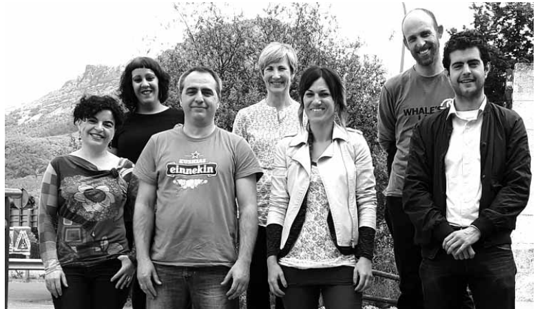
Bideoaren aurkezpena Sakanako dendariek eta udal ordezkariak egin zuten.

Nafarroako Gobernuak, udalek eta Sakanako Garapen Agentziak