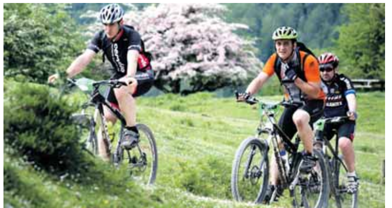
Paraje zoragarrietatik pasatzen zen ibilbidea. ANA VILCHES

Probari dagokionez, Claverrek aipatu zigun bikain atera zela eta antolakuntza aldetik horniduraren fin ibili zirela. “Oso zaila da zenbat pertsona aritu behar diren kontrolatzea. Guk 600 pertsonendako kamiseta eta opariak genituen. Eta pentsa, 598 bikerrek eman zuten izena. Guztiak jaso zuten, beraz, oparia eta horretaz gain hainbat sari