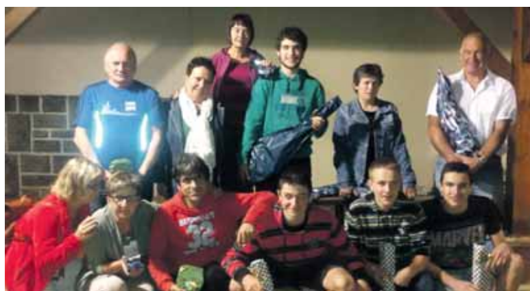
Iratxo Botxa Txapelketa 2016ko finalistak, sariek.