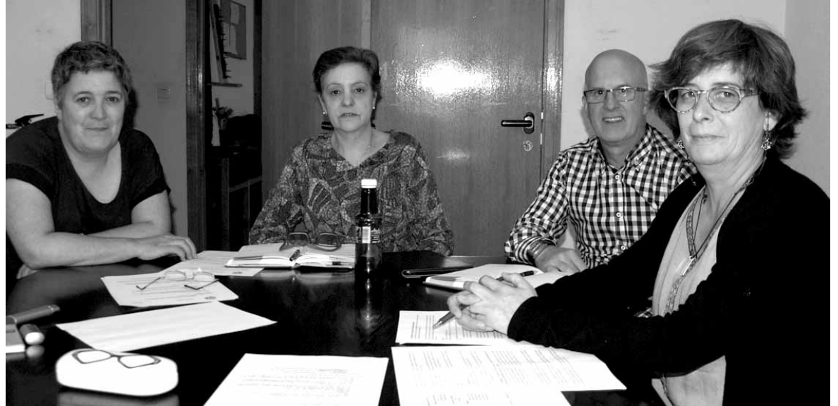
Batzordeko kideak, bilduta. Eragile ezberdinen ekarpenekin osatu nahi dute Udalaren Berdintasun Plana.

Nafarroako berdintasun teknikariek, Nafarroako Gobernuaren Berdintasunerako Institutuak eta Nafarroako Udal eta Kontzejuen Federazioak udaletako berdintasun planak egiteko 2014an adostutako plangintzan oinarrituta dago Altsasun onartutako zirriborroa. Berdintasuna lortzeko bost ildo estrategiko zehaztu dituzte. Lehenik etxera begira jarri dira: emakumezkoen eta gizonezkoen aukera berdintasuna udal administrazioan zehar lerroa izanen da. Bigarrenik, Emakumeenganako indarkeriaren kontrako prebentzioa eta ezabatzea lan egiten da. Horrekin batera, emakumezkoak lan arloan guztiz integratzeko eta garatzeko