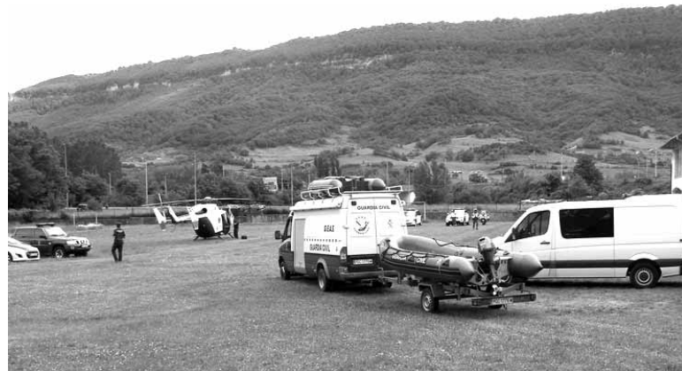
Guardia Civilaren ibilgailuak kaputxinoen komentuko futbol zelaietan.

Antolatutakoaren berri azken unean izan zuen Ospa mugimenduak, "egun batetik bestera antolatu dute". Asteazkenean bertan mugimenduko kideak ikastetxeetako irteera garaian informazio orriak banatu zizkieten gurasoei, "balora zezaten euren seme-alabak halako tokietara eramatea ego-