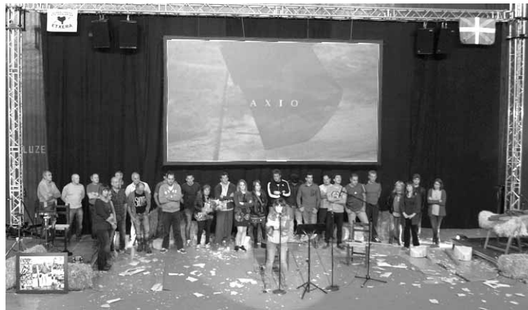
Axioaren dokumentala egiteko makina bat lagunak hartu dute parte.

Axiori buruzko dokumentala bost eurotan dago salgai.