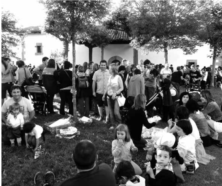
Arbizuarrak, San Joan ermitan. Behean aitsasuarrak, suaren inguruan dantzan.