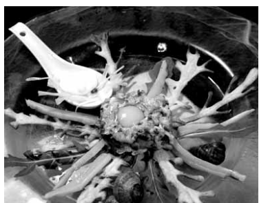
Eguzki-lore itxurako pintxoak.

Joan den asteburuari segida emanen dio Xurrutek, Alde Zaharreko tabernen elkarteak, eta bakoitzean berriro pintxo berezi bat dastatzeko aukera izanen da. Gutizia txikiak 2,2 eurotan eskuratu daitezke. Seiak jaten dituztenek eta txartela osatu hainbat sariren zozketan sartuko dira: sei afari eta 100 euroko sei sari. Honakoak dira dasta daitezkeen