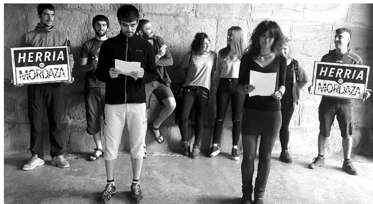
Isunei erantzun kolektiboa emateko deia zabaldu zuten.

Estatuak “errepresio estrategia mantendu eta findu” duela adierazi zuten eta Mozal legea hor kokatu zuten. “Errepresioa isunen bidez ematen da. Ez da ageriko errepresioa, baina errepresioaren helburuak lortzen ditu, status quoa zalantzan jartzen duen edozein mugimendu jazartzea”. Legeak ezartzen dituen isun horiek “adierazpen askatasuna eta iraultzeko eskubidea dirudunen esku-