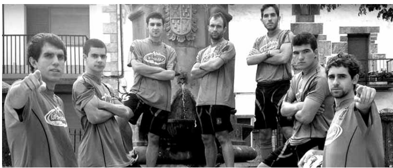
Aralar Mendik sekulako denboraldia egin du.