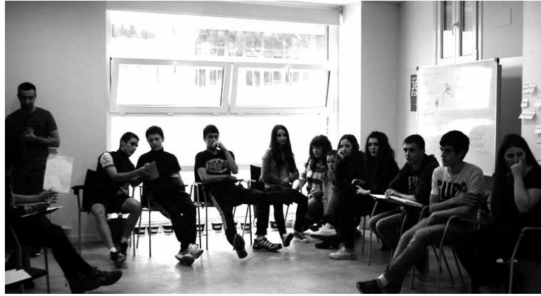
Makina bat gazte elkartzaren Altsasuko euskalkian trebatzeko.