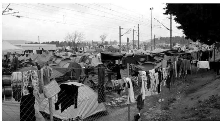
“Pertsona horiei Europako Batasunak ez die inolako aterperik eman”.