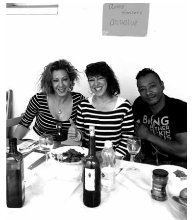
Andaluziako arroza prestatu zuten.

Gastronomia festarekin batera haurrek munduko jolasekin gozatzeko aukera izan zuten. Bestalde, Sakanako Mankomunitateko Immigrazio Zerbitzuak aniztasuna, berdintasuna, errespetua eta diskriminaziorik eza balioak sustatzeko udako kanpaina larunbatean Irurtzunen abiarazi zuen.