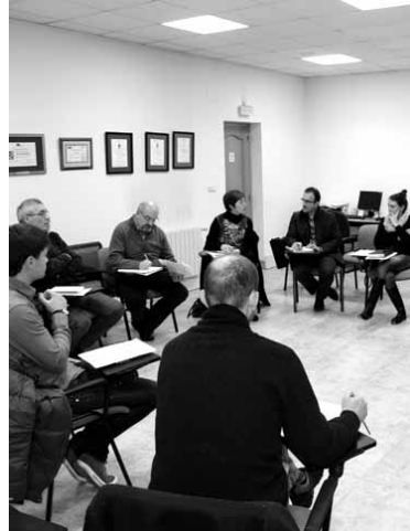
Eragileak plan estrategikoaz ariko dira.

korretara moldatzeko ahalmena ezinbestekoa dute".