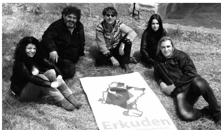
Europar bisonteen berreskurapena sustatu nahi duen elkarteak kideak.

Laukorik ez zela inbertitu beharko ere gaztigatu du Alvarezek. Izan ere, europar bisontea berreskuratzeko gastu guztia diruz lagunduta dago: "Europako Bata-sunaren Life programaren bidez %75 ordaintzen du eta gainontzekoa Poloniako Gobernuak, bisontek guztiak handik heldu baitira." Animalia bakoitzak 10.000 euro balio ditu. Itxitura eta garraioa da egin beharko litzatekeen gastua. Estatuan europar bisontea hazte-