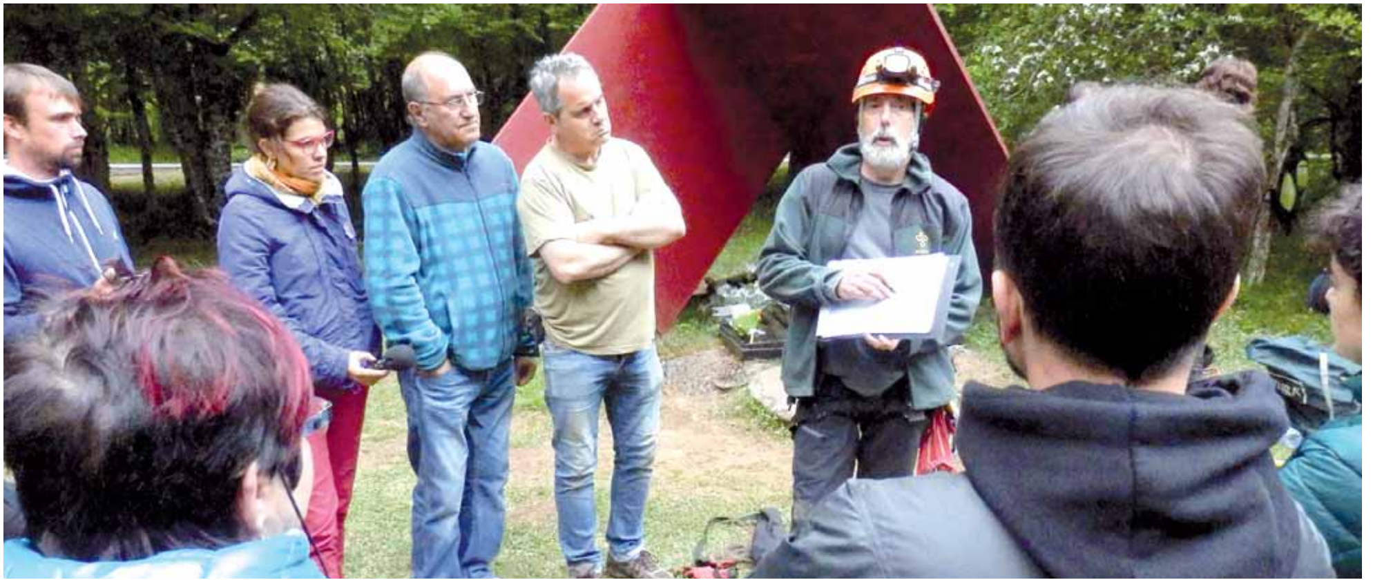
Otsoportilloko lezean dauden hezurdurak norenak diren identifikatzeko aukera izanen dela jakinarazi du Etxeberria forentseak. Iberoko hobian uhartear bat identifikatu dute. NEREA MAZKIARAN