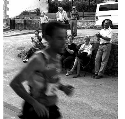
Bakaikuarrak korrikalaria txalotzen.

Legegintzaldia hasi zenetik urte bat pasa denean, Bakaikuko Udalak batzarrera deitu du. Bilkura horretan udalak dituen asmoen berri emanen du, esaterako: diru kontuen, aurtengo aurrekontuen, Iriondo kaleko proiektuaren, auzolanaren eta bestelakoak. Bakaikuko Udaletik bakaikuarrei batzarrera joateko gonbidapena egin diete, "informatzeko eta zalantzak, iradokizunak, kezak... ekarri parte hartzeko".