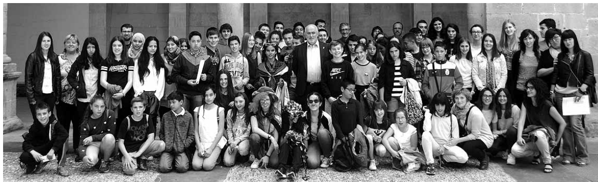
Gazteak ingurumena zaindu eta hobetzeko ikastetxeetan garatu dituzten esperientziak azaldu zizkieten elkarri.

Altsasu institutuko eta Sagrado Corazon ikastetxeetako ikasleak Nafarroako Confint topaketan parte hartu zuten ostiralean