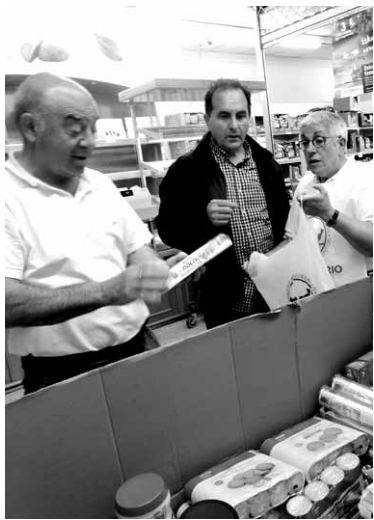
Boluntarioak lanean Altsasun.