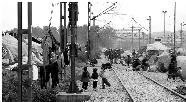
Idomenin bizitakoa “ezin ahaztu, ezta nahi ere”.