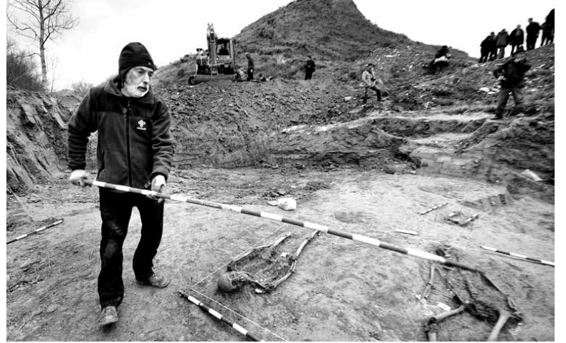
Abenduan indusketa egin zuten Iberoko Zurbau dermioan Aranzadikoek.