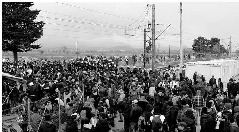
Aurretik ezagututako istorio okerra baino okerragoa ezagutzen joan ziren.