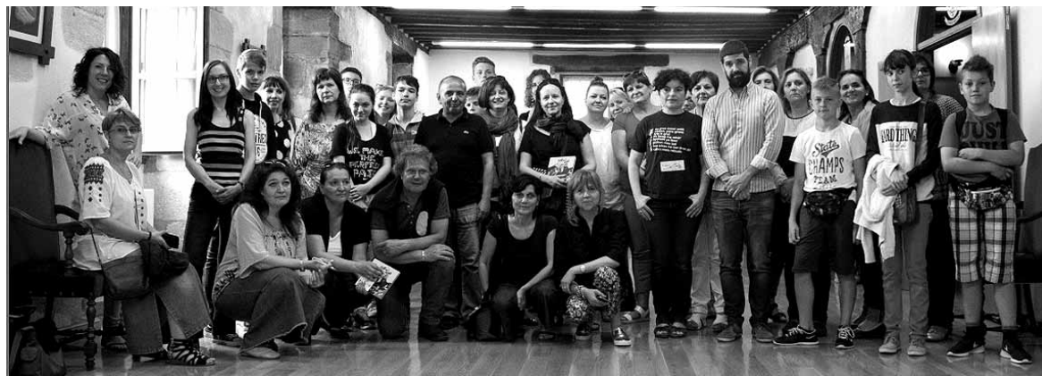
Europatik etorritako ikasleei Etxarri Aranazko udaletxean eta Parlamentuan harrera egin zieten.

Astelehenetik gaur arte Europako zortzi herrialdeetako beste horren beste ikastetxeetako ikasleak Andra Mari ikastolako DBHko 3. mailako ikasleekin egon dira, haien etxeetan lotan. Guztiak ere Europako Batasunak hezkuntza arloan ematen duen Erasmus + bekarekin proiektua garatzen ari dira: in the paradise garden of Europe. Europan ezezagunak diren baina xarma berezia duten natura-espazioen mapa bat osatzea da proiektuaren xedea. Bi urteko proiektua izan da eta bitarte horretan ikastetxeek euren natur eremuak, artea eta sormena partekatu dituzte. Joan den urteko maia-