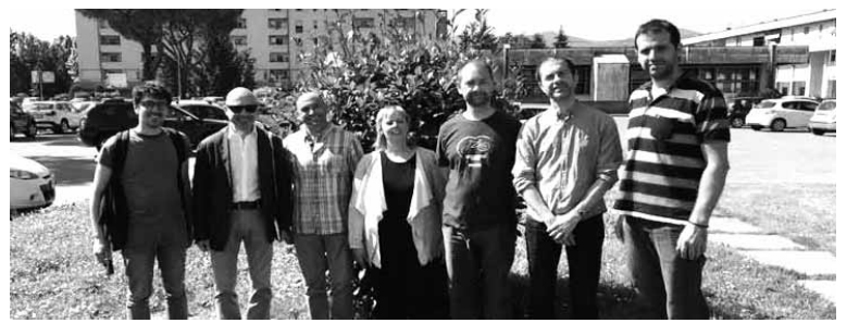
Hernani, Iruñerria eta Sakanako ordezkariak izan ziren Italian. ZERO ZABOR

Mank-eko presidentea Italian egin zen Zero Zabor Herrien bilkuran egon zen