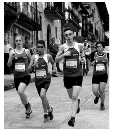
Haurren mailako proba.

lehiatu zen. Nazioetako Krosean egungo Munduko Kros Txapelketa-3 aldiz internazionala izan zen, 1955etik 1957ra, Donostian, Belfasten eta Waregemen jokatuak Nazioetako Krosean. Donostiakoan 44.a saillatu zen eta taldekako brontzezko domina jaso zuen (ikus Guaixeko 11 galderak).