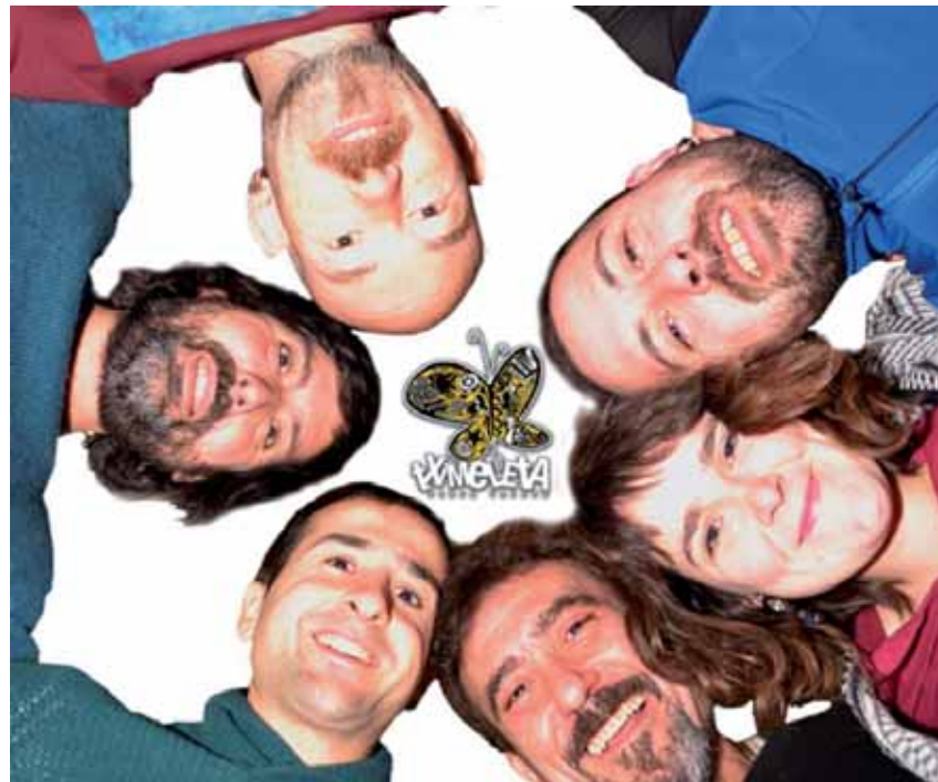
Tximeletak bihar Etxarri Sakanako lagun musikariak gonbidatuko ditu.

Maiatzaren 29an, igandean, 9:30etik aurrera Irurtzungo plazan. Ibilaldia, jolasak eta beste.