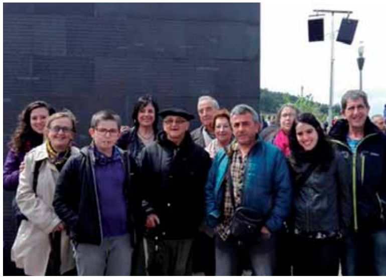
Arbizuarrak Sartagudako Memoria Parkean. @ARBIZUNKULTURAZ

despeditu ondoren, elizaren atzeko oroigarrian ekitaldia egingen da. Plaka bat mustuko dute. Errepresaliatuen omenezko aurrekua eta lore eskaintza izanen dira. Musiak, irakurraldiek eta auzatea osatuko dute omenaldia.