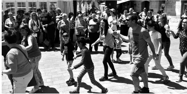
Parte-hartzea islatzeko aurkezpenean dantza egin zuten.

Horregatik, Gure Esku Dagotik ezinbesteko jo dute "norbanakoen gogoia eta konpromisoa.