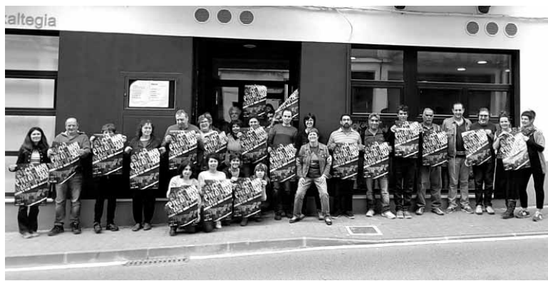
AEKren Itsasi euskaltegiko ikasleak euskarari bidea emateko eskatuz.

Bide eman euskarari, euskaraz bizi nahi dugu manifestazioa eginen da Iruñean garagarriaren 4an, 17:30ean, Golemetik abiatuta. Euskararen Gizarte Eragileen Kontseiluak deitu du manifestazioa eta euskarari bide emateko "neurri ausartak hartzeko" eskatuko da. Hainbat eragilek dagoeneko bat egin dute deialdiarekin. Nafarrak ere ari dira