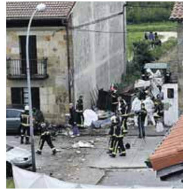
Suhiltzaileak lanean.

Pasa den osteguneko 18:07 ez dute nahi ahaztuko Arbizun: hegazkin arin bat Arbizuko Kale Nagusian erori zen. Lekukoek azaldu zuten, putre batekin talka egin ondoren erori egin zen. Altuera galtzean etxe baten teilatua ukitu zuen eta gero, etxartean erori zen hegazkin arina,