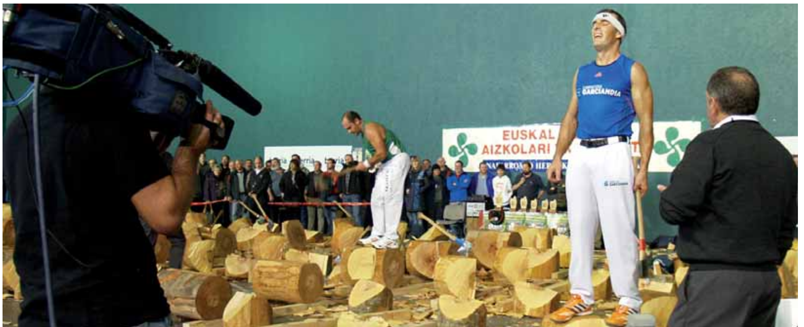
Aizkolari handia omenduko dute etxarrin igandean.

Ziordian herri lasterketa izanen da bihar >> 11