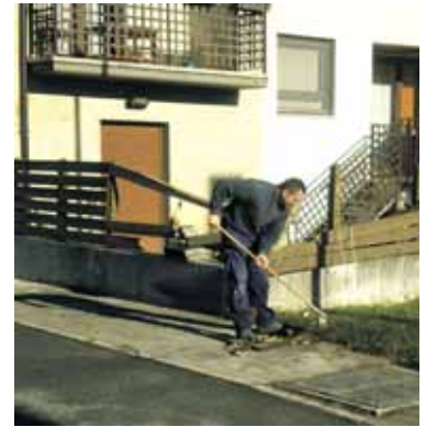
Etxe batean hondatutako hesia.