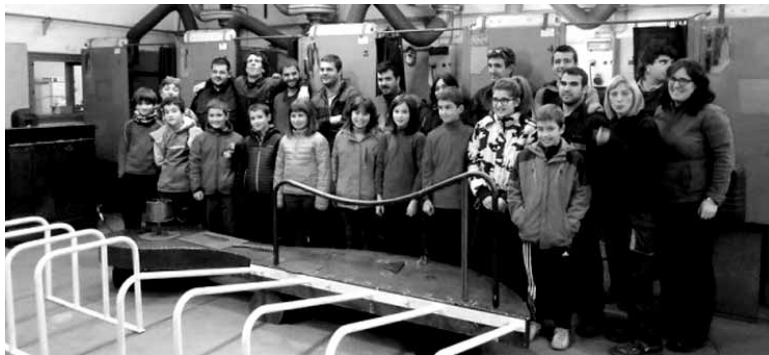
Eskolako ikasleak Lanbide Heziketa institutuan, lanak gainbegiratzeko. UTZITAKOIA

Sakana LH ikastetxeak eskualdearen beharretara egokitzeko, ikasleek duten profesionaltasunaren mailaren berri jaso dute. Ikastetxean garbi dute "gaur egun trebetasun eta ezagutza teknikoek aparte, ekimena izatea, talde lana eta adierazteko gaitasuna kontuan hartzen diren gaitasunak" direla. Horregatik, ikastetxeko irakasle batzuk 2012-2013 ikasturtean Egi-