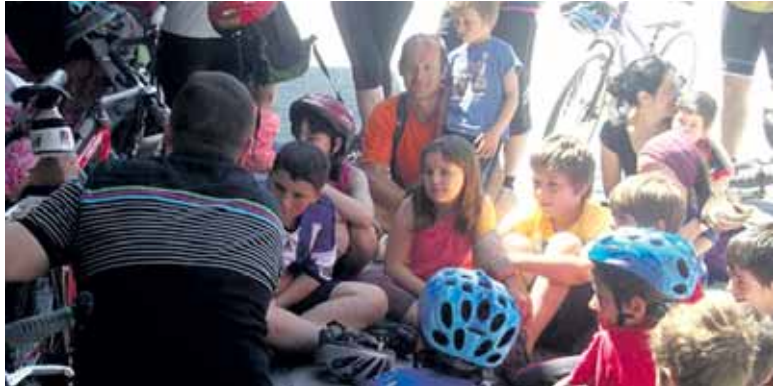
Neska-mutikoak adi adi, bizikleta konpontzeko aurreko urteko tailerreen.

Mankomunitateak antolatuta, bizikleta ibilbidea, herri jolasak, bizikleta konpontzeko tailerra eta material trukea izanen dira 9:30etik aurrera Irurtzongo Foru Plazan