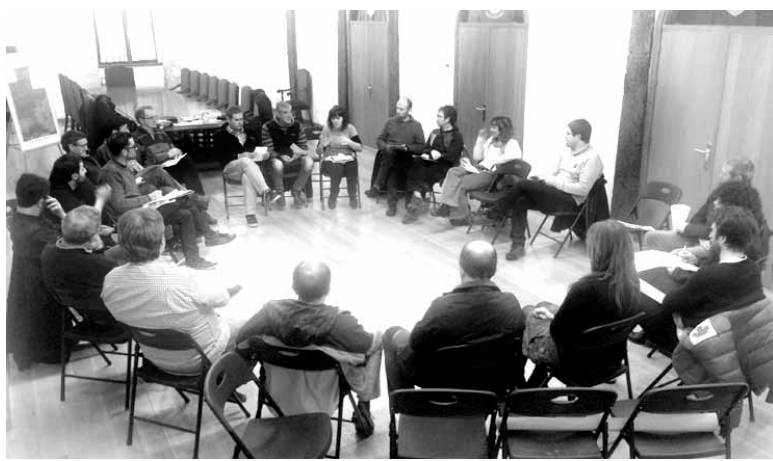
Etxarriko Mendien Batzordearen bilera.

Hurrengo hiru asteazkenetan bi ordenantzak osatzeko bilerak deitu dira. Parte hartzeko udaletxeko bulegoan izena eman behar da, asteartea baino lehen