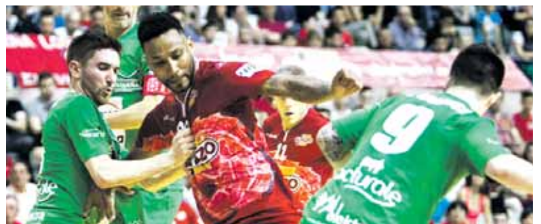
Lehia oso estua izan zuten Magnak eta El Pozok, baina berdeak gailendu ziren.