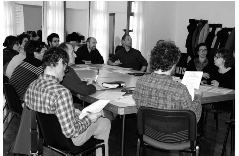
Sakandarrak berriro hondakin planaz iritzia ematera gonbidatuak izan gara.

tu ondoren Nafarroako Hondakinak Kudeatzeko 2016-2025 Plan Integratuaren lehen bertsioa idatziko da, garagarriaren 30erako.