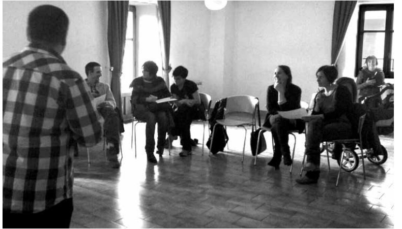
Eusliek izanen diren gurasoen bilera. UTZITAKOIA