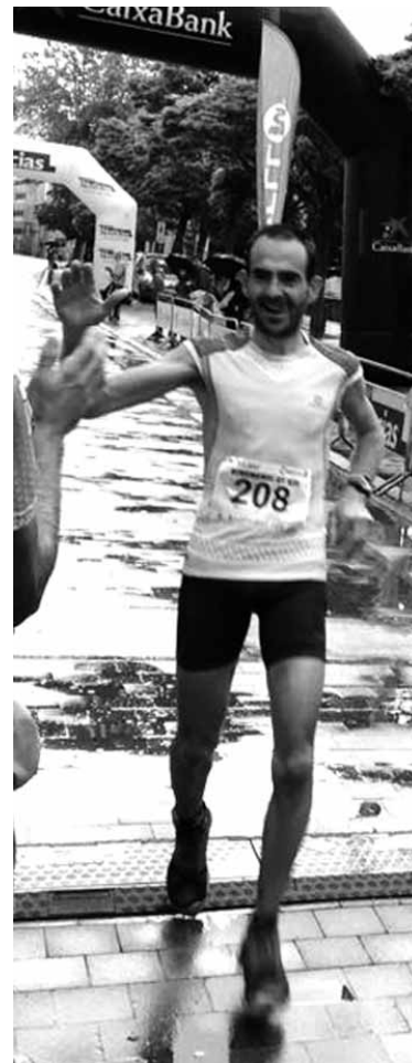
Beraza, helmugara iristen.