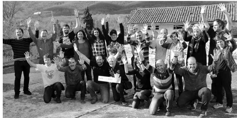
Herri galdeketa antolatu duten herrietako ordezkariak Etxarri. GURE ESKU DAGO

Gure Esku Dagok Etxarri bildu zituen esan zuten: "erabakitze eskubidearen trena Euskal Herrira iritsi da. Indarrak batu behar ditugu gure etorkizuna erabakitze. Horregatik, gai-