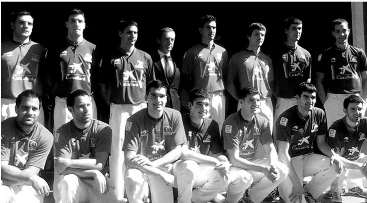
Aurkezpena egin zuteneko talde argazkia.