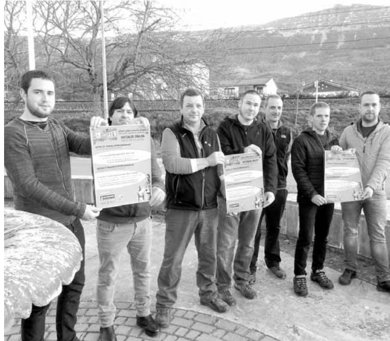
Uharte Arakil, 80 urte memoria gaitzen taldekoak egitarauarekin. N. MAZKIARAN

Taldea aurkezteko hitzaldi sorta prestatu dute eta lastailaren 29rako Memoriaren Eguna antolatuko dutela jakinarazi du: "Egun