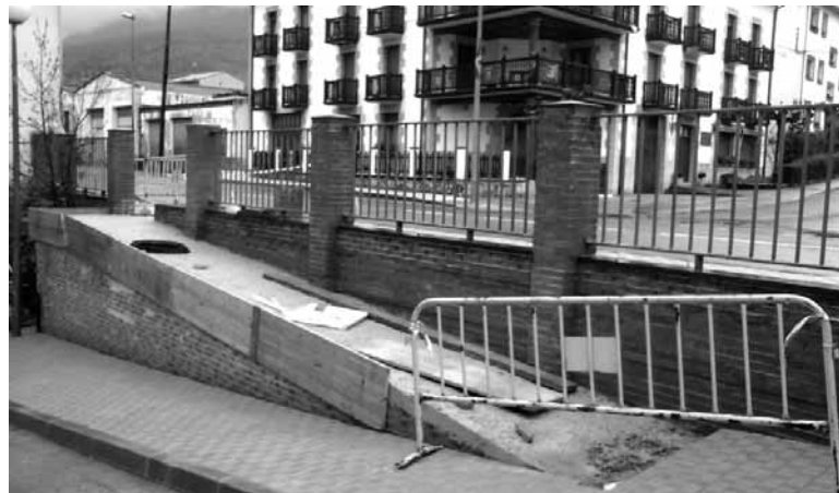
Udazkenean egindako arranja.

Langabezian dauden sei pertsona kontratatuko ditu Olatzagutiako Udalak: obra eta zerbitzuetako brigada indartzeko hiru peoi, herriko kaleetan hainbat lan egiteko igeltsero eta eraikuntza alorreko ofizial eta peoi bana eta bukatzeko, basolanetan aritzeko peoi bat. Kontratazio horiek Nafarroako Gobernuaren diru-laguntzarekin finantzatu dira. Horietaz aparte, Udan Euskaraz kanpainarako eta igerilekuak kudeatzeko kontratazioak