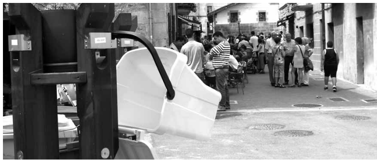
Zintzilikarioa eta pertza Olatzagutian.

Parte hartze prozesuarekin departamentuak honako helburuak lortu nahi ditu. Batetik, plana aurkeztea, kontsulta prozesua errazteko eta planaren informazio aipagarria zabaltzeko, horrekin egungo egoeraren diagnosiaren berri emanez. Bestetik, plan berriaren helburuak eta neurria zehaztu nahi ditu, hondakinak bildu eta tratatzeko alternatiben artean auke-