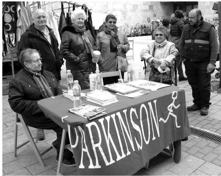
Anaspar elkarteko kideak azokan informazioa zabaldu zuten.

tean izena emanda ez dagoela ere. Horregatik, terapiak Iruñean egin behar izaten dituzte. Han hobe mugitzeko fisioterapia, hobe hitz egiten laguntzeko logopedia, babes psikologikoa jaso, eskulanak egin, abesbatza, eta beste hainbat jardura dituzte. Mendiluzek azaldu zigunez, "elkartea oso garrantzitsua da jendearendako han elkartzen garenak arazo berak ditugu eta elkar ulertzen dugu. Elkartean ez dugu gaixo-girorik ezta giro tristerik ere. Giro alai eta ludikoa da". Anasparrek aurtan 25 urte bete ditu.