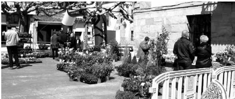
Arbizuko plaza kolorez jantziko da.

Igandean, 10:00etatik 14:00etara, Arbizuko plazan. Eguraldiak lagunduko ez balu kiroldegian eginen litzateke azoka