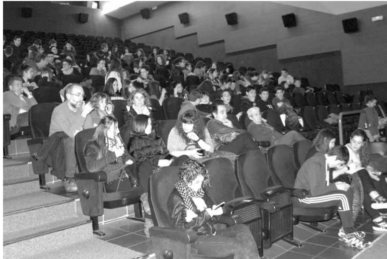
Makina bat altsasuar elkartu ziren euskalkia berreskuratzeko deialdian.