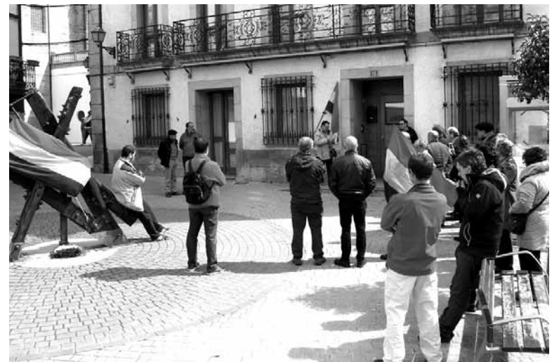
30 bat errepublikazale elkartu ziren atzoko ekitaldian.

Errepublikaren lorpena zerrendatu zituen Carreñok: aberastasunaren banaketa, hezkuntza unibertsala eta publikoa, osasuna, lurren banaketa... "Lanaren eta aberastasunaren banaketa egon den aldi bakoitzean norbait harekin bukatzen saiatu da, eta gehienetan lortu du. Indartsu izan gaitezen eta batuta mantendu, ezinen dute