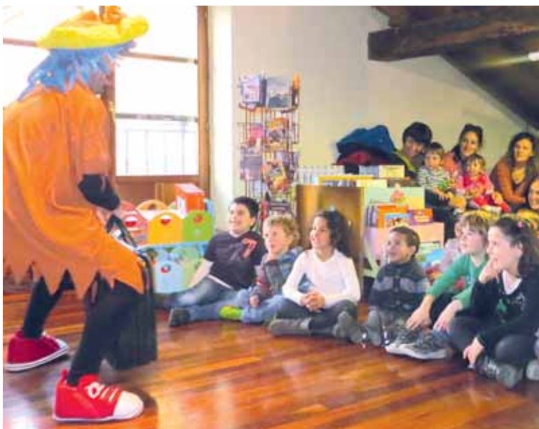
Ipuin kontalaria Ziordian.

nen da. Munduan zehar... entzun nuen izenburuko kontakizuna eskainiko du Jakin ipuin kontalaria, ostegunetan, 17:30ean.