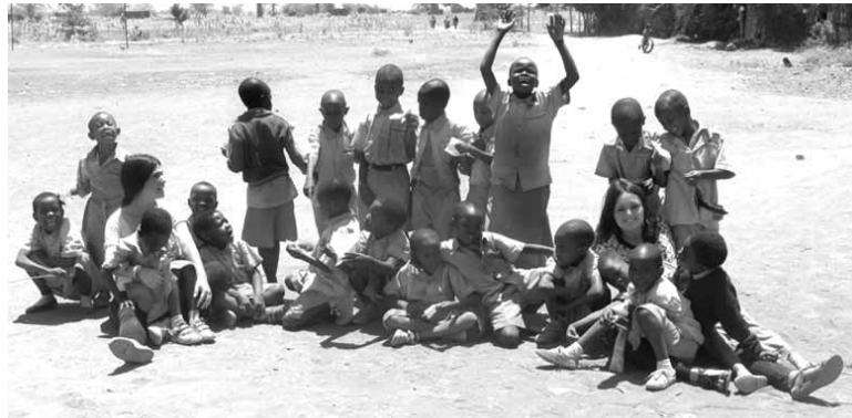
Maddi Urria Albizuk Tanzanian ezagutu zuen eskola lagunduko da igandean.

Helburu horrekin sortu zen azoka eta hala segitzen du. Gainera, lortutako irabaziak elkartasun proiektu bat laguntzera