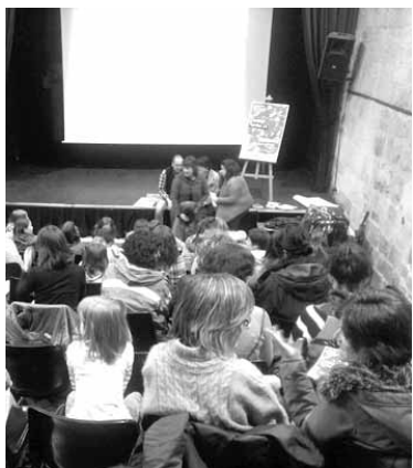
Kultur etxea aurkezpeneko bete.