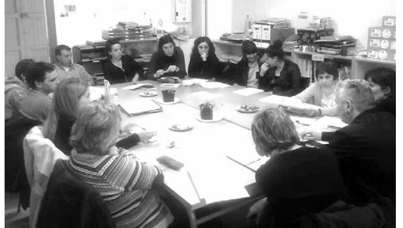
Uharte Arakilen egin zuten aurreneko bilera.

diren hainbat asmo eta ildo jorrazten jarraitzea da. Hasteko, lantaldeko kideak hainbat gairi buruz dagoen materiala biltzen hasiko dira: mitologia, etnologia, natura-ondarea eta arte-ondarea. Egiteko horretan Nafarroako Unibertsitate Publikoko Gradu Akabera-ko lau ikasleren laguntza izanen