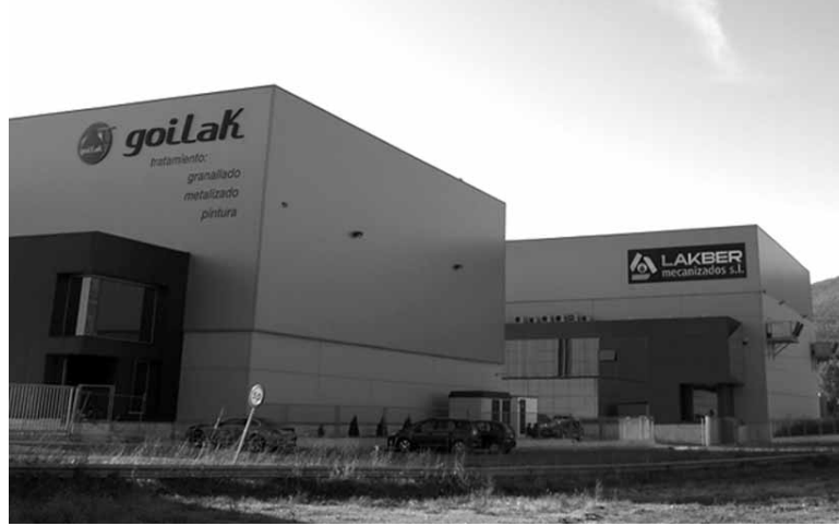
Lakuntzako industrialdeko ikuspegia.

Bestalde, inbentarioa udalen industrialdeen kudeaketa errazte-