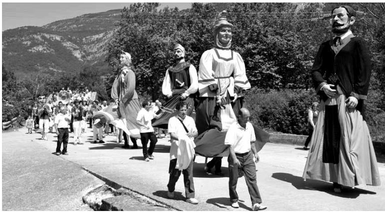
Uharte Arakilgo konpartsa.