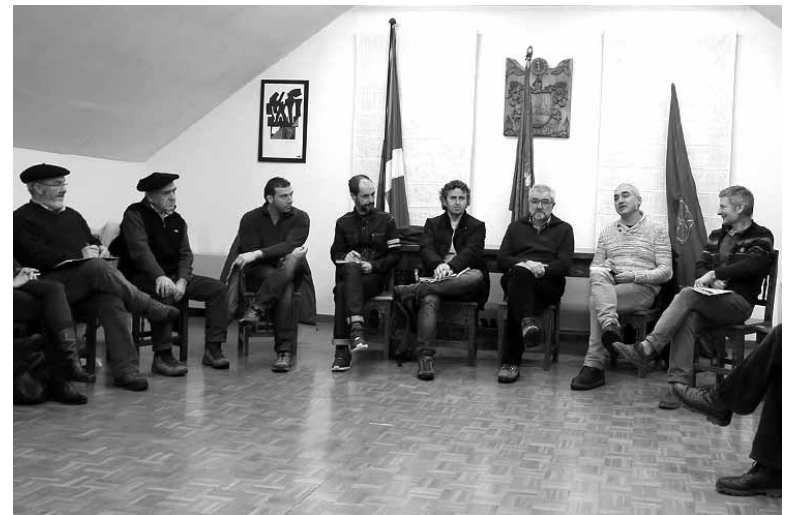
Hizlariak erdian eta entzuleak inguruan eseri ziren.