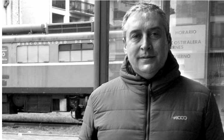
Sakanako kamioilariak Zumarragan lan egiten dute ere. ERKUDEN RUIZ BARROSO

Madrilengertatutakoa errepikatzen da Zumarragan. Madrilko lantokia “ongi” zihuan, Fernandez esanetan. “Lastailean urtea hutsean hasteko itxi zuten, baina ireki behar zuten. Azkenean ez zen horrela izan”. Enplegu erregulazio-ko espedienteak aurkeztu zuten eta maiatza arte manifestazioak, kontzentrazioak, eta abar egin zituzten. “Baina ez zuen ezertarako balio izan”. Langileak estatuko beste lantokietara lekualdatu zituzten. Fernandezek Zumarragako lantokia itxi ondoren langileak lekualdatu-