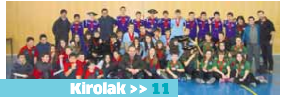
Kirolak >> 11

Andra Mari ikastola Nafarroako Herri Kirol Jolasetako txapeldun handia. Bost finaleratik lautan izan dira irabazleak