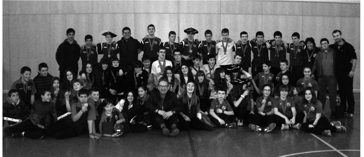
Nafar Kirol Jokoetan aritu diren Andra Mari ikastolako neska-mutikoak eta monitoreak, talde argazkian.

Aurtengo Nafar Kirol Jokoak inoiz baino arrakastatsuekoak izan dira. Txapelketan 9 klubetatik sortutako 30 talde lehiatu dira, tartean Etxarriko Andra Mari eta Altsasuko Iñigo Aritza ikastolatik sortutakoak. Zehazki, Iñigo Aritzatik sortutako Iñigo Aritza, Aizkorri eta Urbasa eta Andra Mari ikastolatik sortutako Andra Mari, Ondatz, Beriain, Andia, Leziza eta Utzubar taldeak.