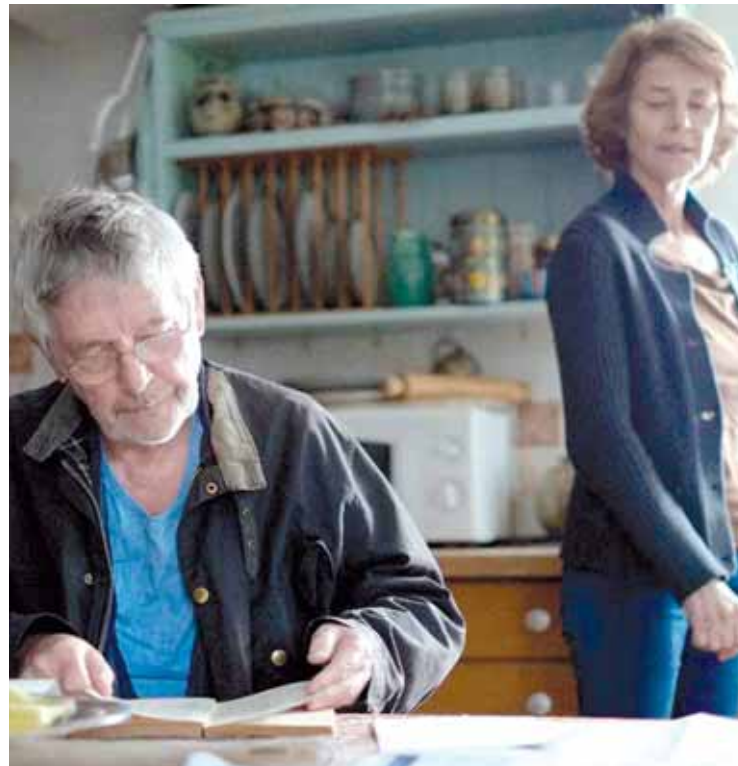
45 años filma Iortian ikusgai izanen da.

Beriainen gora, dispertsioa salatzeko. Apirilaren 3an, igandean, 9:30ean Arbizuko plazatik. Sare.