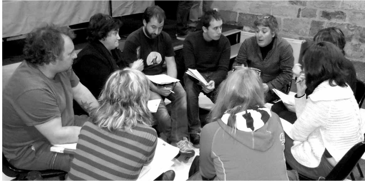
Talde dinamiken bidez hautetsiek euren iritziak azaldu zituzten. FNMC

landu zuten. Bukatzeko, toki erakundeekin finantziarioa izan zuten aztergai. Talde dinamiken ondoren, hautetsi bakoitzak galdetegi bat erantzun zuen.