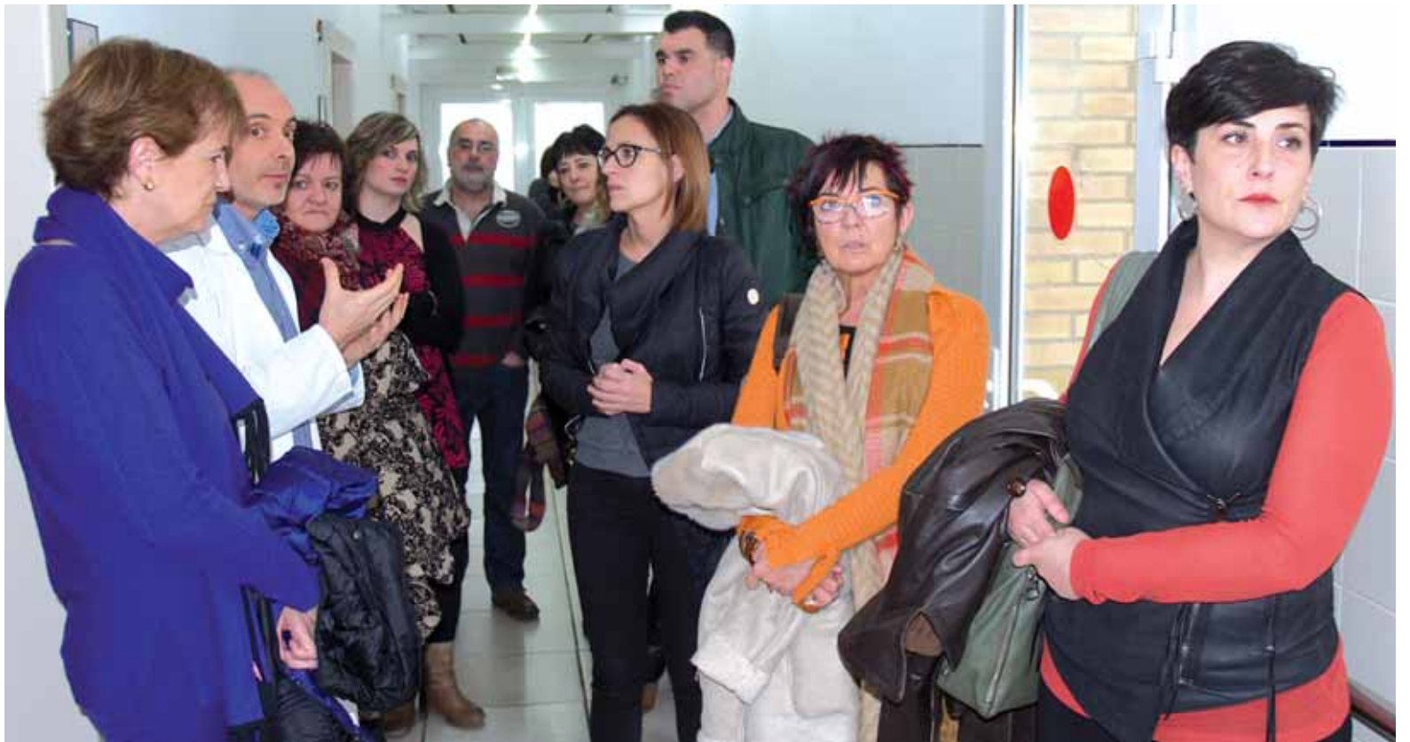
Nafarroako Parlamentuko Osasun Batzordeko kideek gobernuari klinikaren inguruko azterketa egiteko eskatuko diote.

Olaztin M8ko egitarauaren despedida >> 9