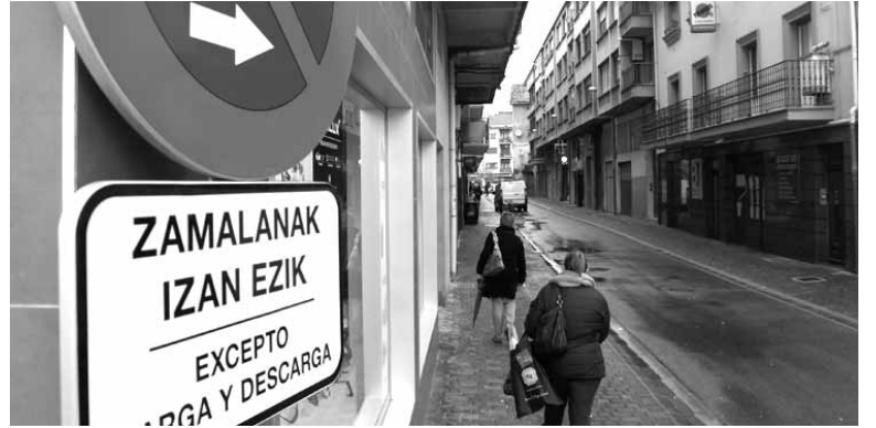
Intxostia zeharkaletik autoak pasa daitezke, baina ezin dute aparkatu.

Arazoa ekiditeko, Altsasuko Udala Udaltzaingoa txosten batean oinarrituta Intxostia zeharkaleko aldeetan aparkatzeko debekua onartu du. Lehen bezala autoak bertatik pasatzeko aukera izanen dute. Zamalanetarako aparkatzeko auke-