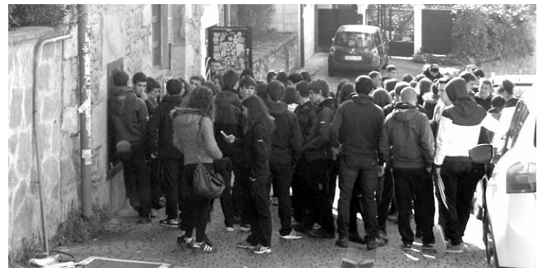
Ikastetxeko kontzentrazioaren ondoren, gaztetxean gosalduta zuten gazteek.

Euskal Herriak hezkuntza sistema propio bat behar duela aldarrikatu zuten kalean ikasleek. Sistema horrek nola beharko lukeen ere azaldu zuten: herritik eta herriaren mesedera dagoena, euskalduna, herritarra, askatzailea eta feminista.