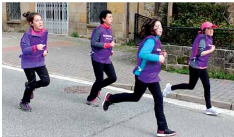
Bukaeran hamaiketako animatua izan zen plazan.

Gehienek korrikan osatu zuten proba (48). Oinezkoak 19 izan ziren, txirrindulariak 12 eta irrastalariak 7. Bi neska txiki silletan joan ziren.