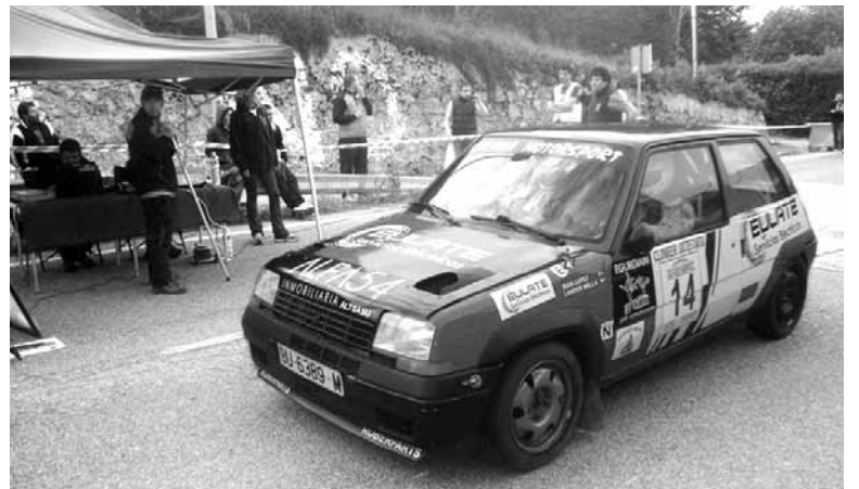
Sakana Motorsportek aurrerago rallya antolatzetik duen aztertuko du.

Sakana Motorsportek gogoratu nahi izan du taldea osatzen duten kideak, Sakanako motorzaleak eta kirolariak direla, eta taldea etekinik asmoko taldea dela.