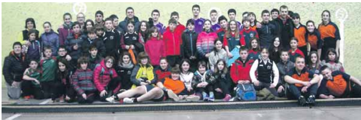
Nafar Kirol Jolasetan parte hartzen ari diren Andra Mari ikastolako neska-mutikoak.

Nafar Kirol Jolasak hiru kategorietan banatuta jokatzen ari dira: kimuak, haurrak eta kadeteak. Proba konbinatueta 30 talde lehiatu dira eta sokatira txapelketan 13 talde. Tartean, talde sakandarrak. Zehazki, Iñigo Aritza ikastolatik sortutako taldeak -Iñigo Aritza, Aizkorri eta Urbasa- eta Andra Mari ikastolatik sortutakoak -Andra Mari, Ondatz, Beriain, Andia, Leziza eta Utzubar-.