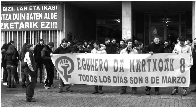
Ikasleak ikastetxe atera eraman zuten aldarrikapena.