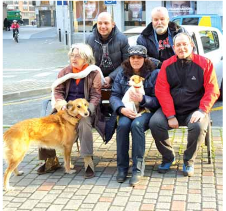
Huellas de Altsasu elkarteko kideak.

Eskoletan kontzientziazio lana egiteaz aparte, maskotendako espazio egokituak sortzea da egin duten beste proposamenetako bat. Euren asmoa belardi batean itxiturak