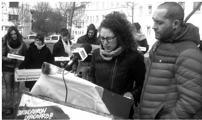
Eskubide zibil eta politikoen defentsan aritzeko deia egin dute.