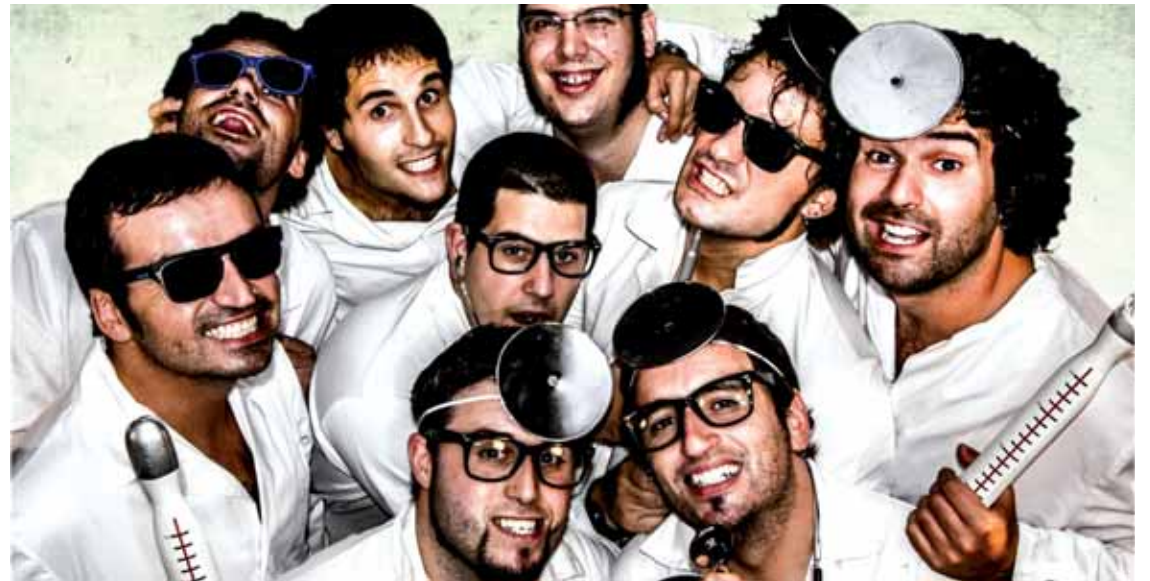
Ze esatek-ekin dantza egiteko aukera izanen da bihar, Altsasuko gaztetxean.

Altsasu-Urritzola Altsasu. Martxoaren 19an, larunbatean, 10:00etan Altsasuko Baratzeko bide plazako lokomotoratik. 74 km.