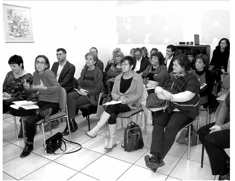
Parlamentariak eta Sakanako ordezkariak azalpeni adi.