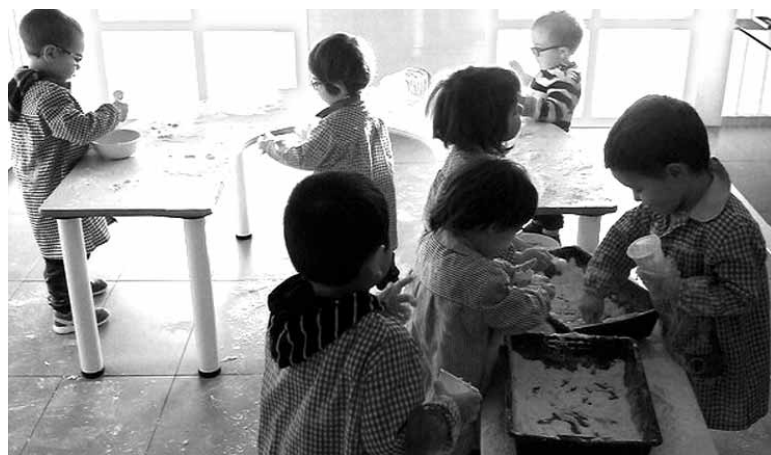
Umeak haur eskolako tailer batean.