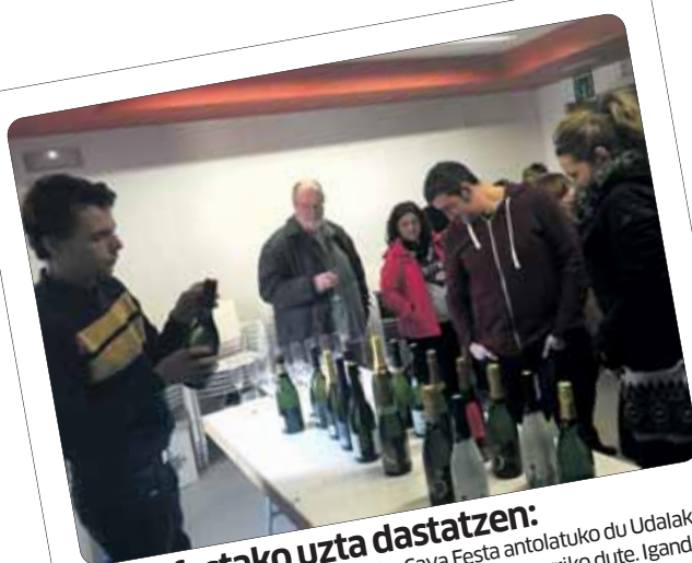
Cava festako uzta dastatzen: Maiatzaren 20tik 22ra Lakuntzako Cava Festa antolatuko du Udalak. San Sadurni d'anoiako 10 ardotegik euren uzta ekarriko dute. Igandean 10 cava horiek dastatzeko aukera egon zen. Cava festaren informazioa hurrengo bideoan: https://www.youtube.com/watch?v=45FYHnkznzQ

Atal honetan ahalik eta iritzi gehienek tokia izan dezaten 1.500 karaktere (espazioekin) baino gehiago duten gutunak EZ DA ONARTUKO. Karaktere kopuru horretatik gorako gutun guztiak LABURTU egingen dira. Gutunean izen-abizenak, telefonoa, helbidea eta Nortasun Agiriaren zenbakia agertu beharko dira. Gutunak asteazkeneko goizeko hamarretarako egon behar dira gurean; bestela, ez da aste horretan publikatuko. Guaixe aldizkariak ez du bere gain hartzen derrigorrez, aldizkarian adierazitako esanen eta iritzien erantzukizunik.