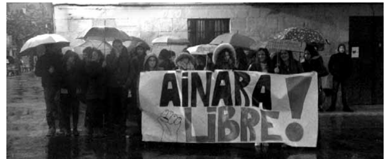
Arbi-zuarrak Ainararen askatasuna aldarrikatu zuten. UTZITAKOIA

12:00etan jarri du hitzordua espetxe inguruan. Donostiako epaitegiak, bestalde, A8 autobidea ixte-gatik protesta egin zuten bost gazteen kontrako epaiketa martxoaren 18rako deitu du. Eleak-Libre egun horretan epaitegiaren protestatzeko deia egin du.