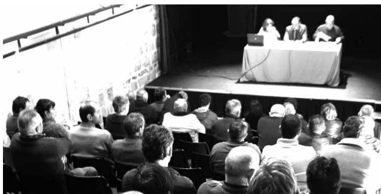
Irurtzunge kultur etxeak aurretik hautetsien bilerak hartu izan ditu.

Sakanako udal eta kontzejuetako hautetsiak Irurtzunge kultur etxean heldu den ostegunean, 17:00etan, egingen den bilerara deituak daude