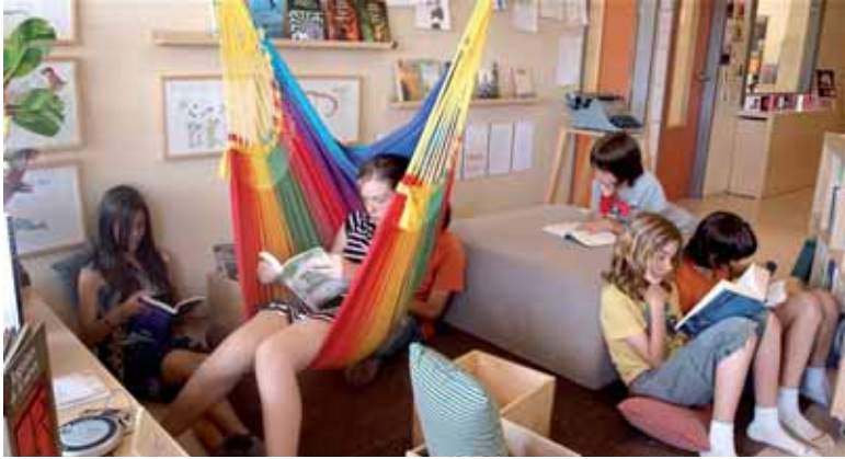
El Martinet eskolari buruzko jardunaldira Euskal Herri guztitik etorri ziren.

ikaslea ikaskuntza prozesuaren erdian jartzen duen proiektua da Dumas, Sakanako Eskola Txikiak landu dutena eta heldu den ikasturteko aurrera Arbizuko eskolan martxan jarri nahi dena