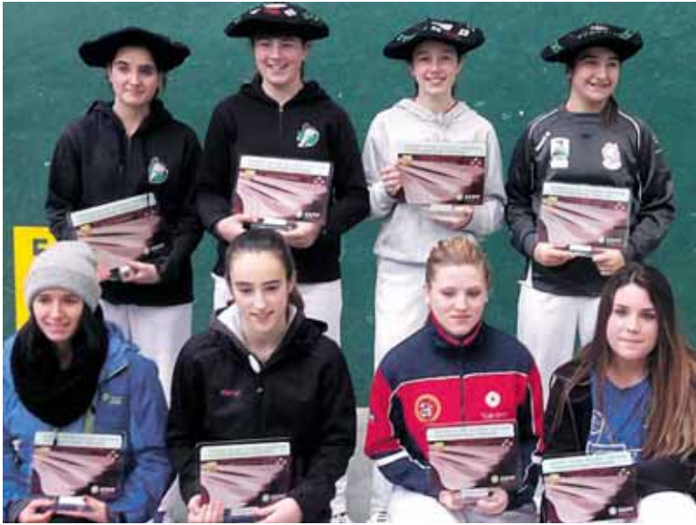
Euskal Herriko Pala Txapelketako finalista.