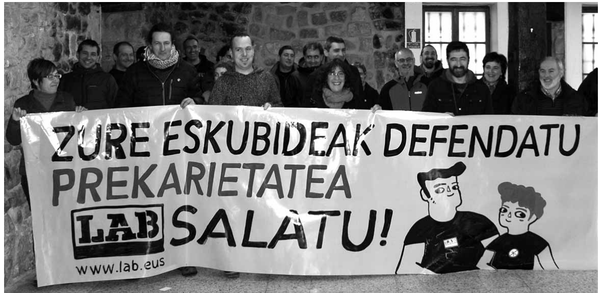
Sakanako LAB sindikatuko ordezkariak prekarietatea salatzen eta eskubideak defendatzeko kanpaina aurkezten