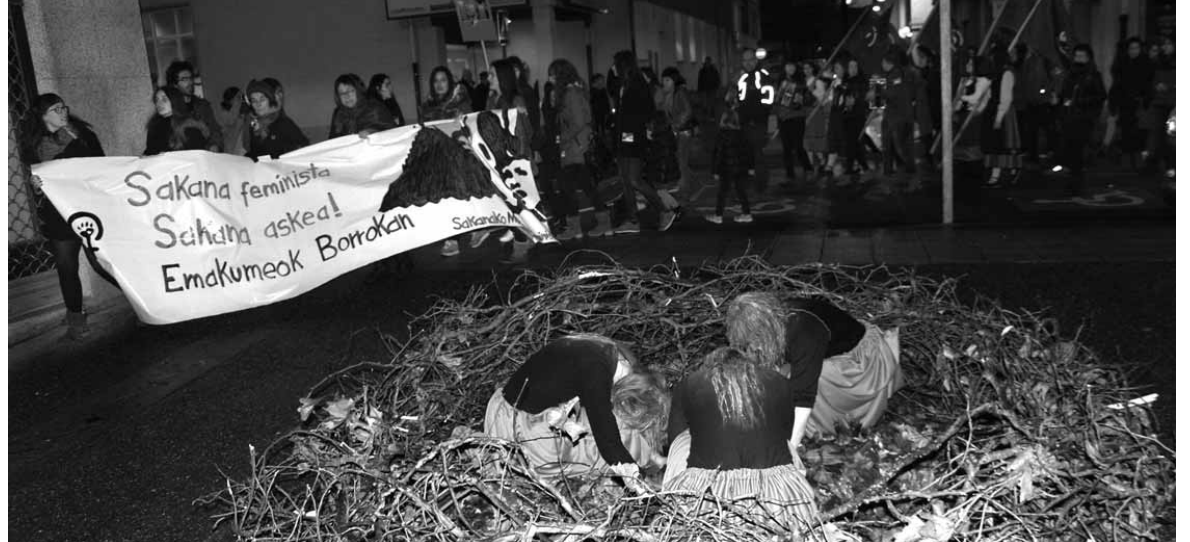
Performancea, dantza eta bertsoak izan ziren manifestazioan. Hari buruzko bideoa ikusteko beheko QR kodea ibili.

Feministek "arazoaren sustraira" joateko ordua zela adierazi zuten. "Irreal den berdintasun instituzionala eta genero desberdintasuna egiturazkoa" dela onartzeko eskatu zuten. "Horretarako bota ditzagun sutara edertasun kanonak, publizitate sexista, homofobia, gure ahotsen isilaraztea, emakumeon lan ordu bukae-