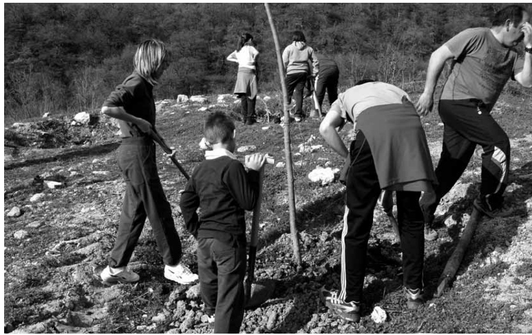
Arakildarrak aurretik ere hartu izan dituzte aitzurrak zuhaitzak landatzeko.

Larunbatean, 9:00etatik, Egietako Itxasperi ermitan