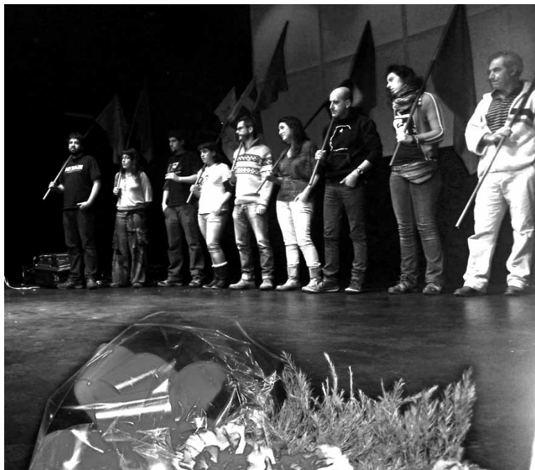
Askapenako kideak 25. urteurrenako ekitaldian, Altsasun.

NATOrri duela 30 urte ezetz esan zitzaion moduan "ekonomiako NATO" den hitzarmenari ere bizkar ematera deitu du