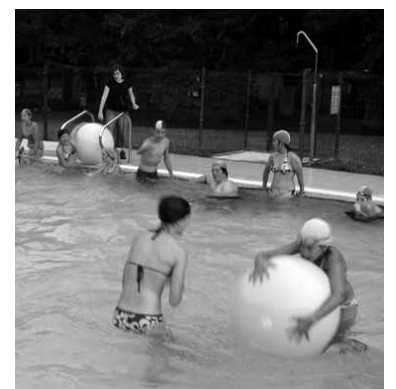
Gozamenez ur festa goxoa.