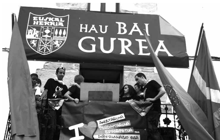
Lakuntzako festetako txupinazoa.

Etxarriko udal ordezkariak ez daude epaiarekin ados. Haien iritziz, "estatuko administrazioak ez du legitimazioarik foru-lege baten urraketa salatzen. Izatekotan Nafarroako Gobernuak izanen luke, baina ez estatuko administrazioak, hain zuzen ere foru-lege bat delako eta hortaz, Nafarroako