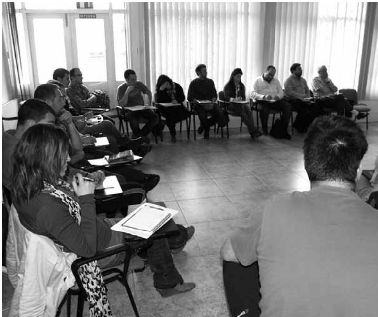
Behatokiaren aurreko bilera bat.