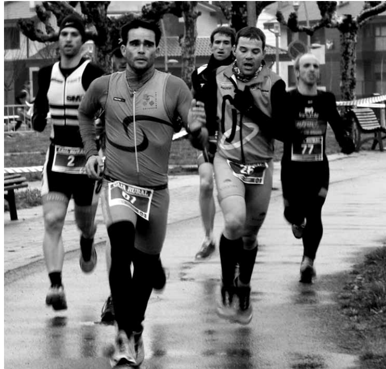
Atzera ere eguraldi kaxkarrari aurre egin beharko zaio Altsasun.

Zirkuituari dagokionez, aurreko urteko zirkuitu bera da biharko lasterketarako antolatu dutena. “Antolakuntzaren aldetik ziurtasuna ematen digu, dena kontrolatuta dugulako. Eta kategoria txiki-koen kasuan ere haurrek ziurtasun hori dute, badakite non jokatu den eta ez dira horren urduri ego-