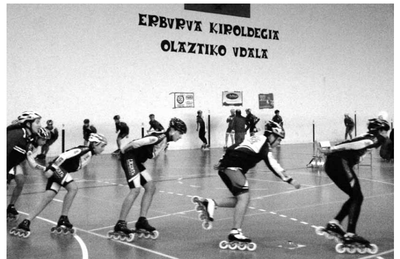
Bihar Olaztin 300 irristalari inguru espero dira.

Goizeko 10:00etan Txikien Ligako probak abiatuko dira -miniak, aurrebenjaminak, benjaminak eta kimuak- eta 12:00etatik aurrera Helduen Ligakoak -haurrak, jubenilak, juniorrak eta seniorrak-