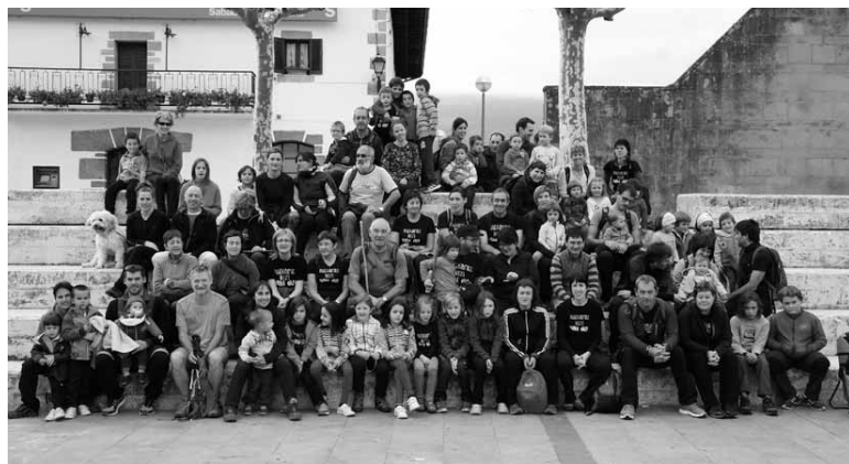
Familia-Mintzakiden aurreko batean parte hartutako batzuk.

Hilero irteera bat prest dute. Igandean Etxeberriko txangoa izanen da euskaraz aritzeko aukera emanen duena. Irurtzongo plazatik Biahizpeko presarantz joko