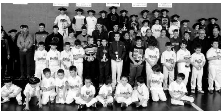
Malerrekako Txapelketako finalista guztiak.