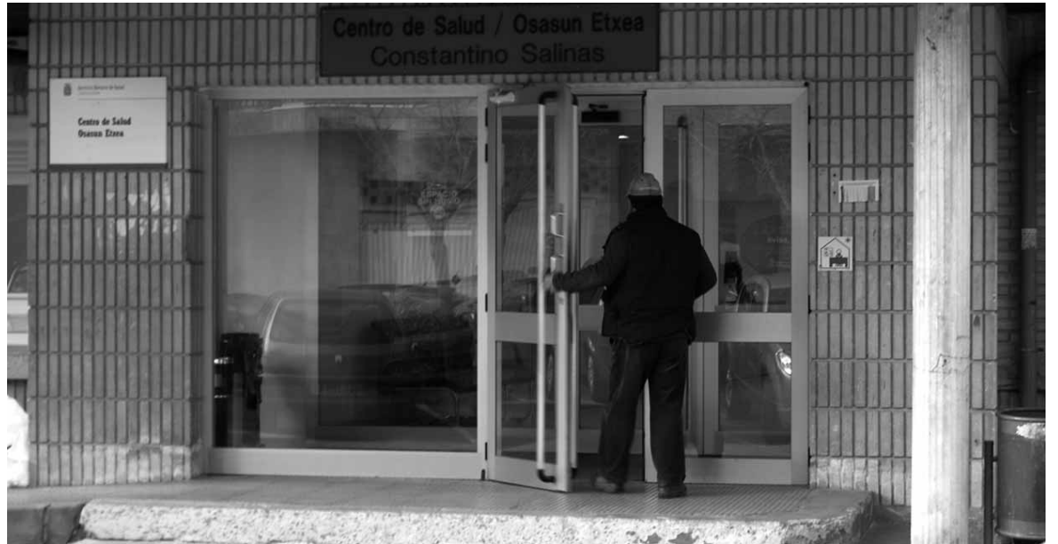
Gizona Altsasuko osasun etxera sartzen.

"Helburu handirik gabe, haurrek ariketa fisiko egingen dute. Aerobikoa, ez-lehiakorra, ongi pasatzea, denak elkarrekin ibiltzea, mugitzea aitzineko jokoekin