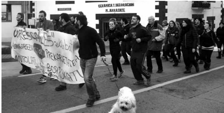
Irurtzundarrek lasterketarekin bat egin zuten. MAIALEN HUARTE ARANO

Joan den urteko grebari eusteko erresistentzia kutxa sortu zuten, baita zorra ere. Prekarietatearen kontrako lasterketak harri aurre egiteko dirua biltzea zuen helburu. 90.000 euro biltzea aurreikusitako zuten eta 120.000tik gora jaso dituzte. Kopurua handitu daiteke, martxoaren 15era arteko epea baitaiko ekarpenak egiteko. Zorra pagatzearekin batera, beste borroka batzuetarako erresistentzia kutxa sortzea da asmoa.