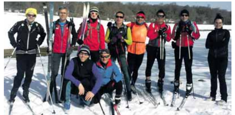
Igandean ibilaldian aritu zen taldeetako bat, Eskizan.

Autobus batek Urbasara igo zituen ipar eski ibilaldian aritu zirenak, 8:30ean. Autobusa kontratatua zegoela aprobeztatuta, nahi zuten orok Urbasara autobusez igotzeko aukera izan zuen, 8:30ean