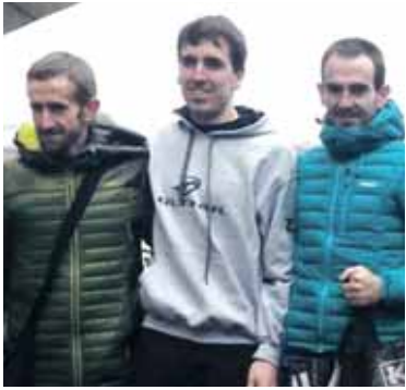
Beraza eskuinean, podiumean.