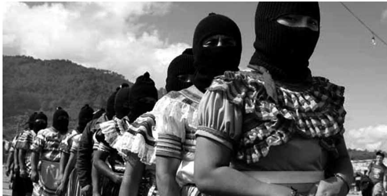
Chiapasko zapatistak. Aurreko urteetan brigadistek haien berri izan dute.

Askapenako kideen iritziz, “brigadak oso lanabes garrantzikoak dira askatasun sozial zein nazionalaren alde borrokan dirauten herrien arteko zubiak eraikitze, lanabes ezinbestekoak halaber, Euskal Herri Internazionalista eta antiimperialista sortzera bidean”. Hori horrela izanik, aurtengo brigadek “balio politiko erantsia” dutela ziurtatu dute. Espainiako Auzitegi Nazionalen Askapenaren kontrako “epaiketa