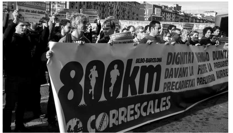
Prekarietatearen aurrean duintasuna aldarrikatuko dute. WWW.URIOLA.EUS

Correscales ekimenak ere kolektibo, mugimendu, erakunde eta pertsonen arteko konplizitateak lortzeko erabili nahi dute. Aldi berean, aldarrikapen eta salaketa lasterketarekin bat egiteko deia egin dute. Hainbat arlokako borrokek elkar laguntzea nahi luketela adierazi dute antolatzaileek.