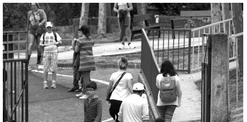
Atakondoa ikastetxera sartu-irteten. ARTXIBOA

Mank Nafarroako Hondakin Partzuergoan sartu zenetik hondakindegian soilik industria hondakin bizigabe ez arriskutsuak botatzen dira. Mank-ek halakoendako gune berri bat nahi du, ibarreko enpresek 8 urte gehiagor Arbizun hondakinak bota ahal izateko. "Haiei zerbitzu bat eskaintzea, kanpora eraman behar ez izateko".