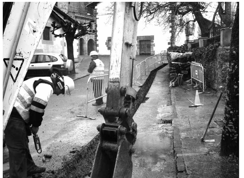
Gasa sartzeko lanean.

Horiek dira sakandarrek joan den urtean sinatu zituzten kontratu kopurua. Haietatik %52,84 gizonezkoek sinatu zituzten (4.163) eta %47,16 emakumezkoek. Kontratu ia gehienak, %94,47, aldi baterakoak izan ziren (7.442). Mugagabehurtu zirenak %2,89 izan ziren (228). Eta hasieratik mugagabeak izan zirenak %2,64 (208).