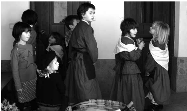
Gaztetxoek ere larunbateko puska biltzean parte hartu zuten. MAIALEN HUARTE