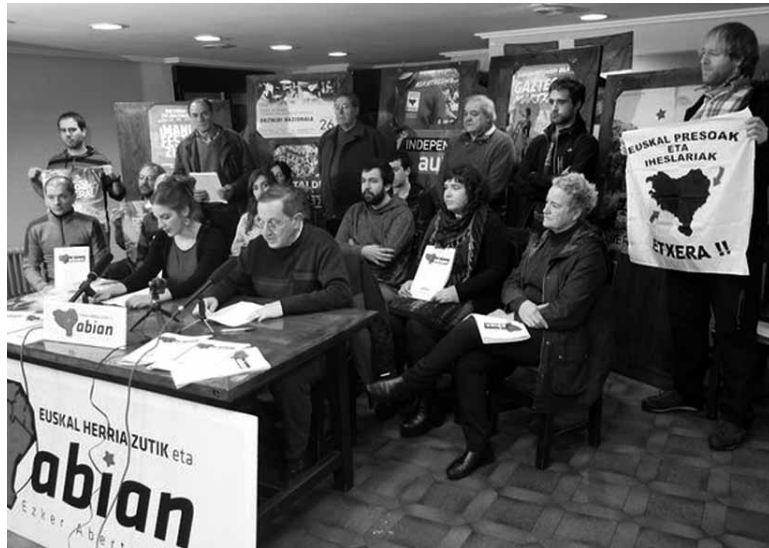
Abian prozesuaren baitan ezker abertzaleak espetxeetara martxan deitu ditu.

Euskal Herria abian, presoak etxera lelopean , euskal preso politikoak preso dauden Espainiako eta Portugalgo espetxe guztietara martxa antolatu ditu ezker abertzaleak biharko. Eskualde guztietatik abiatuko dira autobusak. Pirinioetakoak eta Sakanakoak elkarrekin Dueñas espetxera abiatuko dira. Bi autobusek hartuko dute Palentziarako bidea. Sakanarrak hartzeko aurreneko geldialdia 8:30ean Irurtzunen egingen dute. Etxarri Aranatzeko eta Altsasun bete ondoren, martxari ekingen diote. Behin espetxera iritsita enkartelada egingen dute, musika eta globo aireratzea ere egingen da.