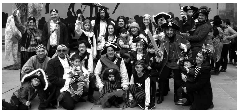
Piratak, mariatxiak, sanferminlariak, zirkuak... denetarik izan zen ihoteetan.