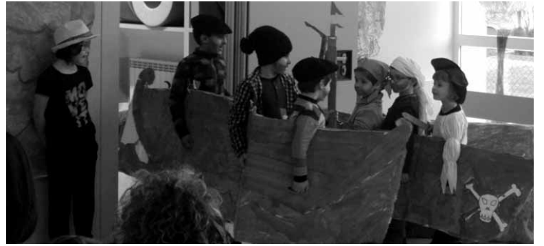
Antzezlaneko piratek itsasontzi bat baino gehiago zituzten. UTZITAKOIA

Ikasturte honetan ikasleek dagoeneko hiru antzezlan jokatu dituzte. Azkena, aurreko ostiralean. Txikien taldea, Lehen Hezkuntzako 1., 2. eta 3. mailako haurrak izan ziren Piratak eta azken balea antzezlan aurkeztu zutenak. Iturmendiko eskolan garatzen ari diren proiektua Albaola itsas faktoriaren bisitarekin osatuko da. Sakanako hainbat herri eskoletako ikasleek Pasaiarako bidea hartuko dute martxoan.