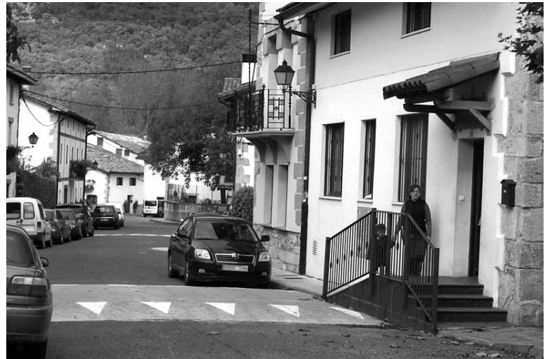
Txapel Azpi elkartera sartzen.

Nafarroako Gobernuak Irañetako ur biltegia berritzeko premia aspaldi ikusia du. Baina dirurik ez duenez, irintarrak lan hori egiteko zain daude. Nilsa enpresa publikoak, bestalde, joan den urtean gaizki zegoen hobi septikoa araztegiagatik ordezkatu zuen. "Kontu