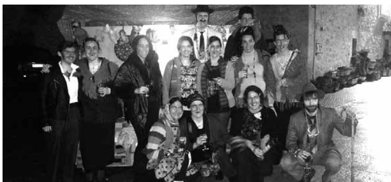
Mozorro gau animatua izan zuten ziordeak larunbatean.