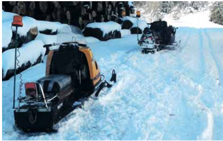
Ipar eskian aritzeko pista prestatzeko lanak, Urbasa-Andian. ARZELUS

Igandean ipar eski ibilbidea antolatu du Mank-ek Otxoportillon. Autobusa 8:30ean abiatuko da Altsasuko Suhiltzaileetatik