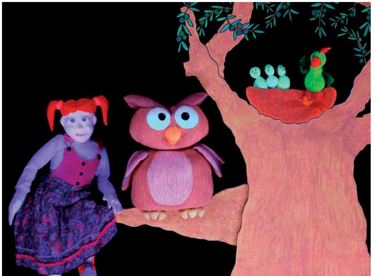
Akëshia, otsailaren 21ean, domekan, 17:00etan Altsasuko Iortia kultur gunean.

Zero grabitatea. Martxoaren 17ra arte, astegunetik 18:30etik 21:00etara eta domeketan 19:00etatik 21:00etara