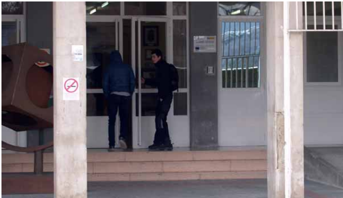
Ikasleak Altsasuko Lanbide Heziketako institutura sartzen.

Ikasleen jatorrizko ikastetxeak, eskualdeko enpresak, erakundeak, ikasle ohiak –prestakuntza jarraitua eman diezaikegu– eta ikastetxea (irakasleak, ikasleak eta