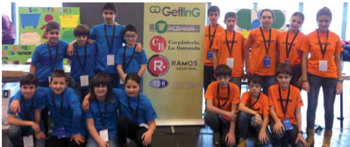
Bi talde urdiaindar robotika proban Iruñean neurtu ziren. UTZITAKOIA

Nafarroako First Lego Leagueko Nafarroako kanporaketa Iruñeko Baluarte jauregian ilbeltzaren 30ean. Lehiaketaren helburuak zientzia, kultura, robotika eta balioen sustapena dira. Aurreko edizioetan bezala errobota egin, harekin probak bete eta, gainera, ikastetxean hondakinen birziklatzeari buruz egindako lan bat aurkeztu behar zuten talde parte-hartzaileek.