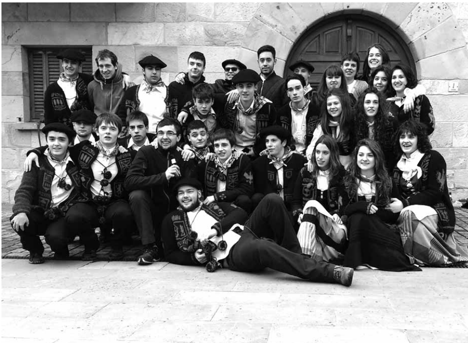
Eguerdiko zortzikoak dantzatu eta gero poz-pez elkartu ziren talde argazkia egiteko.