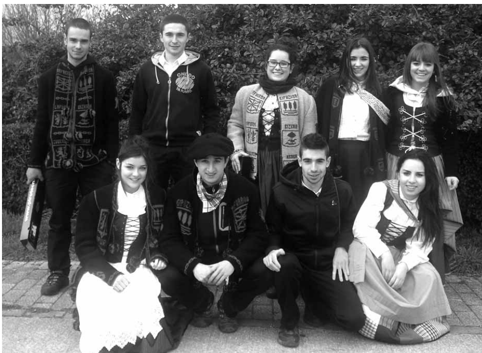
Larunbatean eskean ibili ziren Bakaikuko kintoak.