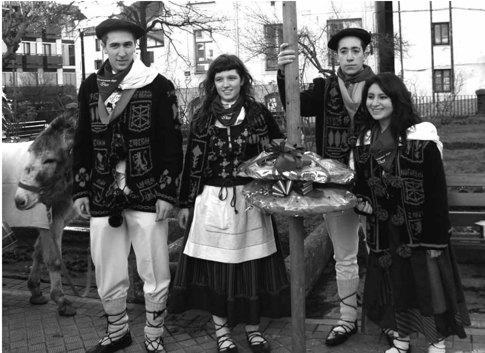
Altsasuko kintoek 16.000€ jaso dituzte.