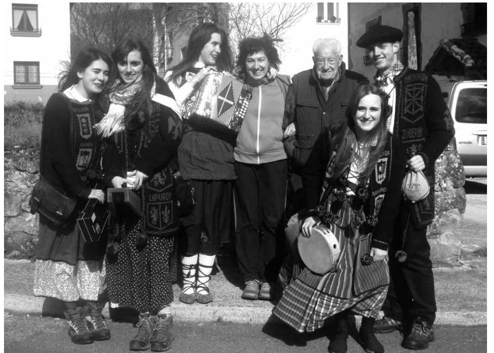
Larunbat goizean trikitilariak lagundurik, ziardiarrei ardoa eta tabakoa eskaini zieten esker onez.