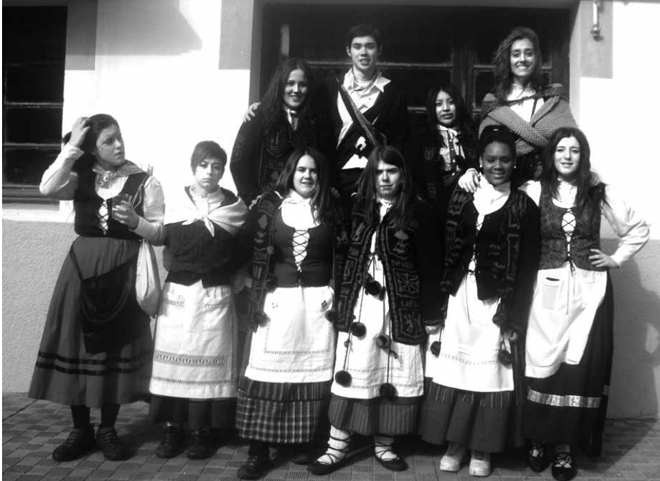
Olaztiko kintoak larunbat goizean opilak banatzen ibili ziren.