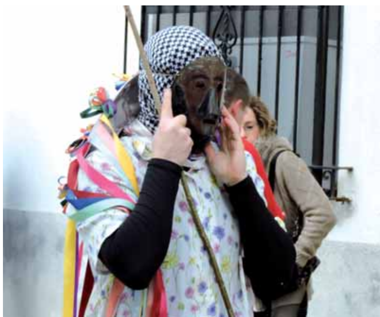
Aurten, estreinako, emakume unanuar batek katola jarri du.