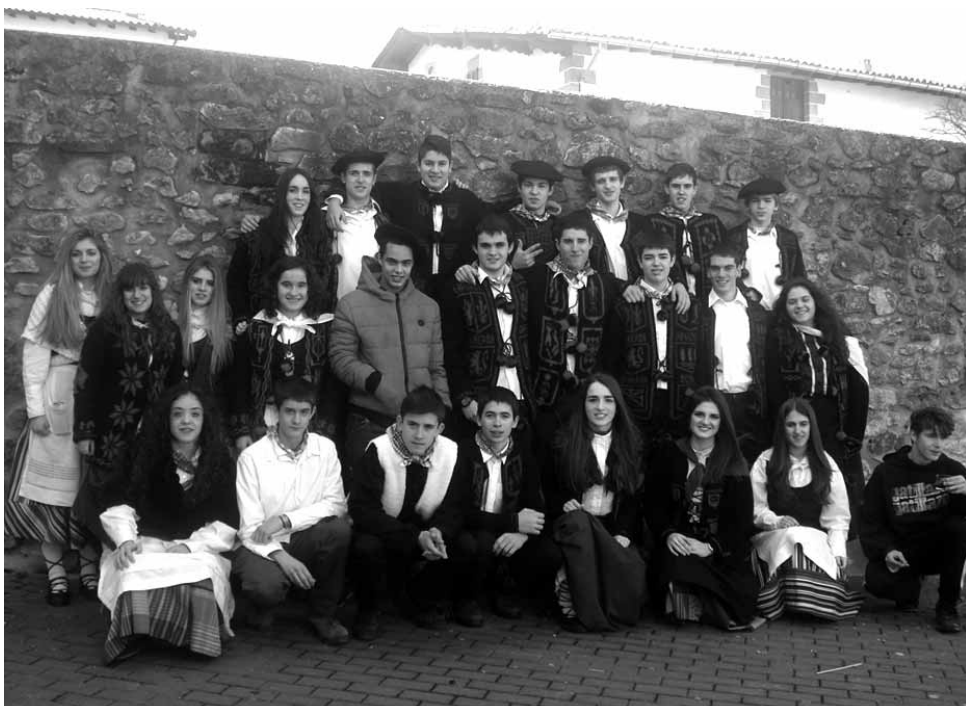
Larunbat goizean Iturmendiko kintoak elkarrekin gosaldu eta kalez kale eskean ibili ziren.