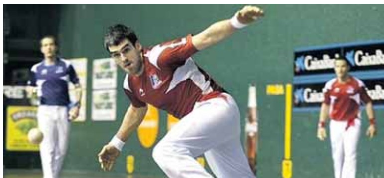
Ezkurdiak eta Barriolak ez zuten egun ona izan.

Ezkurdia-Barriolari Binakakoa hankaz gora jarri zaie, Irujoren eta Rezustaren kontra 22 eta 7 galdu ondoren