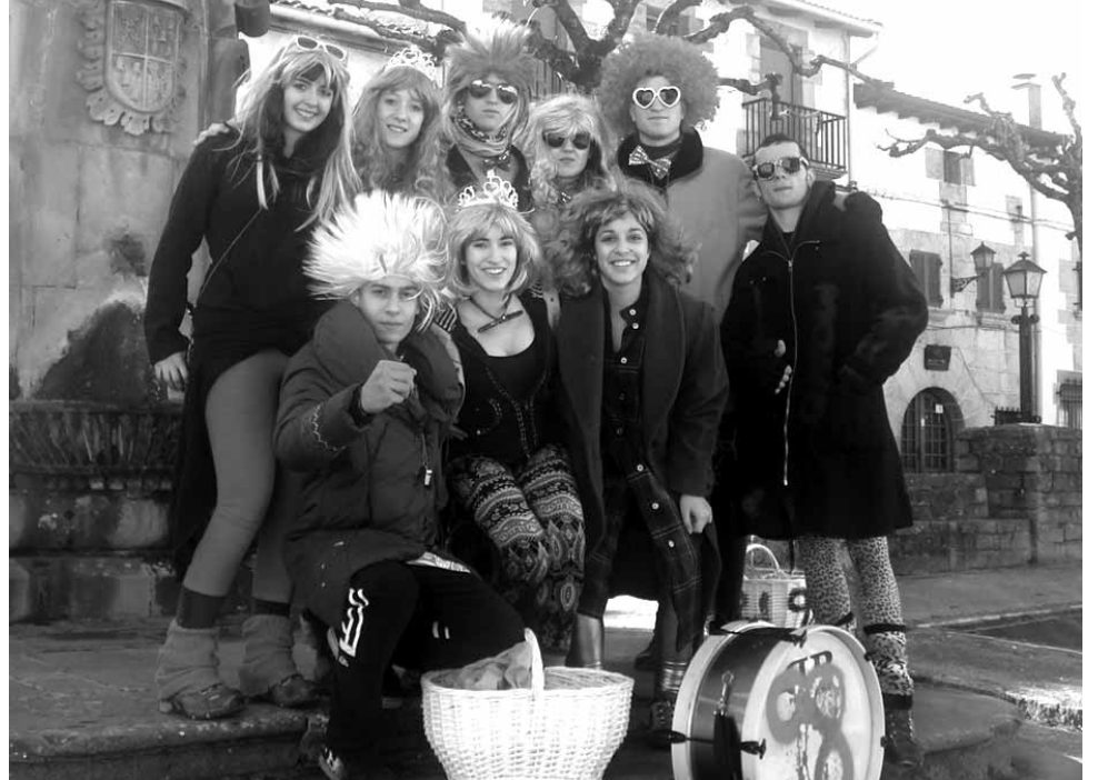
Uharte Arakilgo kintoek bat egin zuten ihote ospakizunekin.