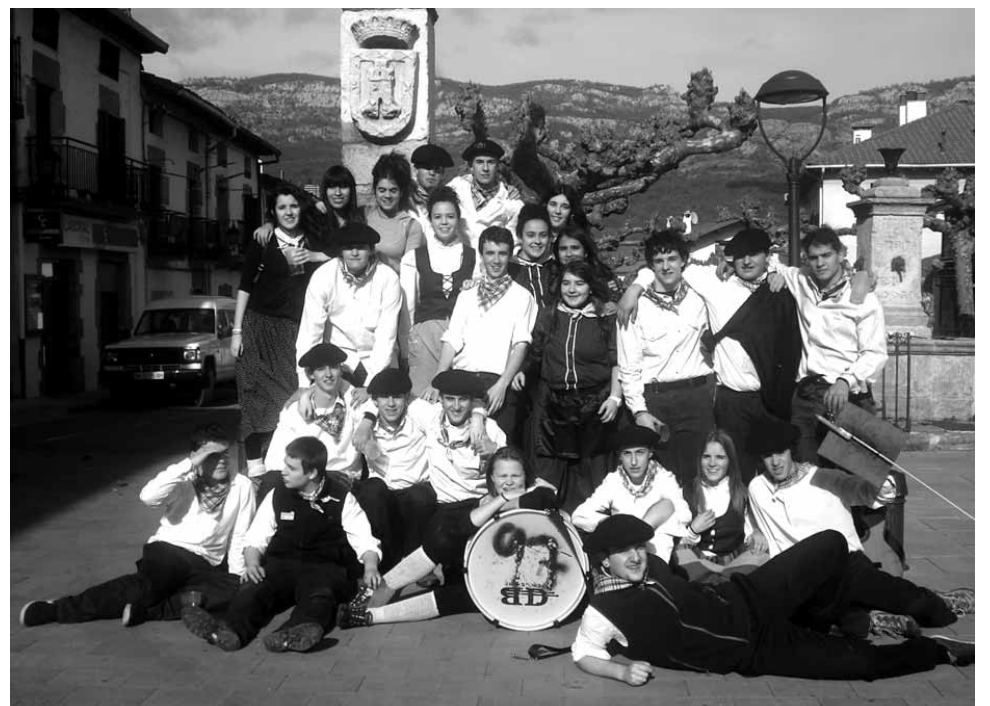
Lakuntzako kintoak Pikota aurrean atera zuten talde argazkia.