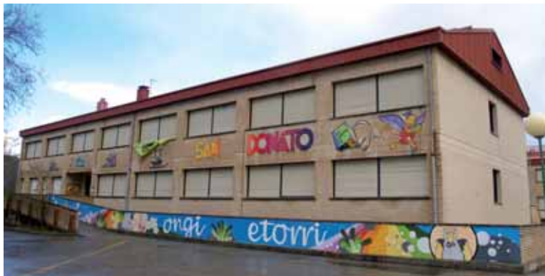
Etxarri Aranazko eskola.

Gaiak interesa sortu du bi ikastetxeetan. Horren adierazle bi ikastetxeetan taldea sortu zela. Denera ia 30 irakasle elkartu ziren.