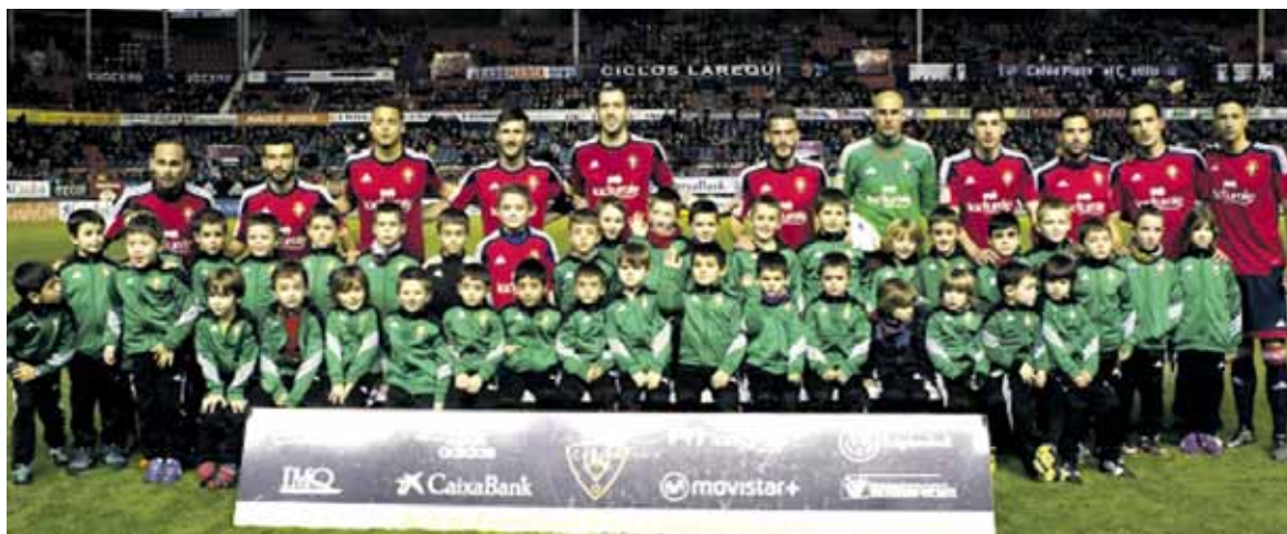
Etxarriko futbol eskolako neska-mutikoek Osasunako jokalariekin talde argazkia atera zuten, Sadarren.

Etxarri Aranazko Futbol Eskolako ikasleak Sadarren izan ziren igandean, Osasuna Fundazioak futbol eskolekin egiten duen kanpainaren barruan, Osasunak eta Almeriak jokatuako partida ikusten. Horretaz gain, Osasunako futbol taldearekin argazkia ateratzeko aukera izan zuten Etxarri Aranazko eta Berriobeitiko futbol eskoletako neska-mutikoek, haien gozamenarako.