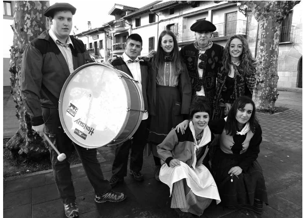
Arbizuko kintoak kaleak alaituz ibili ziren.