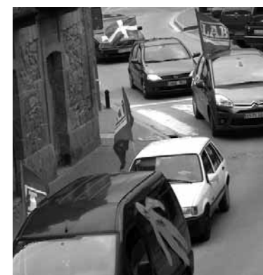
Lan osasunaren aldeko LABen ekimena.