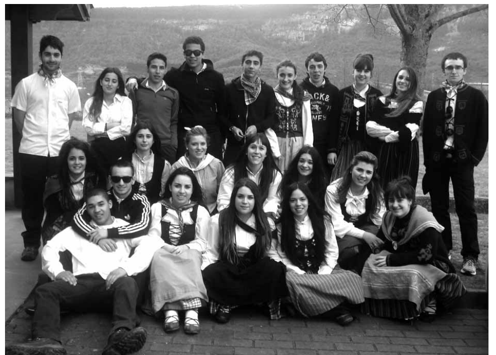
Etzarri Aranazko kinto neska-mutil kuadrilla ederra.