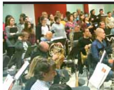
Etxarriko abesbatza La Pamplonesarekin Iruñean >>>15