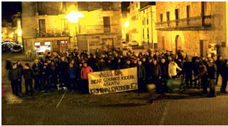
Astelehenero batzarra eta gero atxilotuen askatasuna eskatu zuten.