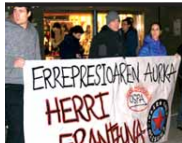
Indar Gorriko bi altsasuar atxilotuak eta auzipetuak >>>6