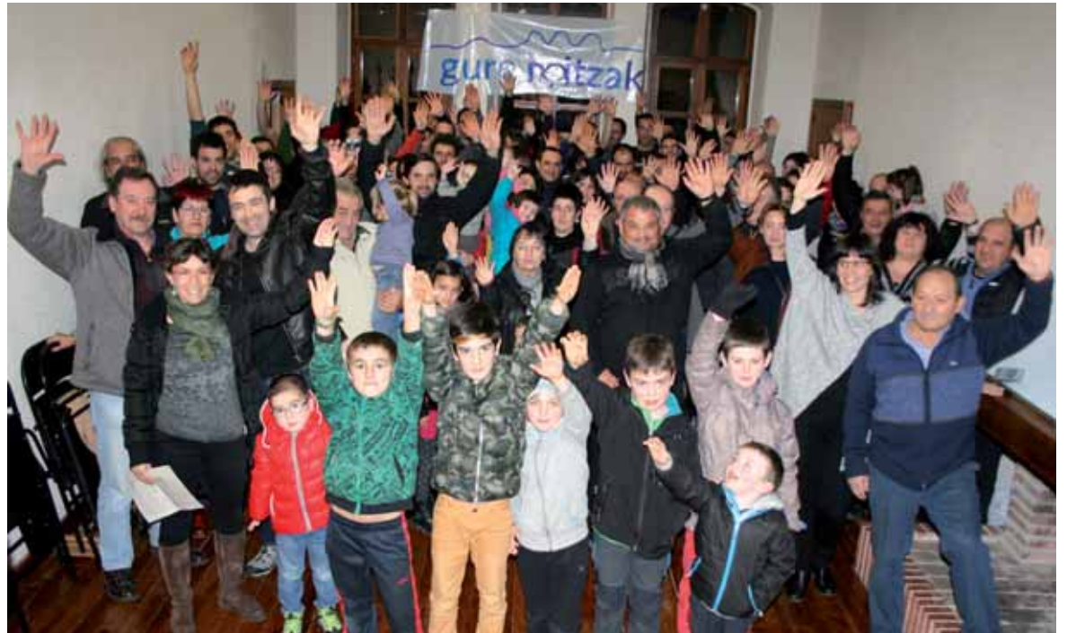
Batzarra egin ondoren bakaikuarrak herri galdeketa berri eman zuten. UTZITAKOIA

Bakaikuko erroldan 290 pertsonadaude. Herri galdeketa alde sinadurak biltzen aritu dira azken asteetan eta 130 babes jasotuz dagoeneko. "Babesnitza" dela gaztigatu dute. "Bilketa ez da bukatu eta sinadurak oporua hantitzea da gure helburua".