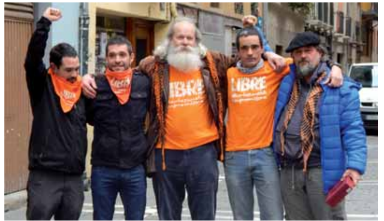
Askapenako bostak Iruñeko Kaldererian. ASKAPENA

Askapenatik adierazi dutenez, "absoluzio sententzia garaipen bat da, dudarik gabe, eta bereziki, garaipen politiko bat da. Bai Euskal Herriko eta baita lagun ditugun beste herrietako pertsona eta antolakunde garaipena da, estatu espainiarra bere politika errepresiboan mantentzearen aurkako bidean herri borrokaren aldeko apustua egin dugunona". Aldi berean, Askapenak "esker ona"