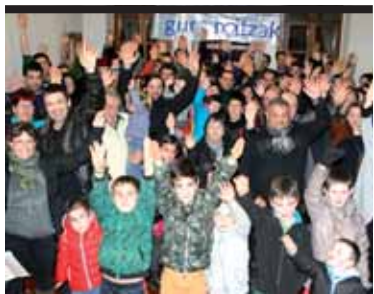
Bakaikun herri galdeketa garagarrilaren 19rako >>>5