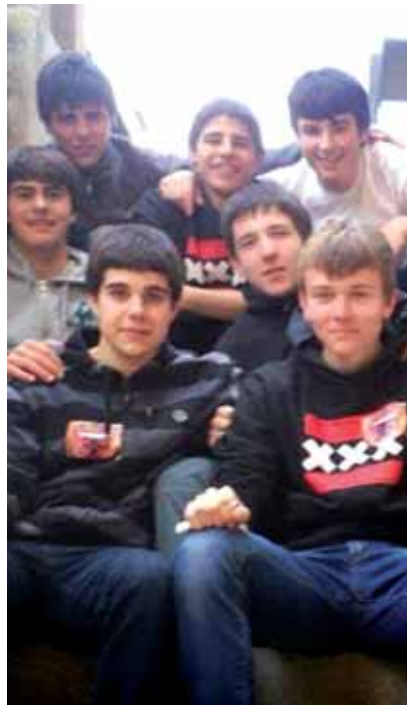
Skarmentu musika taldea.

Siriako gerra, errefuxiatuak eta harrera