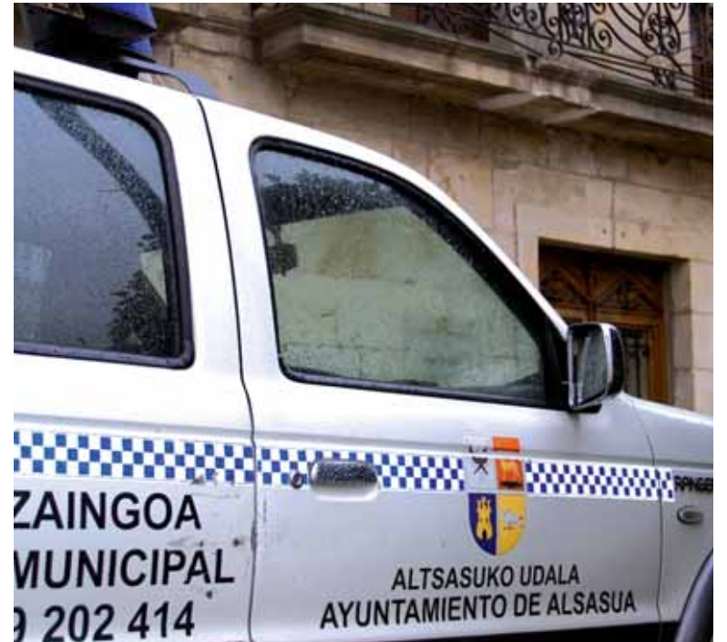
Udaltzainen ibilgailua udaletxe parean.

dira, baina udaltzaingoa duten udal guztietako alkateekin bilera egin nahi du Beaumontek, "legea egiteko lantalde bat sortu eta koordinatzeko, denon onurarako izateko". Udalek interes kontrajarririk dituztela azaldu digu kontseilariak: "batzuk udaltzainak Foruzaingoan sartzea nahi dute eta, beste batzuk, udaltzain gehiago eskatzen dituzte; gelditutako oposizioak daude". Hilaren akaberan edo martxoaren hasieran litzateke.