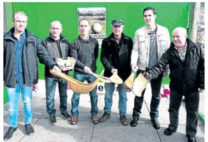
Pilota Berria taldeko hautagaietako batzuk, Arruti eta Lopetegi tartean.

Egora ekonomikoaz galdetuta, Pilota Berria taldeak dio pilotara bideratutako aurrekontua 715.000 eurokoa dela "eta horretatik erdia soldatetara bideratua dago". Hautagaitza berriaren iritzi, "soldaten kopurua aurrekontuaren herena ez gaintzea da normalena, horretatik hemengastuak murriztu ahal izanen genituzke". Bukatzeko, egungo Federazioak egindako injerentzia bat salatu zuten. "Federazioko langileria ofizialak Hauteskunde Batzordeari egindako galdera bat erantzun zigun, eta legalki ezin da hori egin".