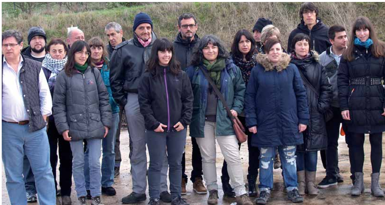
Hiri eta industria hondakinen kudeaketarako eskola tailerrea aritu diren ikasleak erdian.