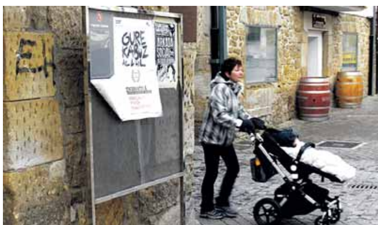
Gure Etxea eraikinean jarritako informazio panela.