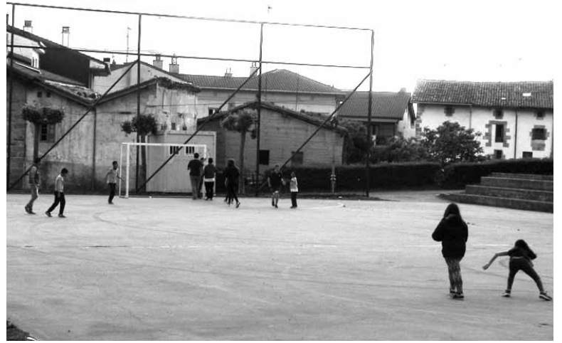
Gaztetxoak baloiarekin jolasten. ARTXIBOA

tentazioa kenduz, esaterako, Altsasura, non eskaintza ludikoa baduten". Negu "luzean" gaztetxo horiendako inolako espaziorik ez dagoela gaztigitatu dute gurasoek. "Igandean kiroldegia itxita dago eta frontoiaren erabilera adinduendako arautua dago. Igande euritsu eta hotzetan zer egiten dute?