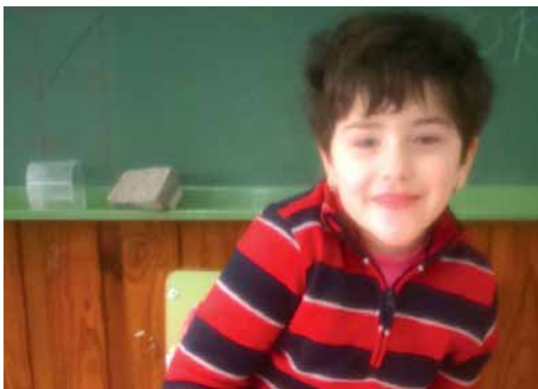
Nicole apirilean operatuko dute.

bere garapenerako ona izanzen dela uste dutelako. Eskola komunitatea laguntza eskaintzeko prest azaldu da eta diru bilketan laguntzen ari da.