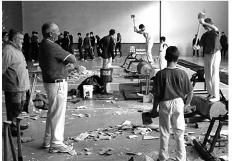
Eskolako ikasleak irakaslearen ondoan, Sakanako Herri Kirol Jardunaldian.