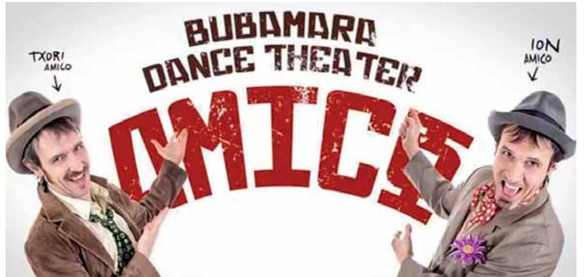
Amico antzezlanari bihar, larunbata, 19:00etan Etxarri Aranazko kultur etxean.

22an, ostiralean, 21:45ean eta ilbeltzaren 24an, domekan, 20:00etan Altsasuko Iortia kultur gunean.