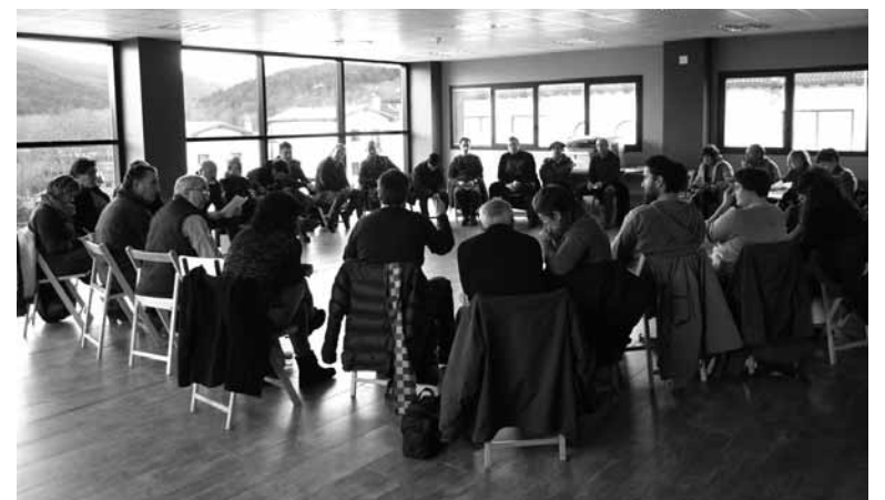
Sareak deitutako topaketa irekiko bilkuretako bat. UTZITAKOIA

nak, helburuak, gabeziak eta ahuleziak mahaigaineratuz. Ondoren, egungo egoera eta aurrera begira zehaztu beharreko lan ildoak aztertu zituzten. Eta horretarako kontuan hartu zituzten: gako estrategiko eta ideologikoak; jarduera ereduak, ekimenak eta mobilizazioak; antolaketa eta mugimenduaren hedapena. Aurtengo plangintza ere zehaztu