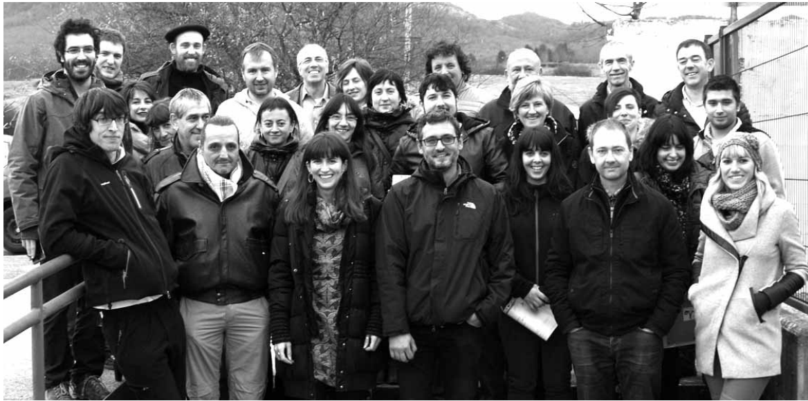
Eskola-tailerreko ikasleak, irakasleak eta sustatzaileak.

Sei hilabetez hondakinaren kudeaketa integralari buruzko jakintza jaso zuten. Aurreneko bi hilabete eta erdiak klasean egon ziren hiri hondakinak, industria hondakinak (laborategiko praktikak barne) eta lan osasuna eta segurtasuna gaiak lantzen. Nafarroako Unibertsitate Publikoak hondakinaren kudeaketari buruzko Altsa-