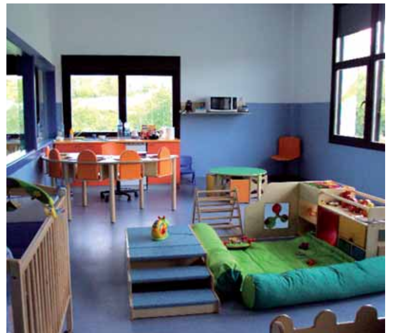
Kattuka haur eskola.

Astelehenean onartutako emendakinen artean Lakuntza-Arbizuko Kattuka eta Altsasuko Txirinbulo haur eskola publiko- en eskaintza hobetzeko bi diru sail aurreikusten dira; bata 300.000 eurokoa eta, bestea, 100.000 eurokoa; 400.000 euro guztira. Lakuntza eta Arbizuko Udalek Kattuka haur eskola eraiki zuten baina Nafarroako Gobernuak hitzemandako diru-laguntzarik ez zuten jaso. Udalek 150.000 euroko diru-laguntza jasoko dute aurturten. Altsasuko Udalak, bestalde, Haur Hezkuntzako lehen zikloa egiteko 250.000 euro behar dituela uste