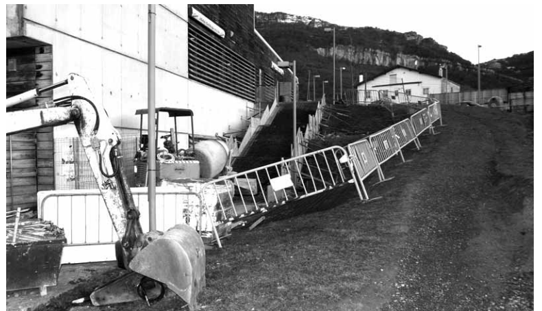
Kiroldegi ondoan egiten ari diren eskaileretako lanak.

espaloietan beheratzeak egin dira eta ez zegoen tokian espaloia egin dute. Lan horiek beste batzuk egiteko udalak joan den urtean bi langabe, kisugilea eta peoia, sei hilabete eta erdiz kontratatu zituen. Kontratazioarako udalak 32.500 euro jarri zituen eta Nafarroako Gobernuaren 17.500 euroko laguntza jaso zuen. 50.000 euro guztira bideratu ziren kontratazioetara.