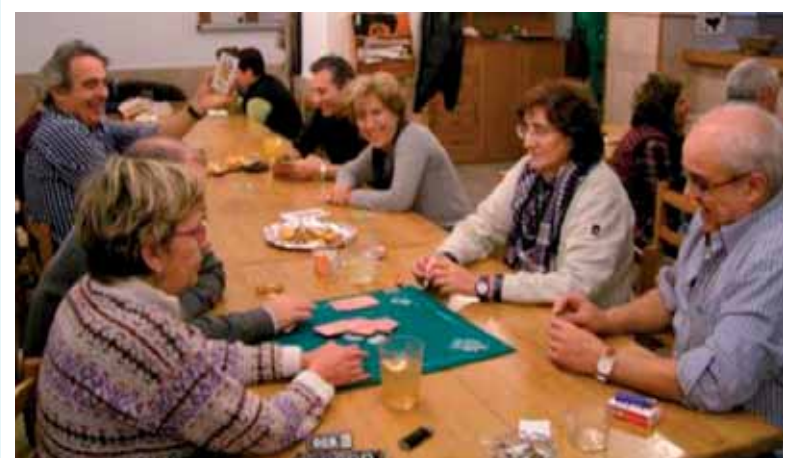
Irañetako kanporaketa. UTZITAKOA