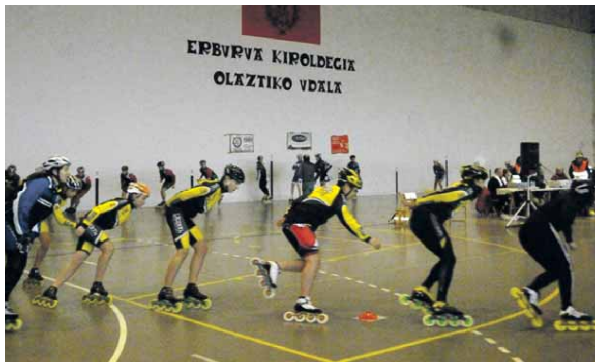
Bihar irristalariz beteko da Olaztiko Erburua kiroldegia.

Bihar, 17:00etan, Sakanako irristaketa Topaketa izanen da Erburua kiroldegian