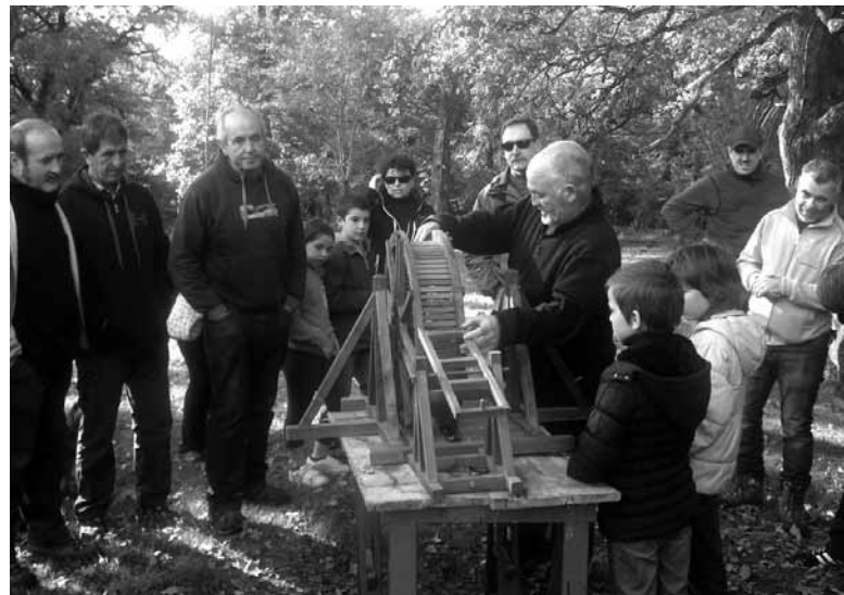
Enneco-ra egindako bisita gidatuetako bat.