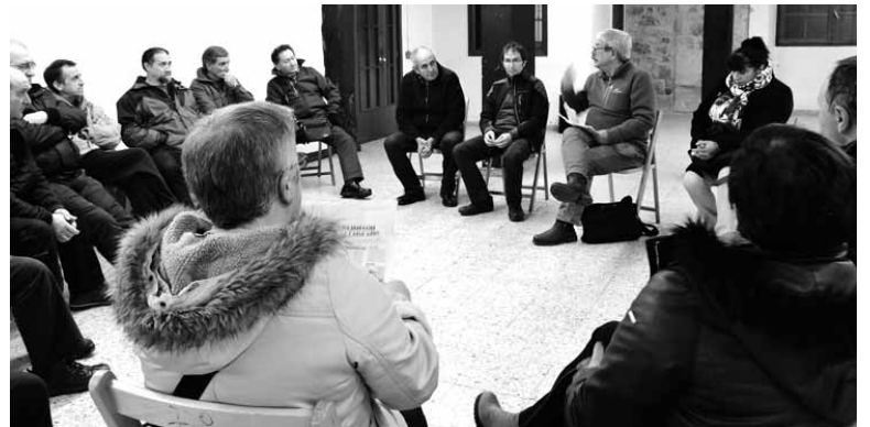
Amiantoaren kaltetuen elkarrearen sustatzaileen abenduko bilera.