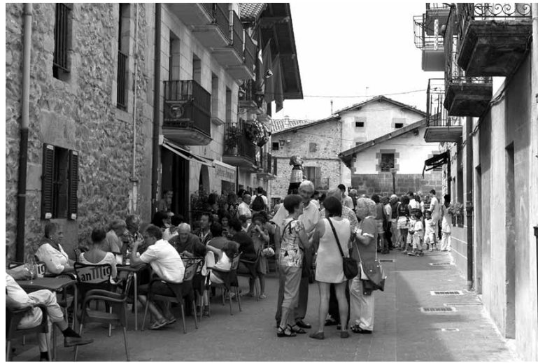
Olaztiarrak kalean, joan den urteko festetako lehen egunean.

Elkarteko tabernen irudia izanen dena aukeratzeko Infernuko erreka kideek logotipo lehiaketa antolatu dute. Berau Infernuko erreka elkartearen informazioaren zabalkunderako kartel eta beselakoetan erabiliko dute. Logoti-