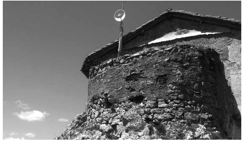
Telefonia antena Ergako Trinitate ermitan.

rentziak izan ditzakete. Arazoak izanez gero herritarren arretarako telefono honetara hots egin daiteke: 900 833 999. Informazioa www.llega800.es web orrian jaso daiteke. Telebista seinalea zuntza optiko, satelite edo internet bidez jasotzen dituztenek ez dute aldaketarik sumatuko.