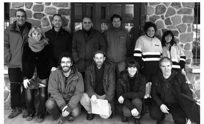
Madrildarrak eta haiei harrera egin zieten sakandarrak. UTZITAKOIA

hondakindegian despiditu zuten. Sakanako ordezkariak euren kezka ere jakinarazi zieten bisitariari: tokiko administrazioek euren hondakinen kudeaketa proiektuak garatzeko dituzten zailtasunak eta ezarritako tasak zigor ekonomikoa direla, sortutako hondakin kopuruaren arabera pagatzen ez delako.