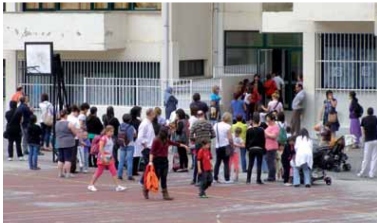
Gurasoak eta ikasleak Atakondoa eskolan.

Bost hilabetez hiru hezitzaile arduratuko dira eskola-laguntza emateaz; haietako bat boluntarioa da. Haien ardurapean 17 ikasle izanen dira. Haietako 9 Lehen Hezkuntzako 3. eta 4. mailakoak dira eta gainontzeko 8ak DBHko 1. eta 2. mailakoak. Guztiak ere Atakondoko ikasleak. Arrazoi desberdinengatik eskola-laguntza programan parte hartzen duten ikasleek arazo akademikokoak dituzte. Horregatik, programaren bidez gehienbat alderdi akademikoa lantzen den arren, beste alderdi batzuk ere