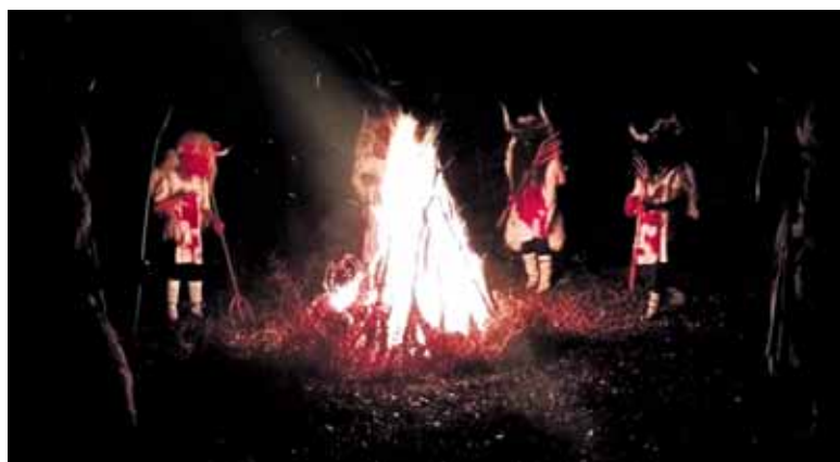
Sakanaren sustapen bideoan momotxorroak ageri dira.