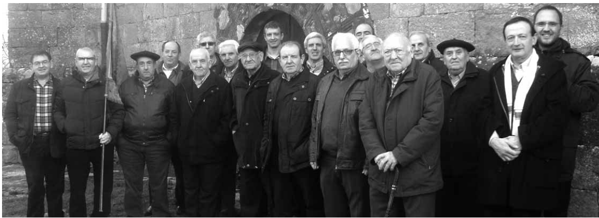
Iturmendiko san antondarrak, kofradiako bandera eta guzti.