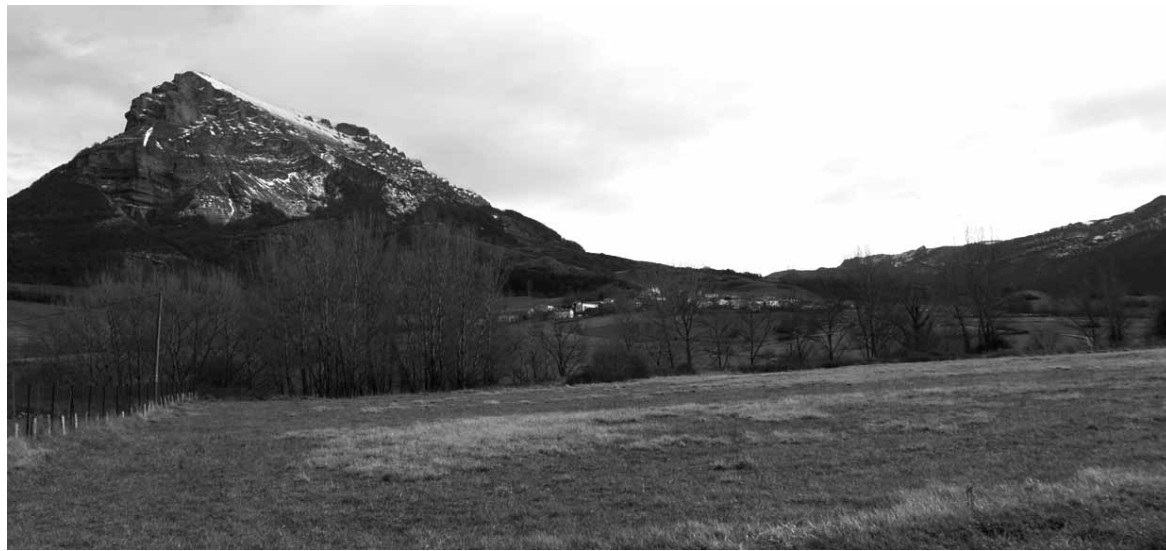
Berriain mendi azpian Unanu, Dorraorako errepedetik.