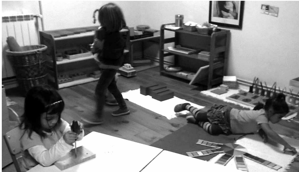
Amalur eskolako ikasleetako batzuk gelan.