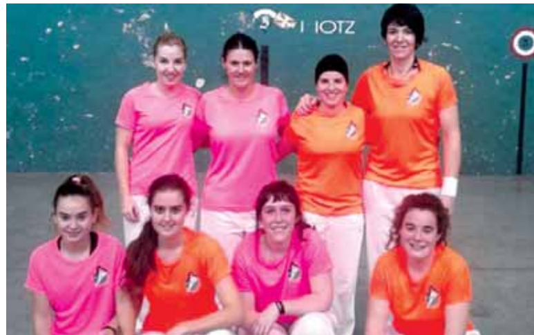
Sakanako I. Gure Pilota Pala Torneoan parte hartu duten palista batzuk.

Finalak igandean jokatu dira, abenduaren 27an, 10:00etatik aurrera Etxarri Aranazko Euskal Herriari pilotalekuan. Sekulako partidak jokatu dira orain arte eta final ikusgarriak espero dira. Ea txapelak Sakanan gelditzen diren.