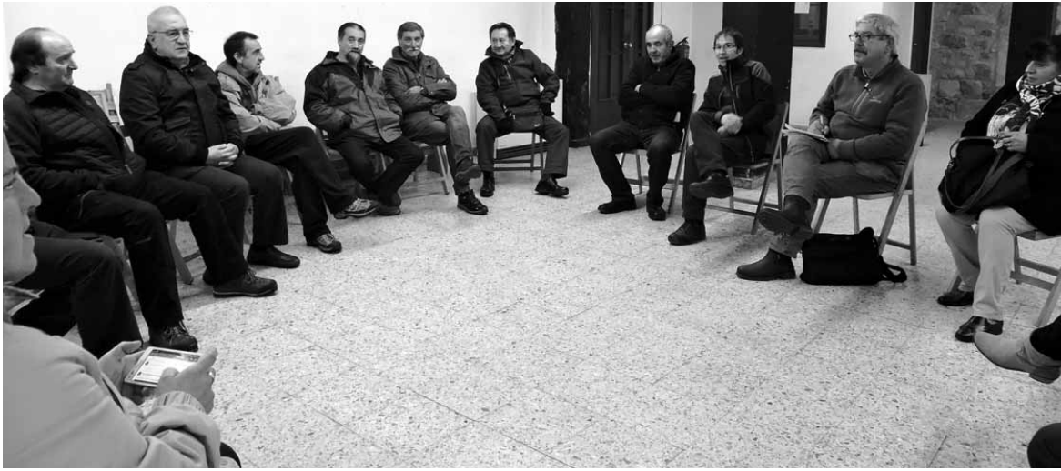
Duela bi asteko bileran 20 bat sakandar elkartu ziren.