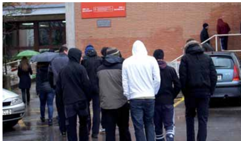
Ikasle eta irakasleek logoaren aukeraketan zeresana izanen dute.

ko dute. Lanekin batera diseinuaren zergatiaren azalpen txiki bat gehitu behar da, bost lerrokoa gehienez ere. Lanak ikastetxearen idazkaritzan aurkeztu behar dira. Proposamen bakoitzaren atzean egilearen datuak agertu beharko dira. Martxoaren 4ko 14:15era arte aurkeztu daitezke lanak. Epai- leek kontutan izanen dituzten iriz- pideak honakoak dira: irudiak xehetasun gutxi izatea; praktiko- tasuna (hainbat euskarritan era- bilgarria izatea, txuri-beltzean inprimatu ahal izatea eta ikaste-