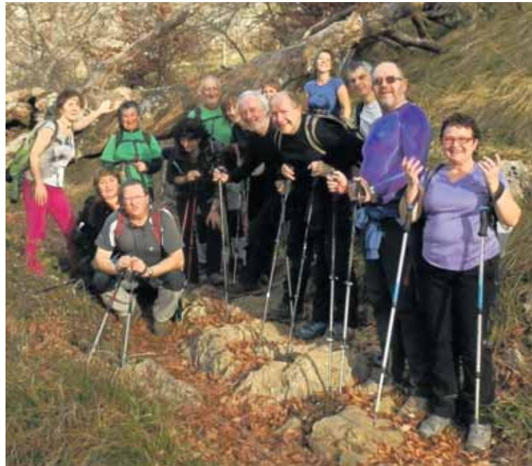
Sakanako Mendizaleak taldekoak, Aralarra igotzen. Santutegia mendigoizalez bete zen igandean.

Mendizaleendako egun kuttuna da, joandako mendizaleak oroitzeko eta beste klubetako aspaldiko lagun mendizaleekin biltzeko eguna. Eta baita ere urtea despeditzeko egun ederra. Aurreko hiru urtetan bezala, Anaitasuna klubak antolatu zuen eguna. 10:45ean hasi zen hildako mendizaleen oroimeneko meza, Mikel Garciandiak emandakoa. Mendizaleen materiala bedeinkatu zuen apaizak. Lekunberriko abesbatzak kanta-