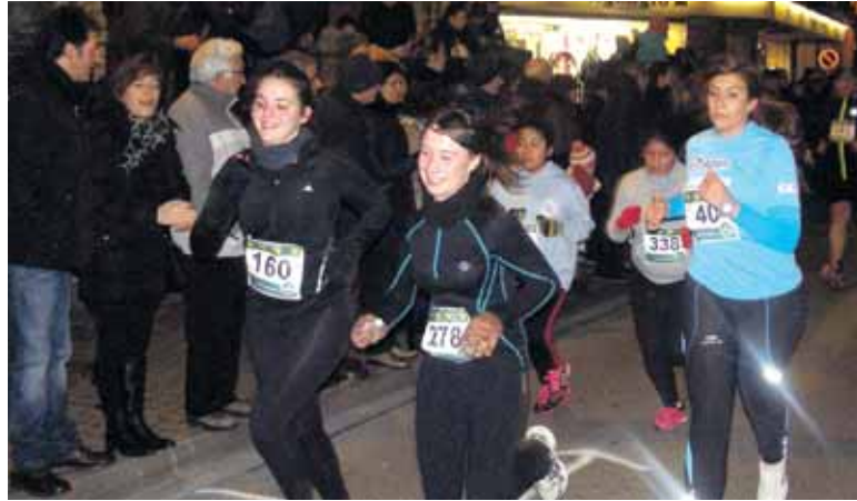
Altsasuko aurreko urteko San Silbestrean 667 korrikalari aritu ziren.