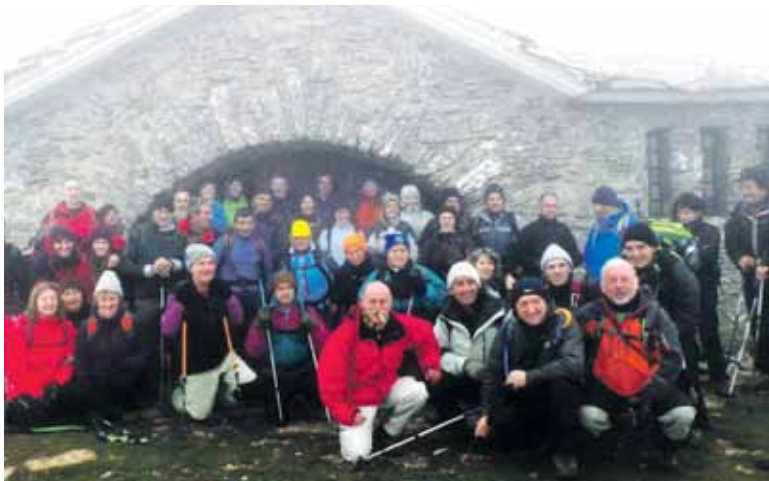
Errege Egunean Beriainen bildu ziren mendizaleetako batzuk.