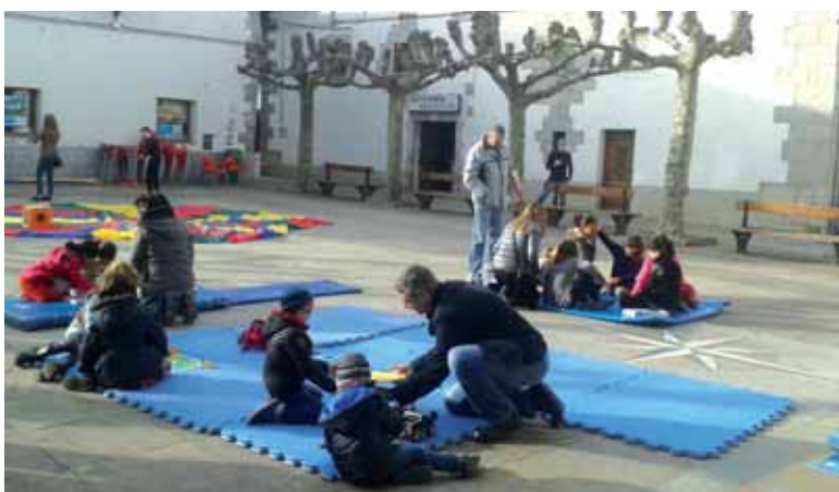
Uharteko plaza jolas parke bihurtu zen. UTZITAKOIA

Eguraldia lagun, frontoian egite- koa zen jostailu trukaketa plazan egin zen azkenik igandean. Haur txokoa jasotako txartelarekin uhartear txikiek, aukera zabala- ren artean, euren jostailu bana hartzeko aukera izan zuten. Baina plazan jostailu trukeaz apar- te jolas kooperatiboak izan ziren. Haur, gazte eta helduak haiekin goiz-eguerdi pasa ederra izan zuten. Eskaintzak uhartear asko erakarri zituen, gainera.