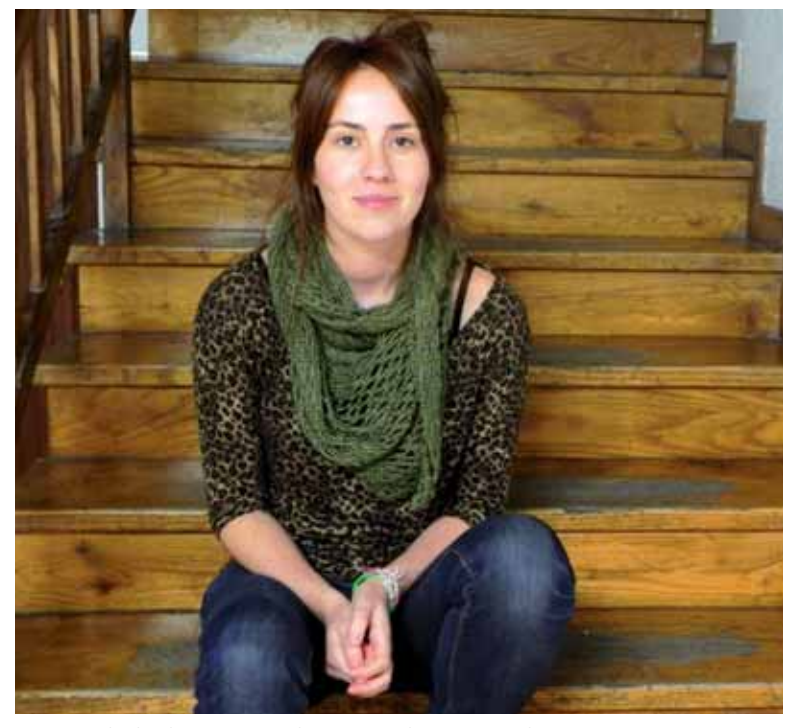
Josune Diaz egindako elkarrizketa, osorik: www.guaixe.eu