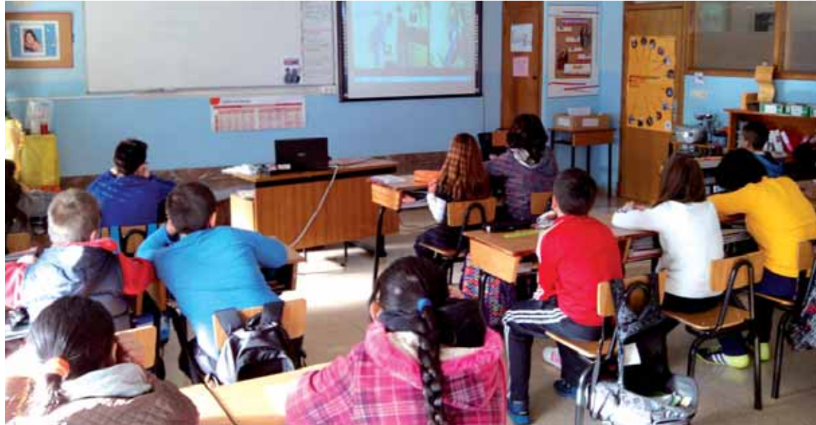
Ikasleak hondakinei buruzko bideoa ikusten. UTZITAKOIA

lizazio tailer horiek Nafarroako Gobernuak Gestión Ambiental de Navarra (GAN) enpresa publikoaren bidez bulkatu ditu eta Mankomunitateak antolatu eta babestu ditu. Ekimen hori foru administrazioak