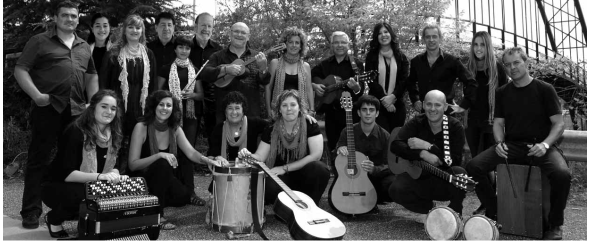
Trasteando taldeko kideak.

Eta horri gizarte erantzukizuna batuko diote, sarreran jasotako dirua ongintzara bideratuz. Aurten Nafarroako Elikagai Ban-