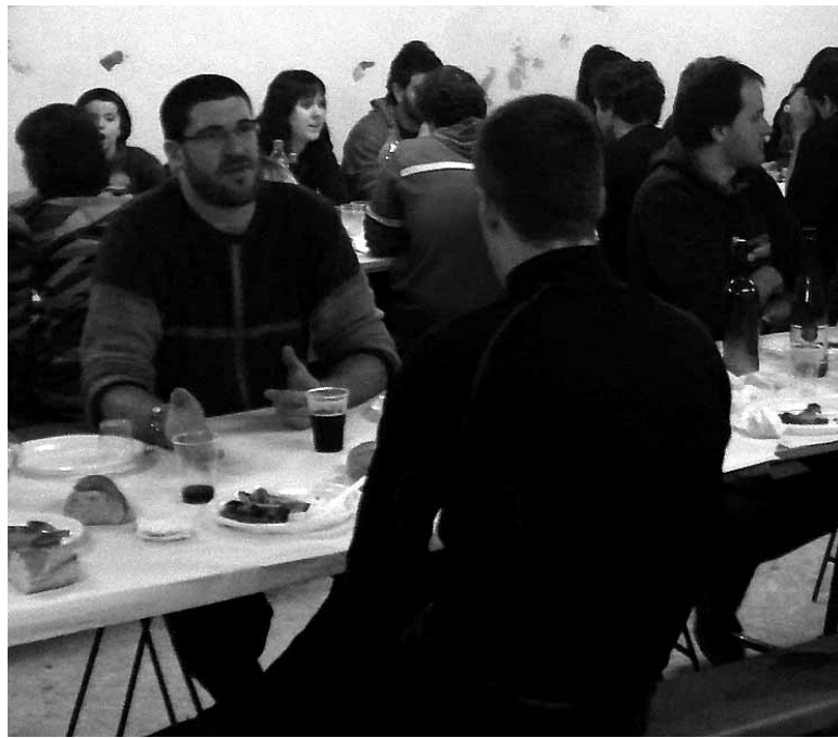
Doneztebe ospakizunean ez da bazkaririk falta. ARTXIBOA

Horren aurretik baina, Olenzero ere herrira iritsiko da. Gurdigainean, ikazkina Beriain menditik behera iristen da. Arratsaldeko sei terdiak aldera egiten du bisita herrian. Gurdia bete opari jaisten da. Laguntzaileak ere bada-kartza, menditik Ihabarrerainoko bidea argitzen dizkioten lagu-