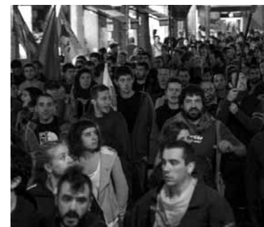
Sakanatik Madrilera joan ziren.

tasuna adierazteko eta Euskal Herriaren kontrako epaiketa politiko gehiago ez izateko manifestazioa egin zen Madrilan. Sakandarrak betetako autobusa Madrilera joan zen.