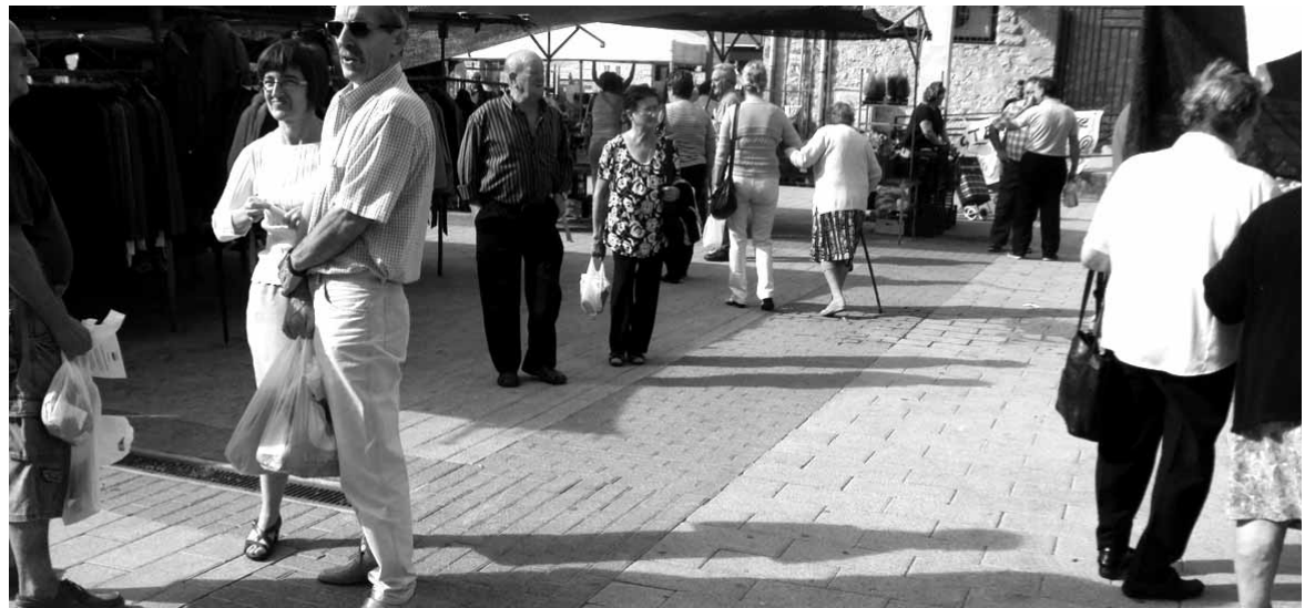
Jendea asteazkenean egiten den azokan.