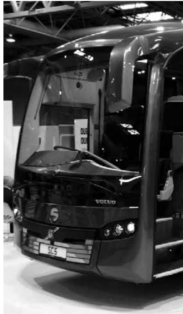
Sunsundeguiaren autobus bat.

Zuzendaritza berriak bideragarritasun plana 2013an jarri zuen eta horrekin batera 40 langile kale-ratu eta 178 gelditu zirela gogorazi dute LABetik. Salatu dutenez, "prekaritatean eta ordu estretan