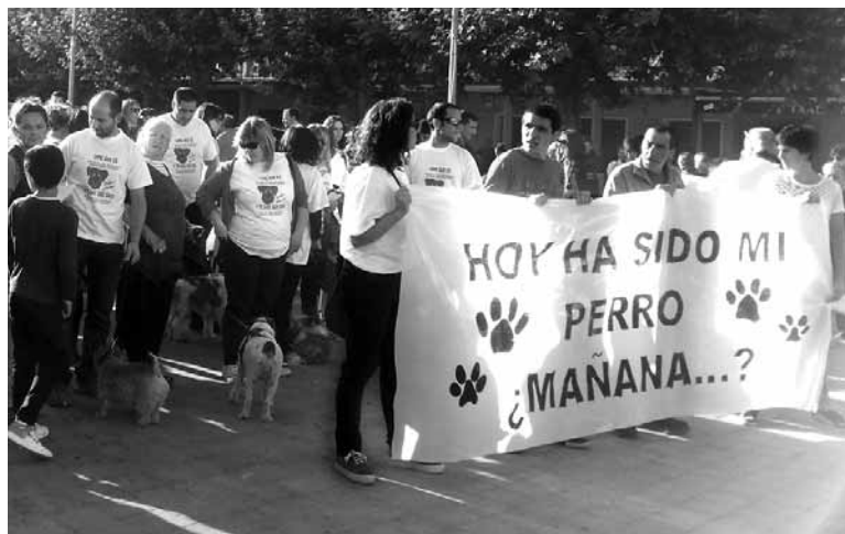
Maskoten pozoitzea salatzen egindako manifestazio buruko pankarta.

Iraileko bigarren asteburuko txakurren pozoitzeen ondoren gertatutakoa salatzen sortu zen