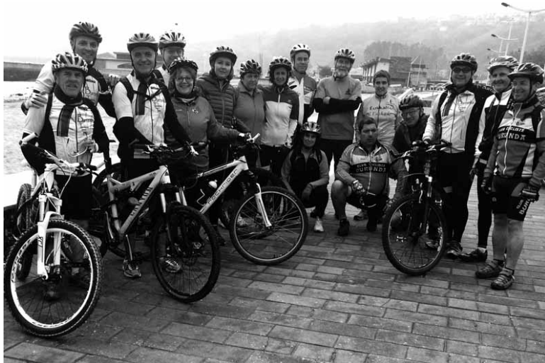
Sakandarrek BTT ibilaldi bikaina egin zuten Suancesen. UTZITAKOIA