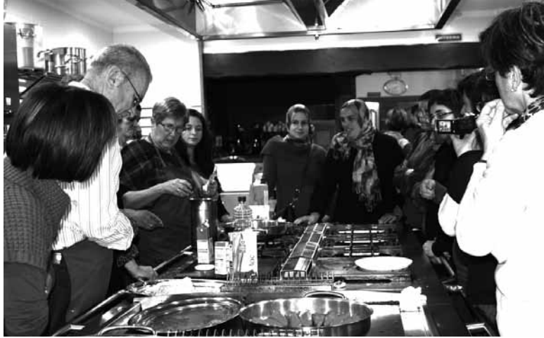
Lakuntzarrak sukaldari irakasle eta ikasle izanen dira aldi berean.

Maroko, Euskal Herria, Hego Amerika eta Senegalgo errezetak prestatzen ikasteko aukera izanen da lau igande arratsaldeetan