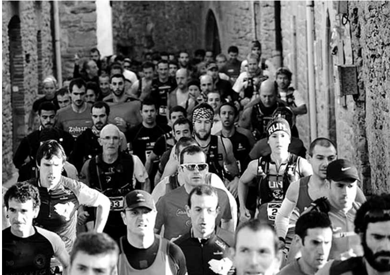
I. Izaga Trail lasterketako irteera.