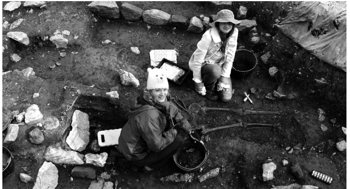
Sei urtetan urtero etorri dira arkeologoen Zamartzera. Goian Erdi Aroko hilerria lanean. UTZITAKOIA

Adituko arkeologoen hezurdurak laborategian ikertuko dituzte. Lan- gintza horretan beste herrialde batzuetako unibertsitate eta labo- rategiak adituen laguntza izan- den dute, bereziki Erresuma Batu- koak, langintza horretarako tres- neria garestia baita. Hezurdura bakoitzari azterketa antropometri- ko zorrotza egingen diote. Hortik datu orokorrak aterako dituzte: altuera, hil zenean zuen adina,