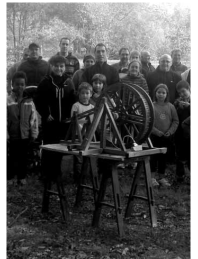
Gustura entzun zituzten azalpenak.