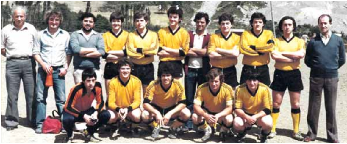
Sutegi futbol taldeko argazki bat. Egun Sutegi klubak jarraitzen du, baina ez dago helduen futbol talderik. UTZITAKOIA