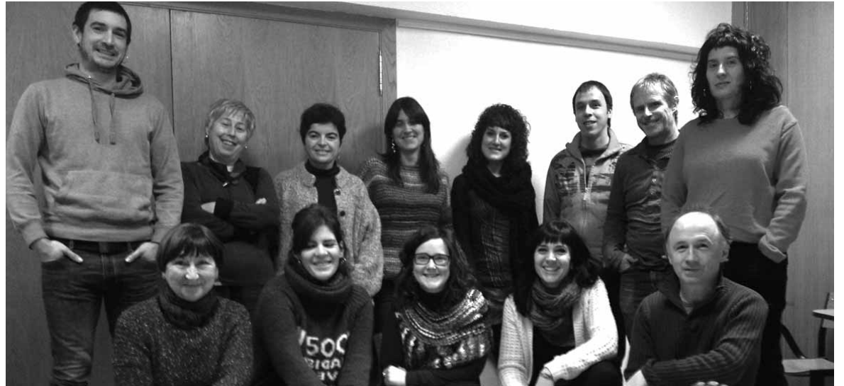
Sakanako Euskalgintza Batzordeko zenbait kide, artxiboko irudian.