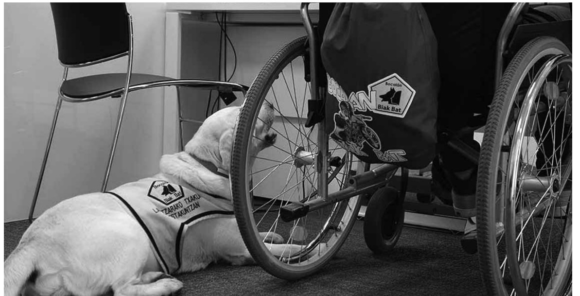
Altsasun egoitza duen Bocalan Biak Bat elkarteak sustatu du Nafarroako Laguntza Txakurren Legea.

Administrazio publikoekin batera, ostalaritzako eragileekin ere lan egiten dute sentsibiliza-