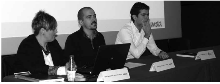
Faktura elektronikoaren erabilerari buruzko azalpenak ematen.