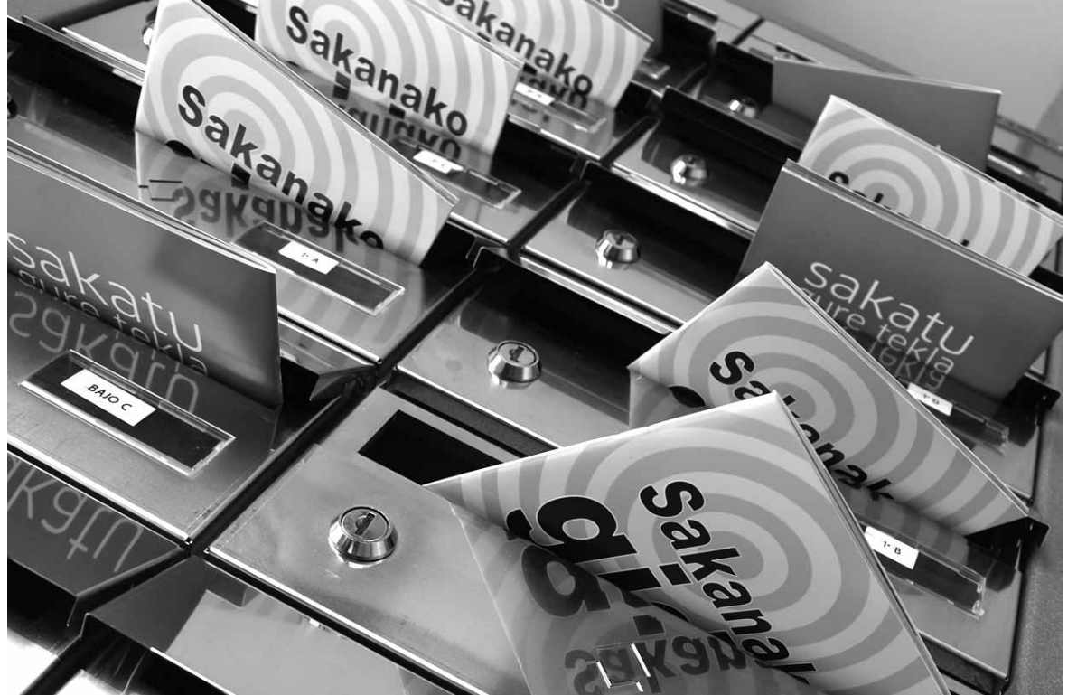
Sakanako Gida 2015-2016 etxeko buzoian jasoko dute sakandarrek.

behar den informazio praktikoa hain zuzen ere. Eta, aldi berean, Sakanan dugun ekonomia-ehunaren aniztasunaz eta establezimenduen ugartasunaz jabetzeko baliagarria ere bada gida. Haie-