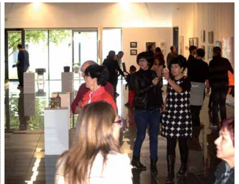
Igandean jende ugari pasatu zen Arte Azokatik.

Euskal Presoak Euskal Herrira! Lastailaren 25ean, domekan,