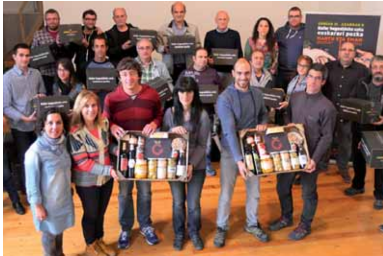
Errigorako antolatzaileak, ekoizleak eta onuradunak aurkezpenean.

Joan den urtean Euskal Herriko 200 herritan izan ziren Errigorako banaketa puntuak eta 12.000 kutxa salduz 160.000 euro lortu ziren. Sakanan ere oihartzuna izan zuen kanpainak 412 eskaera egin baitziren. Laugarren urtez, prest daude eskaera puntuak. Azaroaren 8ra arte egin