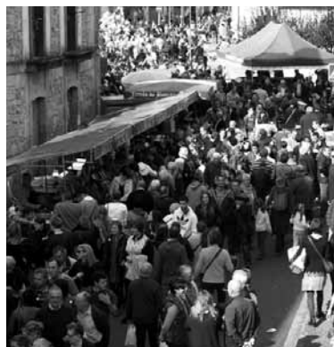
Kale nagusiak jendez lepo bete ziren. Zaldi lehiaketak ikusmin handia sortu zuen.

Txikienek zaldigainean ibiltzeko aukera baliatu zuten Zubeztia plazan. Handik gertu, Otadiko Kristo Deuna kalean, ardi taldeak zeuden ikusgai. Ferialeku kaleak, berriz, joan den urtean zaldi-azienda hartu zuen eta aurten behiak eta astoak izan dira protagonista. Zaldiak, behorrak, pottoak eta biho-