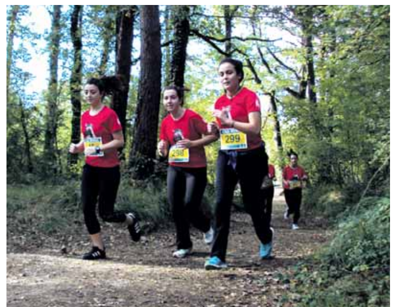
Eguraldi bikinari esker, Onddo lasterketak irudi ederrak utzi zituen.