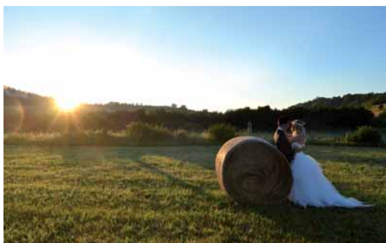
Jasotako 111 argazkiren artean www.guaxe.eus-eko bisitariak aukeratuakoa.

Udako argazki lehiaketak baditu sarituak