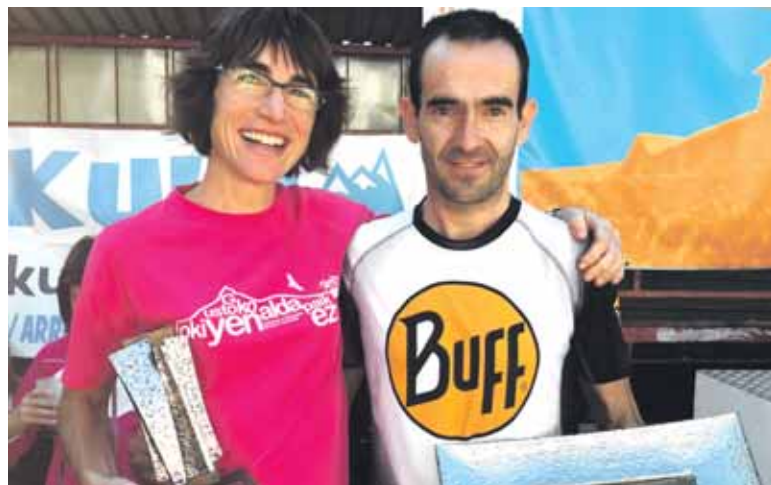
San Martin eta Beraza, lehen sakandarrak. Behean, Sakana Bizirik, talde onena.