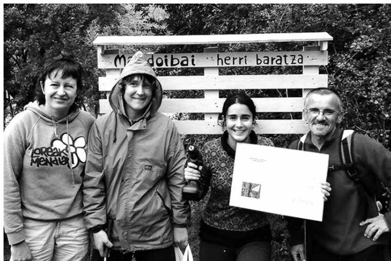
Mandoibai elkarteak kide batzuk herri baratzean.

Noainen beste ikastaro bat eman ondoren, azaroaren 9an,