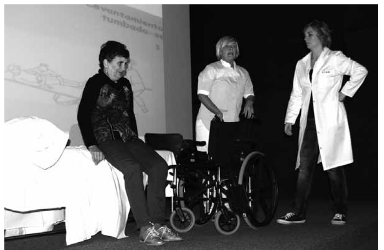
Klinikako langileak boluntario baten laguntzaz aritu ziren asteartean.

telako egoerei nola aurre egin azalduko du medikuak. Prestakuntza saioak aurreko asteartean hasi zituen klinikak, dependentzia duten pertsonak nola mugitu behar diren azaltzen zuen tailer baten bidez.