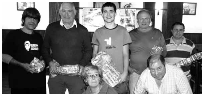
Finalista guztiak, sari ematean.

Irurtzungo Binakako Botxa Txapelketa irabazi zuten asteburuan