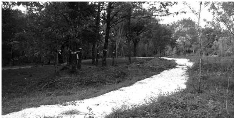
Enneco parkearen banaketa zehaztuta dago eta bideak eginak.

Ingurumeneko eta Lurraldearen Antolamenduko Zuzendaritza Nagusia, Eva Garcia Balaguerrek dioenez, parke tematikoarekin "kultur eskaintza sustatu eta taxutu nahi da, baliabide natural,