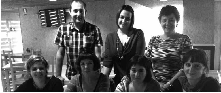
Olatzagutian pasa den ikasturtean aritutako mintzakideak.

Ikasitako euskara praktikatzeko edo herdoildutako euskarari dirdira ateratzeko. Horretarako balio du Mintzakide programak euskara praktikatzeko. Inguruan euskaldunik ez dutelako, lagun arteko joera haustea zaila egiten zaiolako edo lotsagatik dakiten euskara praktikatuz gabe gelditzen dira sakandar asko. Horri buelta emateko, Mintza-