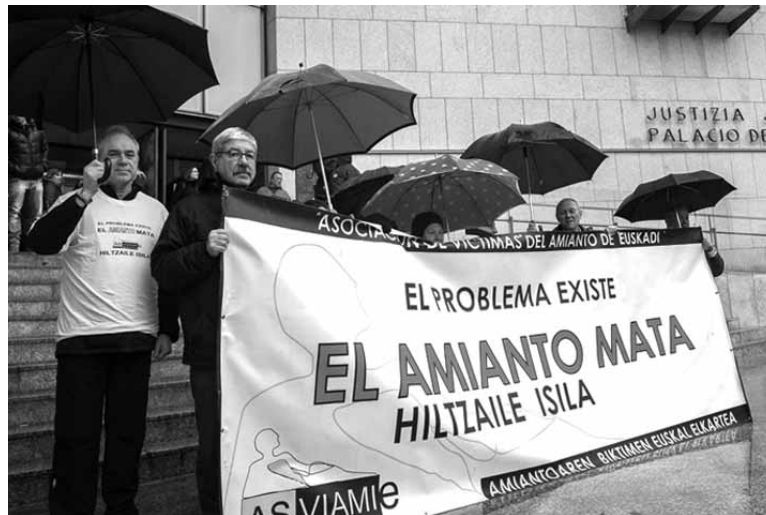
Amiantoaren arriskuaz gaztigatu du askotan Asviamie elkarteak.

Asviamie elkarteak "positibotzat" jo du enpresak kalte ordaina adostea, familia etengabeko helegiteekin zigortu beharrean