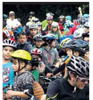
Asteartean, 11:00etan, Altsasuko Baratzeko bide plazan geldialdia egingen du Emakumeen Mundu Martxak eta ekitaldia izanen da.