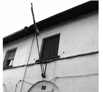
Batzokiko masta, ikurrina gabe.