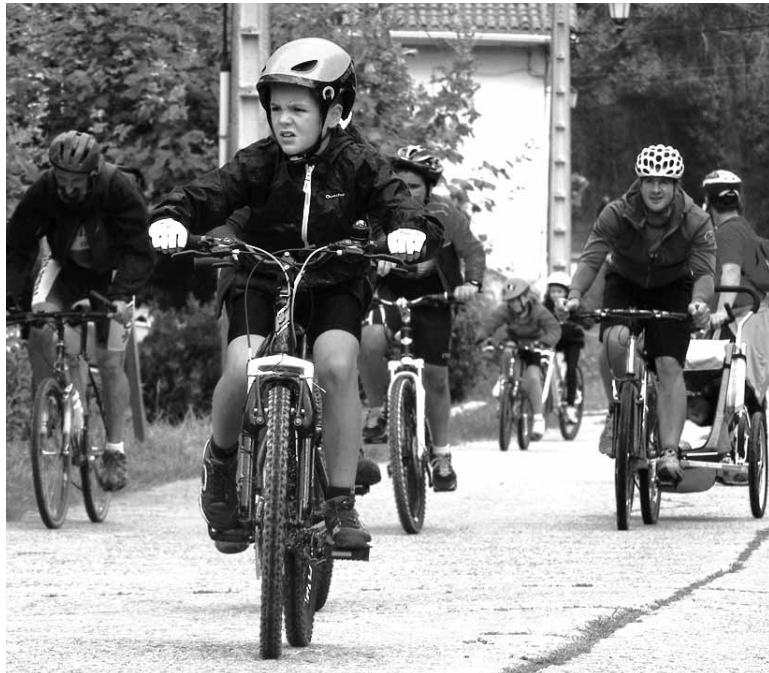
Txikiak, gazteak, helduak, jai berriak... denondako tokia dago Bizikleta Egunean.

Ziorditik abiatuko da martxa, goizeko 9:00etan. Pistetatik ibiliko dira gehienbat, eta Lakuntzan geratuko dira atsedean hartzera. Bokata norberak eraman behar-