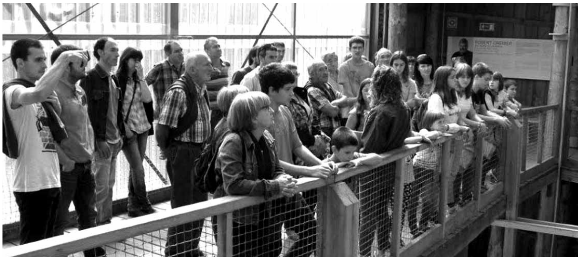
Arbazuarrek itsas faktorian, baleontzia nola ari diren egiten begira.