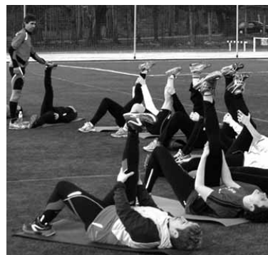
Emakumeendako Atletismo Eskola.