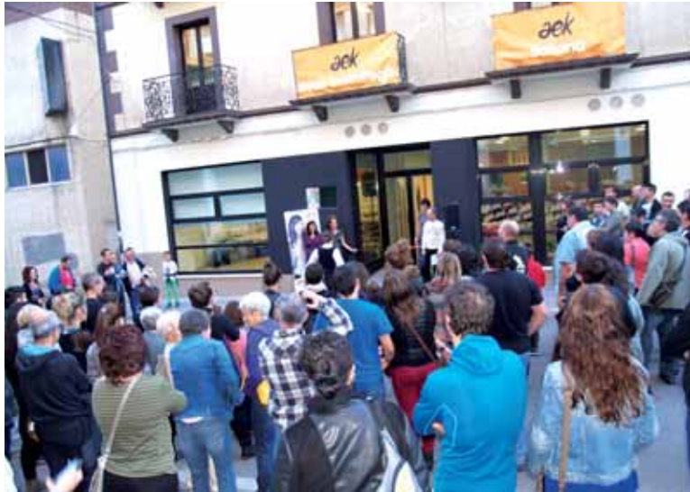
Elkartutako jendea dantzariari begira, mustutze ekitaldiaren hasieran. Zinta moztu eta gero euskaltegi berriua eta handitua bertatik bertara ezagutu zuten.