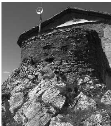
Trinitate ermita eta antena.