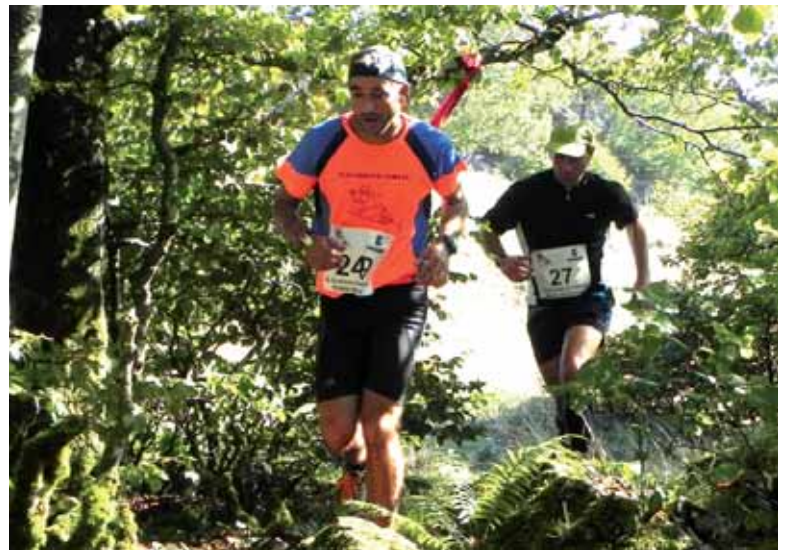
Korrikalariak Urbasako paraje zoragarrietatik barna ibiliko dira.

Momentuz 120 korrikalari daude izena emanda probarako, aurreko urtean baino dezente gutxiago.