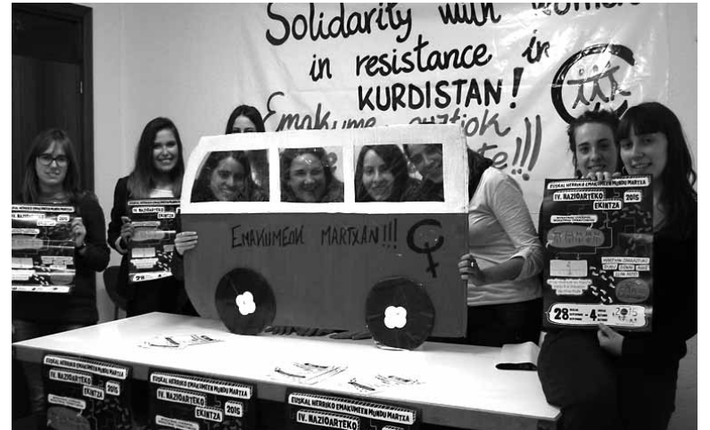
Mugimendu feministako kideak martxaren etorrera iragartzen.

Haziak dira martxaren ikurra, elikadura-buru jabetzaren aldeko borroka gogoan. Martxa pasa