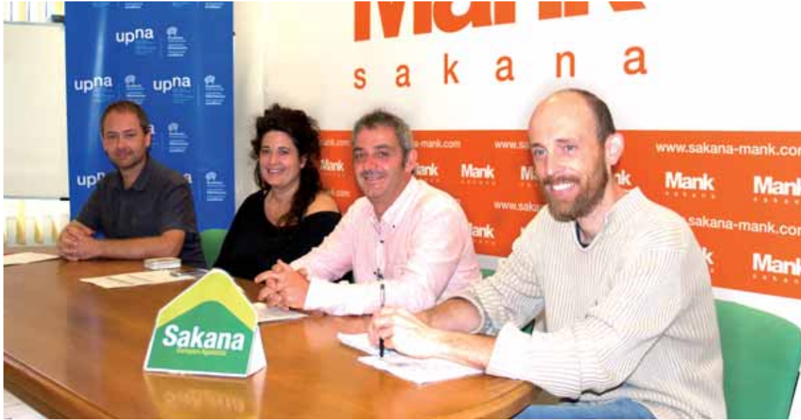
Jakinarazi zutenez, ikastaroak jakinmina sortu du eta Galiziatik 50 pertsona etorriko dira.