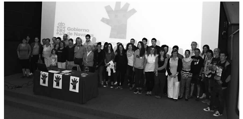
Kanpainako bideoan altsasuar ugariak parte hartzen dute.