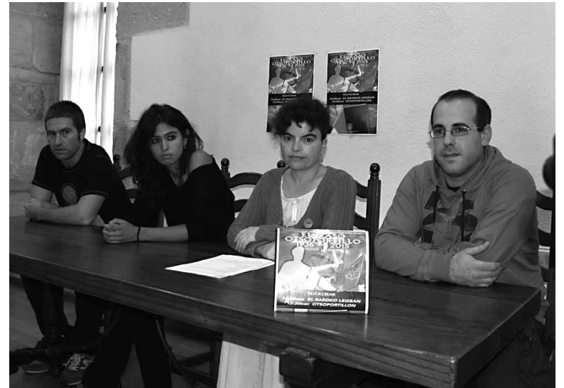
Igandean Urbasako ekitaldiak gerturatzeko deia egin dute antolatzaileek.