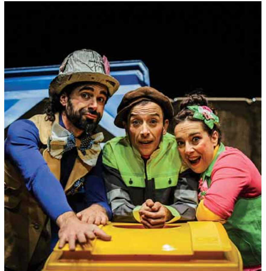
Konpost-eroak, irailaren 8an, 17:30ean Altsasuko Iortia kultur gunean, dohainik.

Festetako kartel erakusketa. Irailaren 10era arte, astegunetan 10:00etatik 14:00etara Altsasuko Iortia kultur gunean.