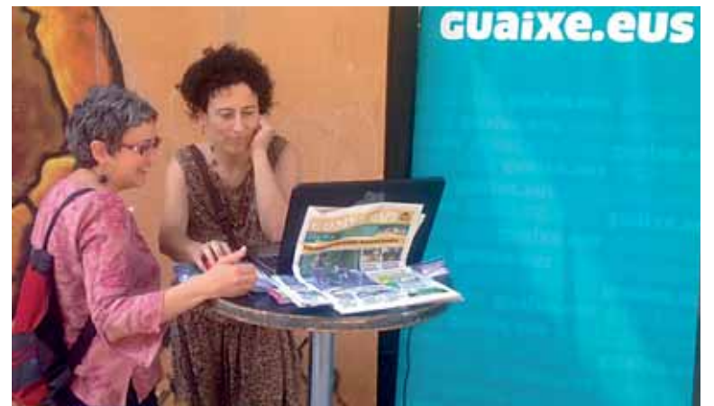
Altsasuko azokan, komunitateko kide nola egin azaltzen.

Komunitatea zer den eta kide nola egin azaltzeko Bierrik fundazioko langileak garileko azken hiru asteazkenetan Altsasuko azokan