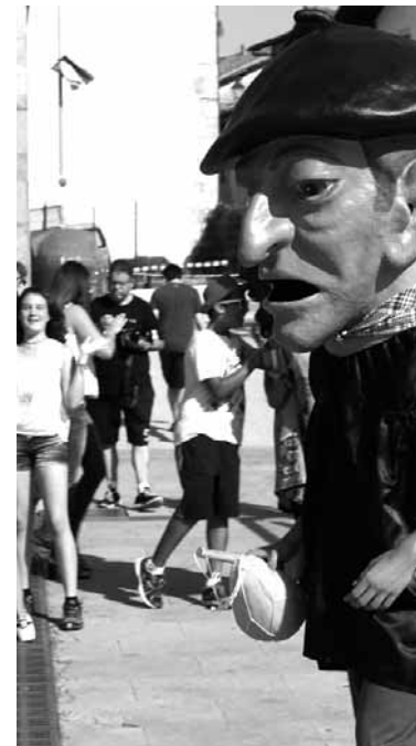
Korrikaldi bat baino gehiago egin zuen.