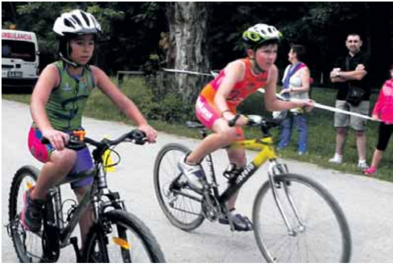
Urriztiko, San Pedroko eta Sarabeko paraje ederretan barna ibiliko dira.