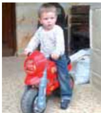
Ibon ZORIONAK gure bihurri hori!!! Mila muxu denon partetik.