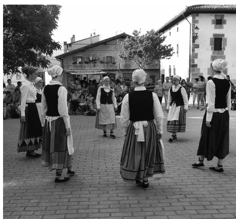
Etxajuaren ondoren Iturmendiko dantzariak saioa eskaini zuten.

Santa Marina eguna. 10:00etan Baselizara abiatzea. 12:00etan Meza baselizan. Erromeria