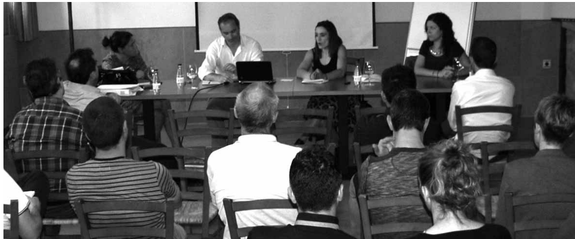
Sakanako Enpresarien Elkarteak 2014 langabetuei zuzendutako 8 ikastaroetan 141 pertsona aritu ziren.

Zerbitzuaren helburu nagusia Sakanako bizilagunen enplegua hobetzea da. Horretarako orientazio eta bitartekaritza zerbitzua eskainiko du SEE-k; hara jotzen