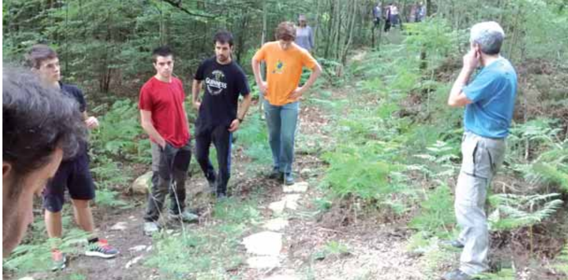
Larunbatean Iturmendin aritu ziren auzolanean.

Arbizurekin elkartu gara Bernoako galtzadaz gehiago jakite-