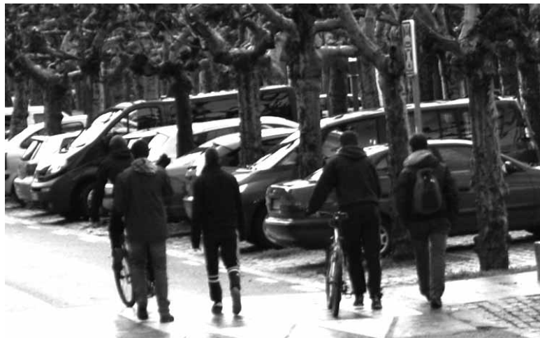
Gazte koadrila Etxarri Aranatzan.

Kontratuaren prezioa 16.400 eurokoa izanen da bi urterako, BEZ barne. Kopuru hori gainditzen duten proposamen ekonomikoak baztertuak izanen dira. Kontratuaren hartzaileak aurten 6.900 euro jasoko ditu eta gainontzeko 9.500 euroak heldu den urtean. Interesa dutenek euren proposamenak Sakanako Mankomunitateko Lakuntzako egoitzan irailaren 11ra arte aurkeztu ditzakete.