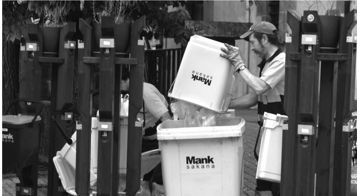
Mankomunitateko hondakin zerbitzuko langileak bilketa lanean.

Enpresa berak jakinarazi zuenez, ontzi arinetan (plastikozko ontziak, latak eta brikak), 2014an, nafar bakoitzak 19,4 kilo sartu zuen batez