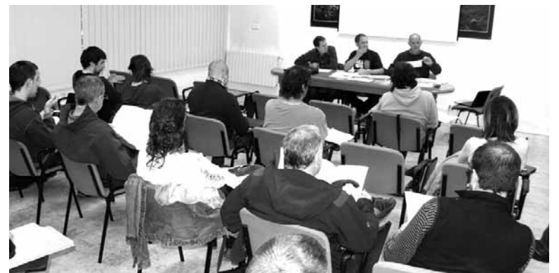
Ostegunean agurtuko dira karguaz aurreko batzarkideak.

Plantilla organikoan ere aldatu onartuko dituzte batzarkideak. Hondakin teknikari lanpostua sortuko da eta bere egitekoa hondakin alor guztia kudeatzea izanen da. Orain arte Mank-ek hiru hezitzaile ditu.