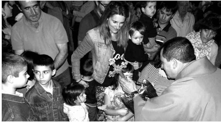
Haurrak Aralarko aingerua gurtuko dute igandean. ARTXIBOA

lotura sustatzeko egiten da ekitaldia. Aingeruaren haurrendako bizi guztirako babesa eskatuko dute. Etzi izan eta aingeruaren irudia gurtu ondoren pergamino bana jasoko dute haurrek. Aurretik izena emandakoek bai jasoko dute. Gainontzekoek Aralarko santutegian izanen dute agorrilaren 2tik aurrera.