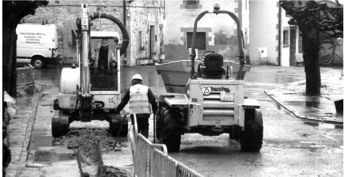
Iturmendin, atzera ere, gas sarea zabaltzeko lanak egiten ari dira.