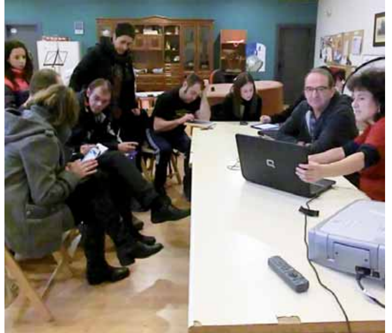
Edozein, eta edozein gailurekin, erraz asko egin daiteke omunitateko kide.

Sakandar euskaldunok, euskaraz bizi garenok, bizi nahi dugunok euskarazko komunikabideak behar ditugu: gure berri izan eta zabaltzeko; gure existentzia, bizitasuna, bizinahia, bizipenak eta bizipozak konpartitzeko; komunikatuta bizi eta komunitate izateko. Sakanako euskardunen komunitatea trinkotu, saretu eta indartzeko tresna Guaixe.eus eta bere Komunitatea. Gure hizkuntzan bizitzeko espazioa eta unea eskaintzen du.