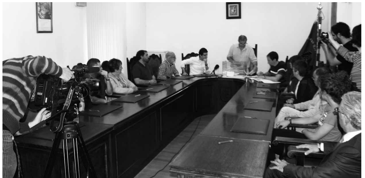
Altsasuko Udala osatzeko bilkurako une bat.