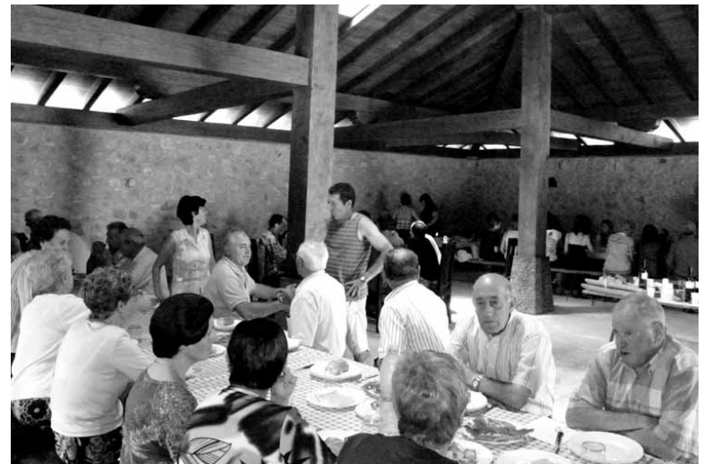
Basabeko borda mustu zenekoa.

Irintarreuren erromerialdia urtero Aralarko santutegian ixten dute, agorriko lehen igandean. Hau da, abuztuaren 2an. Meza izanen da eta ondoren aterpean bazkaltzera geldituko dira.