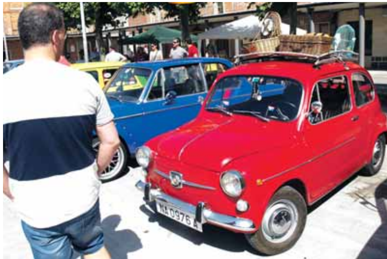
Seat 600 gorriak begirada asko erakarri zituen.

neak, R5ak, Golfak, BMWak, Seat 124ak, Seat 600ak, deportiboak, gerrako kamioi bat eta beste hainbat ibilgailu ikusteko aukera izan