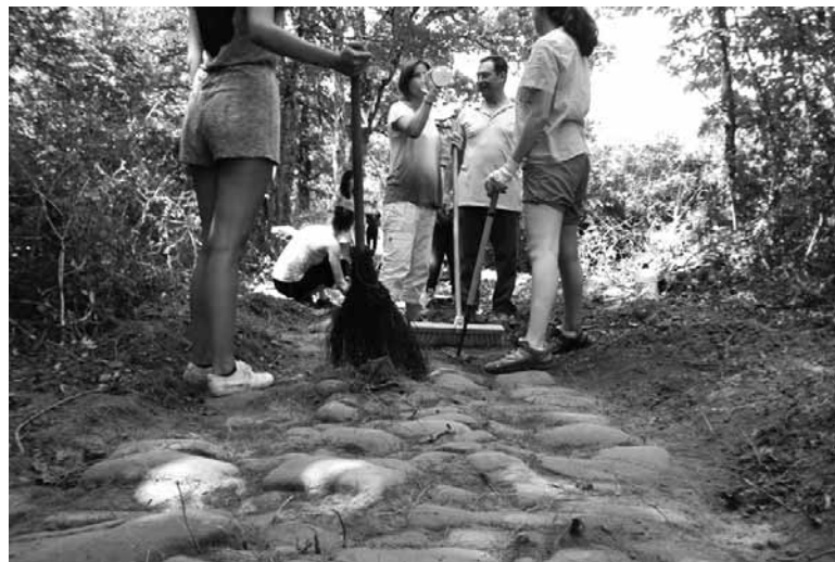
Ekinez galtzada agerian uzten ari dira Etxarri eta Urdiain artean.

Dozena erdi etxarriar, iturmendiarra eta atzerritik auzolandegira etorritako 11 emakumeak elkarrekin lanean aritu ziren larunbatean. Lehenak Etxarri Aranazko Udalak egindako auzolan deialdiari erantzunez joan ziren. Bigarrenak bi aste emanen dute eginkizun horretan. Etxarri aritu ondoren, Bakaikun, Iturmendin eta Urdiainen aritu dira lanean. Bi egun eta erdi bakoitzean.