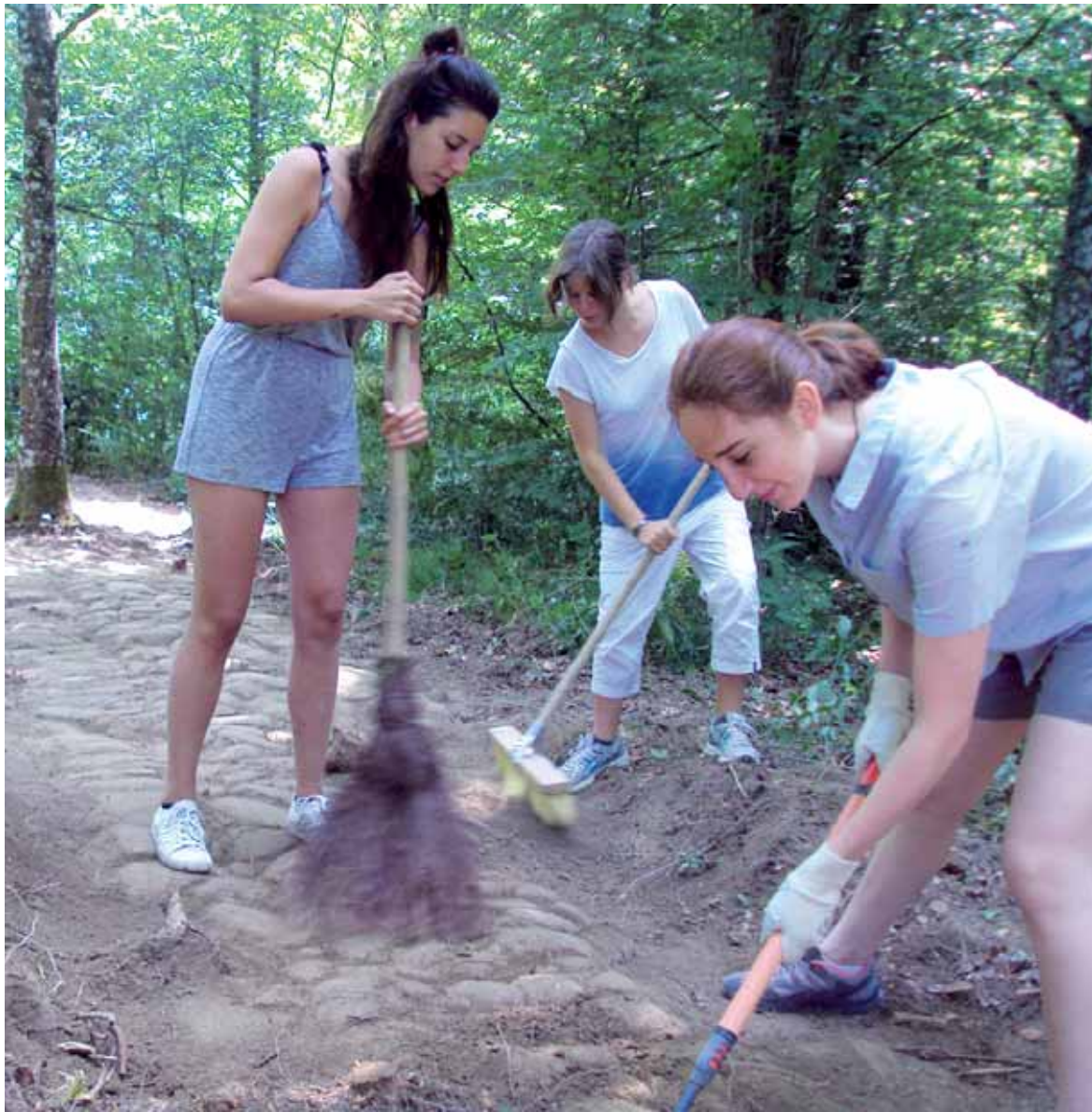
Auzolandegira etorritako batzuk galtzada agerian uzteko lanean.