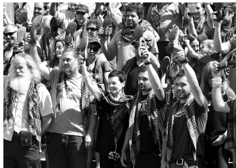
Askapenako auzipetuak eta kideak Herriak Libre dinamika aurkezten.