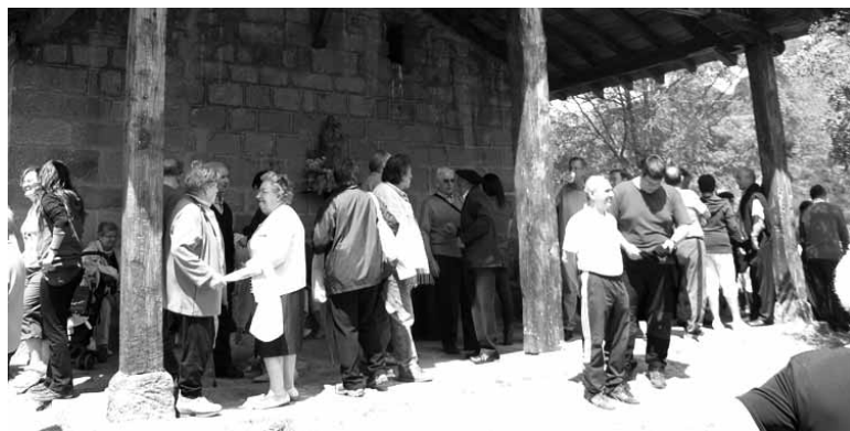
Erkudengo ermitako aterpean ama birjiniaren irudia eta altsasuarrak.

Ermita txiki batean altsasuarrak duten igurari ona da Erkudengo Ama. Haren irudia urte guztian egoten da ermitan, baina hilaren 2an herrira, elizara ekarri zuten. Orduz geroztik, egunero, 20:00etan mezan bederatzurrena egin da. Hura bukatzearekin batera, Erkudengo Amaren irudiak bere etxera buelta eginen du.