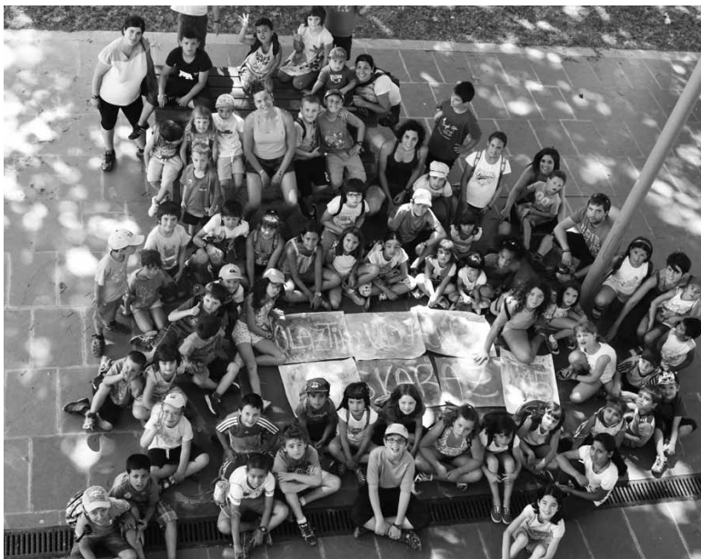
Udan Euskarazko parte-hatzaileak.

Udako euskarazko aisialdi programaren eskaintza egin du Olatzagutiko Udalak. 5 eta 12 urte bitarteko 88 haur parte hartzen ari dira. Zortzi taldetan daude banatuta, D ereduko bost eta B ereduko 3. Haie-taz bederatzita begirale arduratzen dira. San Juan bezperan hasi zen Udan Euskaraz programa eta garilaren 17ra arte luzatuko da.