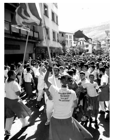
Altsasuarrak festak hasi berritan.

Horregatik, herri mugimenduko kolektiboek elkarlanean aritzeko deia luzatu dute. Elkarlana bideratzeko "modu eraginkorrena batzar irekia antolatzea" dela uste dute, eta, horregatik, herri mugimendutik heldu den ostegunean, 19:00etan, eginen den asanbladan parte hartzera deitu dute.