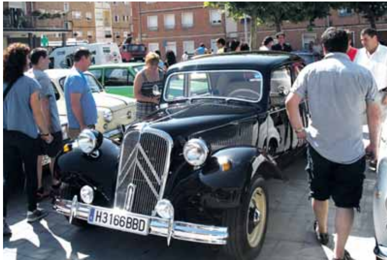
Etxe askotako autoak eta motorrak ikusteko aukera izan zen Altsasun.

Goizeko 10:00etatik 13:00etara Citroën historikoak, Renault Alpi-