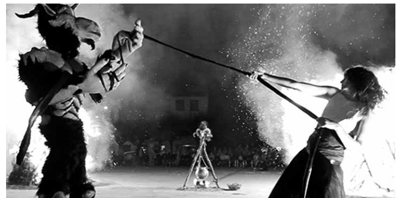
ITBren garagarzaroko erreposoan ikus daitekeen irudietako bat.

Maiatzeko Irurtzun Telebista (ITB) erreposoa kirolez bete aitorri bazen, garagarzaroko udari eskainia da. Igerilekuen sasoi berriaren berri ematearekin batera San Joan bezperan suaren inguruan, plazan, sorginek egindako akelarrearen irudi ikusgarriek osatzen dute ITBren azken emanaldia, www.irurtzuneuskaraz.com web orrian ikusgai dagoena.