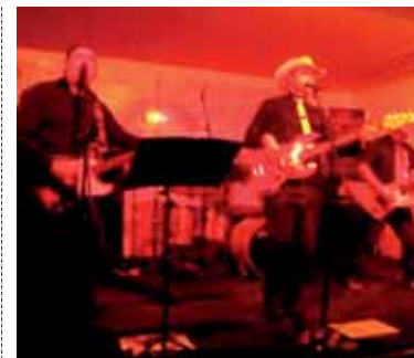
batzarra. Herri mugimendua.

Festak herritik herriarendako. Garilaren 16an, ostegunean, 19:00etan Altsasuko Gure Etxea eraikinean