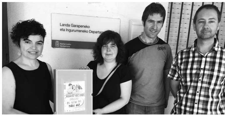
Osasungintza Euskaraz taldeko kideetako batzuk aurkeztu zituzten sinadurak.

Etxarri Aranazko osasun etxeko zerbitzua eta Emakumeen Arreta Zerbitzua euskalduntzeko 600 sakandarren sinadurak jaso zituzten udaberri bukaeran. Hainbat eragile jasotzen dituen Osasungintza Euskaraz taldeak sustatzu zuen bilketa. Sakandarrek haien bidez hiru eskaera zehatz egin dizkiote foru administrazio-