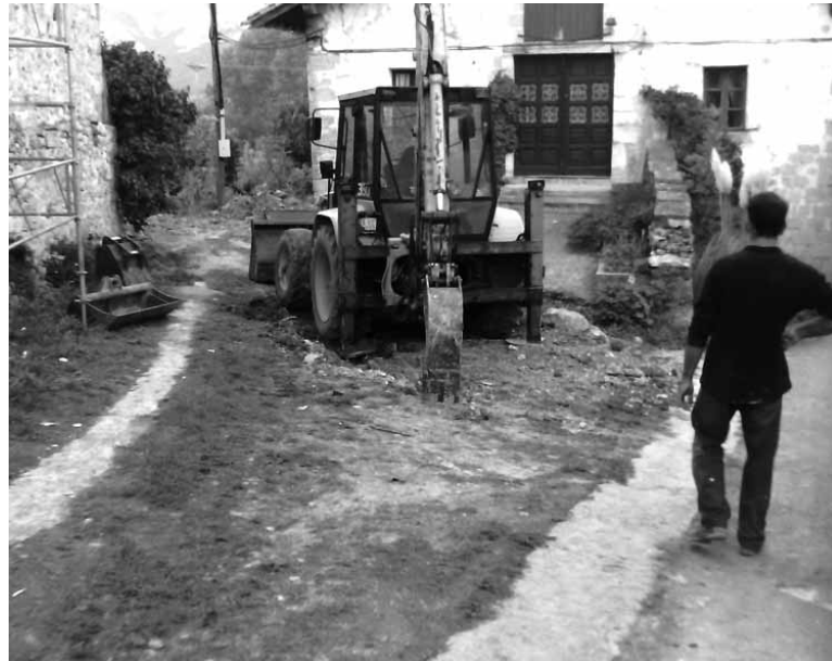
Aurreko urtean bezala aurten ere palarekin hainbat lan egingen dira.

Bestalde, bilan ematea aurreikusen du Arakilgo Udalak. Deialdi mugatu bidez egingen du bost bat enpresari aurrekontua eskatuz eta eskaintzen artean egokiena hartzeko asmoz. Lehen lana aurri egoeran dagoen Etxarrengo Paskal etxean egingen da. Teilatua erdi eroria du eta gelditzen dena kendu eta eraikina egonkortzeko