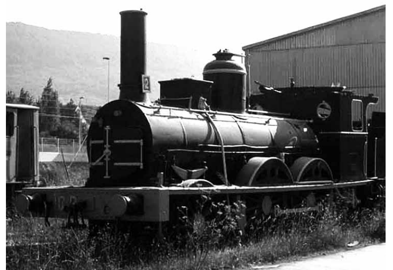
Porlandegian dagoen lokomotorak Iruñeko Kosterapean bukatuko du.

34.430 kilo pisatzen ditu hutsik eta 49.680 kilo zerbitzuan dagoenean. 14 metro luze ditu eta 3.500 kilo ikatzerako gaitasuna du.