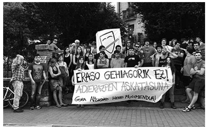
Herri mugimenduko kideak adierazpen askatasuna aldarrikatzen. TOPATU.INFO

Herri mugimenduko kideek agerraldia egin zuten ostiralean eta adierazi zuten "gertaera hauen atzean zehatz-mehatz nor dagoen ez jakin arren, guztiz argi daukagu indar errepresiboen esku hartzea tartean egon dela. Argi gelditu da herri honetako aldarriak isilarazi nahi dituztela herri mugimenduaren aurka joz". Agerraldian adierazi zuten, "ez dugu gure jarduna gertatu eta kaleak aldarrikapenez