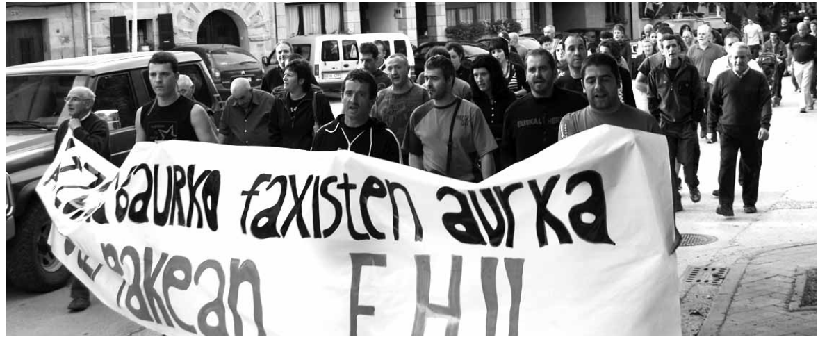
2009ko irailean gertatutakoa salatzen manifestazioa egin zen Arbizun.

Epaiketa duela hilabete bategin beharzen. Baina epaituetakobaten prokuradoreak auto istripua izan zuen maiatzean eta zauriak sendatu bitartean epaiketan ezin zenez egon, hura atzeratzea onartu zuen Fernando Grande Marlaskak.