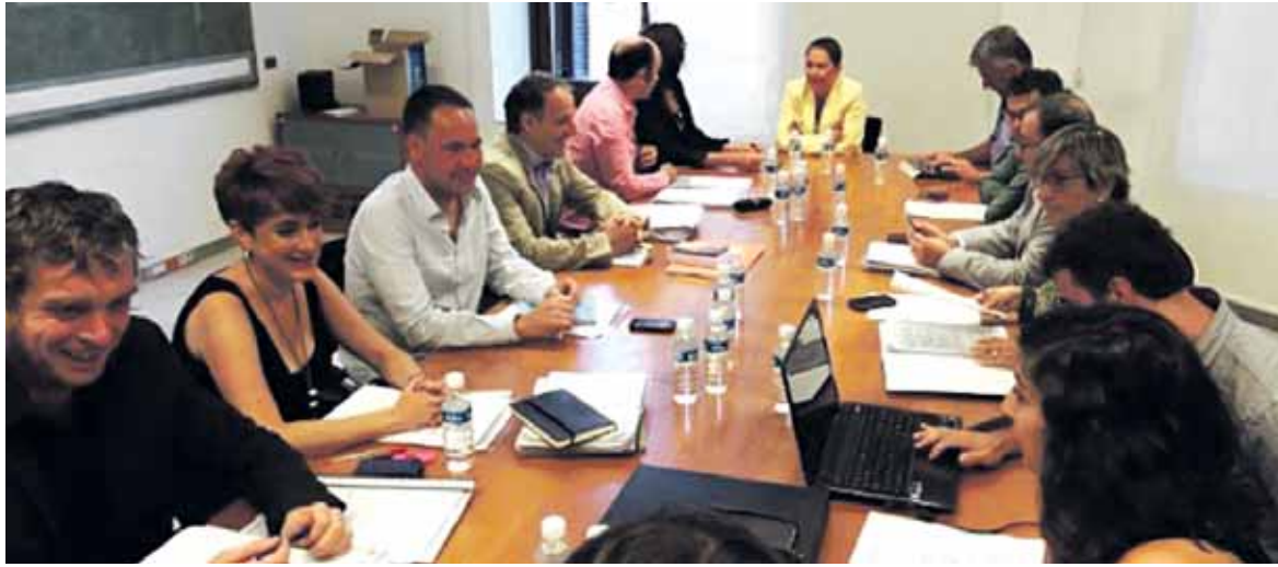
Gobernu berria osatzeko Geroa Baik, Bilduk, Podemos-Ahal Duguk eta Izquierda-Ezkerrak egindako bileretako bat.

ko Cederna-Garalur moduko egiturak sendotzea aurreikusten du gobernu akordioak. Sakana ukitzen duten azpiegitura zenbait egitasmo aipatzen dira lau alderdien arteko akordioan. Batetik, tren garraioari dagokionez, Nafarroa Mediterraneo-Atlantikoa ardatzetik kanpo ez gelditzea erabaki dute, horretarako "nazioarteko estandarrekin bateragarria den konponbidea emateko" lan egingen du gobernu berriak.