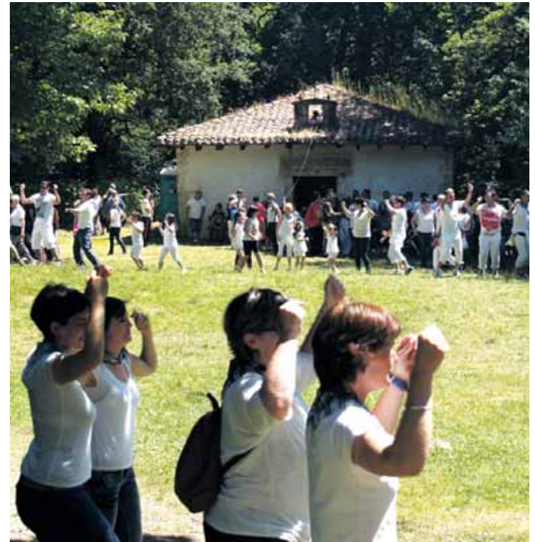
Bero izugarriari aurre eginez, zortzikoek ez zuten huts egin San Pedron.