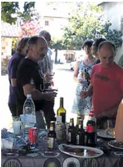
Auzate ederrak izaten dira festetan.