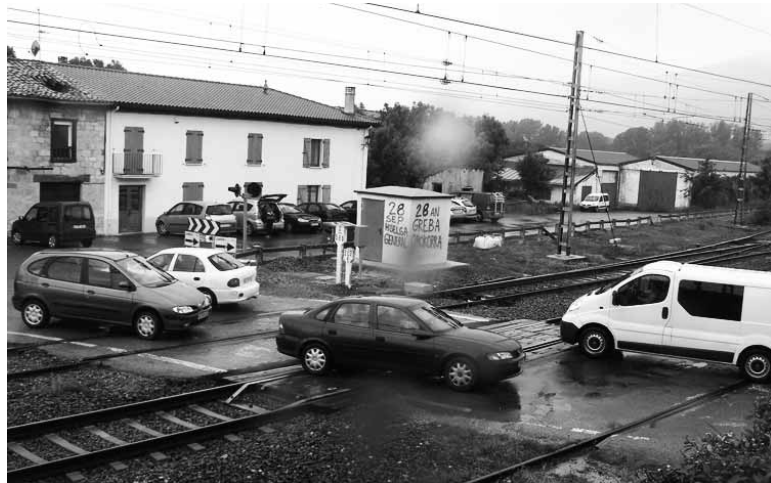
Urte bat barru trafikoak ez du trenbide-pasabidea erabili beharko.

NA-7010 errepideko 21,580 kilometroan dago Izurdiagako trenbide-pasagunea. Hura kentzeko lanak 21,750 kilometroan hasiko dira, San Juan auzora iritsi aurretik, errepide-zati berria hasten den lekuan eta, guztira, 1.234 metroko luzera edukiko du, 3,50 metroko zabalerakobierreko galtzada eta 0,50 metroko bazterbide-