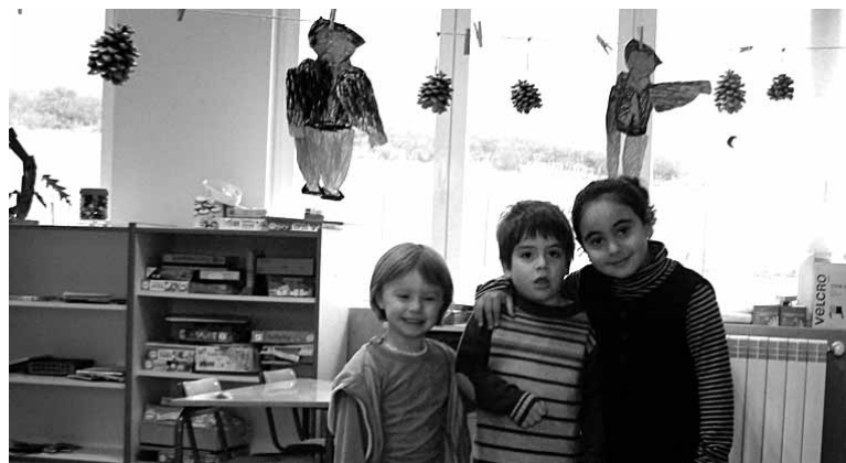
Eskola berrian ikasi duten hiru ikasle.

ireki, ohorezko aureskua dantzatu eta trikitiaren doinuek alaitu zuten ekitaldia. Nicolas Arbizuk emandako azalpen eta argazki zaharren bitartez, herriko eskolari buruzko ibilbide historikoa egin zuten bertaratutakoek. Ondoren udal ordezkariak prestatuko paella eta entsalada dastatu zuten eskolako aterpean. Eskolako irakasle, ikasle, ikasle ohi, guraso, herritar eta udal agintariak, 80 lagun elkartu ziren bazkarian.