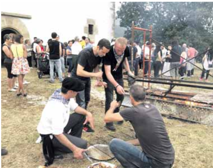
San Pedroko erromerian bapo meriendatu zuten arruazuarrek.