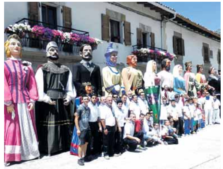
15. urteurrena ospatu zuten Uharteko konpartsak. N. MAZKIARAN