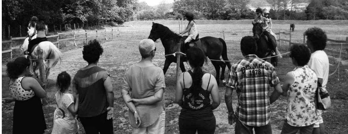
Bidelagun elkarteak kideetako batzuk Urdiaingo Errotainen eskaintza ezagutu zuten.

Bestetik, uda ondoren Bidelagun elkarteak kideendako prestakuntza saioak izanen dira. Alde