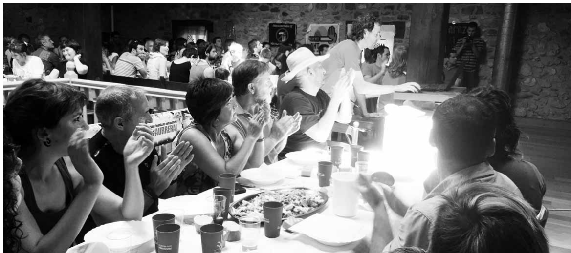
Elkartasun bazkariaren aurretik bideo emanaldia izan zen.

Auzibidearen atzean erabaki politikoa ikusi dute Askapenako bost kideek. "Estatuak bere erabakiak bere bitartekoan bidez gauzatu zituen eta horietako bat auzitegi berezi bat da, Euskal Herriaren kontra eraikia dagoena". Horregatik, ez dute espero "justizian oinarritutako kolpe bat, baikik eta oinarri politikoa dituen kolpe bat". Espero duten bakarra absolutioa da, "ez dugulako bes-