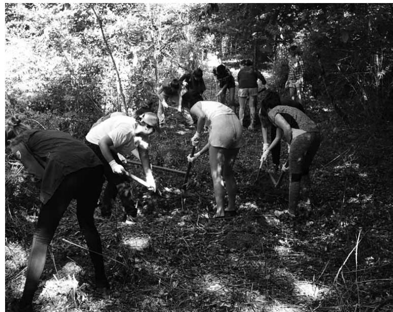
Lurraren eta orbelen azpian galtzada azaleratu dute.