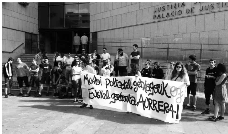
Epaiaren aurretik Donostiako auzitegian kontzentrazioa egin zuten.

Kontzentrazioa despedituta auzitegira sartu ziren. 10:40rako aurreikusia zegoen epaiketa eta 13:00ak aldera hasi eta 15:40ak aldera despeditu zen. Altsasua-