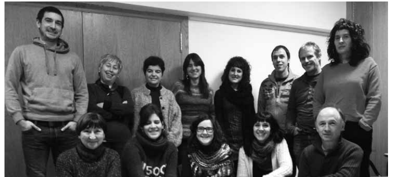
Bilgunearen aurreko bilera batean elkartutako sakandarrak.

Bigarren bilera Otsailaren 21ean elkartu zen SEB