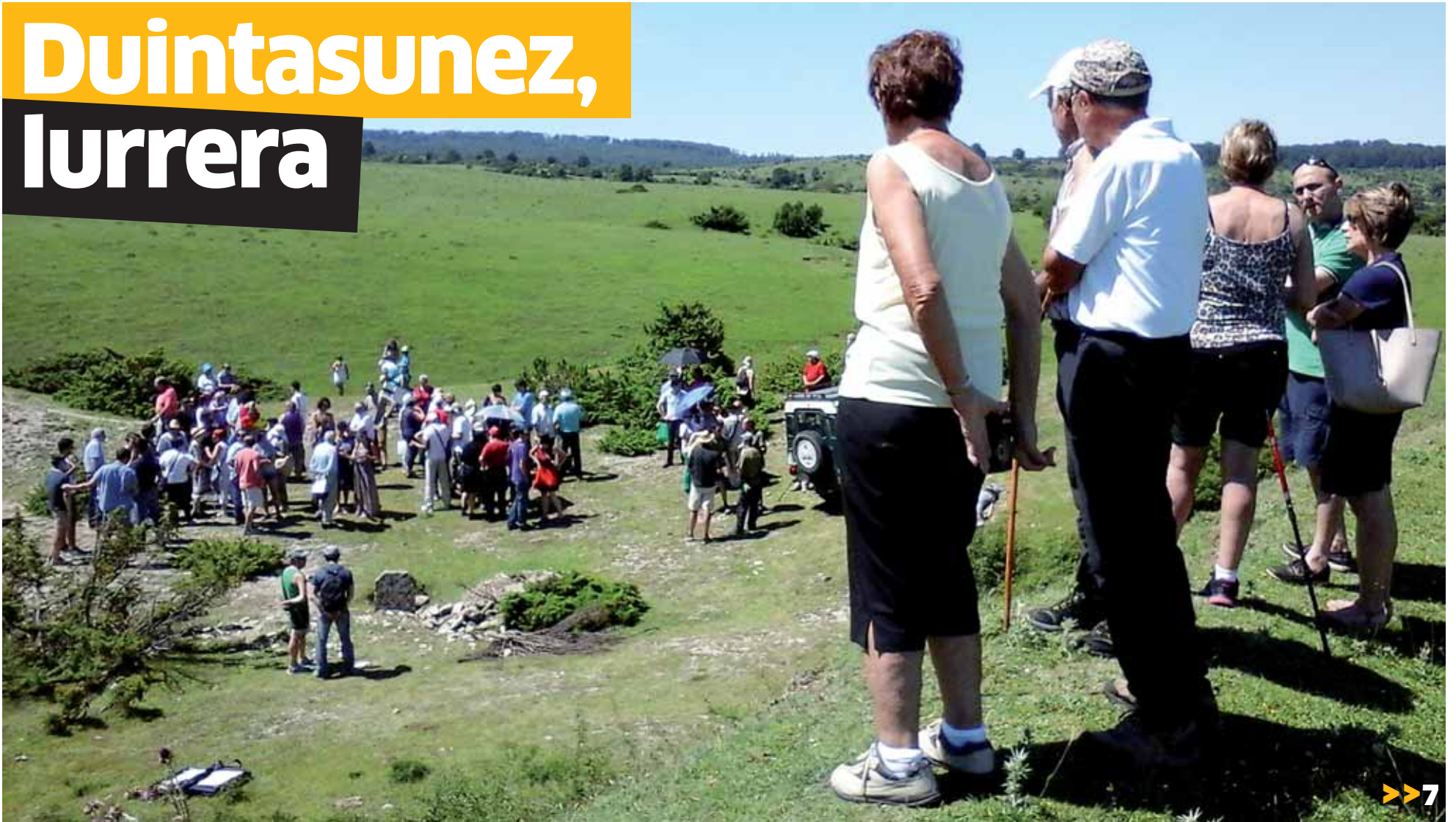
Urbasako saroiko lezean eraildakoen senideak eta ikerketan lagundu zutenak elkartu ziren igandean.