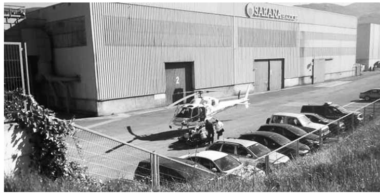
Hain larria izan ez zen istripu baterako ere helikopteroa bidali zuten.

Hildakoa 15 metroko altueratik erori zen, buruan eta gorputzean kolpe handiak hartuz. Etxarri Aranzko zaintzako mediku taldeak ezin izan zuen ezer egin. Larrial-