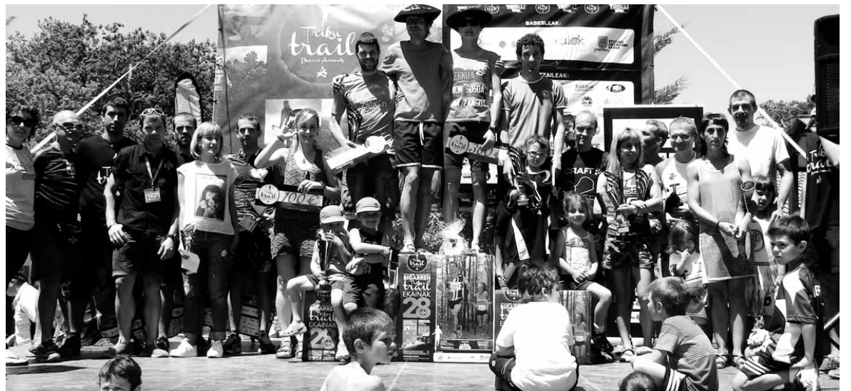
Korrikalariak probaren edertasuna nabarmendu zuten. Argazkian, bukaerako podiuma.