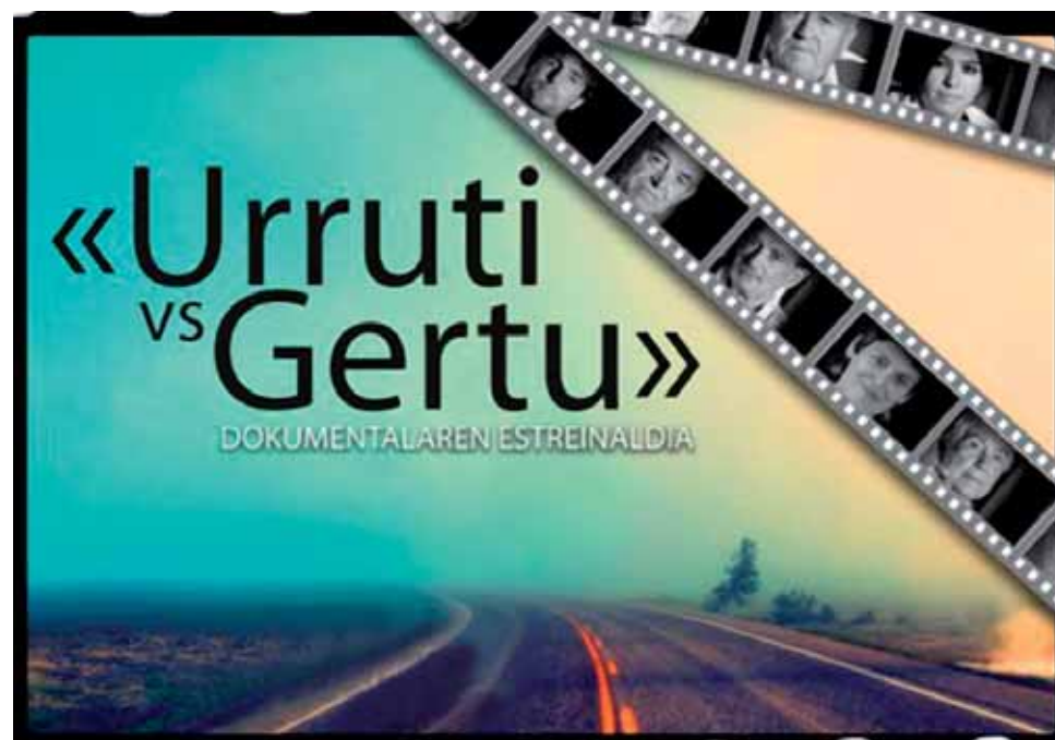
Gaur, 19:00etan Altsasuko Iortia kultur gunean.

Dispertsio politika. Garagarriaren 19an, ostiralean, 19:00etan Altsasuko Iortia kultur gunean. Hizlariak: Etxerat, Jaiki Hadi eta Mirentxin gidariak. Aurretik dokumentala. Sare.