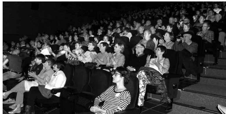
Altsasu Memoriak, atzera ere, Iortia kultur gunea bete zuen.

Larunbatean Altsasu Memoria ekimenak Altsasuko errebaso historikoaren bigarren fasea aurkeztu zuen, 1950etik 1992ra bitarteko garaia barnebiltzen duena. Ekitaldia jendez mukurru bete zen Iortia areto handian ospatu zen. Emanaldiaren lehen zatian 1950etik Frankismoaren amaierara bitarteko urteak hartu ziren hizpide, besteak beste, FASAKo grebari, euskal folkloreaken jazarpenari, euskal sindikatuen sorrerari eta ikurrinen agerpenari aipamen eginez; bigarren zatian, bere aldetik, bertaratutakoei post-frankismoko egoeraren berri eman zitzaizkien, herrian gerra zikinak eta polizia-gehiegikeriek utzita-