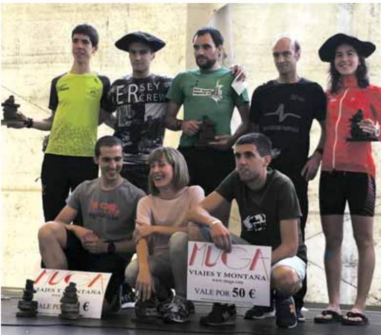
Lakuntza-Aralarreko podiuma, txapeldunak eta lehen sakandarrak artean.