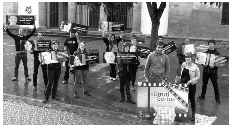
Altsasuarrak gaurko dokumental emanaldira gonbidatu dituzte.

Altsasuko Sarek euskal preso politikoek bizi duten sakabanaketa politika salatuz ekitaldia eginen du gaur arratsaldean. Iortia kultur gunean Sakanako presoen senideen lekukotzak jasotzen dituen Urruti vs Gertu dokumentala emanen du kultur gunean. Hango ezkaratzean izen bereko erakusketa ikusgai izanen da eta, bukatzeko, Etxerat presoen senideen elkarterko, presoen osasunaz arduratzen den Jaiki Hadi elkarterko eta senideak espetxeetara furgonetetan eramaten dituzte Mirentxin gida-