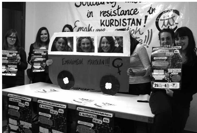
Mundu Martxako antolakuntza parte hartzeko gonbitea luzatu dute.

Martxa iritsi aurretik irailean lan handia eginen dela iragarri dute. Herrietan Emakumeen Mundu Martxaren berri ematen duen