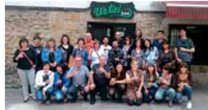
Urtzi taberna Zorionaaaaaaak zure urtebetetzeaaaaaaan, zorionaaaaaaak ta urte askotarakooooo. 25 urte eta aurrera cava eta gusanitoen etxeak! Noizko Chicote Urtzin? Tarariririri, Gora San Fermin! eta Lixarrengo independente!