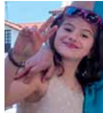
Iraia ZORIONAK potxola!! 9 urte ze zaharra!! Muxu asko zure familiaren partez.