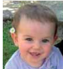
Haizea Zorionak Haizea. Musu handi-handi bat Egilazko eta Altsasuko familien partetik. Mila kilo zorion zure urtebetetzean.