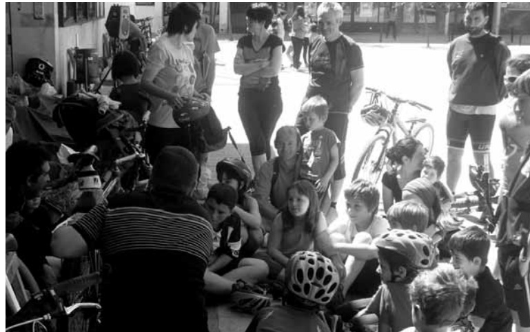
Bizikleta konpontzeko tailerra adi adi jarraitu zuten.

Mank-etik balorazio positibo a egin dute. "Egun ederra, alaia eta osasuntsua izan zen igandean bizikleta ibilbidearekin hasi eta Iortia plazan auzate ederrarekin bukatu zena" adierazi dute. Goizeko 9:30ean ekin zioten bizikleta ibilbideari. Otadiako Santokristo, San Pedro, Erkuden eta San Juan baselizen ondotik pasatu zen ibilbidea, Barranka Txirrindulari taldeko kideak gidatuta. Hura bukatuta, partaideen artean Berri Bikes den-