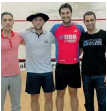
Arbizuko txapelketako finalista.