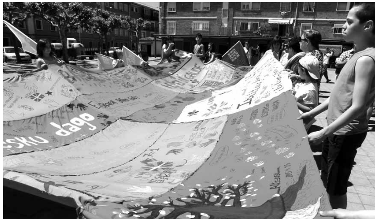
Goian, Lakuntzako jostunak lana erakusten. Behean, altsasuarren lana. Eskubian, Irurtzungo salmenta postua.

Hilaren 21ean Euskal Herriko bost hiriburutan oihalezko hautestontzi erraldoiak sortzera deitu du Gure Esku Dago. Dinamikako kideek adierazi dutenez, hautestontzi erraldoi horiek erabakitze eskubidea gauzatzeko borondatea irudikatuko du. Iruñeako hautestontzia