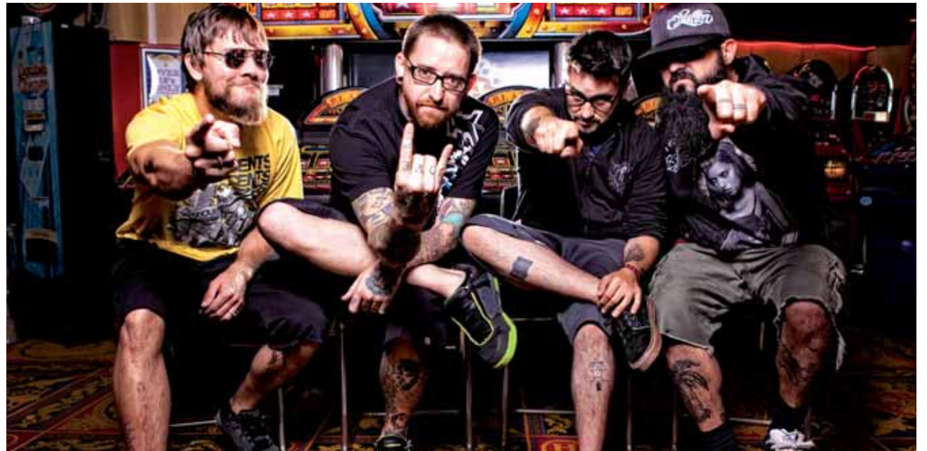
Authority Zero eta Lion Head arituko dira gaur 23:00etatik aurrera Altsasuko gaztetxean.

Finalista San Adrianen. Garagarriaren 7an, igandean, Etxarri Aranazko. Udaberri eta Larrañeta mendi taldeak.