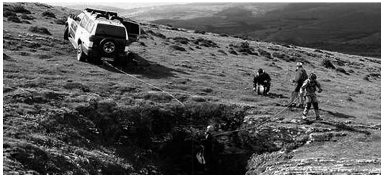
Guardia Zibilak Andiaiko lezera jaisten. UTZITAKOIA

Espeleologo batek gaztigatu ondoren, Guardia Zibilak Lizarragako portu ondoko leze batetik artilleriako jaurtigai zatiak, mortero