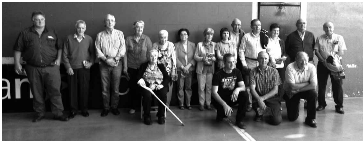
Ondarearen bilketarako elkarrizketatutako guztiek ezin izan zuten larunbateko aurkezpenegon.

Larunbatean 200 bat uhartere elkartziren Larrabieta frontoian. Oraingoan frontisak Uharte Arakili buruzko testigantzak jaso zituen. 21 uhartere aurreko mendeko bizimoduez eta ohiturez hizketan grabatutakoaren lagin bat eman baitzuen jendaurrean udalak eta Labrit