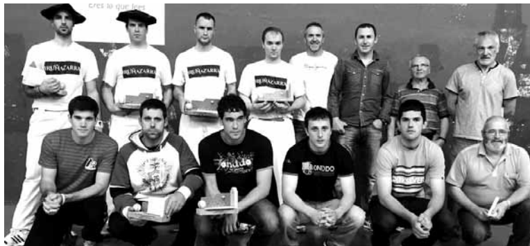
Irurtzungo Pilota Txapelketako finalistak eta gonbidatuak sari ematen.

Baiza Parapente Taldearen informazio guztia eta eurekin harremanetan jartzeko aukera.