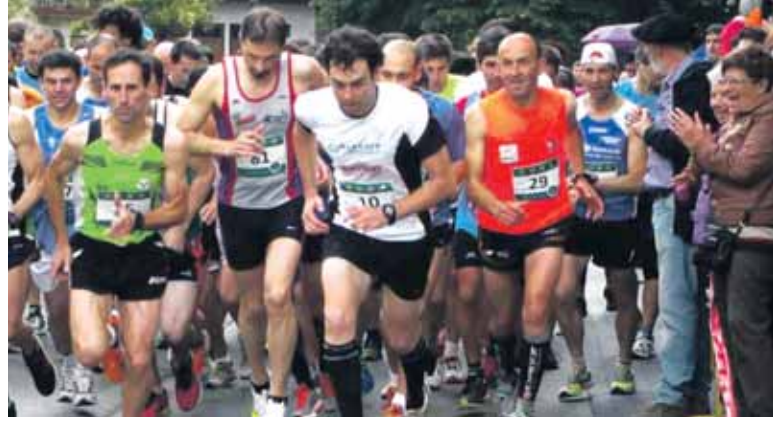
Aurreko urteko lasterketan 110 korrikalari aritu ziren proba nagusian.

Ziordiko lasterketan izena emateko aurretik www.dantzalekuskana.com webgunera jo behar da. Bestela, egunean bertan eman ahaliko da izena, goizeko 10:00etatik 11:00etara, Ziordiko elkartean. Izena ematea dohainik da, baina