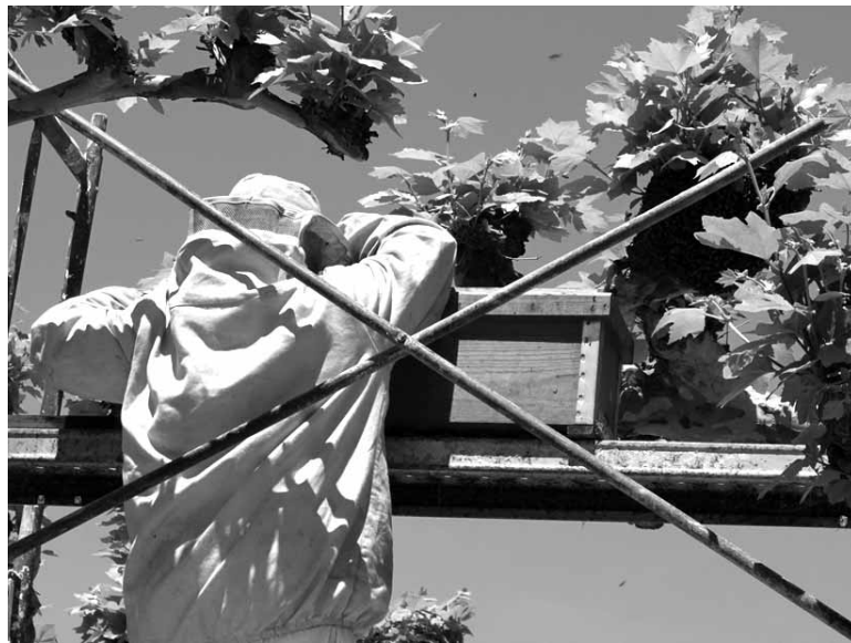
Erleziaina aldami gainean erlauntza kentzeko lanean.