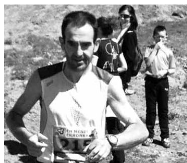
Beraza EH Mendi Erronkan. UTZITAKOIA