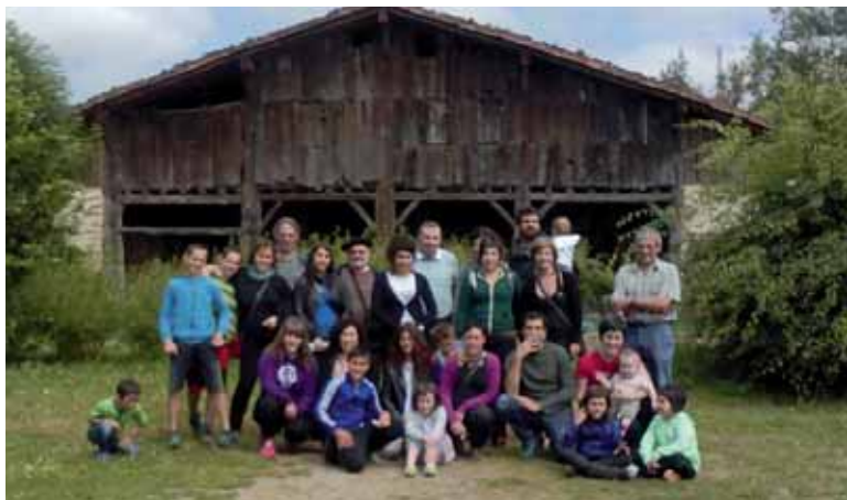
Mintzakideak Igartubeiti baserrira txangoan. UTZITAKOIA