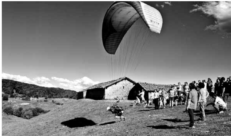
Parapentea Santa Marinatik abiatzen.

siko ditugu hegan. Iturmendin lokala zabalduko dute egun guztian barna, mokaduren bat hartzeko, eta euren zaletasun handiengan murgilduko dira: hegan.