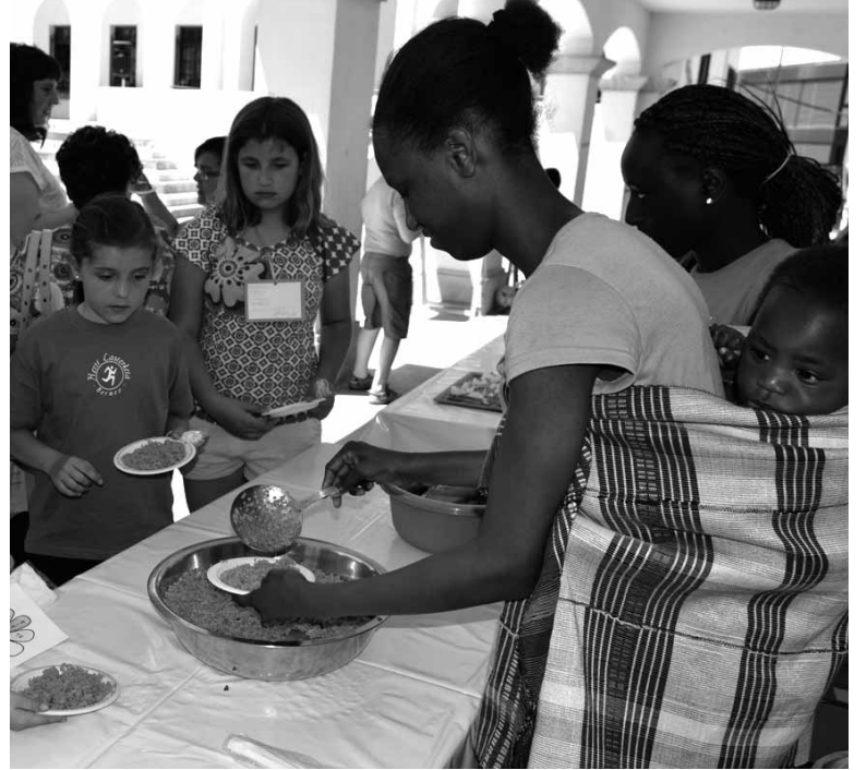
Errezetak ikasi eta haiek probatzeko aukera izanen da bihar Irurtzunen.