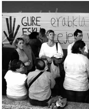
Irurtzungo salmenta postua.

11:00etan Jostunak dokumentala Auzogelan. 14:00etan bazkaria eta kantaldia. 17:00etan Jostea.