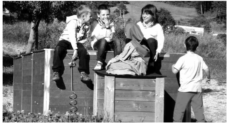
Irurtzungo auzo konpostagailua haurren jolastoki.

Mank-etik jakinarazi digutenez Arakil, Irañeta, Arruazu eta Ergoienan aurrerago egingen dute konpost uztaren banaketa. Daten berri auzokongostagailuak jarritako oharren bidez zehaztuko dute Mank-eko langileek.