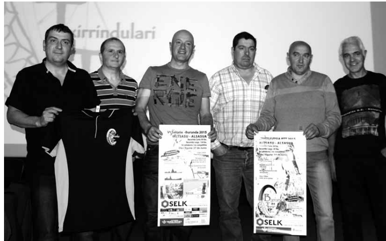
Barranka taldeko kideetako batzuk.

Ezkurdiak salatu zuen leitzarrak bere bost atsedendialdiak agortu eta gero bi minutu pasa erretiratu zela aldageletara, eta inork ez zuela ezeresan. Epaileei autoritate eska-