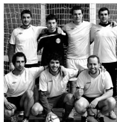
Hijos de Perlak Bunker estutu zuen.

ostiralean, 20:00etan, Uharteko Arakilgo pilotalekuan. Ligako finala ere bi talde hauek jokatu zuten eta Racingek lortu zuen gailentzea, penaltietan. Bunkerrek errebantxa hartzea nahi izango du eta Racingek denboraldiko bigarren kopa eskuratzea. Zalantzarik gabe, galdu ezinezko final estua.