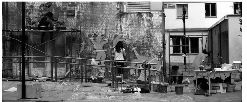
Gazteek eta Itziar Nazabalek murala egin zuten larunbatean.