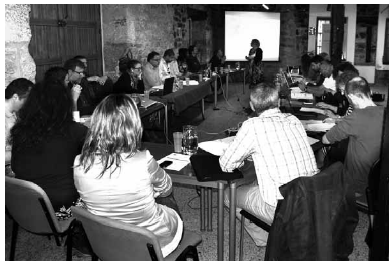
Altsasuko Gure Etxea eraikinean bildu dira proiektuetako kide europarrak.

Batzukonpostalantzenari dira, besteak biogasa. Herrialde bakoitzeko proiektua aurrera eramateko erakundeek, unibertsitateek eta enpresek clusterrak sortu dituzte. Aipatu bileretan cluster bakoitzak bere proiektuaren garapenaz eginen azalduko du. Aldi berean, guztien artean helburuak eta egitasmoak partekatuko dituzte.