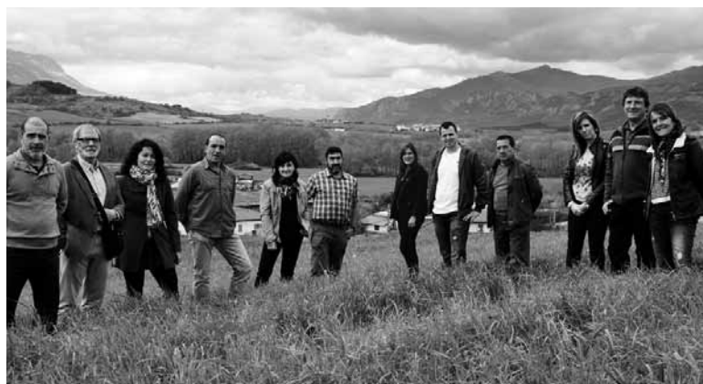
Arakilgo Independenteen zerrendako kideak.

Arakil bizi baten alde ekonomia arloan bost proposamen zehatz aurkeztu ditu AIk. Ibarrean bizi eta lan egin ahal izateko 11 lehentasun zehaztu ditu bere programan hautagaitza independenteak. Haien artean herri-lanak, mugikortasunaren aldeko