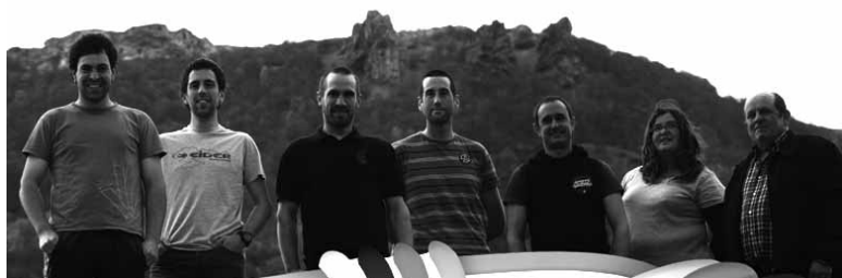
Bakaikuko EH Bilduko hautagaitza.

Egoera ikusita ekonomia baliabi-deak ongi aprobetxatzeko eta herritarrendako benetan baliagarriak diren proiektuak jasoko dituen bide orria gauzatu nahi du EH Bilduk Bakaikun, 10 edo 15 urterako baliagarria izanen dena. Despeditutako legegintzaldian herritarrek inkestent bidez egindako proposamenak osatzeko azpiegitura, euskara, ingu-