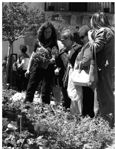
Iazko azokako postu bat.

Olatzagutiko Udalak zazpigarrenez lore eta landare azoka antolatu du. Hamaika salmenta postuk euren eskaintza egingen diete azoka bisitatzen duten guztiei. Lore eta landareez aparte, lorontziak, aromaterapia, lorezaintza, natur kosmetika, erlezaintza, sendabelarrak eta beste izanen dira. Eguraldiak lagun-duko ez balu azoka Erburua kiroldegian egingen litzateke.