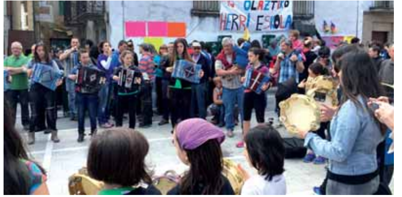
Flash-mobaren ondoren trikitilarien doinuak zabaldu ziren Olaztin.