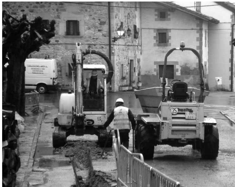
Langileak Iturmendin lanean.

44 sakandar gutxiago daude Nafarroako Enplegu Zerbitzuan izena emanda, 1.462 guztira. Sakanako langabezia 1500 langabetik behera egon zen azken aldia 2011ko maiatzean izan zen, 1.421.