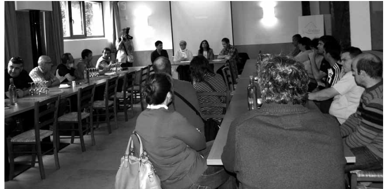
Baso lanei buruzko enplegu tailerreko bilera bat. Egun 3Dkoa egiten ari dira.

ekarriko du. "Horretan gakoa da materia organikoaren kudeaketa zuzena". Hondakin mota horren kudeaketak lanpostuak sortzeko aukera ematen duelako, beraz, langabeak horretan trebatzeko enplegu tailerrera diru-laguntza eskaera egin zuen. Joan den urteko deialdian Mank-ek ez zuen laguntzarik jaso, bai, ordea, 2011n eta 2012an; baso lanetarako enplegu tailerrak egin ziren orduan.