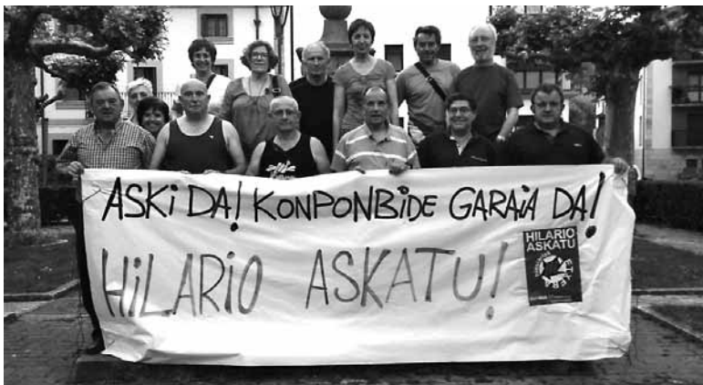
Urbizuren lagun eta hurbilekoek manifestaziora joateko deia egin dute.

Igandean, 19:00etan, Olatzagutian Hilario askatu! Iheslariak etxera! leloa duen manifestazioa egin da