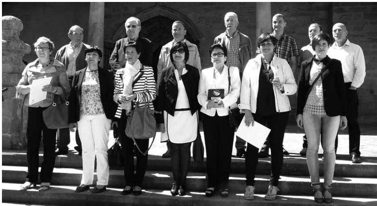
Aitortza jaso zuten odol-emaile guztiak.