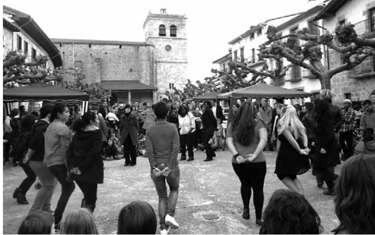
Lakuntzan ospatutako integrazio eta aniztasun festa.

Ekimen guztiek bertako eta kanpoko herritarrek nahastea, biltzea, dute helburu, funtsean. Joan zen urteko udazkenean, Unesco Kate-