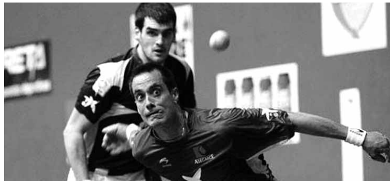
Ezkurdia irabaztekoan egon zen, baina Oinatzek egin zuen aurrera.

dute. Aurten ekainaren 27an V Sakana Burunda zikloturistamartxa antolatuko dute. Helburua 300 txirrindulari elkartzeta da. Proba ez lehiakorra da eta ibilbide luzea edo laburra (Aralarko San Migel igo gabe) egiteko aukera izango da. Soilik Aralarko San Migelgo igoe- ra izango da kronometratua.