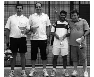
Aurreko edizioetako bat.