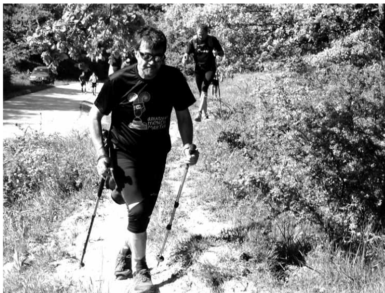
Uharte Arakilen indarrak hartu eta gero, Aralarra bidean.

Sakanako ikuspegi bikainez gozatu zuten mendizaleek. Hornidura eta kontrol guneak izan zituz-