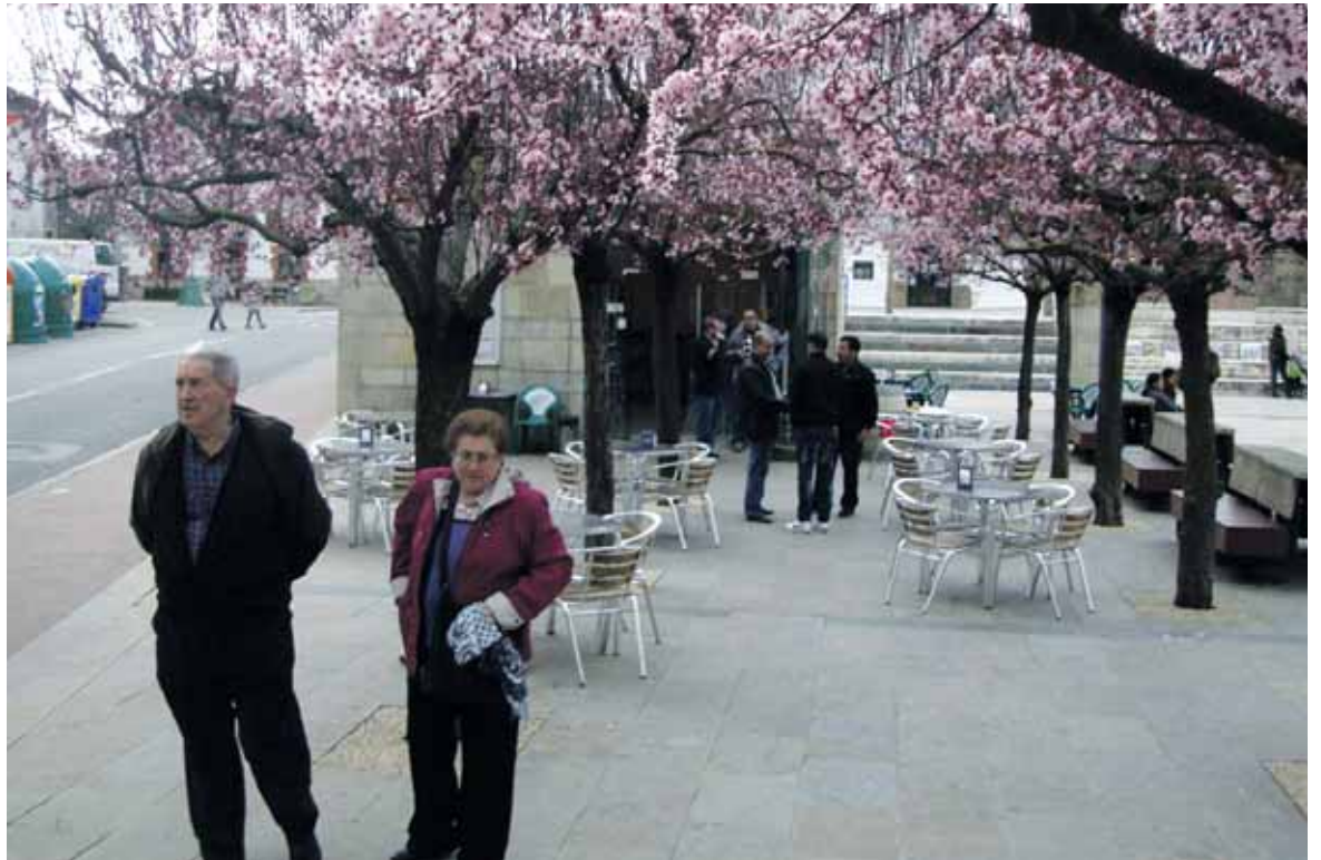
Irurtzundarrak plaza inguruan.