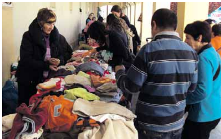
Arkupetan hartu zuen aterpea bigarren eskuko azokak.

Guztira 903 euro eskuratu ziren igandean. Horri biharko elkartasun afarian aterako direnak gehitu beharko zaizkio baita Itxipuruko kontu korrontean egiten diren ekarpenak ere. Jasotako dirua Irurtzungo Elikagai Bankua hiru hilabetez esnez eta olio hornitza bideratu nahi da. Bankuak martxoan 60 familia (200 pertsona) elikatu zituen.