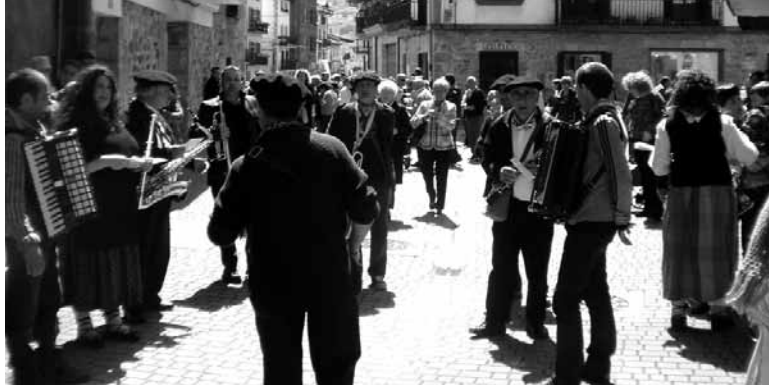
Altsasuko Alde Zaharreko festetan ez da musika doinurik faltako.

Artisau azoka, Alde Zaharreko festak eta Dantzari Txiki Eguna. Hiruek bat egiten dute asteburuan, Altsasuko Alde Zaharreko jai egitarau osatua eskaintzeko. Gainera, domekan hasi eta irailaren 14ra arte, maiatzeko gurutzetik iraileko gurutzera, eguerdiro altsasuar talde bat eliza dorrera igo eta ezkila errepikak egiten dituzte. Egun horretan Foru plazan 21 artisau postu ikusteko aukera izanen da.