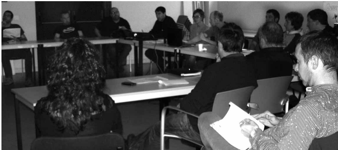
Sakanako Sozioekonomia Behatokiaren azken bilera.

Sakanako Sozioekonomia Behatokiak horixe adostu zuen apirilaren 20an egindako bileran. Aldi berean, Behatokiak joan den urtean SPE garatzeko Cederna-Garal-