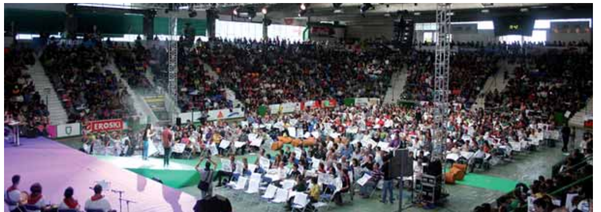
Nafarroan euskaraz bizi nahi dutela adierazteko elkartu ziren euskaltzaleak Anaitasunan.