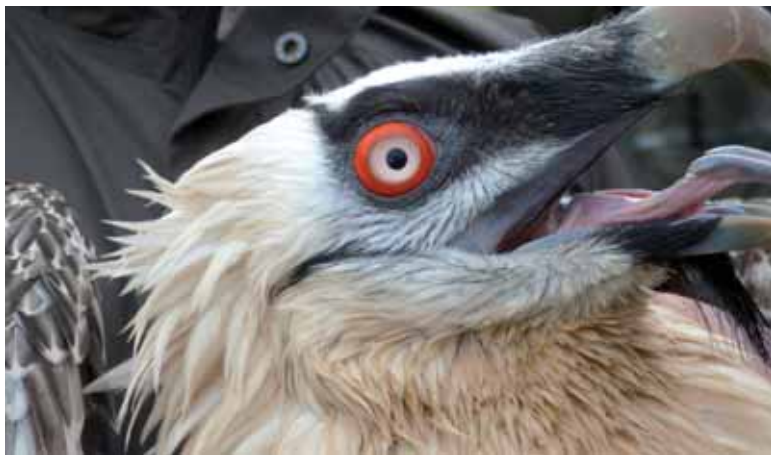
Kiriku ugatzari jarraipena egiteko irrati transmisorea jarri diote. UTZITAKOA