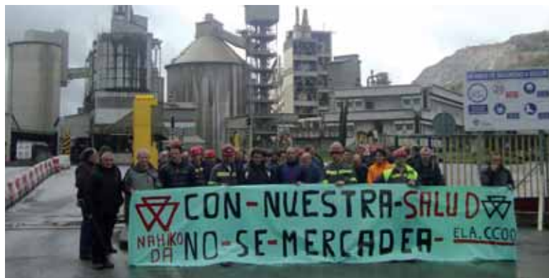
Portlandgo zuzendaritzari angileen osasunarekin ez jolasteko exigitu diote.

Cementos Portland Valderrivas (CPV) enpresako langileek ordu bateko lan uztea egin zuten astelehenean, ELAk eta CCOOk deituta (UGTk ez zuen deialdiarekin bat egin). Nahikoa da. Gure osasuna ez da salerosteko leloa zuen pankartaren atzean egin zuten kontzentrazioa. Enpresa batzordean gehiengo duten bi sindikatuek jakinarazi zuten, “CPV eta mutua elkar hartuta ari dira lan istripuen ondoren. Daukan arrisku guztiarekin, langileak beste