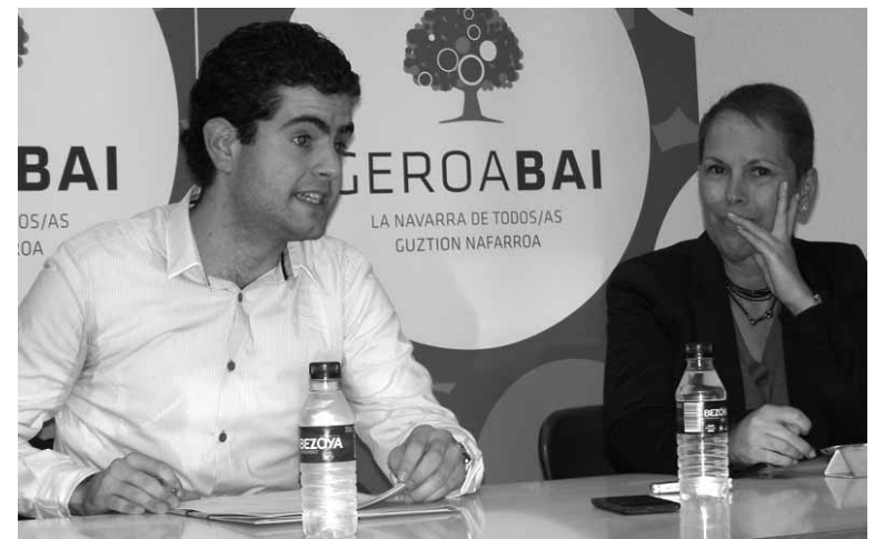
Javi Ollo eta Uxue Barkos, Geroa Bairen alkate-gaia eta presidente-gaia.

erregenerazioa gertatu dela nabarmendu du Ollok: “berritu egin dugu, baina esperientzia ere badago, eraginkortasuna mantentzeko”. Udal programan, kontratua deitu dio Ollok, garapen sozio ekonomikoa, pertsonen arrisku egoerak eta gardentasuna eta parte-hartzea oinarri izanen direla aurreratu du.