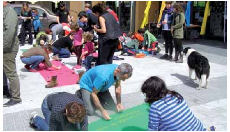
Makina bat altsasuar elkartu ziren Gure Esku Dago deituta.

Dinamikak deituta, Euskal Herriko makina bat herritan aste-buruan Joste Egunak ospatu dira. Sakanan Lakuntzan, Bakaikun, Urdiainen, Altsasun eta Ziordian antolatu ziren ekitaldiak. Elkartu ziren sakandarrek eskuratutako oihaletan erabakitze eskubidearen aldeko aldarriak, mezuak eta marrazkiak egin zituzten. Musika