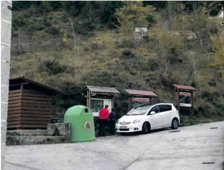
Bi mendizale Etxeberrin Aixitarako bideko mapa begiratzen. ARTXIBOA

Parte hartzea librea da. Baina, igandean bertan, 9:30etik aurrera Leitzako, Lekunberriko edo Lata-