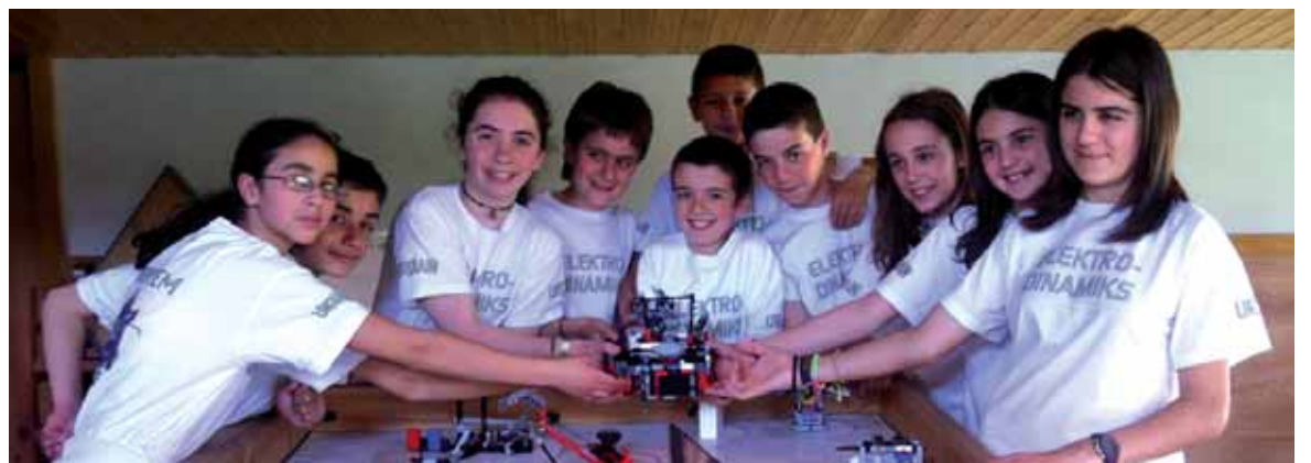
Robotika landu duten ikasle urdiaindarrak.

Ondoren, Aitziber elkartearen (...) robotika zer den azaldu genien. Gero, robotak eta robotak egiten dituen probak erakutsi eta azal-