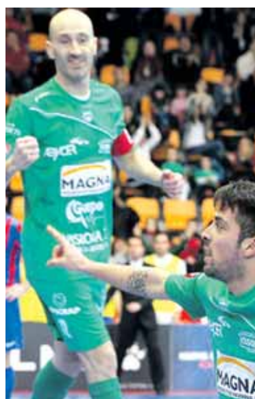
Esevenri 4 gol sartu zizkion Jaeni.

Inter Movistarrek irabazi du liga (79 puntu), Bartzelona (74 puntu), El Pozo (73 puntu), Jaen (54 puntu), Palma Futsal (53 puntu), Magna Nafarroa (52 puntu), Aspil Vidal