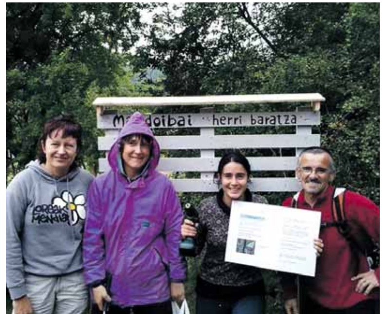
Mandoibai elkarteak kideetako batzuk baratzeko sarreran.

Herri baratzen proiektuak aurrera jarraitzen du Etxarri Aranatzko Mandoibai dermioan. Udalak