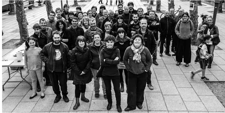
Pasa den asteazkenean aurkeztu zen Etxarriko EH Bilduren zerrenda.

Bilduren sorrerari aipamena eginez esan zuten, “urteetan elkarri bizkar emanda bizi ginen herri-tarrak gure indarra batzea erabaki genuen, herrigintzan aurrera egiteko. Herritarren parte har-