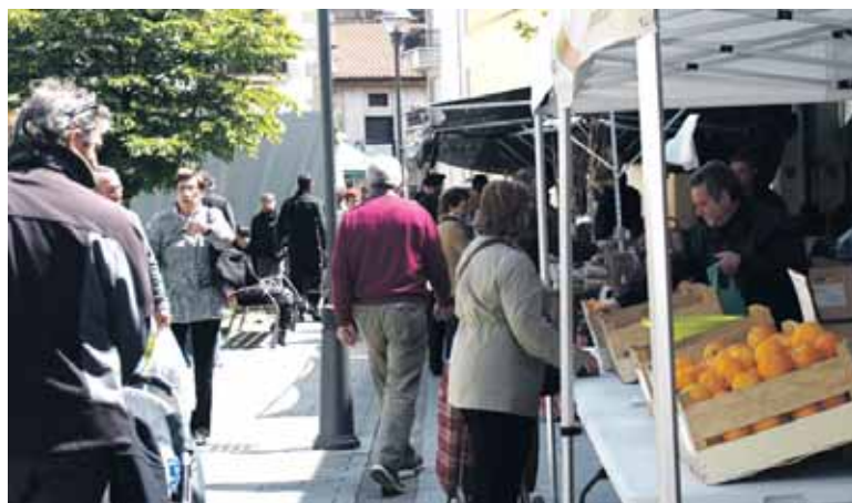
Jendea Altsasuko azokako fruta salmenta postu aurretik pasatzen.

Saioak Pazienteen Eskolarekin lankidetzan ari den irakasle talde batek emango ditu, osasuneko 9 profesionalek osatuta, bai eta adituak diren 9 pazientek ere, haiek guztiak horretarako bereziki prestatuta daudenak. Lan-metodologiaren barnean sartzen dira: hitzaldiak, eztabaidak, kasuen azterketak, ariketak, esperientziak partekatzea..., talde txikietan nahiz gela osoarekin.