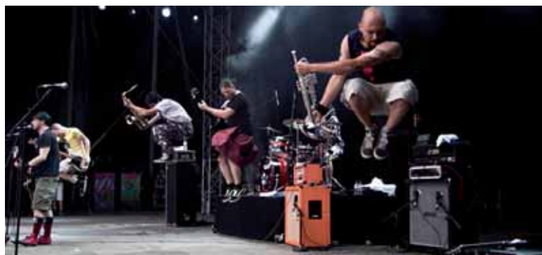
Igandean, Altsasuko gaztetxean Talco ikusteko aukera izanen da.