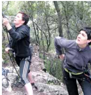
Aurreko ikastaroetako bat.

Maiatzaren 13ra arte, Mank-en (948 464 866 edo kirolak@sakanamank.com). Prezioa: 39 euro.