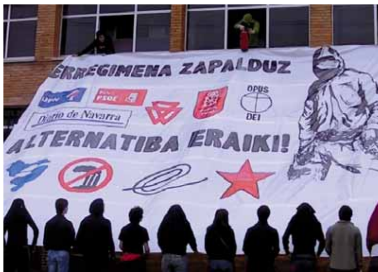
Lantegiaren okupazio sinbolikoko une bat. UTZITAKOIA

Sistemak eskaintzen dituen aukeren aurrean “Sakanako gazteok argi dugu bizi ditugun baldintzak irauli eta gure bizi eredu propioak eraikitzeko salto egin behar dugula”. Horregatik, “zapaltzen gaituen sistema kapitalista honen aurrean burujabe