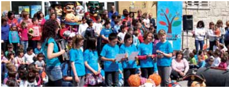
Aurkezpena bertsotan egin zuten.

Maiatzaren 9an ospatuko da, Olatzagutian. Herri bazkarian izena emateko epea astelehenera arte dago zabalik eta horretarako guraso elkarteetara jo behar da