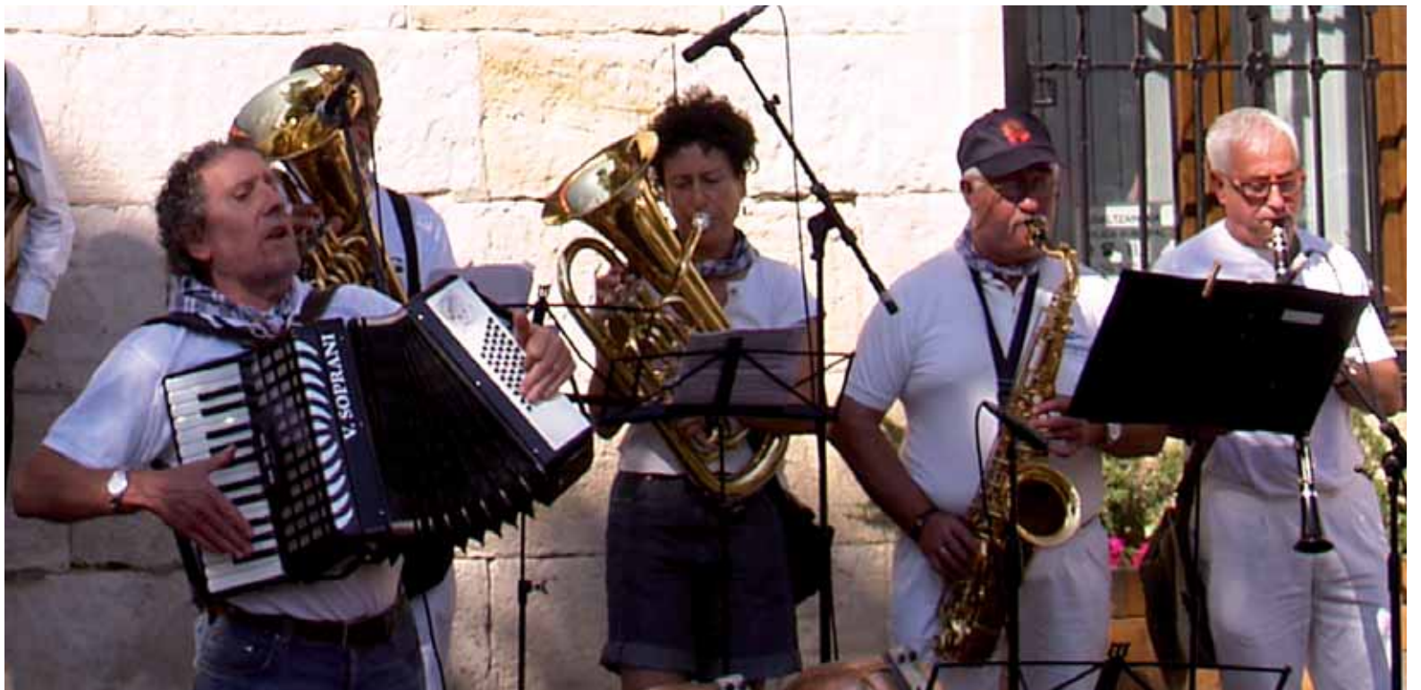
Enrike Zelaiaren omenezko kontzertua larunbatean izanen da, 19:00etan, Altsasuko Burunda pilotalekuan.