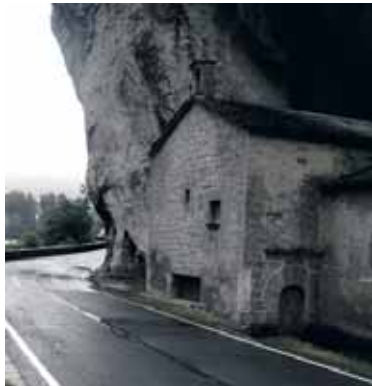
Oskia harratean dago ermita.

Ohi denez, maiatzaren aurreneko egunean arakildarrek Oskia ermitarako bidea hartuko dute. Aralarko aingeruaren irudia lagun izanen dute bide horretan. Arakilen barnako ibilbidea 9:00etan hasiko du goiaingeruaren irudiak. Zuhatzun ordu laurden geroago izanen da. 9:30erako Ekain izanen da. Etxarrenek hamarrak baino pixka bat lehenago espero dute. Handik Urriazola jokodu, 10:20an iristeko. Izurdiaga izanen da Aralarko aingeruaren azken aurreko geldialdia 10:45ean. Errotzera 11:10ean iritsiko da. Arakildarrak azken herri horretan elkartu eta erromesaldia Oskia harrateko ermitara abiatuko dira, 11:40an. Eguerdian meza hasiko da ermitan.