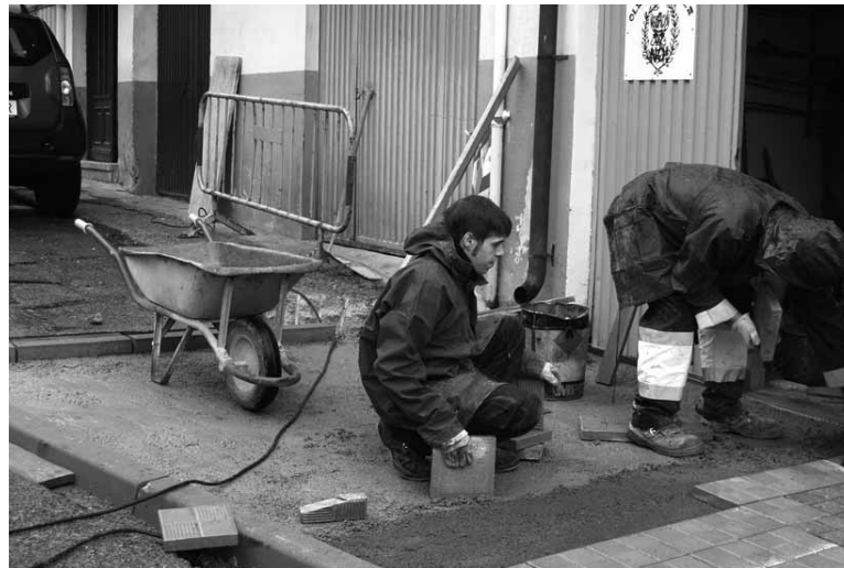
Arkitektura oztopoak kentzeko lanek segida izan dute aurten.

arkitektura-oztopoak kentzeko lanak egiten ari da Olatzagutiko Udala. Aurrekontuan jasotako lanen artean daude, bestalde, esko-