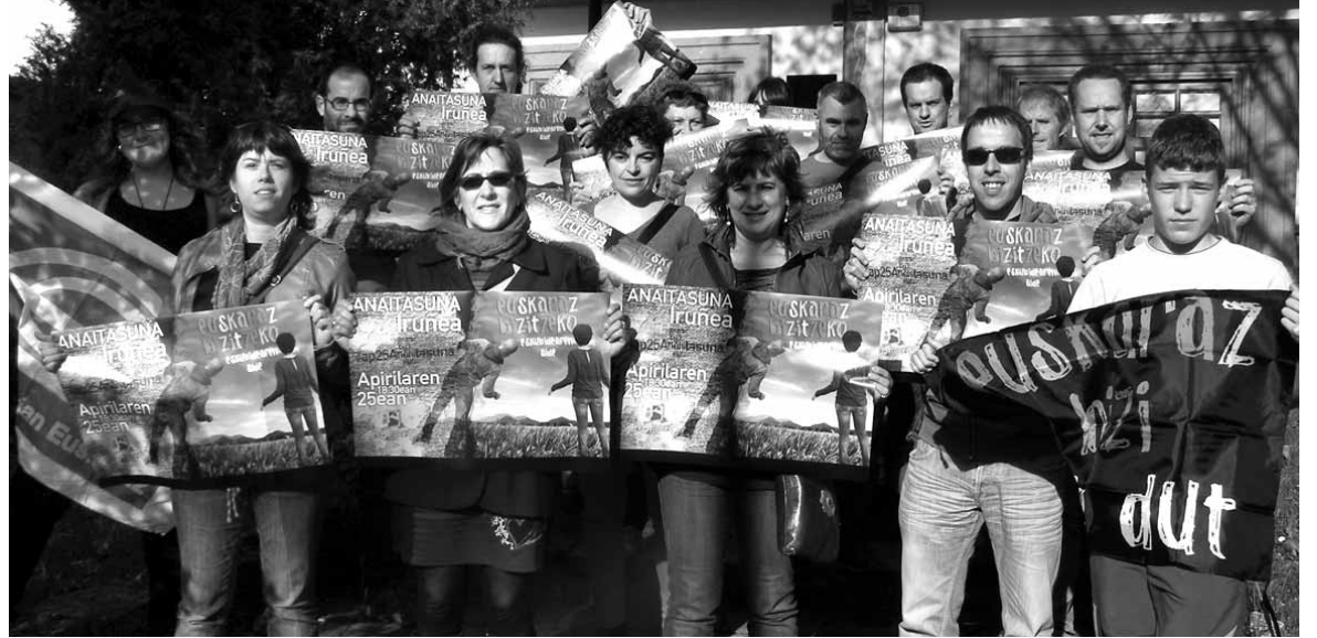
Iragarri dutenez, ekitaldi parte-hartzailea, bisuala, artistikoa eta metaforikoa izanen da Anaitasunaren egingen dena.

Hizkuntza normalizazioak ikuspegi politikoa eta soziala dituela nabarmendu du Bilbaok. Horretarako lau zutabe aipatu ditu: cor-