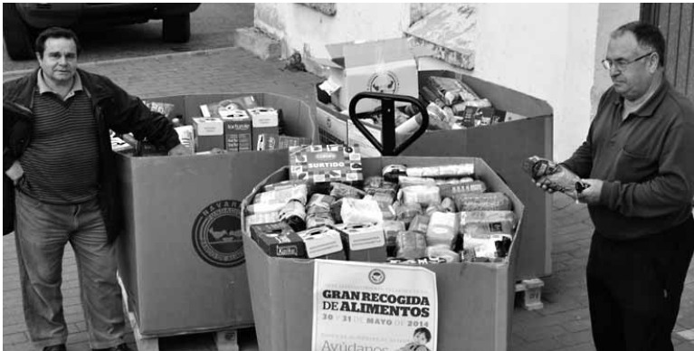
Biharko azokaz aparte, maiatzaren 2an afaria izanen da. UTZITAKOIA

go eta Uharteko Arakilgo Elikagai Bankukoek banatu beharreko jakiak. Azken hilabeteetan kopu-