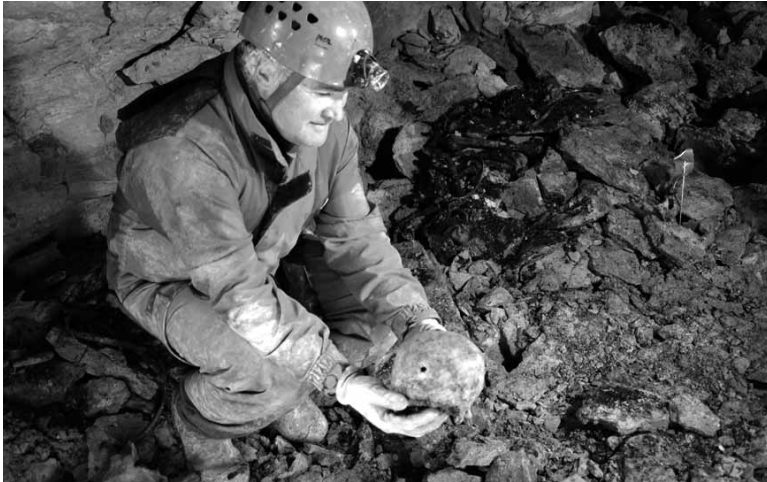
Identifikatutako etxarriarrak UGTko kideak ziren.