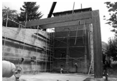
Frontoia estaltzeko lanak bukatu dira

Pinturako eta bestelako azken lan txikien faltan, maiatzean edo garagarzaroen mustuko dute etxeberriarrek frontoi berritua. Pilotalekua estaltzeko teilatua, porlanezko zoru berria eta atzeko pareta jarri dituzte eta begiratokia egin dute. Lanek 90.000 euroko aurrekontua izan dute. Haietatik 28.000 Arakilgo udalak jarri ditu. Gainontzekoa, berriz, Etxeberriko Kontzejuaren bizkar gelditu da. Horretarako kontzejuak bere bi pisuetako bat saldu du. Horrela,