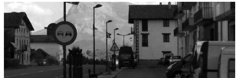
Udaz geroztik farola berriak dituzte Urdiainen.