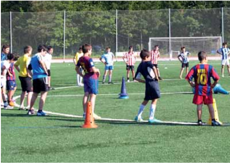
Futbolariak udako futbol campusean trebatzen.