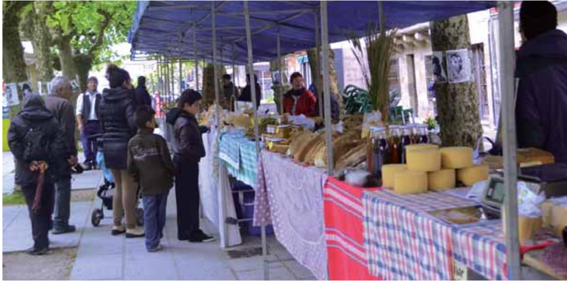
Ibarreko produkturik onenak ikusteko eta dastatzeko aukera egongo da igandean Etxarri Aranatzen.

Sakanako ekoizleekin batera EHNE-Bizilurren barruan dau den ekoizleak ere izanen dira Ama-Lur azokan izanen diren 20 bat postuetan: ezti ekologikoa, ardoa, arrautza ekologikoak, pasta ekologikoa, ogia, gozoki eta barazki ekologikoak, zein ohiko eta ekologiko erako behi eta ardi esnekiak, Pirinioetako patatak, edota behikia, ardikia, euskal zerrikia eta karakolak, besteak beste dastagai