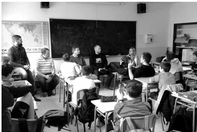
Kaxubiarrak azalpen asko eman zizkieten Poloniara joanen diren ikasleei.

Martxoaren 31n izan ziren bisitan. Baltiko kostaldeko, Polonia iparraldeko hizkuntza da kaxubiera. 250.000 hiztun inguru ditu eta egoera kaxkarrak du. Euskarak azken hamarkadetan egindako bidea dute oinarri berreskuratzeko prozesuan.