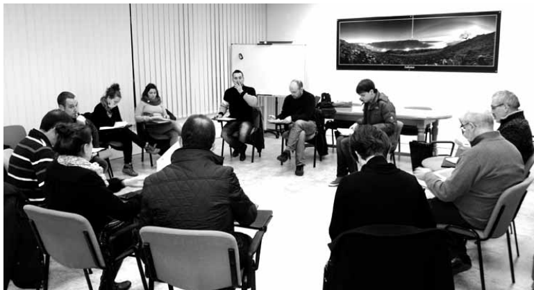
Sakanako Plan Estrategikoa zehazteko bileretako bat.