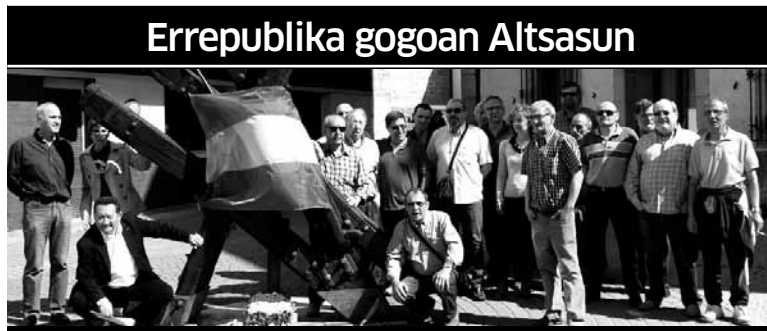
Astearteko lore eskaintzarekin langile batailoietan egon zirenak, haien senideak eta askatasunaren eta justiziaren alde borrokatu ziren ideia errepublikanako eta ezkertiarreko pertsonak omendu zituzten astelehenean Altsasun, Ezker Batuak deituta. +www.guaixe.eus

Azkenaldian hainbat elkarte memorialistak sustatzen ari diren ekimenak ikusirik, Oltzako Zendeako Udalaren aldetik egoki jo dute