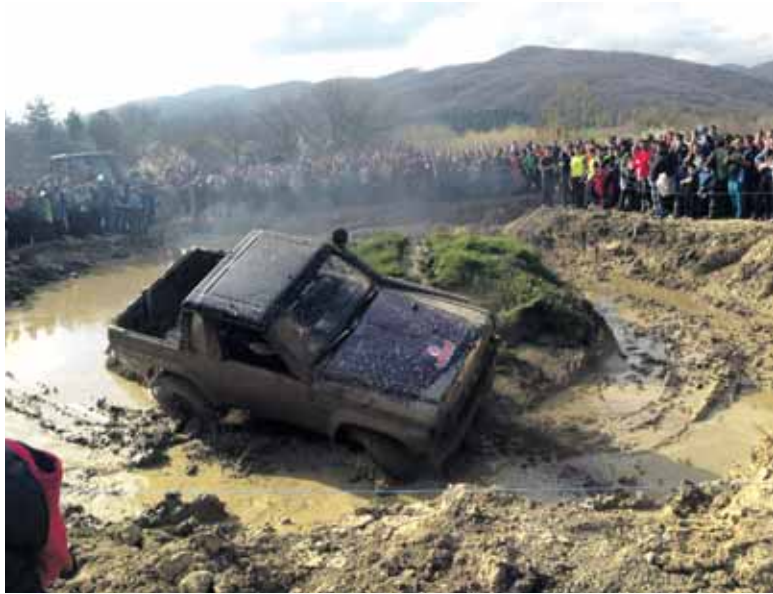
Jendetza bildu zen proba jarraitzera. Pilotu sakandarrak izan ziren onenak.