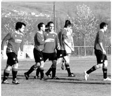
Etxarri preferente mailara igo da.

ETXARRI ARANATZ 4 - UHARTE B 3 BURLADES 4 - ALTSASU 2