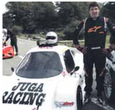
Flores Urbasako igoeran.