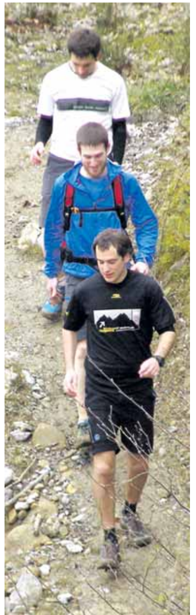
Mendizaleak Orobe aldean.

Aurten maiatzaren 9an izanen da Irurtzongo Iratxok antolatutako 26. Sakanako Ibilaldia. Bi ibilbide izanen dira aukeran. Ibilbide luzea, San Donato, San Migel eta Trinitatea ermitak batzen dituen (54 km, 3.300 m desnibela), eta ibilaldi laburra (27,5 km, 1.344 m desnibela). Izena ematea zabalik dago www.iratxoelkartea.com web gunean.