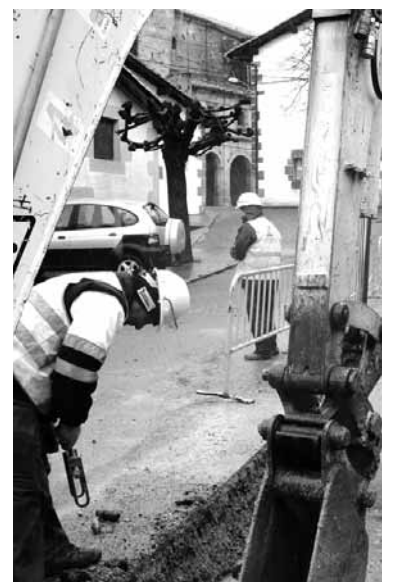
Iturmendiko gas sarea egiteko lanak.

Enpresatik jakinarazi dutenez, aurten Sakanan 300.000 euroko inbertsioa eginen dute. Bakaikun sarea jartzearekin batera, gainontzeko herrietan dauden gas banaketa sareak zabaltzeko eta argu-neetarako lanak egiten hasi da. Azken horiek bezero berriei zer-