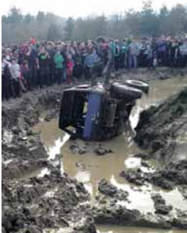
Ezinean geratu ziren asko.

rrako probak jokatu dira. Ekainaren 27an atzera ere Arbizu izango da 4x4 ibilgailuen topagunea, San Juanetan.