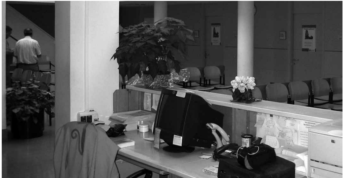
Etxarri Aranazko osasun etxea.

Horren aurrean, kanpaina bulkatu duten erakundeek herritarrei dei egiten die zerbitzu euskalduna izateko eskaera formal egin dezaten. Horretarako eskaera idatzi eredu sortu dute, Etxarrin jasotzen diren osasun zerbitzu guztiak euskaraz jasotzea nahi dela adierazteko. Zehazki, hiru eskaera egiten dira: Batetik, lanpostu horiek plantilla organikoan euskara eskakizuna izan dezate. Bestetik, dagoeneko lanean ari