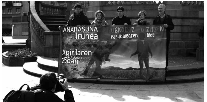
ELA, LAB, EILAS, ESK, EHNE eta CGT sindikatueta kideak ekitaldiarekin bat.

Kontseiluak antolatutako ekitaldiaren harira Iruñerriko euskalgintzak eguna girotzeko Ezkaba mendirako lasterketa ez lehiakorra antolatu du apirilaren 25erako, 10:00etan abiatuko da. Bestal-