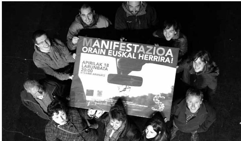
Sakanako makina bat eragilek eman dio babesu ekimenari.

Bihar, 20:00etan, manifestazioa Etxarri Aranatzaren Sarek deituta