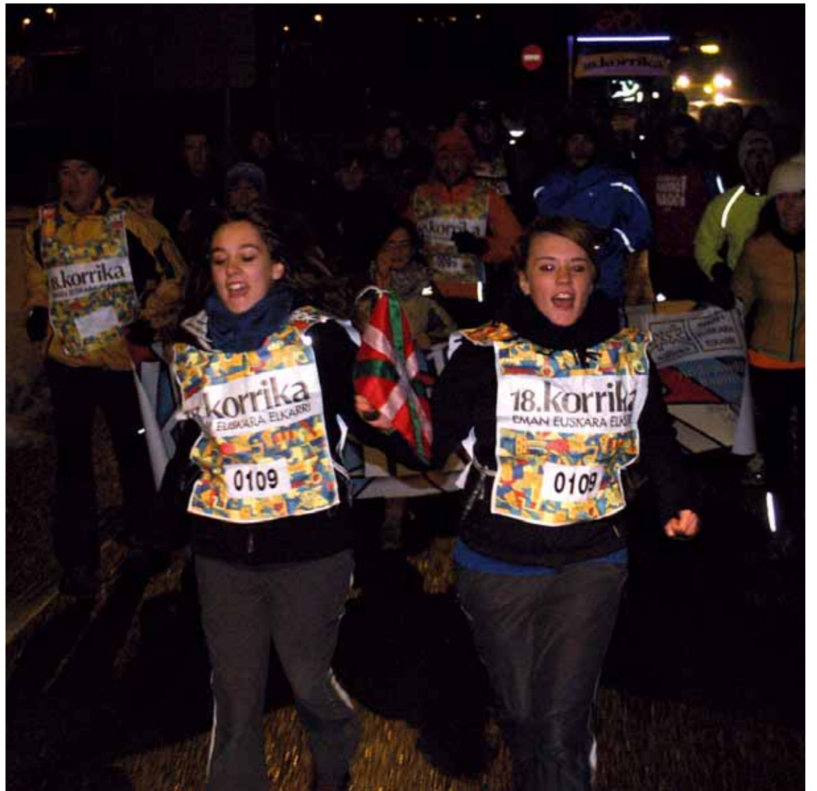
Bihar, goizaldeko 2:00etatik 7:30era, Korrika 19-k Sakana zeharkatuko du. ARTXIBOA