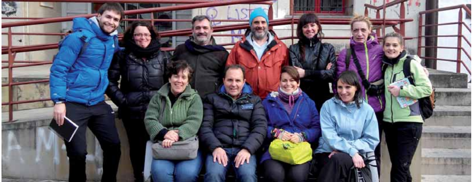
SNEINN programaren edizioan parte hartzen duten ekintzaileak. UTZITAKOIA

Langabezian zeuden eta izena eman zuten ekintzaileen artean hamar izan ziren aukeratuak. 35