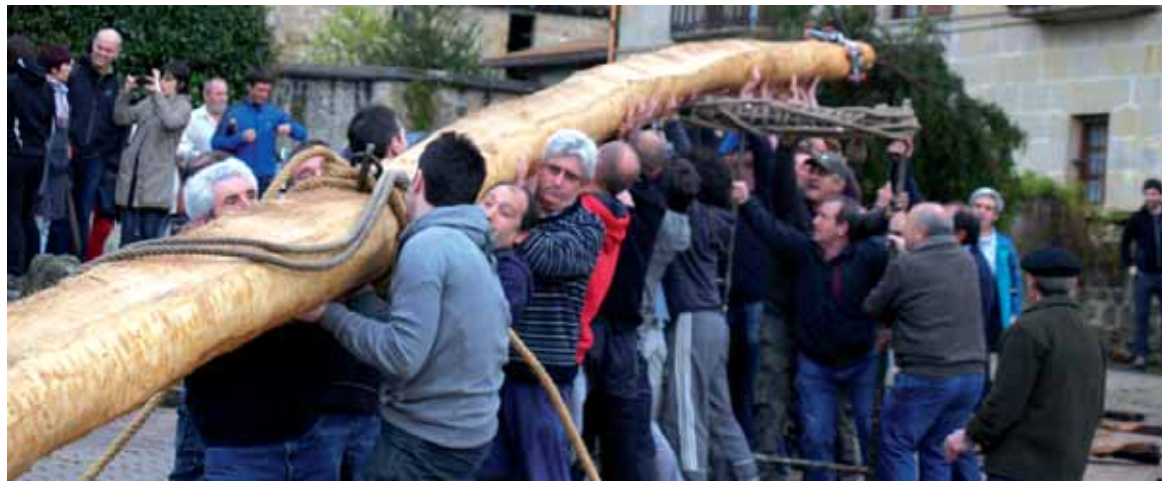
Iturmendiko maiatza jasotzen.

Joan den mendean Iturmendin nolako bizimodua zegoen azaldu zuten aurreko urtean 13 iturmendiarrak. Lanbideak, urte-berri ospakizuna, Santa Marina ermitakofesta, ohiturak, eskola... denetarik lekukotzak jasotzen ditu Labrit Ondareak egindako bideo lanak. Ekoiztetxeak, Navarcho eta NUPekin batera, 13 iturmendiarrorietan 30 orduko grabazioak egin dizkie. Bihar, udaletxean, haien lagin bat ikusteko