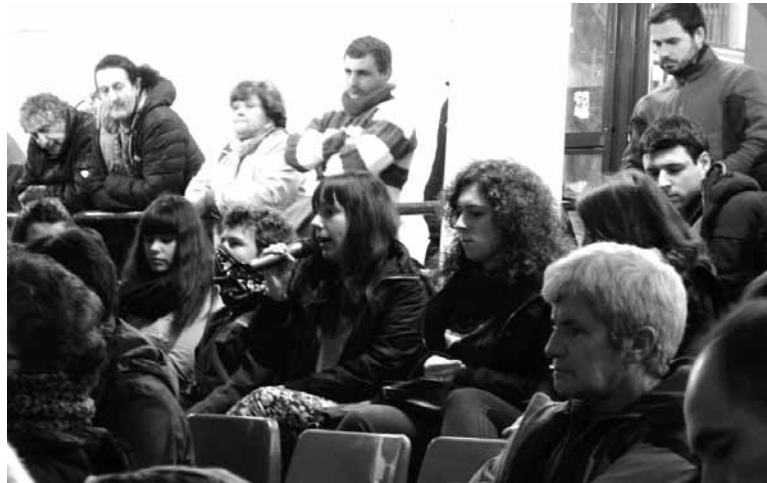
Aurreko astean izandako asanbladan erabaki zen galdera.

Festa Batzordeko presidentearen azalpenen ostean, batzarrera bertaratutakoek euren aburuak