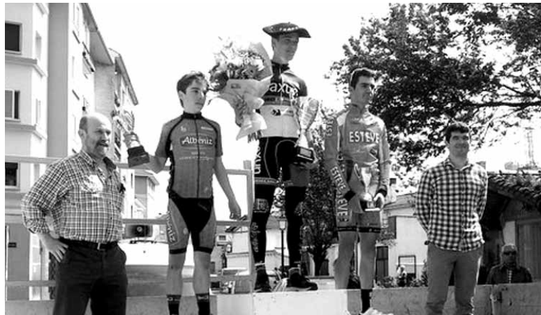
2014an Camachok irabazi zuen proba, Barceloren eta Suredaren aurretik.

Sociedad Deportiva Alsasuak antolatutako 56. Erramu Trofeoa jokatu da igandean, 10:30ean