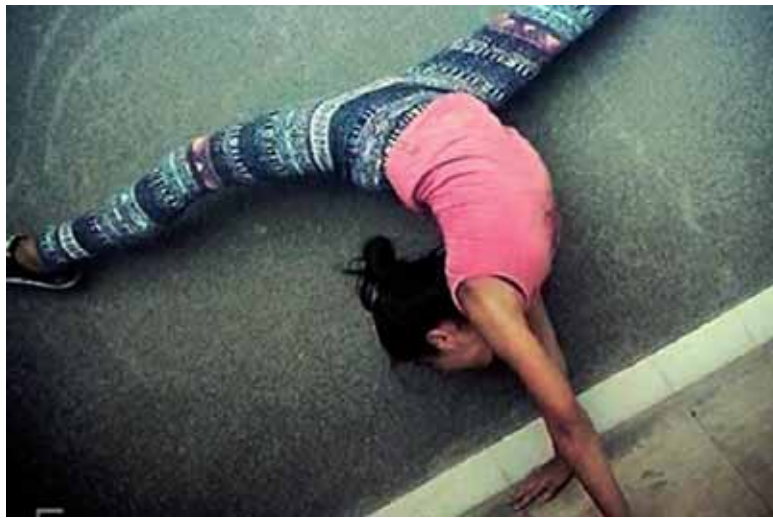
Olatziarrak egindako eta saritutako argazkia.