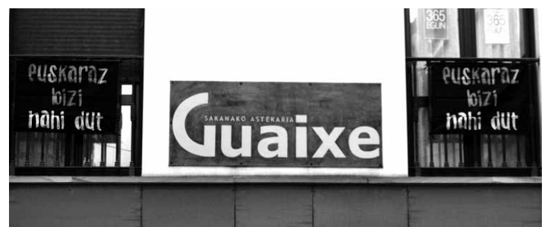
Euskaraz bizi nahi dut banderolak, Guaixeko bulegoetan zintzilik.

ko eragileei eska diezaiekete. Bestela, Iruñean AEK-ko Iruñezar edo IKAKo Campion euskaltegiaren