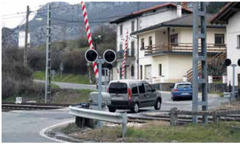
Autoak Izurdiagako trenbide pasatik pasatzen.

Izurdiagako trenbide-pasaguneko eguneroko batez besteko trafikoko intentsitatea hori da.