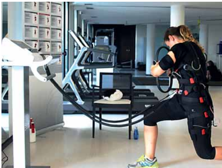
Elektroestimulazio gailua jarri dugu.