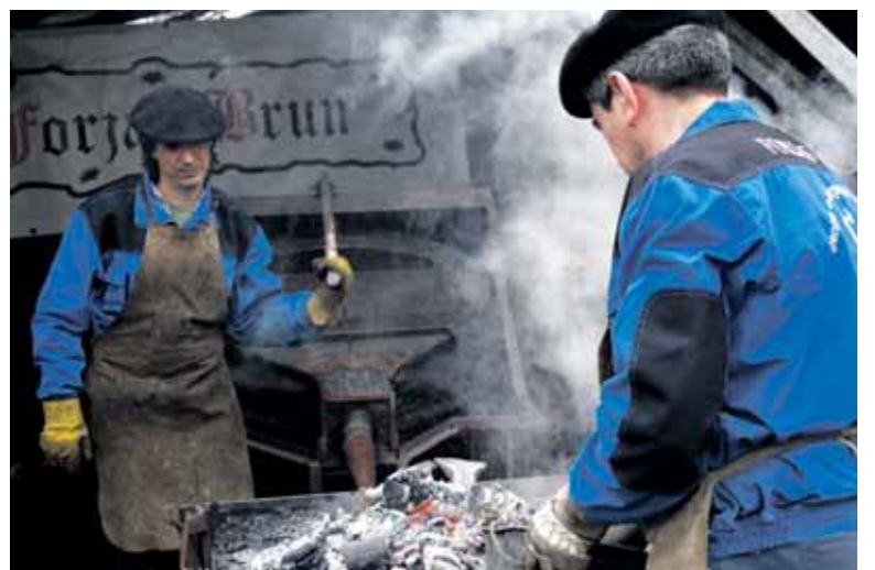
Brun forjariak hauspoari eragiten.

pen prozesu osoa azalduko dute bi egunetan, burdin minerala jasotzetik pieza erabat bukatuta egon arte. Burdinaren prozesua eta historia azalduko dute. Forjariaren zapi belaunaldiren eskarmentua duten forjariarekin batera lanean aritzeko aukera ere izanen dute bisitariak.