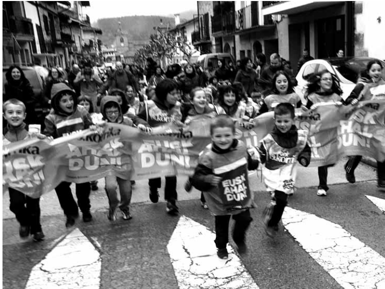
Korrika Txikia egin zuten Arbizon. Gaur beste herri batzuetan egingen da.

17:30ean Korrika txikia. Ondoren txokolate jatea. 22:00etan Herri afaria zineman. Ondoren, kontzertuak: Tocan 2 la polla eta herriko musikariak. Korrika pasa ondoren txokolate jatea Lakuntzako Pertza elkartearen.