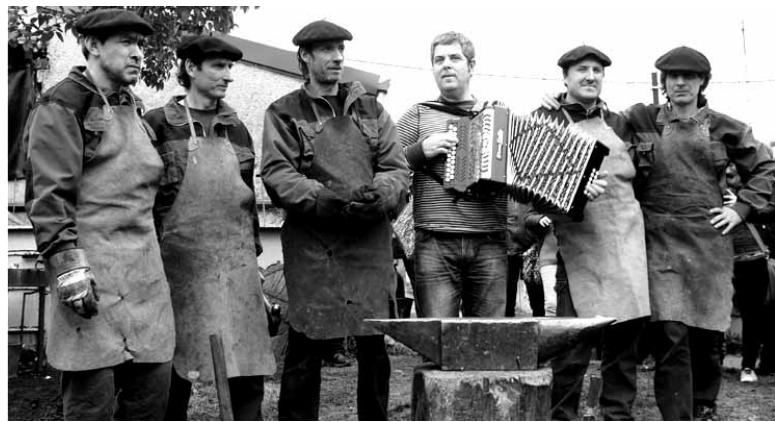
Bidelagun elkarteak Junkera omendu zuen Brun forjariaren burdindegian.