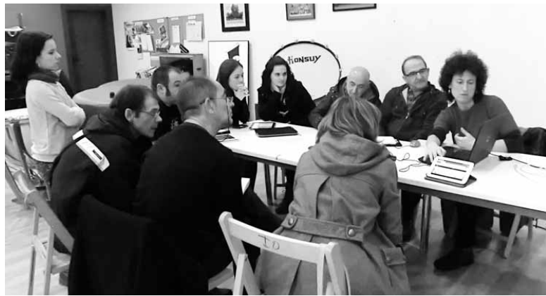
Guaixeko Komunitateko kide nola egin azaltzen.