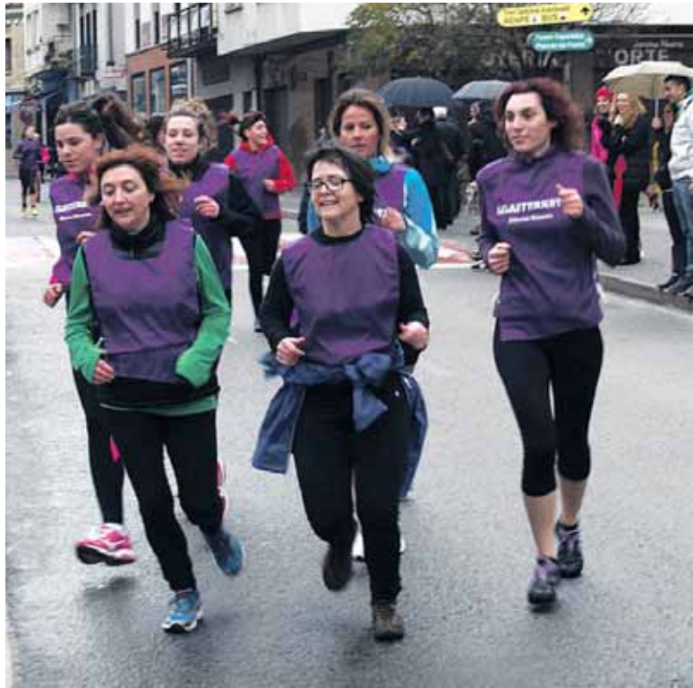
Gehienek korrikan, baina patinetan edo bizikletan egin zuen ere egon zen.

Eguerdiko 12:00etan eman zitzaion hasiera emakumeen lasterketa parte-hartzaile ez-lehiakorri. Emakume gehienek korrika osatu zuten 4 km inguruko ibilbidea, baina batzuk bizikletan egin zuten bidea, baita patinetan ere. Izan ere, parte-hartzea zen kontua. Altsasuko karriketatik barna korrikan, bizikletan edo patinetan ibili ziren, peto morea gainean zutela. Proba bukatzerakoan merezitako gosariatzeko aukera izan zuten guztiek. Altsasuko Udaleko Emakumeen Bilguneak eskerrak eman nahi dizkie Lilatoia aurrera ateratzeko lanean aritu ziren boluntario guz-