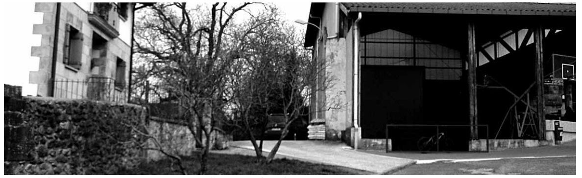
Eskolara joateko xenda etxearen eta frontoiaren artean abiatuko da.

Lan horietatik dirurik soberan geldituko balitz, medikuaren etxeko teilatuaren erlanean bateginen luke Iturmendiko Udalak. Horrekin batera, Gabirondokazaldu digunez, elizazpitik eskola berrira joateko oinezkoendako xenda bat egokituko du Udalak. "Hirigintza planean 6 metroko kale bat aurreikusten da, baina orain xenda eginen dugu. Ikasleak errepidetik oinez joaten dira eta arriskua kendu nahi dugu",