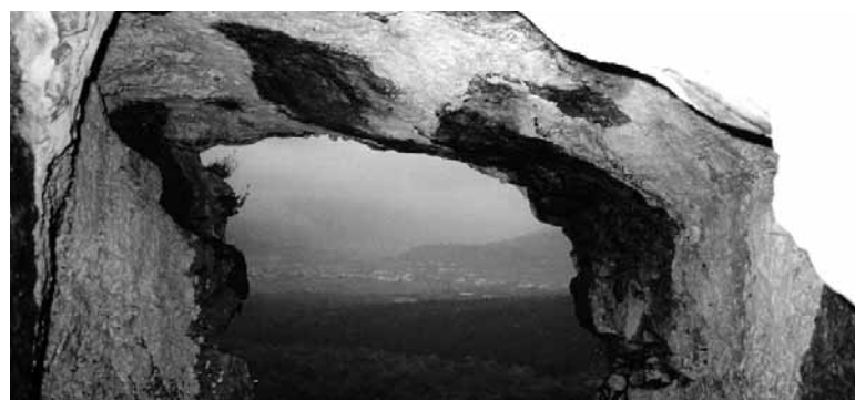
Aixita gazteluko oroigarria jartzen. Behean, jentilen leihoa, Iruritako gazteluan.