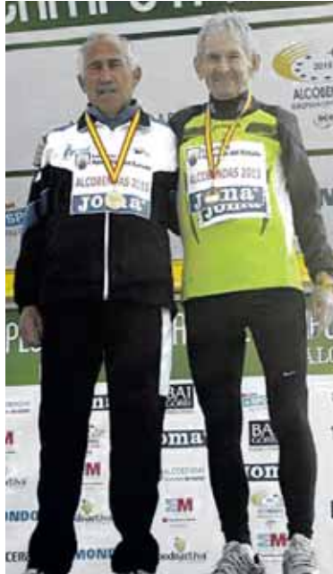
Merzero, eskuinean, podiumean.

Beteranoen probaz aparte, Espainiako autonomien arteko Kross Txapelketak eta Indibidualak jokatu ziren. Emakumezkoen maila