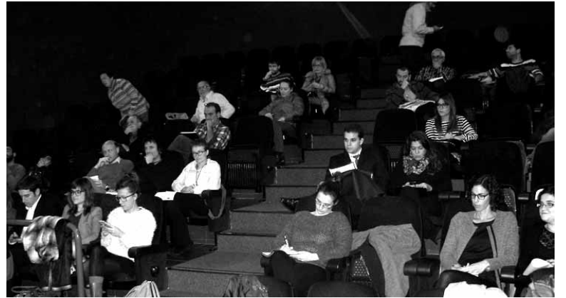
Cederna Garalurrek aurretik ekintzaileendako antolatutako jardunaldia.

Osatzen ari diren agirian ahalik eta ideia eta lurralde proiektu gehien jaso nahi ditu Garalurrek, "Nafarroako Mendia lurralde lehiakorragoa, berritzaileagoa, ekonomikoki eta ingurumenerako iraunkorragoa eta berdintasun printzipioekin adeitsuagoa izatea lortzeko". Horregatik, astearterako bilerara joatera gonbidatu ditu sakandarrak, estrategia