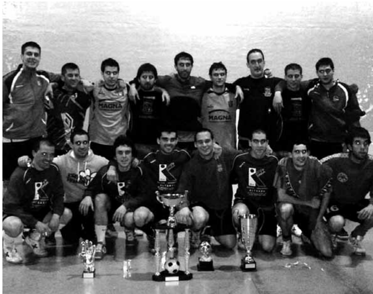
Aurreko urteko finalistak, Racing San Migel eta Arbizu. Arbizuk irabazi zuen.