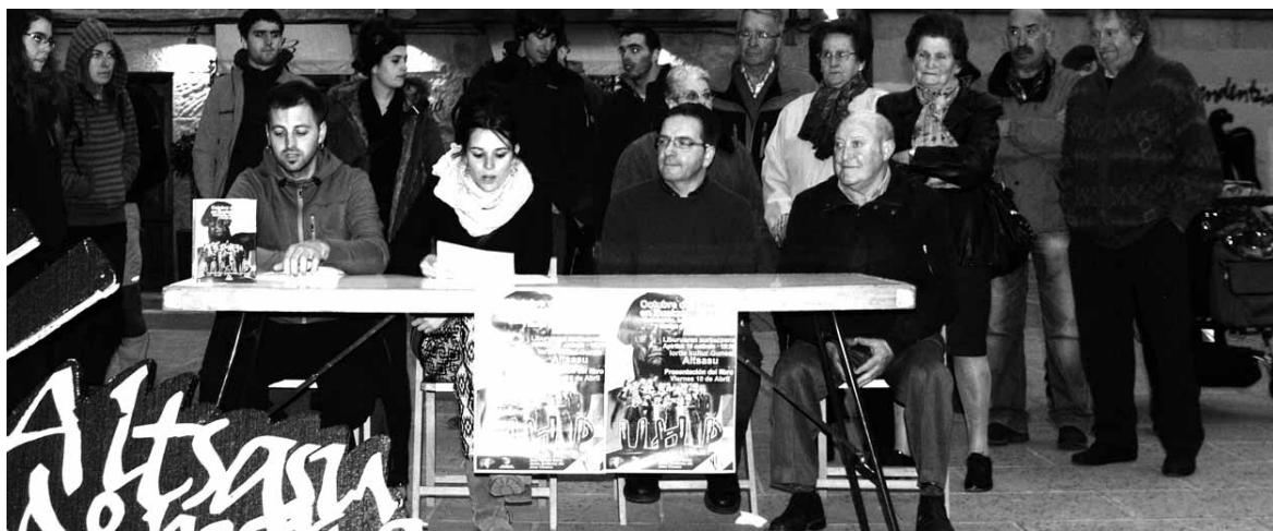
Altsasu Memoria taldeko kideak Iguzkizaren semearekin batera.