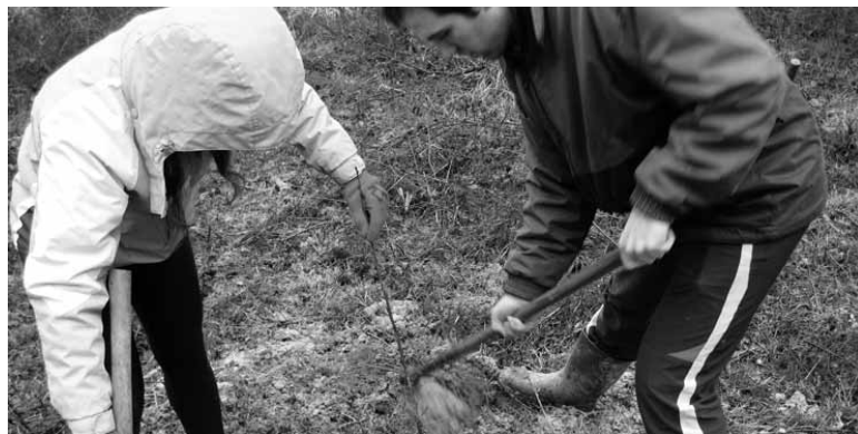
Landaketa eta beste egin zituzten domekan Bakaikuko basoan.

Domeka goizean 20 bat bakaikuarrek hartu zuten beheko basoko bidea. Haur, gazte eta heldu, guztiek langintza bakarria zuten: 30 gaztainondo landatzea. Gaztainondoen lan taldearen hurrengo egitekoa ale gazte horien inguruko bazterrek garbi mantentzea izanen da.