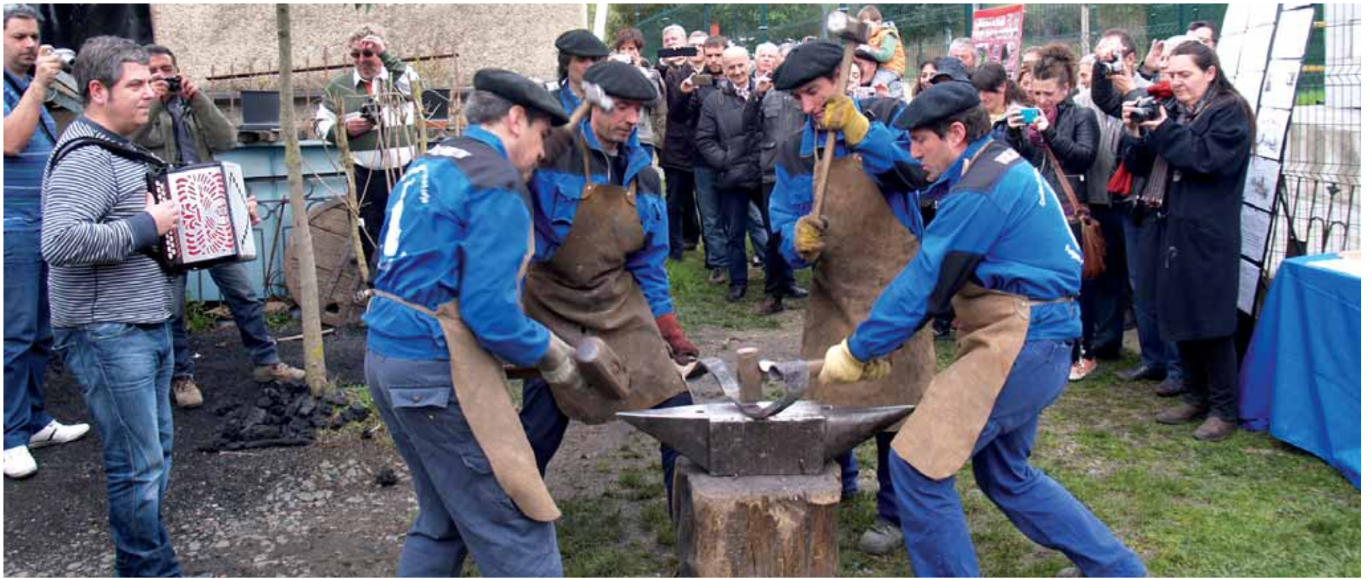
Kepa Junkerak eta Brun forjako forjariak Aldapeko jo zuten Bidelagun elkarteko kideen aurrean.