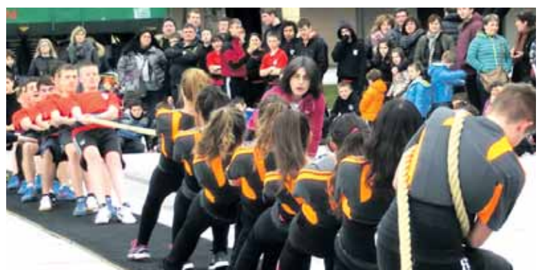
Andra Mari ikastolako taldeko tiratzaileak, bizkarrez, lehen jardunaldian.

Nafar Kirol jokoen hirugarren jardunaldia igandean jokatu da Berriozarko kiroldegian, 11:00etan.