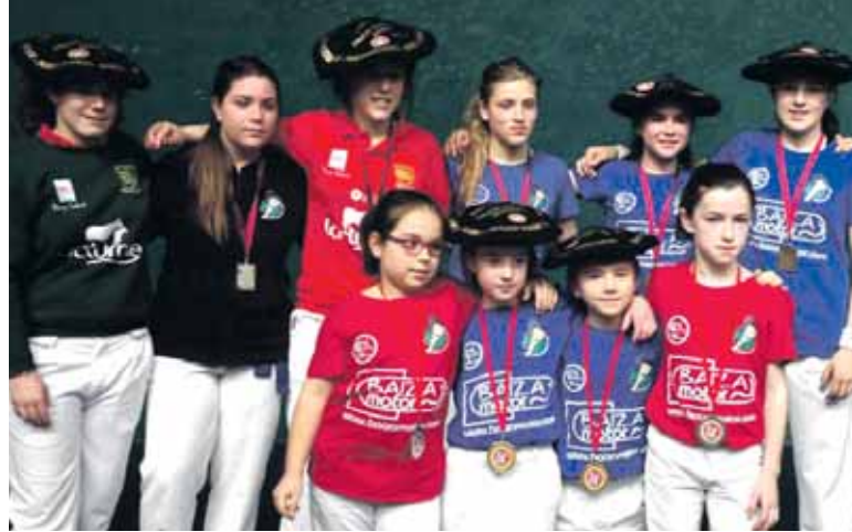
Gure Pilotako finalistek talde argazkia atera zuten.

Etxarri Aranatzeko Gure Pilota klubak lan handia egiten du emakumezkoen pala sustatzeko. Eta lan handi horrek uzta bikaina ematen jarraitzen du. Urtero Nafarroako eta gertuko txapelketetan lehiatzen dira gure palistak, eta emaitzak bata bestearen atzetik datoz. Igandean, esaterako, Nafarroako Paleta Goma Txapelketa-