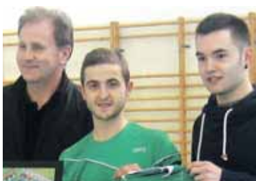
Etxarri, Oyarzunekin eta Saldiserekin.