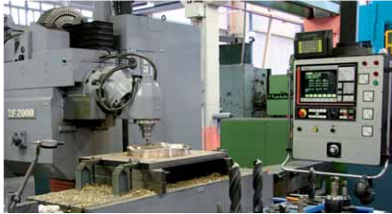
Langileak trebatuko dituzte enpresen eskariari erantzuteko.

Hori dela eta, Hezkuntza Departamentuarekin, Altsasuko Enplegu Bulegoarekin eta LH ikastetxearekin lankidetzan, behar horiek nola ase beharko lirakeen azter-