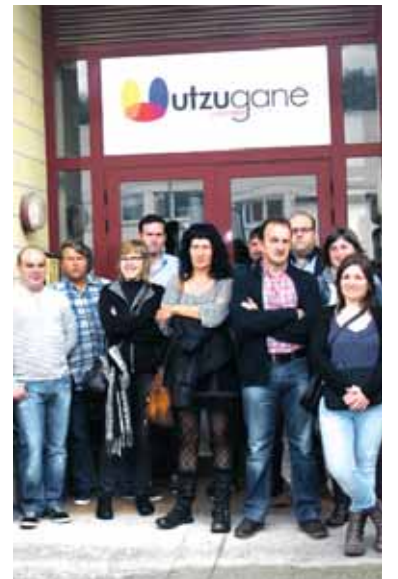
Plana onartu zutenetako batzuk.