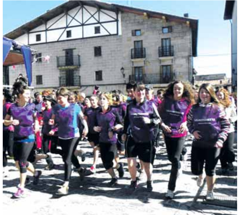
2014an 122 emakume inguruk parte hartu zuten Lilasterketan.

Murchantera joateko autobusa antolatu da Arbizun. Autobuserako eta bazkarirako izena ematea betiko tokietan egin behar dela adierazi dute antolatzaileek.