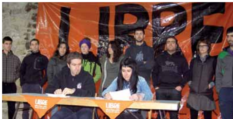
Hainbat sakandarrek aurkeztu zuten Libre eguna.

Sakanako Libre dinamika antolatu du biharko Etxarri Aranazko egitarua. Herri aske batean pertsonak libre! Elkartasunetik konpromisora leloa du. Euskal Herriaren erabakitzeko eskubidea eta horren aldeko lan politikoa ezabatzeko epaiketa politikoa egiten direla eta haietan oina-