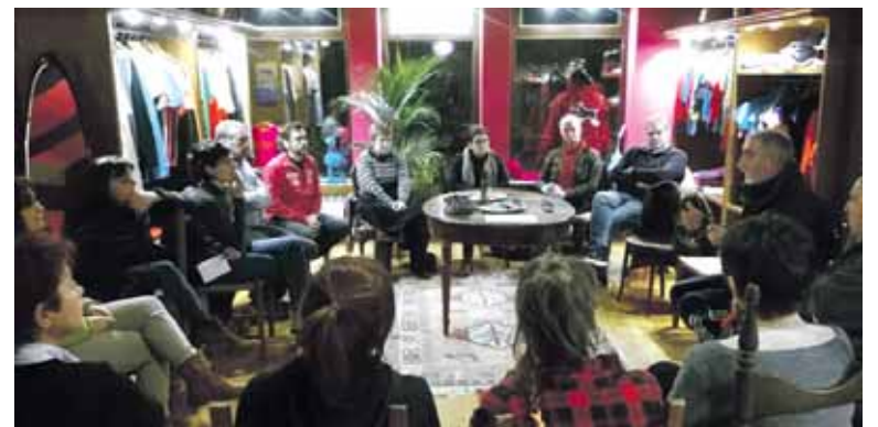
Basoko Mari artisau gunean Bidelagun elkarteak egindako aurreneko topaketa

ko topaketa Kepa Junkera trikitilariaren musika ibilbideari aitortza egiteko baliatuko du. Hark "kulturari egindako ekarpena eta nortasuna tradizioetik modernitatera proiektatzeko izandako gai-