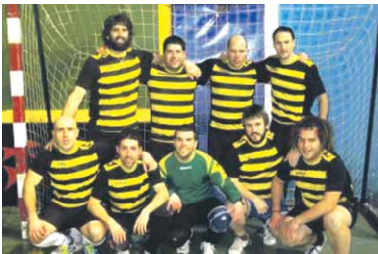
Auzomotojorik taldeak sartu zituen gol gehien final laurdenetan.