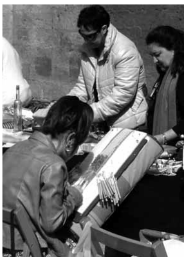
Ehizirikin lanean.