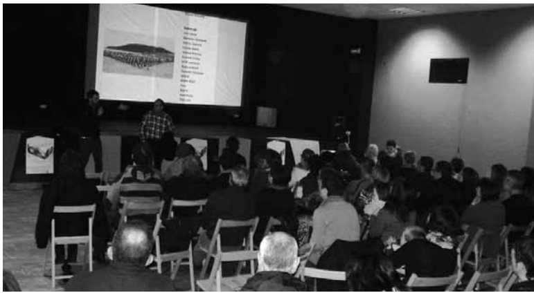
Lakuntzako kultur etxea bete zuen Gure Esku Dagok.