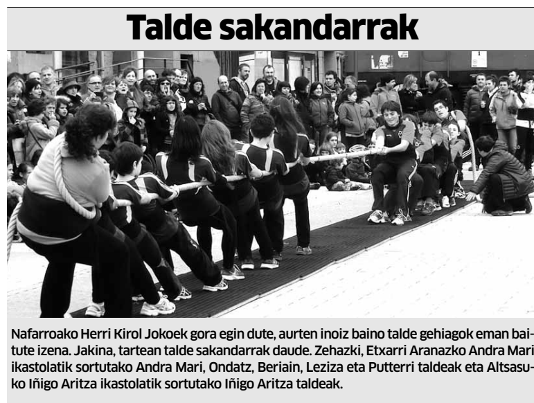
Nafarroako Herri Kirol Jokoen gora egin dute, aurtan inoiz baino talde gehiagok eman baitute izena. Jakina, tartean talde sakandarrak daude. Zehazki, Etxarri Aranatzko Andra Mari ikastolatik sortutako Andra Mari, Ondatz, Beriain, Leziza eta Putterri taldeak eta Altsasuko Iñigo Aritza ikastolatik sortutako Iñigo Aritza taldeak.

Igandean lehen jardunaldia jokatu zen Altsasuko Burunda pilotalekuan. Kimuen proba konbinatua 4 multzotan banatuta aritu