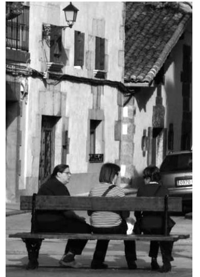
Uhartearrak plazan.

Uharte Arakilgo Udalak pasa den osteguneko bilkuran Emakumeen Nazioarteko Eguna dela eta adierazpen instituzionala onartu zuen. Udalak "emakume eta gizon askeen Euskal Herriaren alde lan egiten jarraitzeko" konpromisoa hartu zuen. Horretarako, Uharte Arakilen "biolentziarik gabeko bizitza bizitzeko eremuak izateko bitartekoak" jarriko ditu. Aldi berean, udalak emakume elkarte eta mugimendu feministarekin elkarlana bultzatuko du. Azkenik, "emakumeek bizitzeko merezi duten bizitza duinak izateko politikak" garatuko ditu. Aldi berean, udalak Martxoaren 8an Uharte Arakilen eta Sakanan mugimendu feministak deituriko mobilizazio eta jarduerekin bat egiten du. Uharte Arakilgo Udalak onartutako adierazpenean merkatuek sortutako krisiak "urteetako borrokaren bitartez irabazitako eskubideak galtzeko arriskuan" jarri dituela salatu du. Ekonomiaren oinarrian emakumeek egindako etxeko lanak eta zaintzak daudela eta sistema kapitalistak haiek "ezkutuan utzi eta aitortpenik onartu gabe, gutxietsi" egiten dituela nabarmendu dute udalean. Emakumeek lan merkatuan duten tokia "marjinala" dela eta esplotazio bikoitza pairatzen dutela adierazi dute Uharte Arakilgo Udalean. "Emakumeek bizitza duina izateko sistema kapitalista eta patriarkatu gaitzitu beharra inoiz baino agerriago dago". Udaletik "patriarkatuaren zutabea den familia-eredu tradizionala, heteropatriarkala, indartzeko neurriez" gaitzitu dute, indarkeria matxista salatzearekin batera.