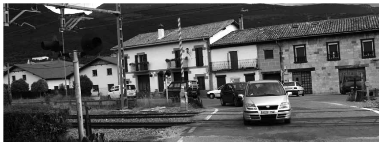
Pareko etxeetatik kontzeju-etxera espaloia egingen da.

Aurten ez bada, heldu den urtean Geltoki eta San Juan auzoak lotzen dituen errepidean oinezkoendako espaloia izanen da. Egungo trenbide pasagunean hasi eta forjarien etxetik kontzeju-etxeraino iritsiko dena. Espaloi hori trenbide pasagunea kentzeko lanekin batera egingen du Nafarroako Gobernuak. Lanak bukatzean Izurdiagako bi auzoak batzen dituen kale hori udalaren jabetza izatera pasako da.