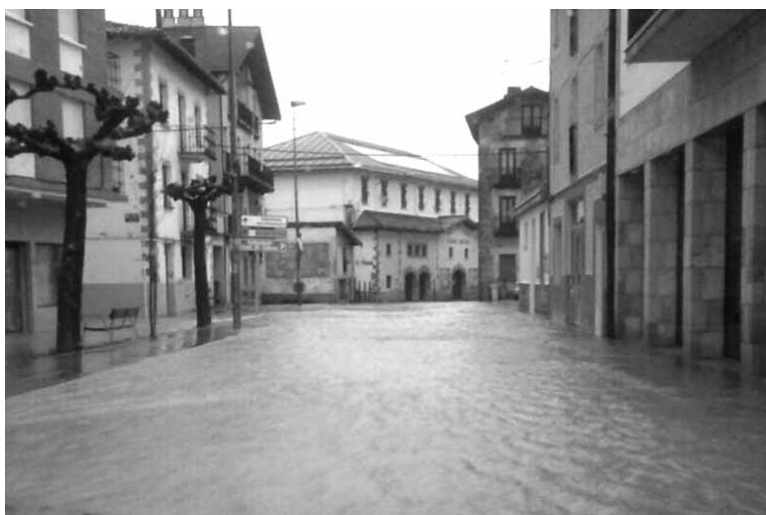
Kale Nagusia urpean.

Troskerako erreka Urbasako portutik behera jaisten da. Olatzagutira iritsita, Arronga plaza ondoran, Ingurabide kalean, sartzen da lurpean eta ibairatu aurretik Errekalde, Larratxota, Nagusia, Pelotalekupe, Sacti Spiritu eta San Francisco kaleak lurpetik zeharkatzen ditu. Bestalde, Erburua aldetik jaisten den errekek ere lurpetik zeharkatzen du herria, Troskerakoarekin San Francisco kale azpian bat egin eta Arakil ibaian bukatu arte.