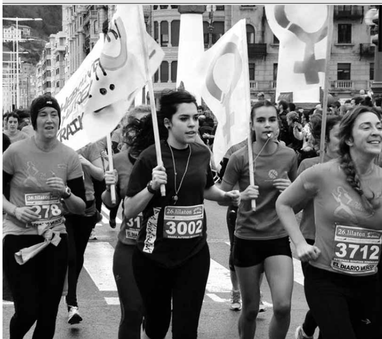
Martxoaren 15ean jokatu da Altsasuko II. Lilasterketa, emakumeendako lasterketa parte-hartzaile ez lehiakorra (4 km). Izena ematea zabalik dago www.dantzalekusakana.com web gunean edo Emakumeen Bilgunean (948 564 823), dohainik.