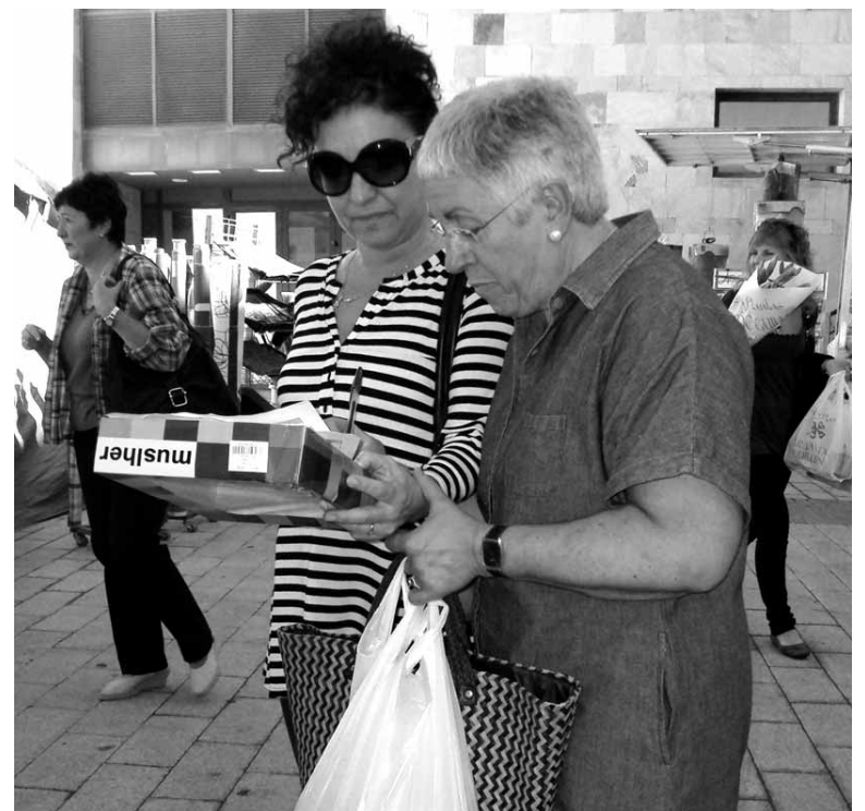
Emakumeak azokan. ARTXIBOA

Altsasuko Udaletik gaztigatu dutenez, "gizonak, baina, ez dira proportzio berean sartu ardurakidetzaren eta zaintzaren esparru pribatuetara". Bestelako arazoak ere ez direla konpondu nabarmendu dute udaletik: "lan-segregazioa, kristalezko mugak eta soldata-arraillak; gainera, eskasak dira etxeko lanetarako eta bateragarritasunerako baliabideez hornitze-ko zerbitzu-politikak".