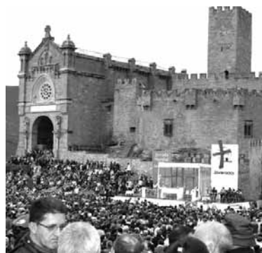
Xabierko gaztelua beteko da atzera.

Larunbatean hainbat sakandarrek Zangozako bidea hartuko dute, han loegin eta igande goizean, 8:00etan, Xabierrako gurutze bidean parte hartuko. Gazteluko zelaian meza 10:00etan izanen da. Bigarren Xabierraldia heldu den larunbatean izanen da. Gurutze bidea 15:00etan abiatuko da Zangozatik eta meza 17:00etan izanen da. Xabierraldiak herenegun hasi eta 12an bukatuko den graziaren bederatzirrenaren barruan daude. Hala, asteartean Mendialdetik Xabierrako erromesaldia antolatu da eta elizkizun elebiduna egingen da.