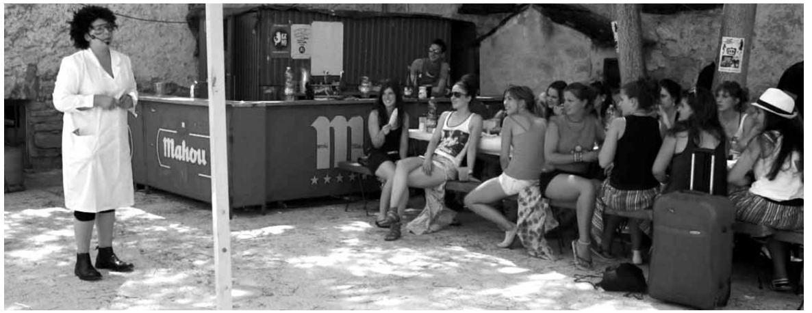
Barazki Gunean festetan, bazkariaren ondoren, egindako ekitaldia.