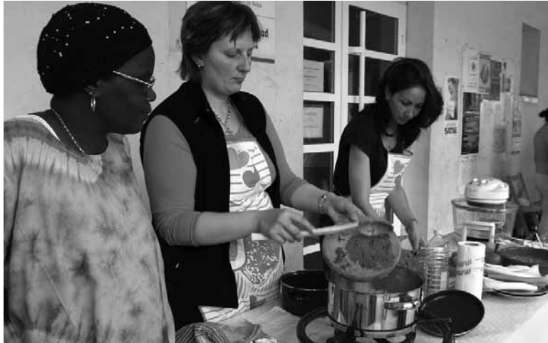
Irurtzundar guztiei zuzenduta dago jardunaldietako egitaraua.

Emakumeen Taldeak Irurtzungo Kultur Kontseiluarekin batera antolatu duen egitaraua hilaren 20ra arte luzatuko da. Ikus-entzunezkoek aparteko pisua dute aurtengo jardunaldietan. Asteburu honetan, esaterako, egunero emanaldiren bat iza-