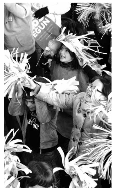
Irurtzango lip-duba.

kararen normalizazioa helburu duten erakundeek, Sakanakoak edo ibarrean jarduten dutenak, aurkeztu ditzakete eskaerak. Mank-ek 5.000 euro bideratu ditu. Eskabideak Mank-eko Lakuntzako egoitzan hilaren 31 baino lehen aurkeztu beharko dira. Eskatzaileek eskabide osatuarekin batera, IFKaren kopia, egin nahi den jardueraren plangintza xehatua, haren sarreraren eta gastuen aurrekontua eta beste erakundeei egingadako diru-laguntza eskaeren aitorpena aurkeztu beharko dute.