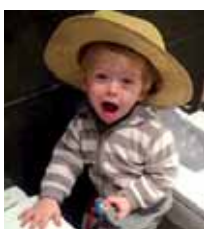
Adei Lazkoz Senar Lehengusu polittennai eta jatorrenai gurdikada muxu eta gurdikada zorion. Haizea eta Aitorren partetik.