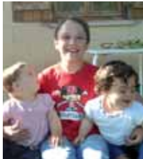
Izai ZORIONAK familia osoaren partez, zure 10. urtebetetzean!! Muxu asko.