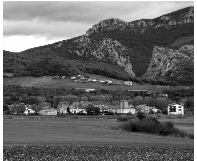
Etxarrengo eta Etxeberriko ikuspegia Ekaitik.