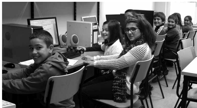
Ikasle iturmendiarrak informatika gelan.

Dindaia fundazioari esleitu dio Sakanako Mankomunitateak Lehen Hezkuntzako ikaste-