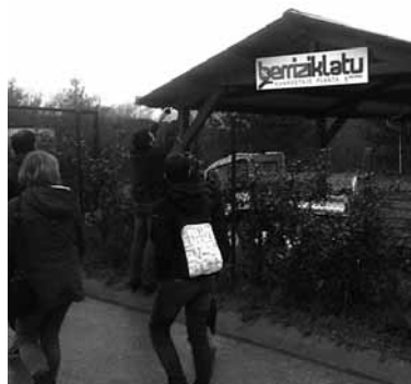
Konpostagailura bisitan. UTZITAKOIA

Larrabatzun baserritarrek kudeatzen dute materia organikoaren bilketa eta tratamendua, gero sortzen duten konposta herriko nekazaritza lurretan erabiltzeko. Nekazarien parte hartzea ezagutzeko Sakanako EHNEko kide bat joan zen. Berriz herrian, bestalde, konpost planta txiki baten bidez kudeatzen da materia organikoa. Bai bata bai bestea proiektu pilotu gisa ari dira lantzen eta haiek zabaltzeko asmoa dute. Sakanako ereduaren berri ere jasodute.