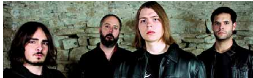
Allowance taldea ariko da larunbatean, 22:30ean Altsasuko Gaztetxean.

Sakanan antolatzen diren ekitaldien berri emateko: gutunak@guaixe.net