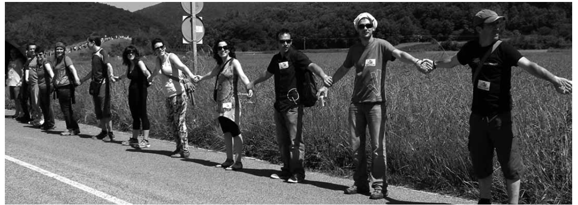
Garagarriaren 8an makina bat sakandarrek parte hartu zuten Gure Esku Dagoaren giza katean.

antolatutako giza katea. Hain zuzen, ekimen hari eta erabakitze eskubideari buruzko hainbat iritzi jasotzen dituen Jostunak dokumentalaren Sakanako