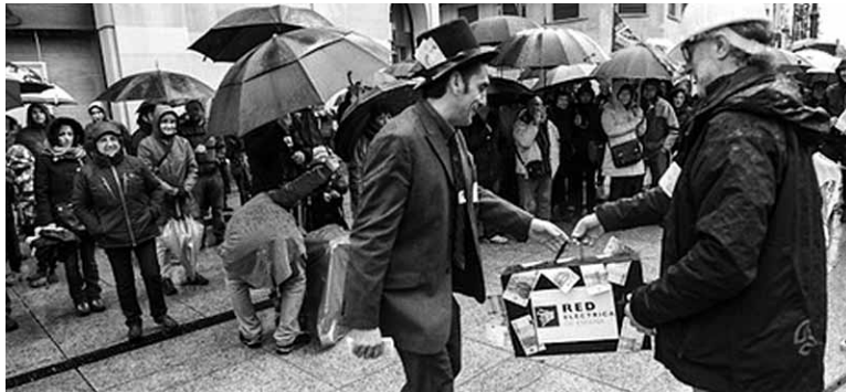
Argindar librea eta ate birakariei buruzko parodia. UZTITAKOIA

216 toki-erakunde egitasmoa bertan behera uzteko eskatu dute-