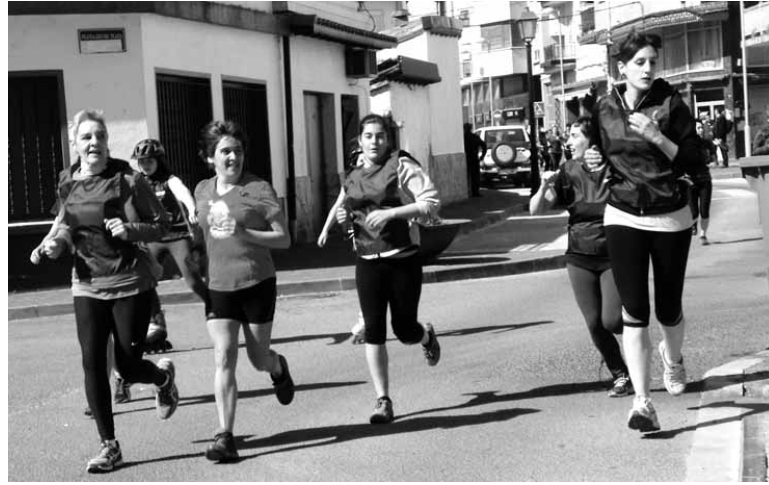
Aurreko urtean 122 emakumek parte hartu zuten Lilasterketan.

Helburua emakumeen parte-hartzea sustatzea da, adin guztietako emakumeena. Probak San Silbestrearen ibilbide bera izango du, 4 km ingurukoa, Foru plazatik aterata. Bukaeran parte-hartzaileendako hamaiketako izanen da. Aurreko urtean Lilasterketa arrakastatsua izan zen: prestatutako 100 petoak amaitu ziren. 122 emakume izan ziren aritu zirenak.