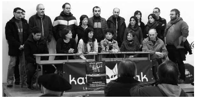
Nafarroako euskalgintzako eragileek Donostiara joateko deia egin dute.

Kontseilutik gainontzeko udalei eta administrazioei euskararen normalizazioaren aldeko beharrezko neurri eraginkorrak hartzen hasteko eskatu die. Hainbat udalek "konpromiso irmoa