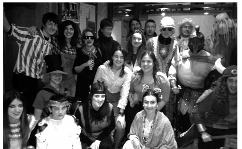
Hiriberri denetarikoz mozorroak izan ziren. UTZITAKOIA