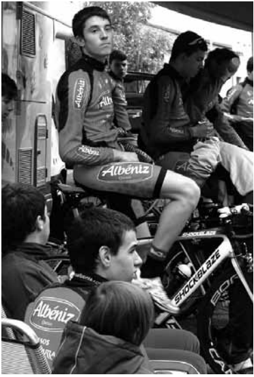
Burundako txirrindulariak 2014an.