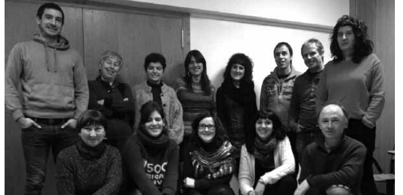
Sakandarrekin batera Nafarroako Kontseiluko eta EHEko kideak.

Oztopoen ginetik, euskaraz biziko gara. Lelo horrekin larunbatean, 17:30ean, Kontseiluak deitu duen manifestazioan parte hartzeragorbidatu dute. Korrika Batzordeak. Euskararen aldeko lasterke-ta martxo akaberan abiatuko da. Hura behar bezala antolatze-ko herrietako batzordeetan eta haiek