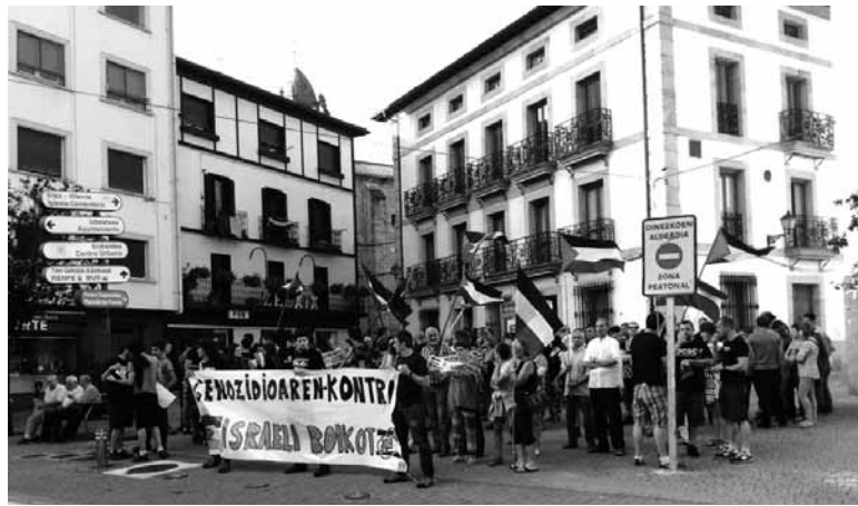
Askapenaren palestinarren aldeko kontzentrazio bat.

zionalistak nazioarteko brigaden antolakuntzarekin segitzen dela jakinarazi du, erakundearen kontrako epaiketa aurki egingen dela jakin arren. Joan den urtean Argentina, Uruguay, Venezuela, Bolibia, Palestina, Saharar lurralde okupatuak, Gaztela, Aragoi eta Herrialde Katalanetan izan ziren Askapenako brigadistak. Herrialde horiei aurten Galizia, Mexiko, Brasil eta Kurdistan gehitu dizkio. Askapenarekin brigadista izan nahi duenak martxoaren 31ra arteko epea du izena emateko.