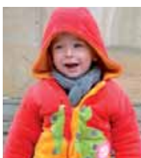
Adei Lazkoz Senar Gue pottokuek iyendien bi urte ingo dituu. ZORIONAK jatorra, segi guai artie be-zein alai ta maitekor. Familia denan partetik.