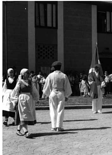
Dantzariak 1998an dantzan.

Ukrainarako bidaiaria hark lau milioi pezetako (24.040 euro) aurrekontua izan zuen. Horretarako dantzari-herrietako festetan barrakak jarri zituzten eta dantza jaialdia antolatu zuten herrian. Hurrengo urtean Ukrainako dantza talde bat Altsasuko festetan aritu zen dantzan. Aurretik jaki ez galkorren bilketa egin zuen dantza taldeak altsasuarren artean, ukrainarrek eraman zezaten. +www.guaixe.eus