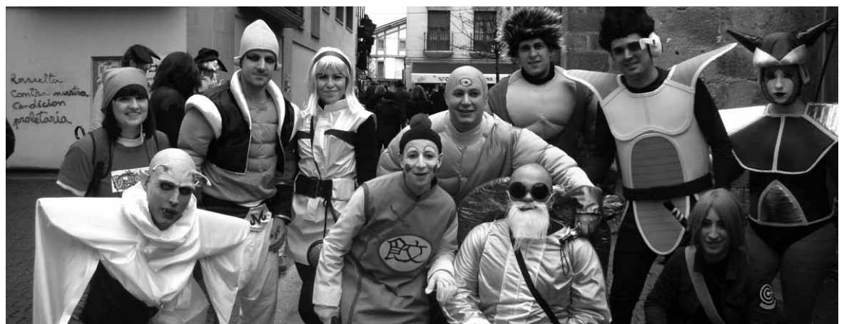
Altsasun super-heroiekin batera makina bat mozorro gehiago izan ziren. Argazki gehiago: www.guaixe.eus .