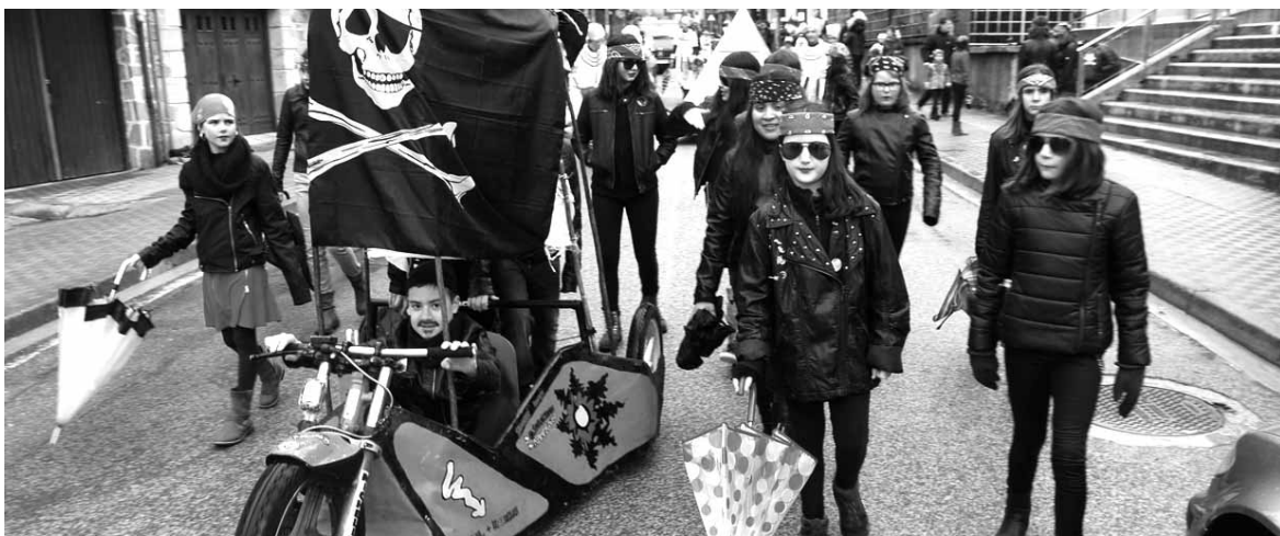
Olaztin opatu genuen motor-zale koadrila hau. Olaztiko argazki gehiago www.guaixe.eus .