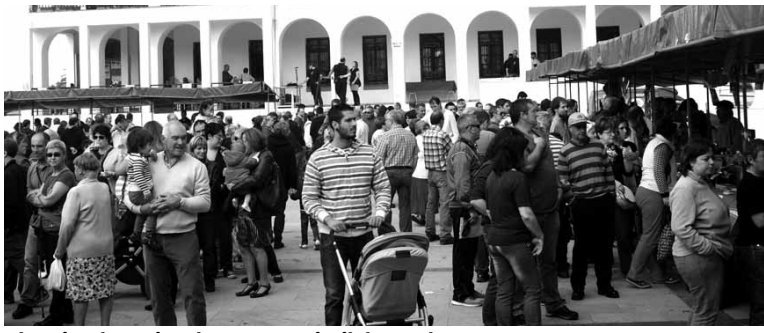
Plaza jendez gainezka egon zen iraileko azokan.