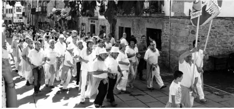
Peñetako kideak kalejiran.

Hala, batzarren lehen zatian festa egutegiari buruzko argudioak emanen dira eta bigarrenean proposamenak. 22ko batzarrean erabakiko da herri-galdeketa eginen den galdera. Aldi berean, batzarrak erabakiko du festen data mantenduko den edo aldaketa egingen bada aurtengora den baka-rrik edo betirako.