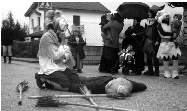
Ihabarko Landarraren kezka. Gehiago: www.guaixe.eus . MAIALEN HUARTE ARANO