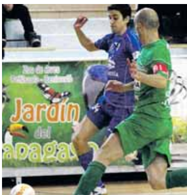
Eseverrik goletako bat sartu zuen.