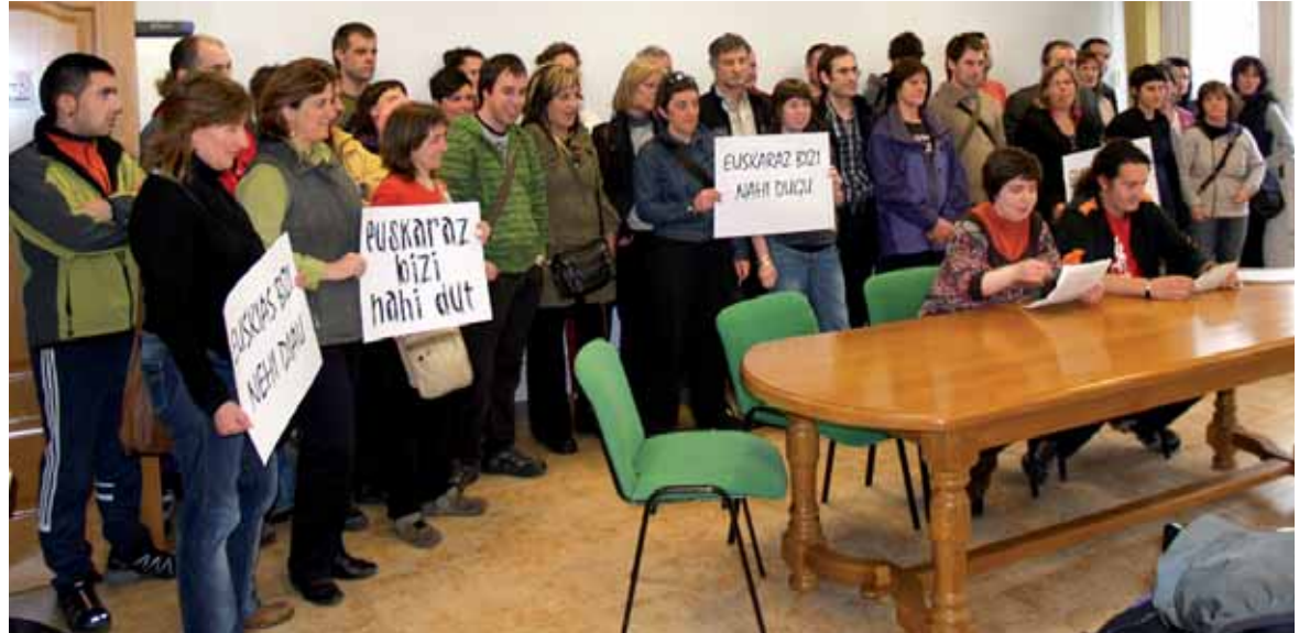
Sakandarrak euskaraz bizi nahia prentsaurrekoan adierazten.

Bihar, 10:30ean, Etxarriko kultur etxean. Lehen orduan Kontseiluak apirilaren 25erako Iruñeko Anaitasun antolatutako duen ekitaldiaren berri emanen da. Bigarrenean, berriz, Sakanako euskalgintzaren lehentasunak markatuko dira, alderdiei helarazteko