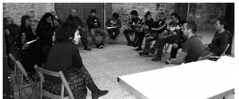
Karta prestatzeko Sakanan batzarrak egin ziren, tartean Altsasan.

“aliantza sindikal eta sozial indartsua behar da, proposamenak egin eta lehentasunak adosteko gaitasunarekin”. Zeregin horretan “Karta oinarritzko tresna da, Euskal Herrian ezartzen diren politikak errotik aldatzeko beharrezko abiaturik eta gure gizarte eredu alternatiboa jasotzen duena”. Gobernuak ezarritako “politika antisozialek pobrezia eta aberas-