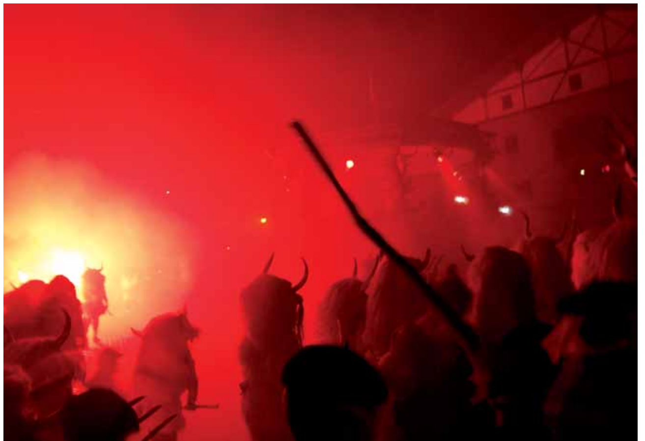
Astearte ihoteak irudi ikusgarriak utzi zituen. Ez gorde mozorroa, asteburuan ihote festek segida dutelako.