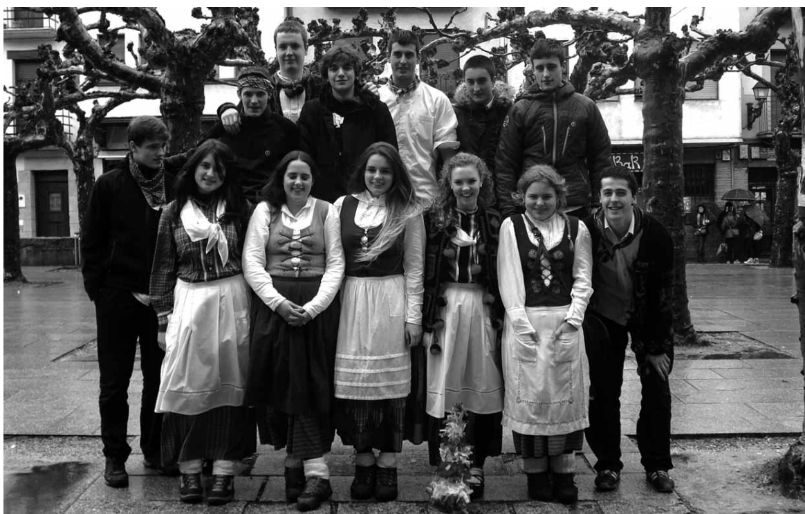
Etxarri Aranazko kintoak.