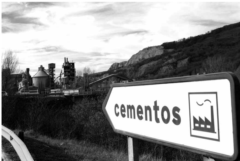
Cementos Portland Valderrivasek Olatzagutian duen porlandegia.

Zelaia salatu duenez, plan berria prestatzeko Nafarroako Gobernuak bildutako txostenen artean errefusa diren hondakinak erretzearen aldeko bat dago. "Sortzen dituzten Hondakinetatik Eratorritako Erregaien arabera sailkatzen ditu txosten horrek hondakin tratamendu sistemak,