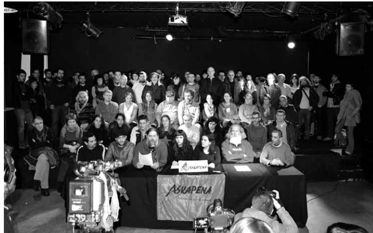
Auzipetuek Askapenako kideekin batera emandako prentsaurrekoa. UTZITAKOIA

Agerraldian bost auzipetuek Askapenako 80 kide baino gehiagoren babesa izan zuten eta adierazi zuten: “internazionalismoa Euskal Herriaren askapen prozesuko ezinbesteko ardatza dela ulertuta lanean jarraituko dugu”. Auzia salatzeko ekimenak eginen dituztela iragarri dute erakunde internazionalistatik.