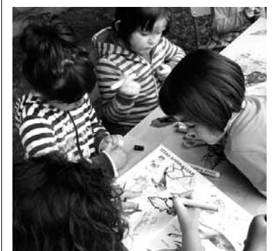
Haurrak jolasean.

Lakuntzako Luis Fuentes ikastetxe publikoa eta Burundako Iñigo Aritz ikastola, Nafarroako beste 88 ikastetxerekin batera, Lehen Hezkuntzako 4. eta 5. mailan software-ko programazioa erakusteko proiektu batean parte hartzen ari dira. Haren bidez ikasleei informatika-programak diseinatzeko (software) eta robotikako aplikazioetan erabilitako lengoian idazten erakutsi nahi zaie. Bai Lakuntzan bai Altsasan ikasleak robotikan prestatzen eta Scratch lengoiaarekin programazio-proiektuak garatzen dituzten irakasleak daude eta, horri esker, era oso bisualean, jolas, istorio eta animazio interaktiboak sor daitezke.