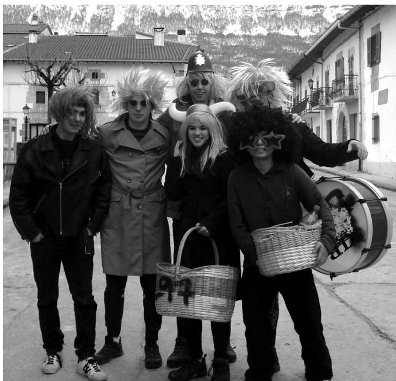
Uharte Arakilgo kintoak.