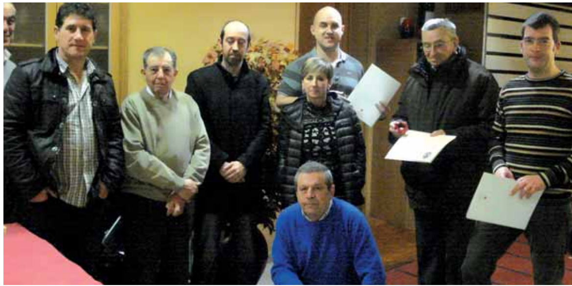
Etxarrin aitortza jasotako odol-emaileak eta haien ordeztasunak Adonako ordezkariarekin batera.