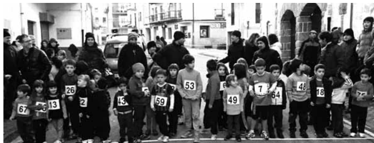
Olaztiko San Silbestrean 100 korrikalari inguruk hartu zuten parte.