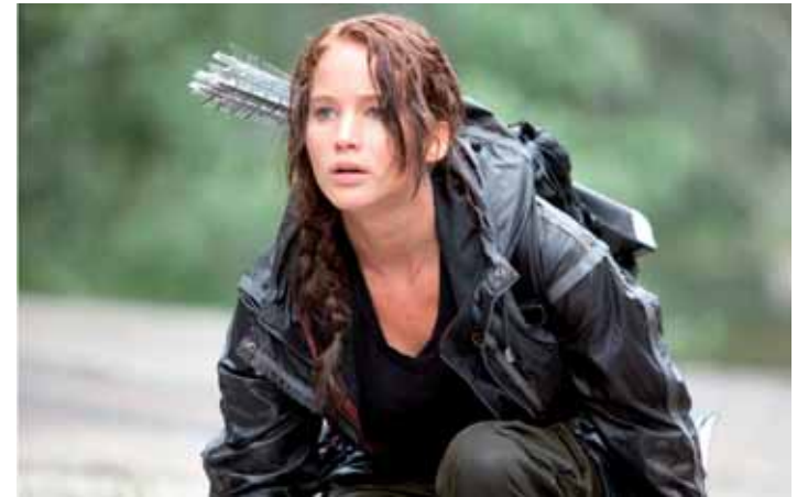
Los juegos del hambre Iortian ikusgai.

domekan, 9:00etan Altsasuko Zumalakarregi plazatik. 46 km. Burunda klubeko mendi bizikleta taldea.