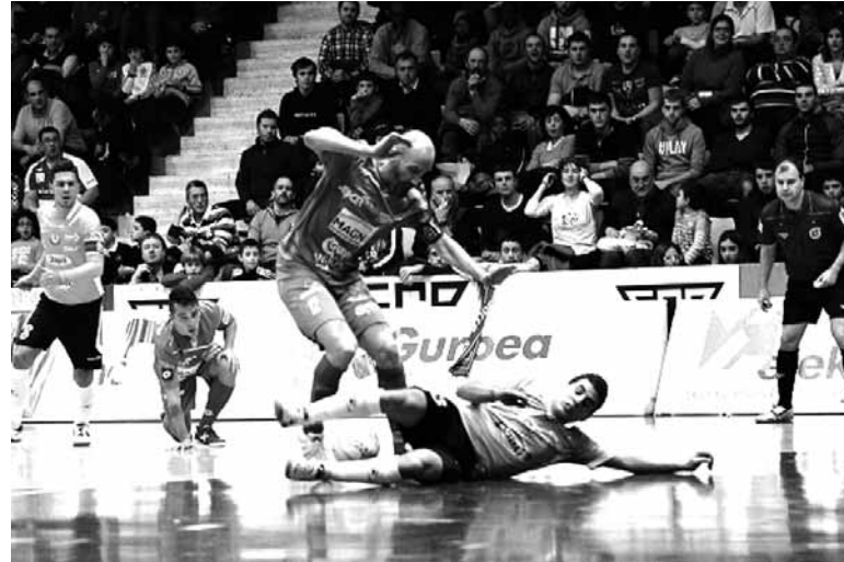
Magnak seigarren postua lapurtu zion Aspil-Vidal Tuterako taldeari.

Zaleek emandako babesarekin eta sortutako giroarekin oso esker-