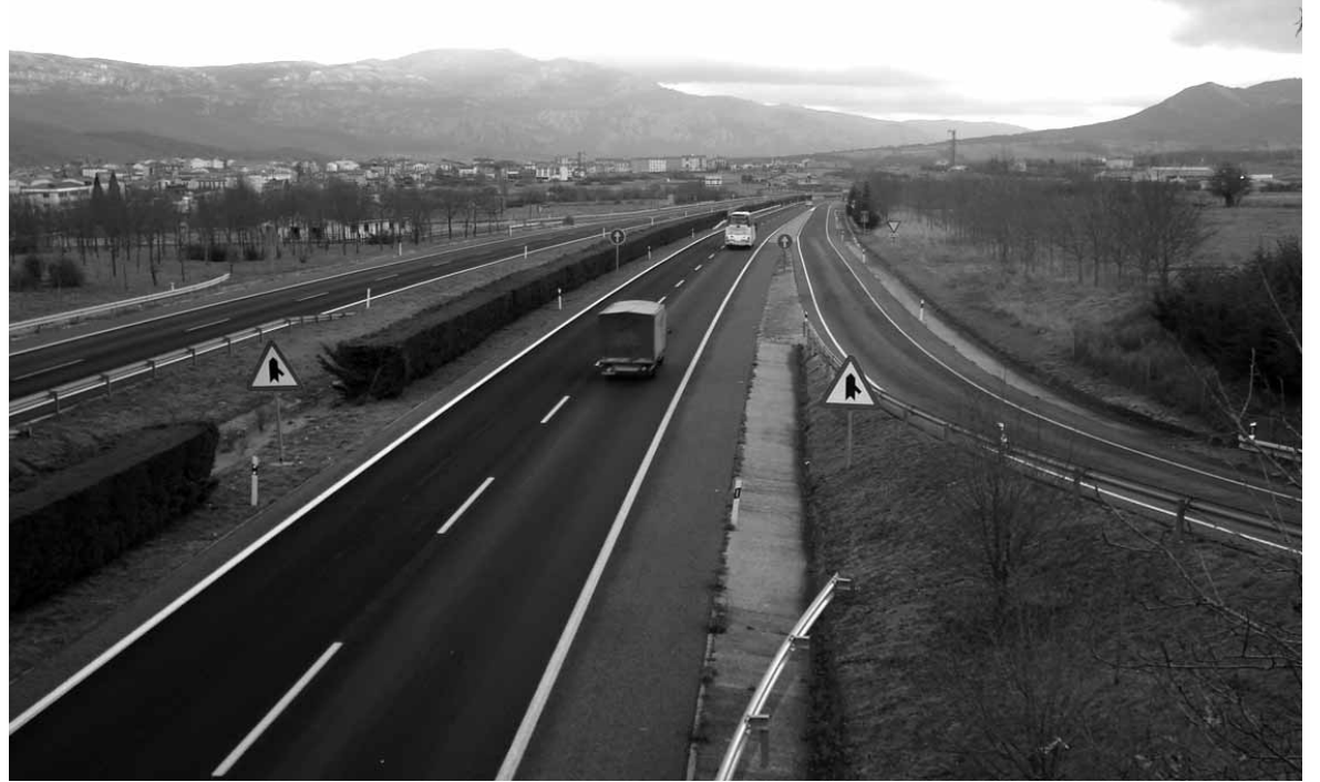
Sakanako Autobia Etxarri parean. Zoru berriak gidarien kexak ekarri ditu.

Gobernuak hotzean zabaldua-ko mikroglomeratuarekin berritu du autobiako zorua. “Kostu txikiko eta balio estetiko handiko tratamendua da, zerbitzu aldian zehar zoruaren bizitza baliagarria luzatu dezakeena”. Gobernutik erantzun dute zoruaren eta gurpilen arteko heltzea hobetu dela eta horrekin bide segurtasuna. Ruizek azaldu duenez, Sakanako Autobiako (A-10) beste zoru zati batzuk modu berean konpondu dira, “argi geratuz egokia dela”. Hala ere, aitortu duenez “egungo drainatze-tipologia aldatzen du eta ondorioz,