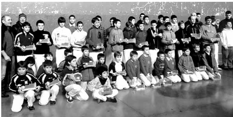
Aurreko urteko txapelketako sari ematea, Lakuntzan.

Sakanako Pilota Txapelketaren finalak jokatuko dira bihar, larunbatean, Arbizon eta Lakuntzan