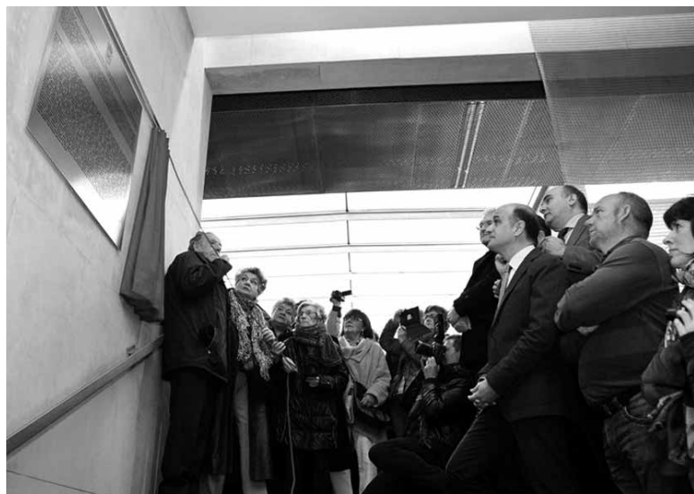
Errepresaliatuen senideak plaka agerian uzten. UTZITAKOIA