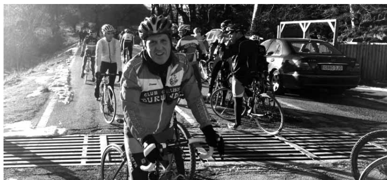
Urbasako portua igo zuten txirrindulariek urteko azken egunean. SDA