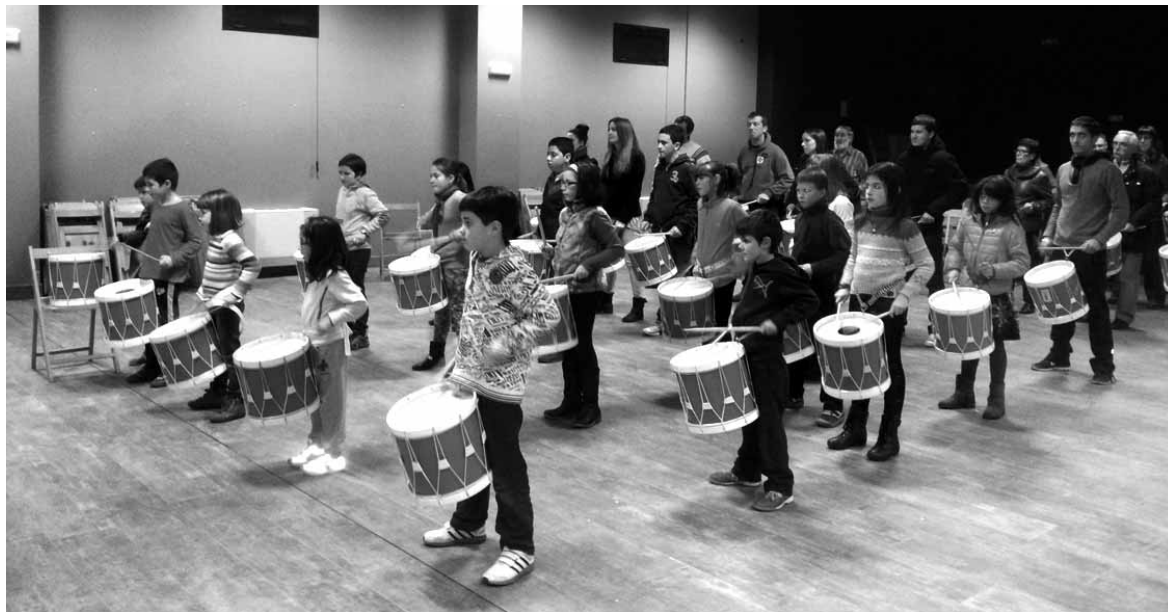
Aste osoan entsegutan egon dira astelehen iluntzean denak behar bezala jotzeko.