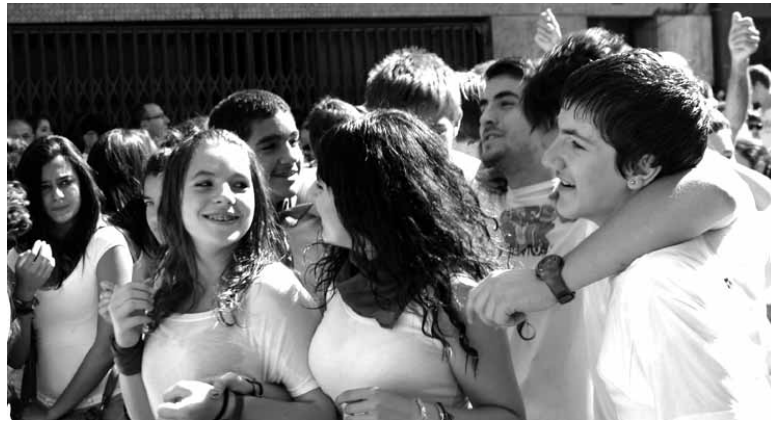
Neska-mutilak festetako etxajua lehertu berriren.