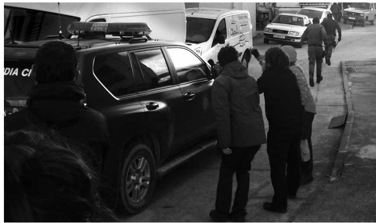
Herritarrek Baldari animoak ematen.

Ministerioak zabaldu duenez, "Herrirako diruzain gisa atxilotutakoek legez kanpo utzitako Amnistiaren Aldeko Batzordeak