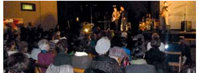
Herriko musikariek emanaldi ederra eskaini zuten zinearen mustutzean.