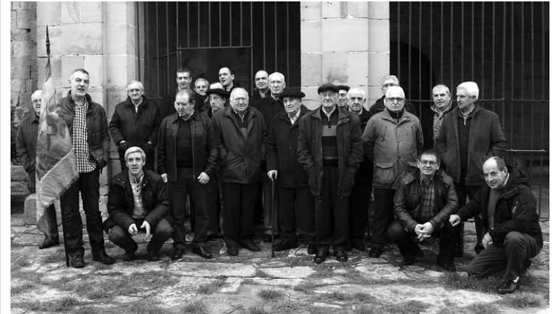
Iturmendiko kofradiak 325 urte inguru ditu. ARTXIBOA