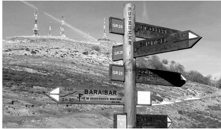
GR-ak markatu eta mantentzeko lan handia egin dute ere Sakanako mendizaleek.

Aspalditik abisatzen ari da Nafarroako Mendi Federazioa, ezin duela gehiago bere gain hartu Nafarroako Ibilbideen Sareko mantenua. Izan ere, Nafarroako Gobernuak da ibilbide horien sustatzailea. Gobernuak diru-laguntza ematen zion mendi federazioari aipatu ibilbideen mantenu lana egin zezan, eta federazioko 180 boluntariok egiten zituzten mantenu lanak: mendi ibilbideetan seinaleztapena jarri, mendizaleak