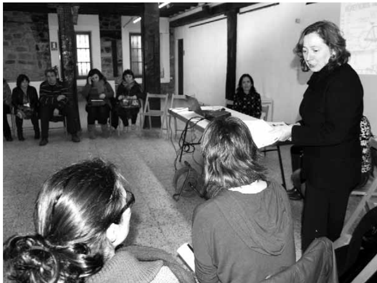
Cederna Garalurrek ekintzailetasunari buruz antolatutako jardunaldia.