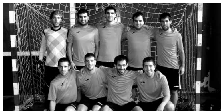
Bunker taldea da Futsalsakana Txapelketako lider berria.