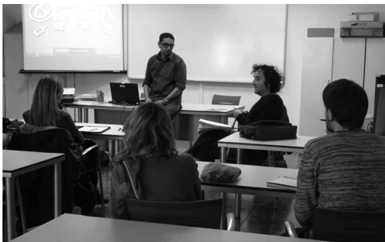
Herenegun langabeek Batutako esperientzia ezagutzeko aukera izan zuten.