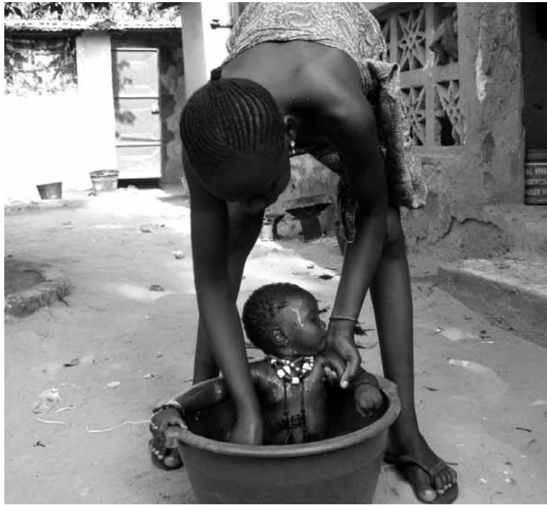
Ama umea garbitzen Senegalen. UTZITAKOIA

Senegalen osasun arreta ez da doakoa eta herritar gehienak ez dute nahikoa dirurik kontsulta, erradiografia edo botikak ordaintzeko. Beraz, antibiotikoekin edo sendaketa arrunt batekin senda daitekeen infekzio arrunt batek edo birusak heriotza eragin dezakete.