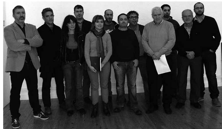
Xaloe euskalgintzako makina bat ordezkariaren babesa jaso du.

Xaloe Telebistak emititzen hasteko inbertsio handiari egin behar dio aurre. Garrantzitsuena seinale digitala zabaltzen duen multiplex emisorea da (etorkizunean Hamaika eta Abian telebistek erabili dezaketen). Seinalea Iruñerria guztian