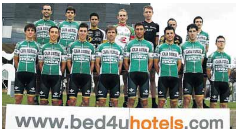
Talde profesional kontinentalak argazkia atera zuen. RURAL KUTXA

Rural Kutxa talde amateur sakan-darrak 24 txirrindulari izanen ditu