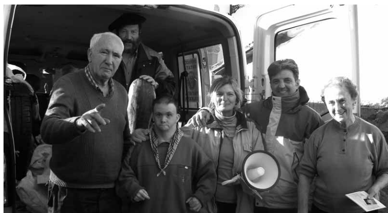
Iturmendiarek bat egin zuten Patata Operazioarekin.

Ezuste desatsegina ere izan zuten Alegria de Iruñekoek urdiaindarrak esan zieten hain izenean