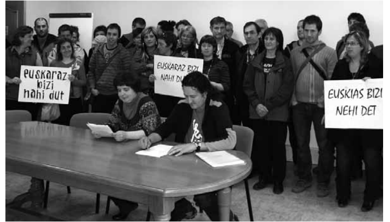
Sakanako euskaltzaleak Euskaraz bizi nahi dut manifestaziora deitu zutenean.

ra, Sakanako euskalgintzak bilgune bat sortzeko eta "elkarren berri izateko, egoeraren diagnostiko bateratu bat egiteko, eta sortzen diren arazoei batera erantzuteko". Deitzailek dioteenez, Sakanako euskalgintza bilgune horretan saretzeak "Sakanako euskaltzaleon kohesioa eta batasuna indartzea ekarriko du, eta erronka berriei elkarrekin heltzea".