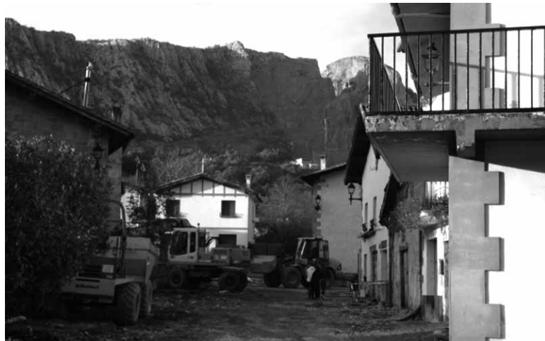
Lanengatik jasotako kaleetako bat.

Egin beharrekoan egin ondoren, zorua berritzeko porlana eta galtzadarriak erabiliko dituzte. Lanak hiru hilabetetan despedi-