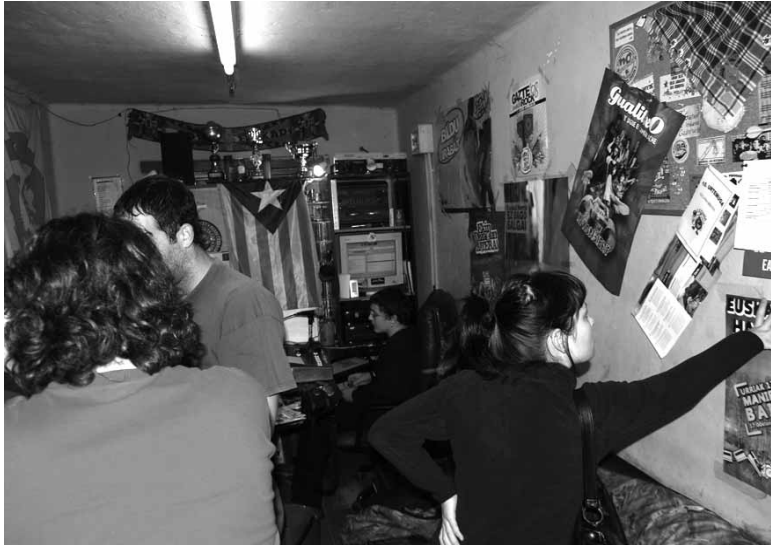
Iturmendiko estudiantek FM 107,7an igortzen ditu uhinak Eztanda Irratiak.

Bihar, 9:00etatik 24:00etara, makina bat saio entzuteko aukera izanen da FM 107,7an