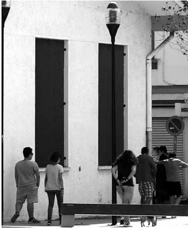
Gazteak kalean.

Gozamenez programak gazte-en sexualitatea propio eta begirune osoz adierazi nahi du, ikuspegi positibo, plural eta aberasgarri batetik abiatuta. Altsasuko gazte-ek proposatutako ekintzan izanen dira gaurtik aurrera garatuko direnak. Gazte altsasuarrak parte hartzera gonbidatu dituzte. Sakanako Gozamenez Batzordeak antolatu du programa, Altsasuko Udaleko Gazteria Zerbitzuaren, Iruñeko Gozamenez Batzordearen eta Osasunbidearen laguntzaz.