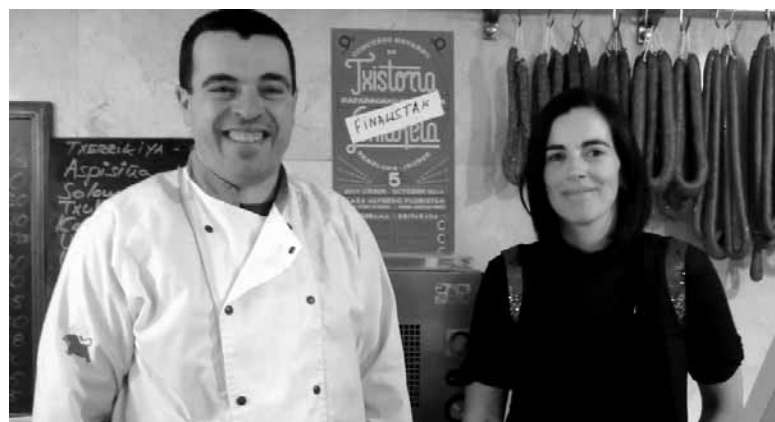
Iruñean jasotako aitortzarekin pozik zeuden harategian.