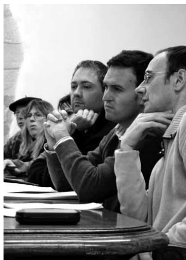
Udal bilkurako une bat.

NaBaiko ordezkariak ere PPko zinegotziaren jarrera "zorrotz arbuiatu" zuten eta "haren adierazpenengatik harridura azaldu zuten". Koalizioko kideak azaldu zuten hondakin bilketa sistema berria ezarri aurretik dudak sortu zirela, baina behin indarrean sistema garbia eta eraginkorra