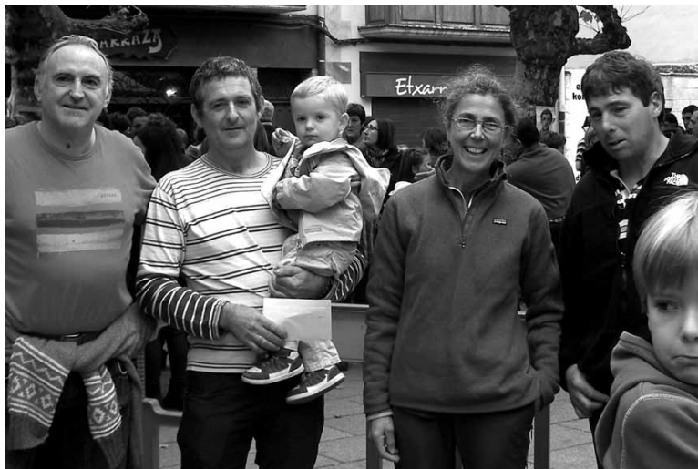
Etxarriko alkatea, saria jaso zuten hiru gaztagileekin batera.

Aipatutako ez aparte, Uhartegazta (Uhartegazta), Albi (Arruazu), Arana-Etaio (Arbizu) eta Amillano gaztandegia (Altsasu) lehiatu ziren.