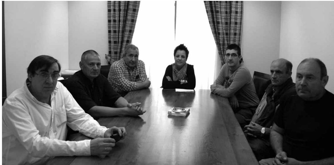
Ziordiko Udala eratu zen egunean.