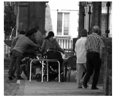
Uharterrak plazan. ARTXIBOA

guztia grabatu egingen da. Lipdubaren grabazioa despeditzeko auzatea izanen da. Udaleko Euskara Batzordeak eta Galtz-orratz dantza taldeak lip-dubaren grabazioan aritzeko grabatzeko gonbitea luzatu diete uharterrei. Sakanako Mankomunitatearen laguntza du ekimenak.