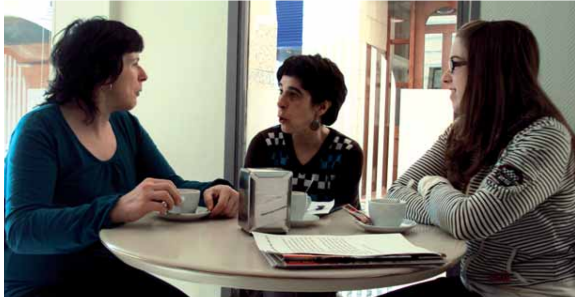
Astean ordu bat besterik ez da behar Mintzakiden parte hartzeko eta euskara praktikatzeko. ARTXIBOA

Mintzakide programa hazi ahal behar berriak sortzen dira, eta horren adibide da Gurasolagun. Euskarak segidarik izanzen badu ezinbestekoa da gurasoen eta seme-alaben arteko hizkuntza transmisioa. Familia barruko hizkuntza harremanetan eragiteko sortu da Gurasolagun. Bere helburua da egoera berean dauden gurasoak harremanetan jartzea. Berdin du plazan, parkean, aste-buruko txangoetan edo non den. Familia edo lagun giro guztiz euskalduna sortzen da, zeinetan gura-