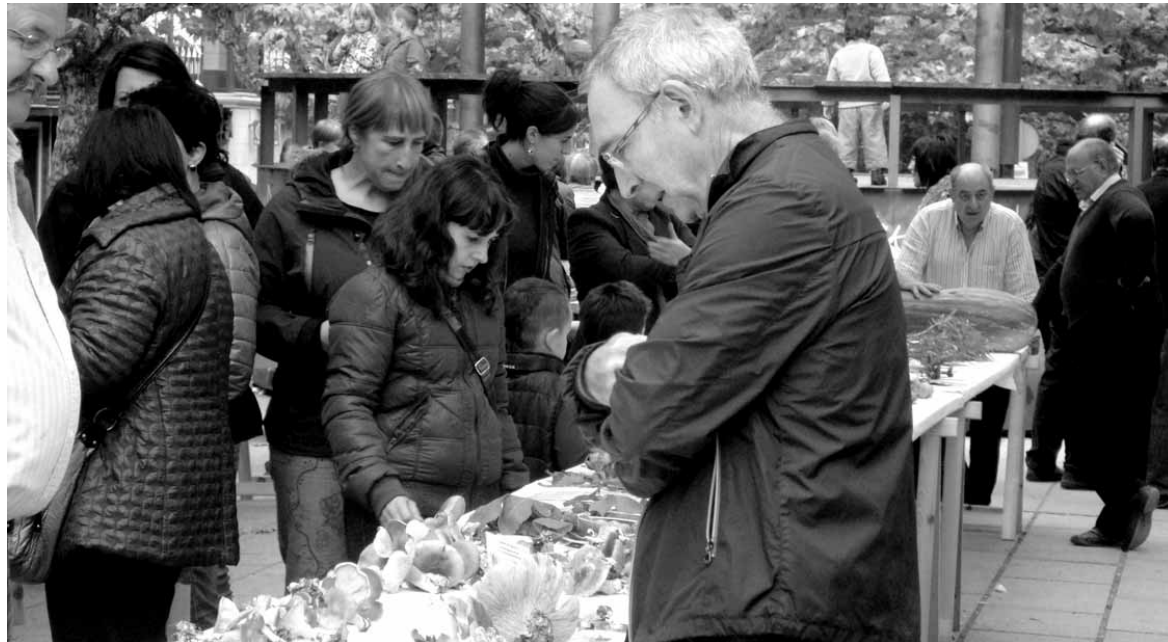
Eguraldiak lagunduko ez duela iragarri dutenez, plazatik frontoira aldatu da erakusketa.

Erakusketa antolatzen den etxarriar taldea bihar goizean joanen da basora. Han jasotako landare