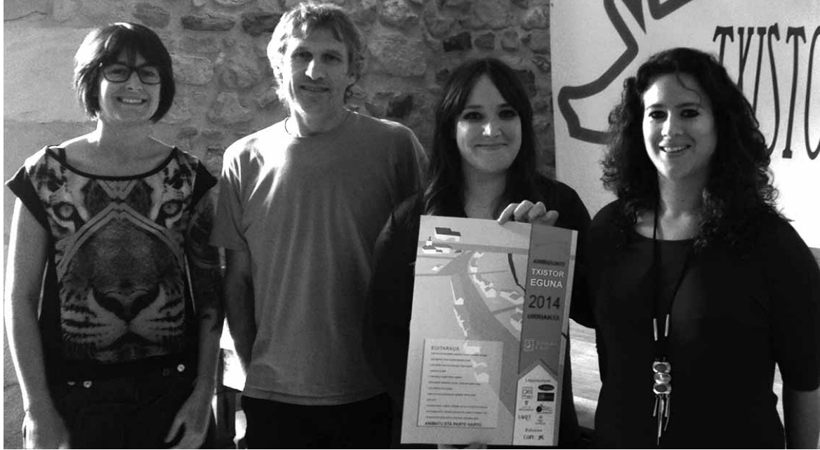
Udal ordezkariak guztia prest dute iganderako. Behean ikastetxeetako ikasleak atzo egindako talo eta txistor tailerlean.

Berrogeita hamar bat arbizuar ariko dira etzi Txistorra eguna aurrera ateratzeko lanean. Haiek askok txerriarekin zerikusia duten erakustaldietan parte hartuko dute. Guztiak ere eliz ondoko jolas parkean egonen dira. Alde batetik, txerria zatikatzen ikusteko aukera izanen da. Bestetik, tripota, txistorra, xaboi eta lixiba, txantxigorri, birrikak, txerri hankak eta belarriak egosteko tailerrak egonen dira. Azken bi produktu horiek egosi eta friji-