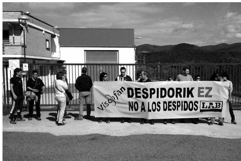
Sindikatu kideek lantegi atera eraman zuten aldarrikapena.

LABetik Viscofani "bere produktio interesak lehenetsiz aipatu arriskuak ezkutatzea" leporatu diote; "neurriak hartu beharrean egoera hau jasaten ari direnak zigortzea erabaki du enpresak". Sindikatuak enpresari arrisku horiek desagerrarazteko prebentzio neurriak hartzeko eskatu dio. "Kasu hau iceberg-aren punta besterik ez da, konpondu ezean beste langile batzuek ondorioak izan litzake". Lantegian "gertakizun larririk egongo balitz enpresarena izanen litzateke ardura bakarra".