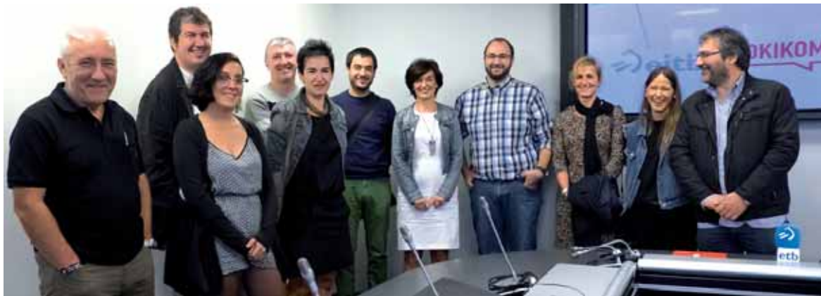
Tokikom-eko hedabideetako ordezkariek EITB-koekin batera, akordioa sinatu ondoren.