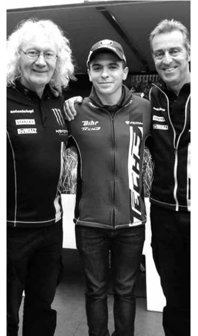
Alex Tech3 taldeko lankideekin.