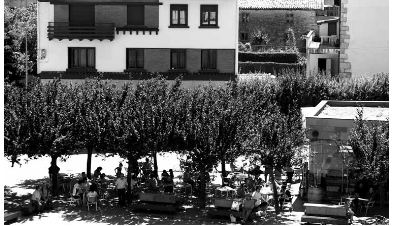
Irurtzundarrak itzalpean eserita.

Irurtzungo oinarritzko osasun eskualdea 1985eko legearekin sortu zenean ez zen gizarte-langile kargurik jaso eta lanpostu hori ez da sekula egon. Eskualdeak Iza (lau herri), Imotz, Larraun, Lekunbe-