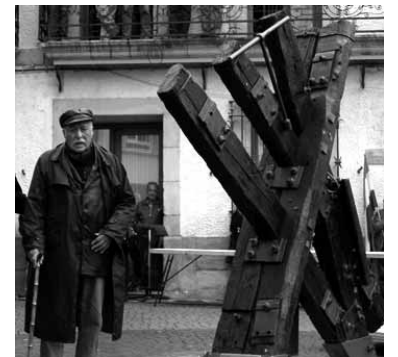
Arenalek mustu zuen eskultura 2008an

reak totalitarismoaren aurrean defendatzeagatik izan ziren pertsona horiek erailak, kartzelatuak edota errepresaliatuak". Urte askotan ahaztuak izan direla eta Altsasuko herriak errepresaliatu haiek bere oroimenean izatea "justizia, egia eta erreparazioaren izenean beharrezkoa" dela uste dute udalean. Aipatu hiru balore horietan elkarbizitza eraiki behar dela gaineratu dute batzordean.