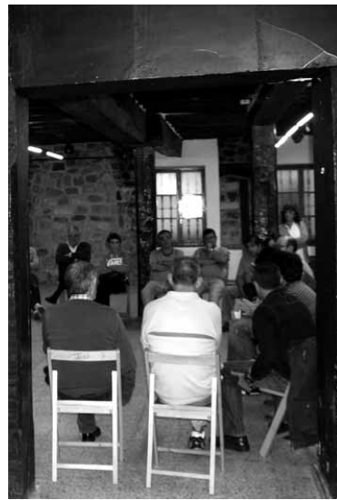
Deialdiak batu zituenetako batzuk.