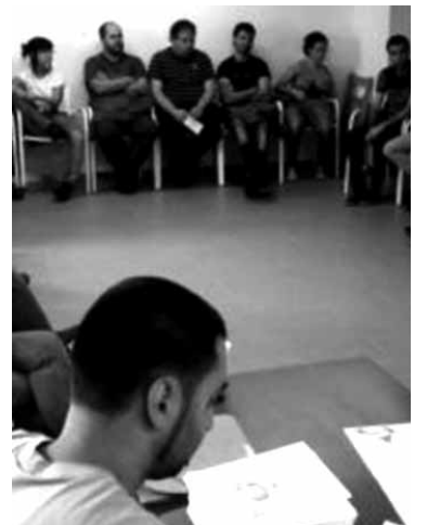
EHEko kideak bileran. UTZITAKOIA