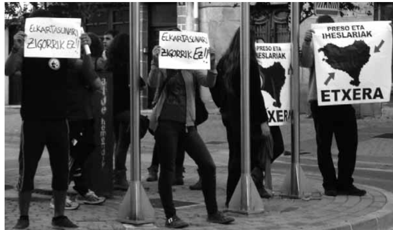
Zitazioengatik protestak egin zituzten aurreko ostiralean.

Espainiako Auzitegi Nazionalaren esku dago auzia. Hark Iruñeko epaile bati galderak bidali eta haren aurrean deklaratu beharko luke altsasuarrek. Horren zain gelditu dira altsasuarrek. Nafarroan udan izan diren ekitaldien-