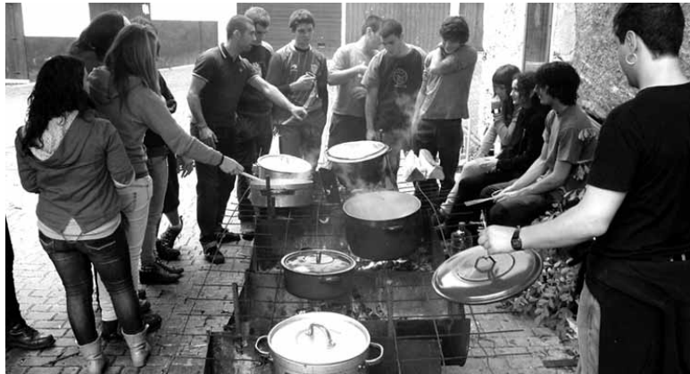
Lapiko artean ibiliko dira bihar eguerdian gaztetxe inguruan.

Gaur hasi eta domeka bitartean hainbat ekitaldirekin ospatuko da efemeridea