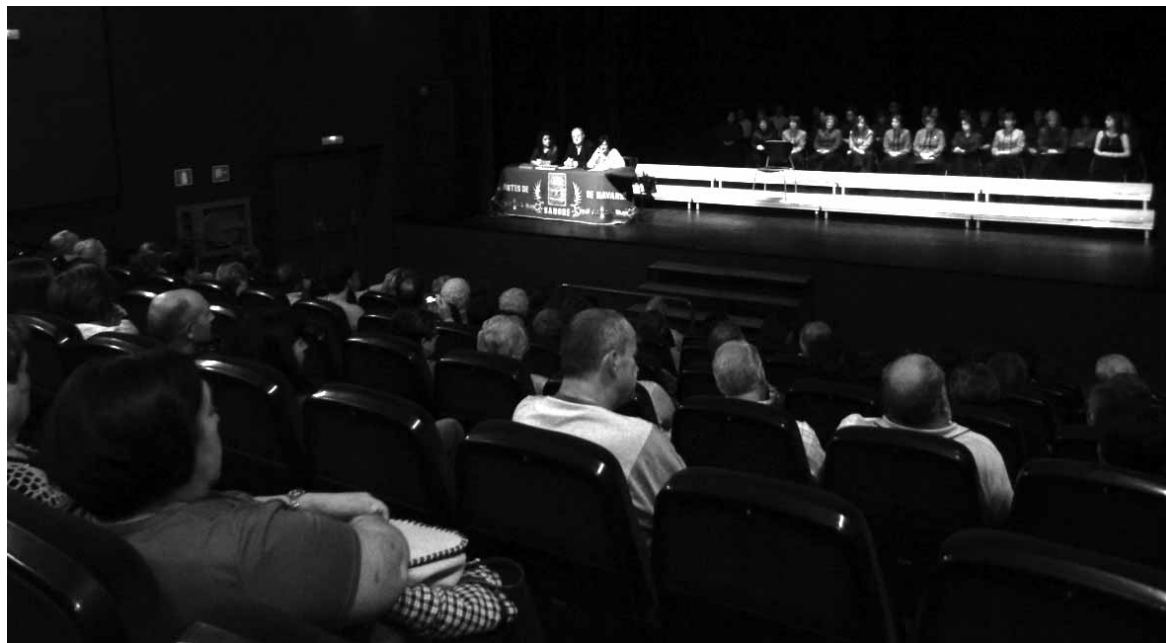
Gazteei odol-emaile egiteko gonbitea egin zien Adonako buruak.

Azalpen horien ostean, domina banaketari ekin zitzaion, Erkundengo Ama abesbatzak abesten zuen bitartean. Guztira 23 odol emaile saritu ziren (denek ezin izan zuten ekitaldian egon), 10 urrezko dominarekin (odola 50 aldiz emateagatik) eta 13 zilarrezkoarekin (odola 25 aldiz emate-