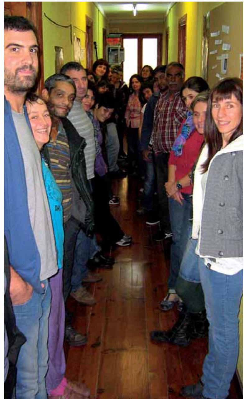
Euskara ikasleak atzo AEKren Itsasi euskaltegian. AEK

Irurtzungo antzerki zikloa gaur abiatuko da >> 15