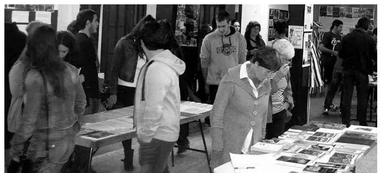
Mustutze egunean jende ugari gerturatu zen.