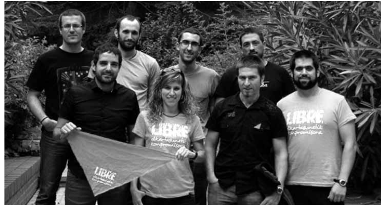
Etxarriarrak (eskubian ator ilunez) gainontzeko auzipetuekin batera.

Auzipetutakoek nabarmendu zuten gehienak inkomunikatuta egon zirela, Guardia Civilaren eskutan, eta torturak salatu zituzten. Horregatik atzo eskatu zuten "bortxa eta indarkeriaren bidez