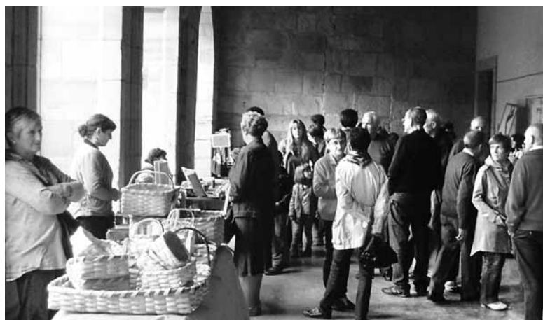
Joan den urtean postuak aterpean egon ziren.