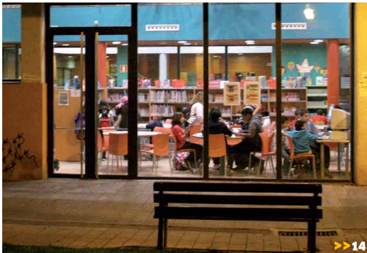
Haur eta gaztetxoak Altsasuko liburutegian.