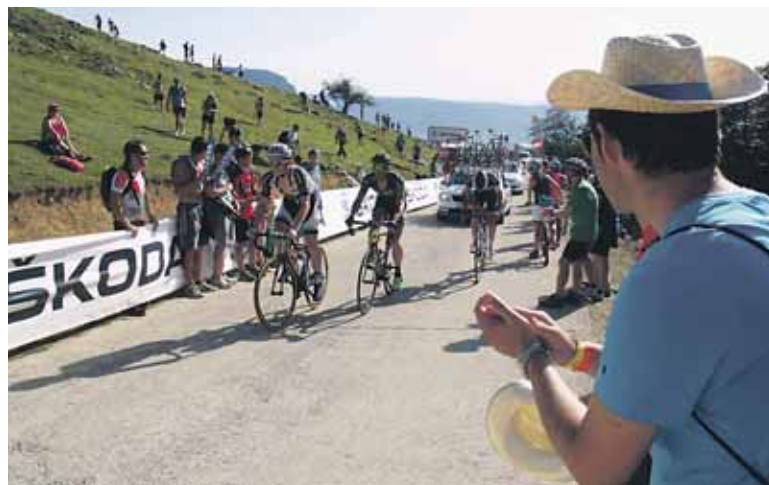
Txirrindulariak txalo artean iritsi ziren helmugara.