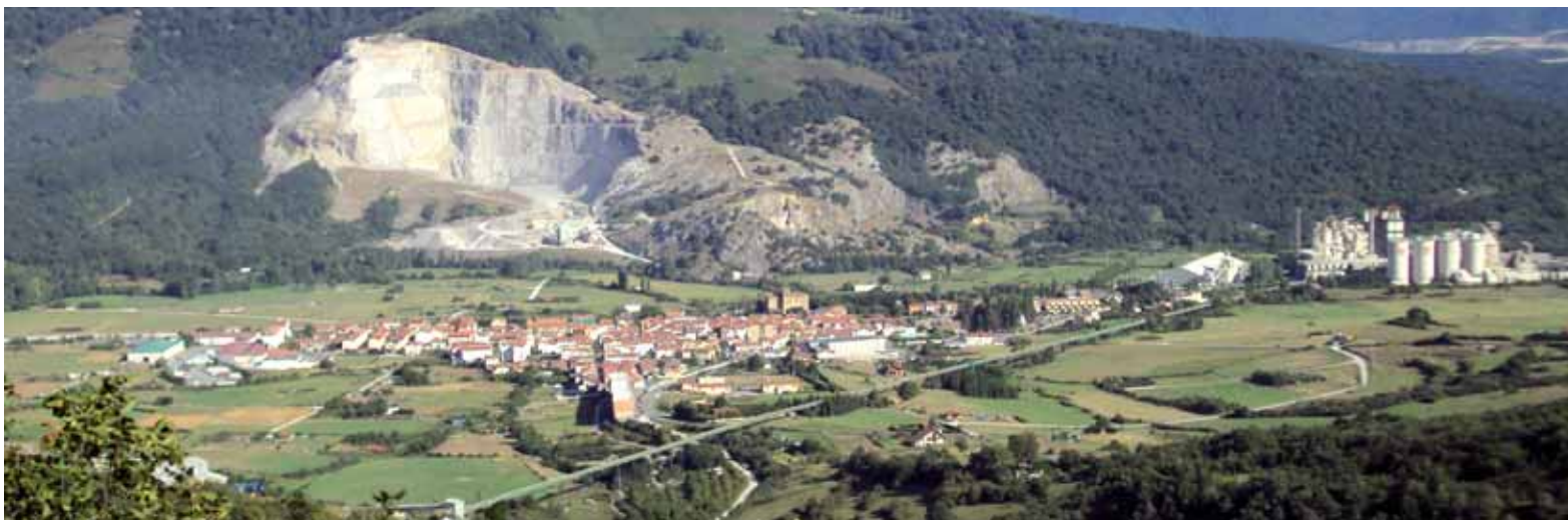
Olatzagutiko ikuspegia Urbasako portutik.