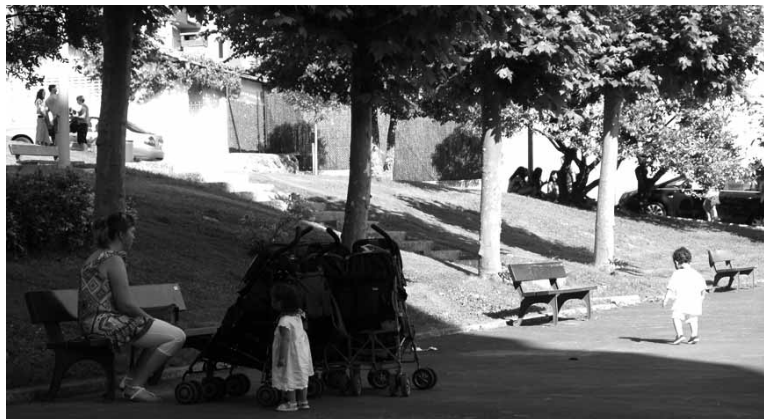
Emakumea eta haurrak Gernika plazan.

Horietaz aparte, heldu den astean haurrendako jolas parke berria jartzen hasiko da udalak kontratatutako enpresabatek. Egungozabua mantendu eginen dira eta saskia