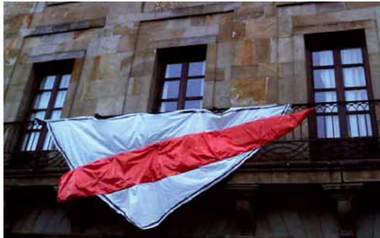
Adierazpen askatasuna murriztu diotela salatu du Etxarriko Udalak.

Etxarri Aranazko Udalatik “gogor salatu dute” epaia, “etxa-