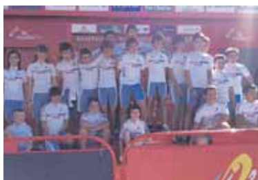
Aralar Klubekoak podiumean.