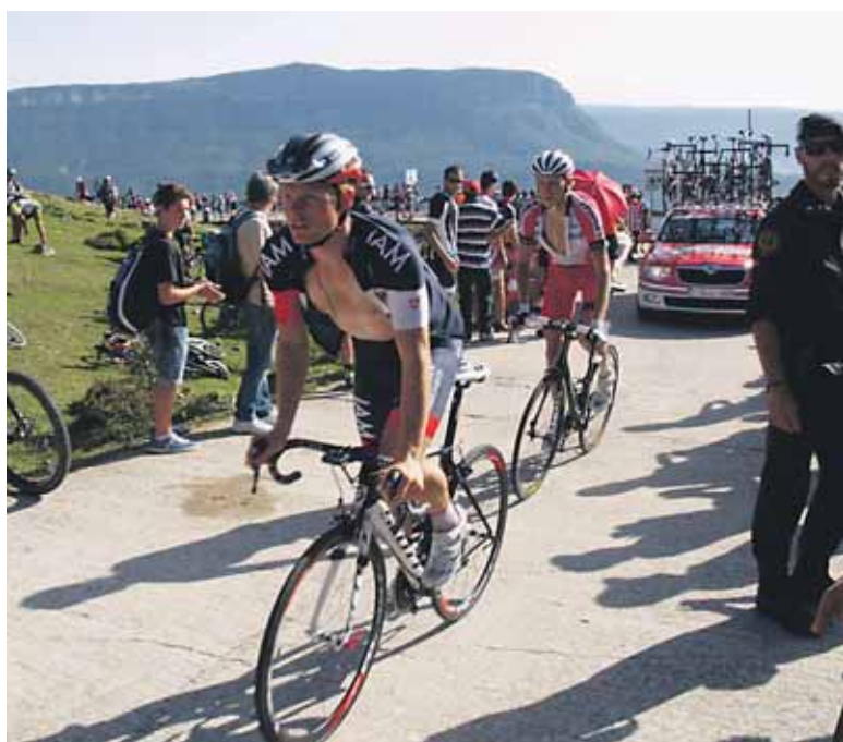
Txirrindulariak azken ahalegina egiten, Beriain atzean zutela.