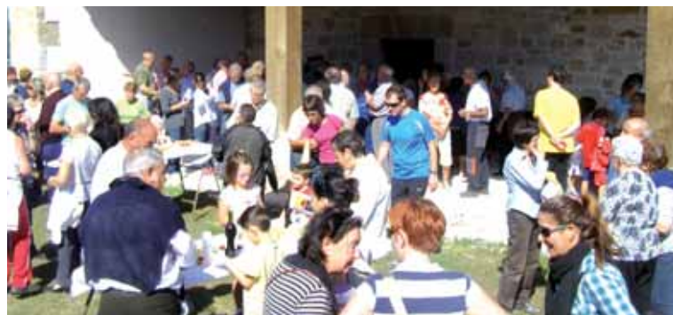
Joan zen urtean etxarriarreko Konzezion elkartu ziren.

Etxarriarreko joan zen urteko irailaren 21ean egindako elizkizu-