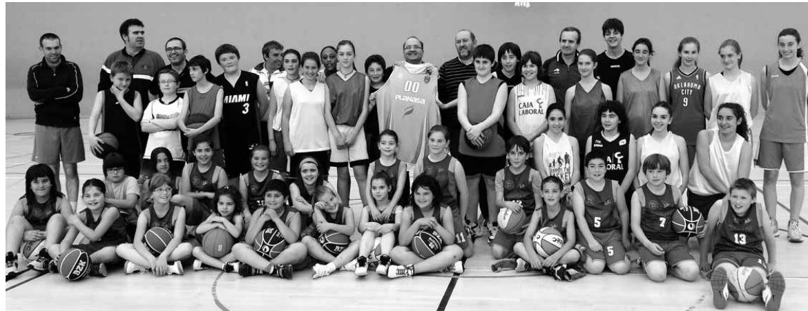
Altsasuko Saskibaloia Klubak, CBASK-ek eta Basket Navarra Club taldeak hitzarmena sinatu zuteneko. CBASK

Basketa gustuko duten zale guztiek izango dute partida jarraitzeko aukera. Sarrera doan izango da, eta Zelandi betetzea espero dute antolatzaileek. Puntako saskibaloia partida batekin gozatzeko gain,