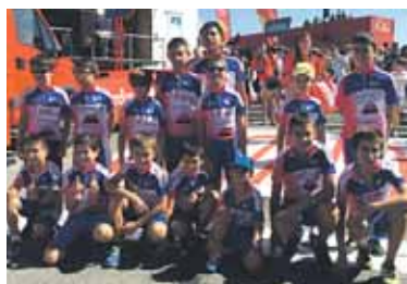
Burunda klubekoen argazkia.