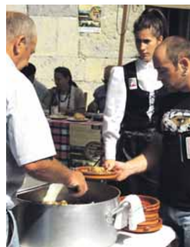
Ardiki lehiaketako parte hartzaile bat.