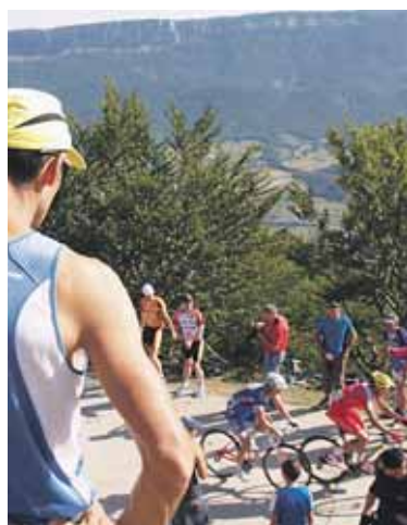
Altuera hartuta, ikuspegia hobea.