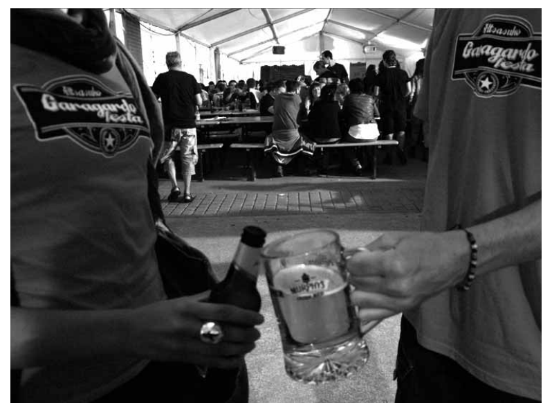
Zer edan eta zer jan izanen da Zubeztia plaza.

Altsasuko festen aurreko ezinbesteko hitzordua bihurtu da herritar eta sakandar askorendako Zubiondo elkarteak hainbat erakunderen laguntzaz antolatutako garagardo azoka. Garai honetan Alemanian ospatzen den garagardo festen modura, txerri-ukondo, hainbat espeziaduntxerriak, saltxitzez, oilasko-erreez eta abarrez asetzeko aukera izanen da. Jakina Zubeztia plazako karpatik pasatzen direnek garagardo eskaintza zabala jasoko dute.