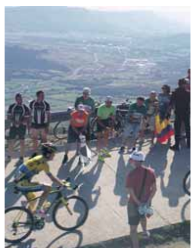
Sakana eder-eder ikusten zen.