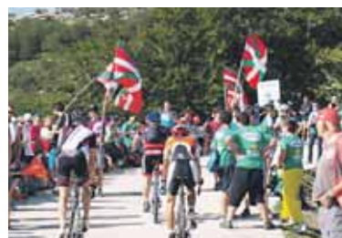
Txirindulariak gorako bidean.