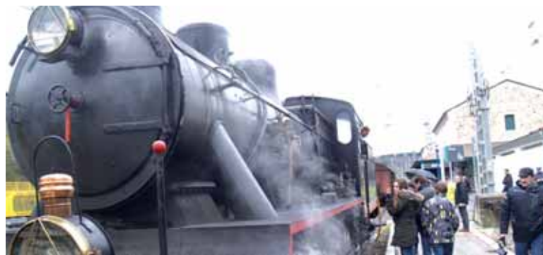
Duela bi urte Altsasura etorri zen lurrin makina.

Hizkuntzan, kulturean, ekonomian, populazioan eta hainbat arlotan aldaketak ekarri zuten trenaren etorrerak. Gipuzkoarako mugarekin egin beharrekotunelak egiteko Piamonteko langileak etorri ziren eta haiekarri zuten trikitixa Euskal Herrira. Bestalde, trenbidea egiteko makina bat trabesa behar izan ziren. Ibarreko basoetatik orduan