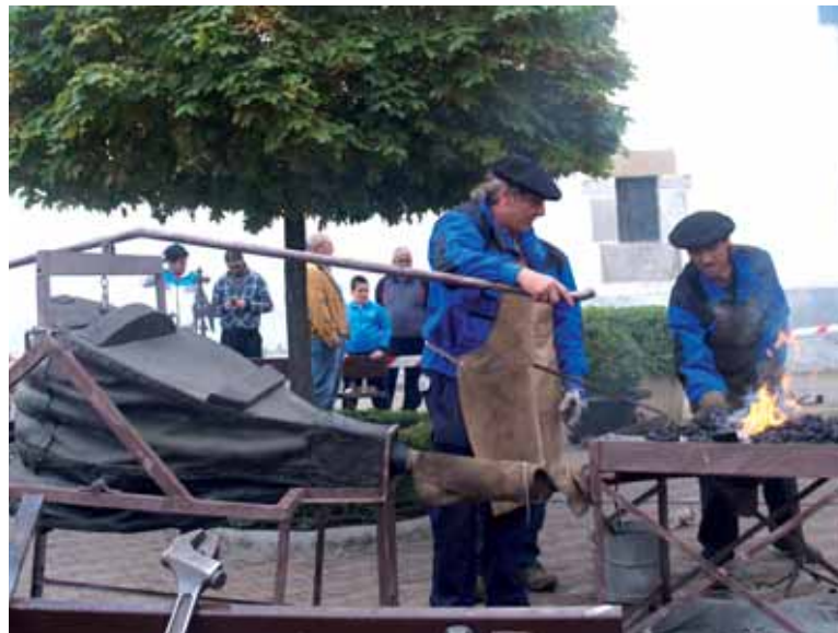
Forjariak lanean. Lanabesak uzten dituztenak ez dute haiekin lan egin beharko.