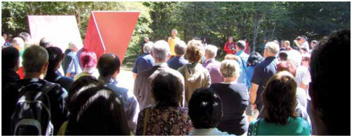
Igandean, atzera ere, Otsoportillo topagune bihurtuko da.

Udaletik gogora ekarri zuten 1936ko garilaren 18ko "altxamendu militar faxistak odolez eta malkoz bete zituen Etxarri eta Sakanako herri guztiak". Ondorioz sindikalisten, haien eskubi-