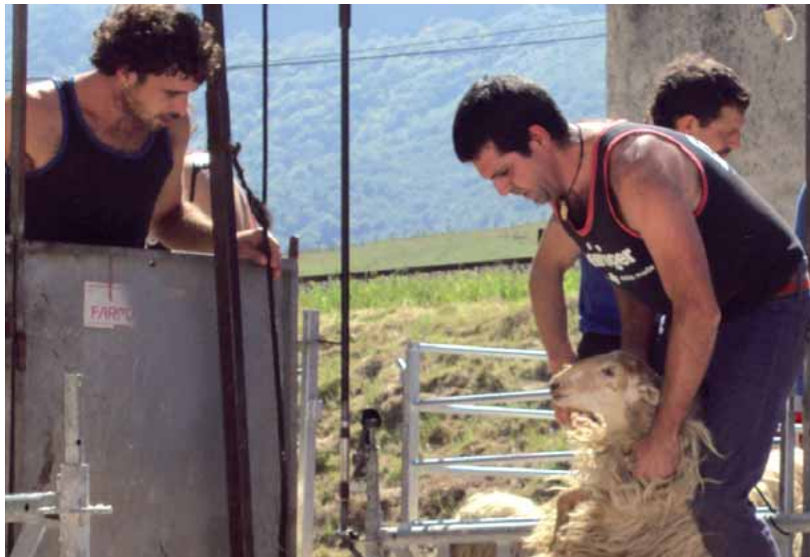
Ardi-motzailea finalean lanean.