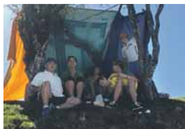
Koadrila bat Aralarren.