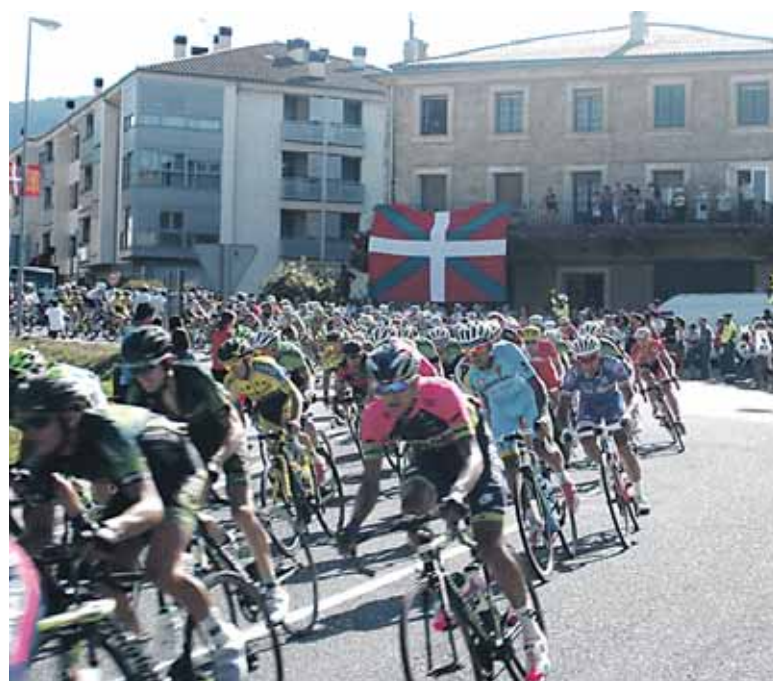
Ikurriña oso presente egon zen Etxarri Aranatzen.