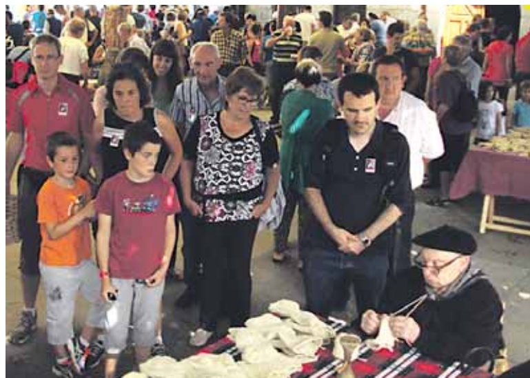
Artisauek ez zuten huts egin aurtengo Artzain Egunean.