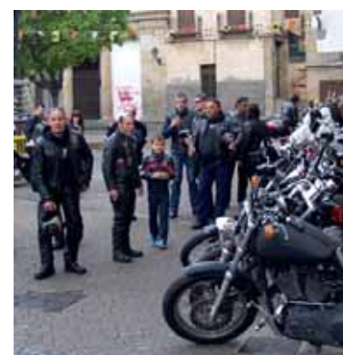
Motorzale topaketa Altsasun.

Web orrian euskararen arrastorik ez dago.