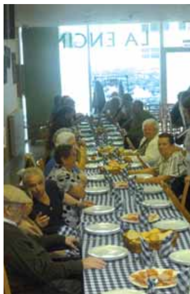
Bazkaria La Encina elkartearen.