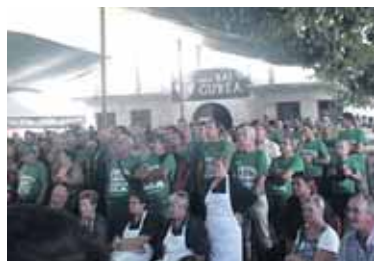
Uhartan pantaila erraldoia jarri zuten.