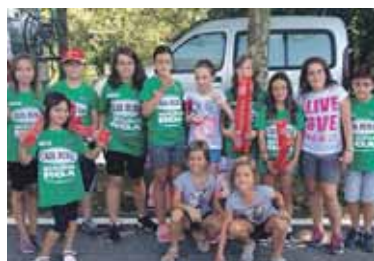
Zaletu gazteak Uhartan.