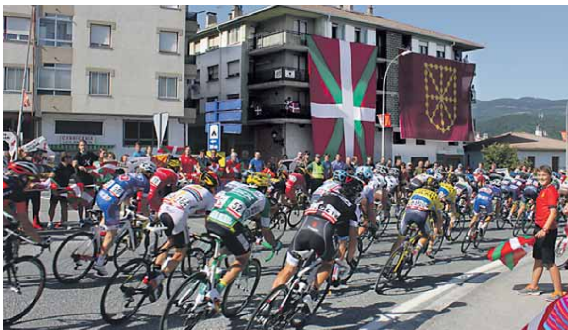
Etxarri Aranazko pasaera zuzenean ematerakoan airetik hartutako irudiak eman zituzten.