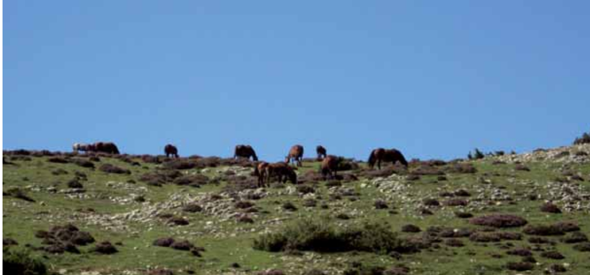
Behorak eta zaldiak Andian.

Bilkura berean jakinarazi zenez, aurten Urbasako egurraren eta su-egurraren aprobetxamendua %15 handituko da, "mendiaren iraun-kortasunari kalterik egin gabe". Gainera, mendi-bideak (Santa Kiteriako pistarako sarbideak) eta landaredi gutxiko guneak hobetzen eta barrutietako itxiturak gainbegiratzen ari dira (Lizarr-