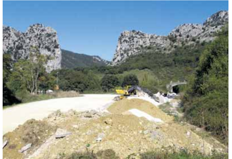
Bi Aizpe eta harako bidea. Handik ibili zen Plazaola trenbidea.

nen udalari bidea diren 5.539 metro karratu desjabetuko dizkiote. Aizkorben guztira 10.301 metro karratu desjabetuko dituzte: 7 partikularri (4.689 m 2 ), Aizkorbe Kontzejuari (lau sailletik,