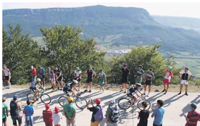
Txirrindulariak aipatu zuten bezala, oso gogorra egin zitzaion igoera.