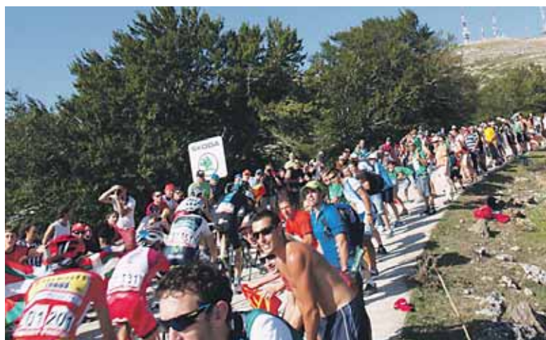
Pista, txirindulariz eta zalez estalia.