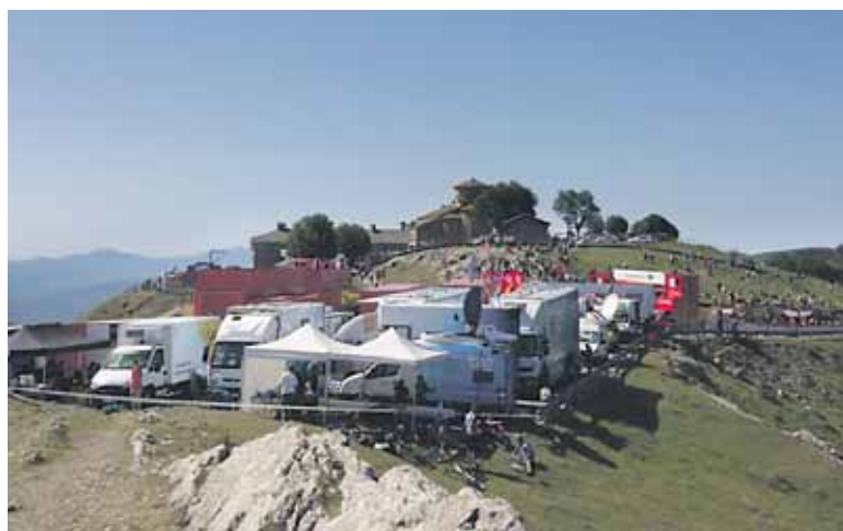
Aralarko santutegian azpiegitura handia prestatu zuen Unipublicek.