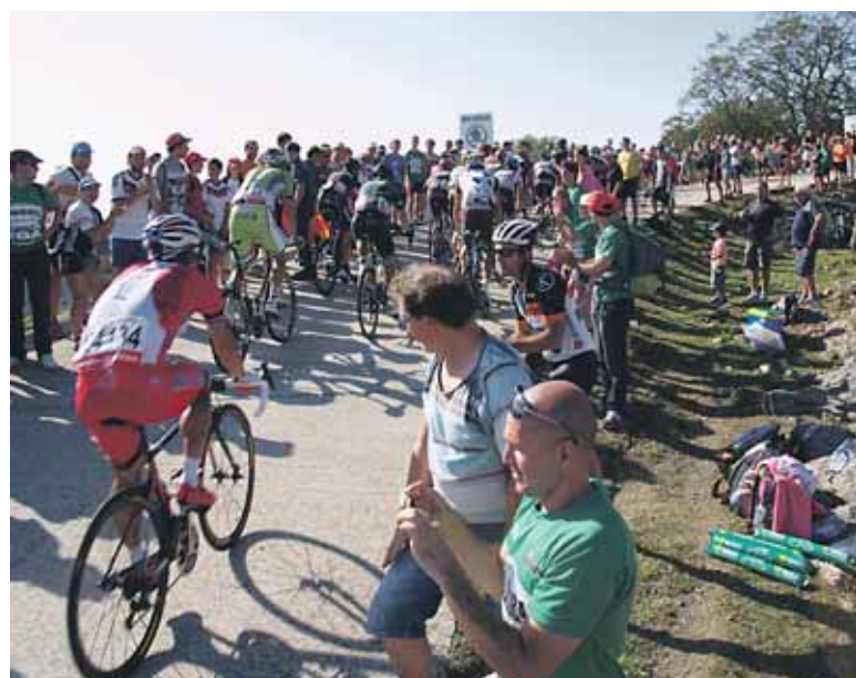
Txirindulariek zaleen animuak gogoz eskertu zituzten.