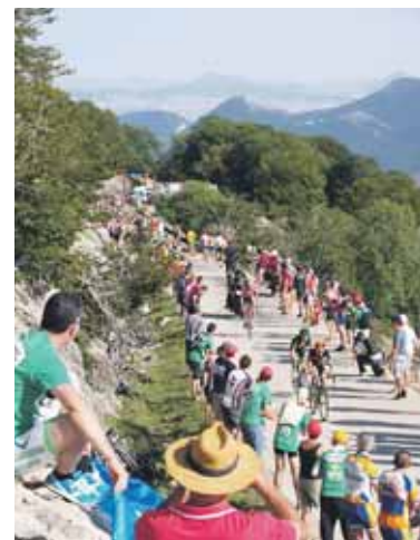
Ikuspegia primerakoa zen.