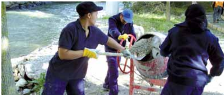
Langileak masa egiten.

Sakanako toki-erakundeek gizarte bazterketa bizi duten edo horren arriskuan dauden 33 pertsona kontratatu dituzte. Horretarako, Nafarroako Gobernuaren Zuzeneko Enplegu Aktiboaren deialdia baliatu dute. Toki erakundeek Gizarte Enplegu Babestuaren