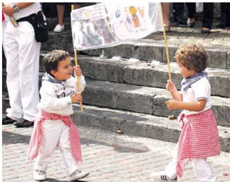
Peñak jarraipena ziurtatuta duela dirudi.