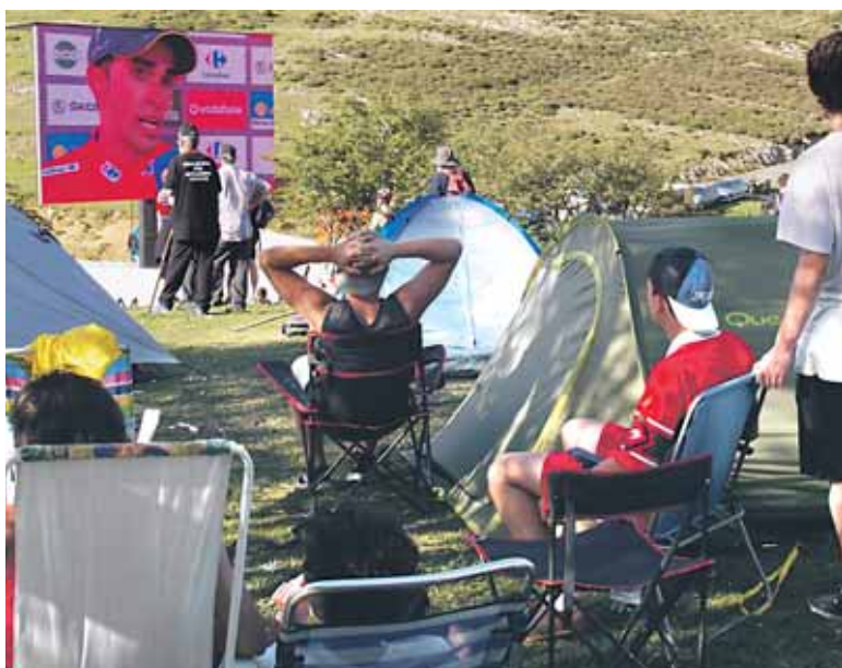
Erosotasuna bilatu zuenik ere izan zen.