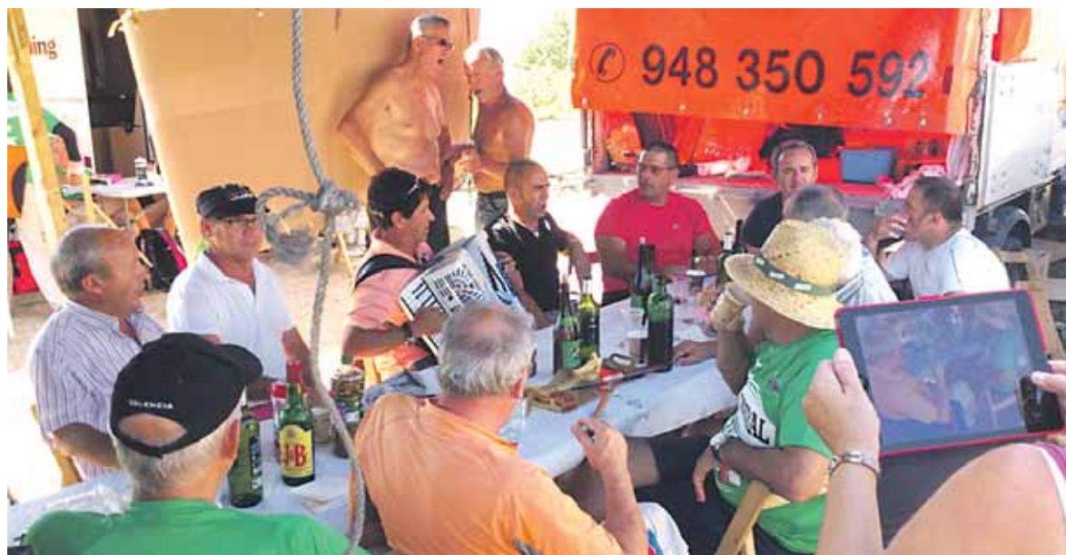
Bazkari ederrarekin eta musikarekin laburragoa egin zuten tropelari itxaron beharreko tartea.