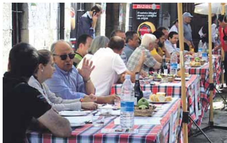
Gazta txapelketako epaimahaikideak.