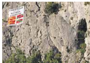
Eskalatzaileek jarritako pankarta.