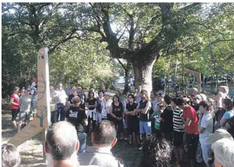
Albaola Itsas Kultur Faktoriako arduradunak bisita gidatua eskaini zuen. Azalpenak eta gero herriko artistek ikuskizun polita eskaini zuten.