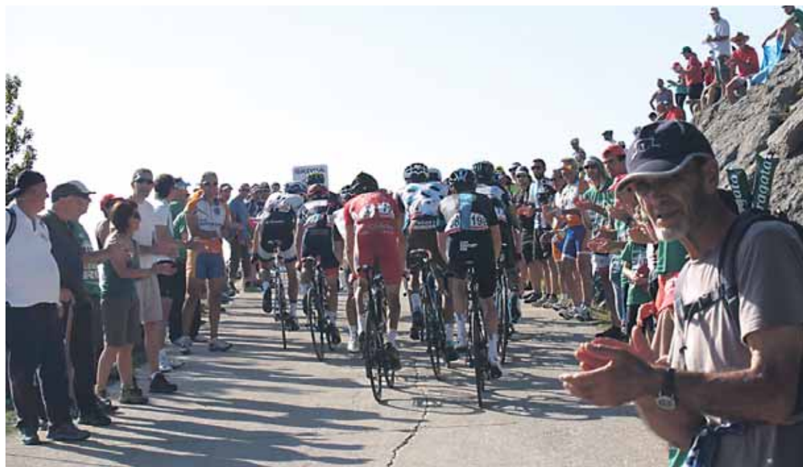
Txirrindulariak Aralarko azken maldetan gora, ikusleen animoen artean.