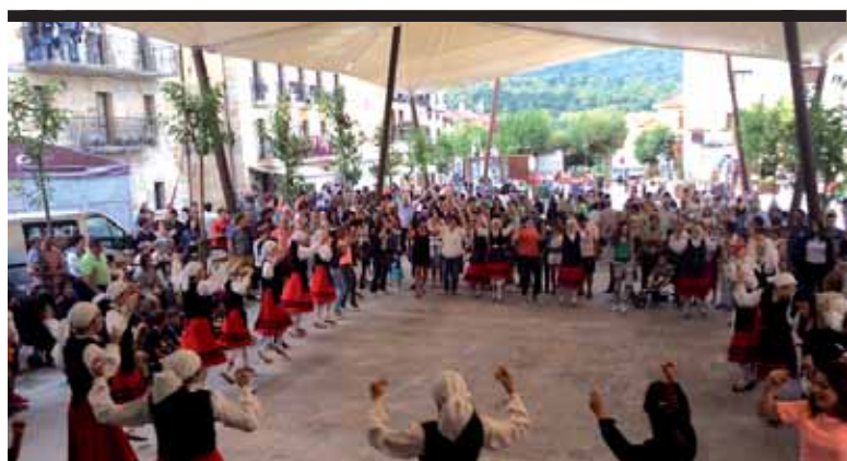
Lakuntzarren plaza berria >> 16