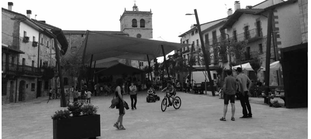
Oinezkoendako espazio zabala bihurtu da plaza Lakuntzan.

San Saastin festen ondoren hasi ziren lanek erabat itxuraldatu dute lakuntzaren bilgunea den plaza. Eliza eta iturria bitartean, plazak eta ondoko kaleak bat egin dute, eta oinezkoendako espazioa sortu da. Hala ere, auzokideek euren ibilgailuekin sartzeko aukera dute puntualki. Plaza gurutzatzen duen Mikel Arregi kaleko tartea jaso da, ibilgailuek abiadura mantsotu dezaten. Plazako zoladura berritzearekin batera, sareak berritu eta beste