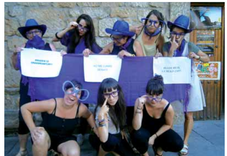
Gaur betaurreko moreak jantzera gonbidatu gaituzte.

Bestalde, herenegun haiek antolatutako Festa dezagun gaurdanik geroa bideoaren emanaldira jende ugari joan zen. Euskal Herriko hainbat herriko festetan emakumearen parte hartzea aztertzen du ikus-entzunezkoak, tartean, Altsasuko Santa Agedaren berri ere ematen du.