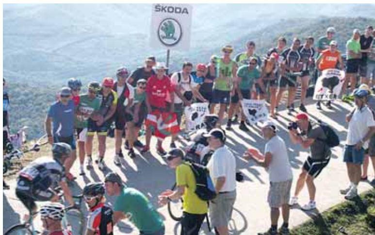
Milaka zaletu bildu ziren Uharte Arakilgo pistan.