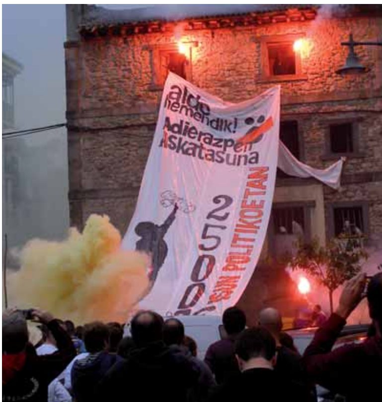
Alde Hemendik aldarrikapena zabaldu zuten larunbatean.

Ospa mugimenduak kalejiran zabaldu zuten “alde hemendik” mezua