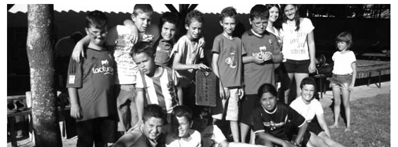
34 partaideren artean goikoak izan ziren finalista.

Urtero bezala, Irurtzungo Aizpea euskara taldeak Irurtzungo Haur Botxa Txapelketa antolatu du. Eki-menarekin botxa kirola eta euskararen erabilera bulkatu nahi zen. 34 partaidek eman zuten izena, bi mailatan.