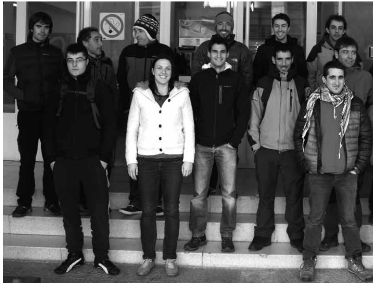
Otsailan hasi ziren ikasleetako batzuk, irakaslearekin batera.

Otsaila hasieran hasi zen Sakana Lanbide Heziketa (LH) institutua mendiko kirol eta eskaladako gradu ertaineko ikasketetako lehen maila. 21 ikasle hasi zituzten ikasketa horiek, bi ikasturtetan banatuak daudenak. Guztira 975 orduko ikasketak dira. Aurreneko kurtsoan 420 ordu egin zituzten, klasean eta mendiko praktikak uztartuz. Bigarren ikasturtean ikasle horiek 555 ikas-