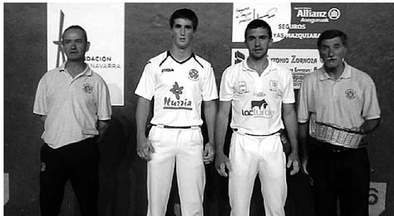
Pilotari afizionatuak ikusteko aukera izanen da bihar ere Altsasun. SDA

Elite mailako binakakoa: Ontsal-olizoa / Azpiri-Irusta