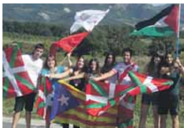
Etxarriko gazte kuadrila bat.