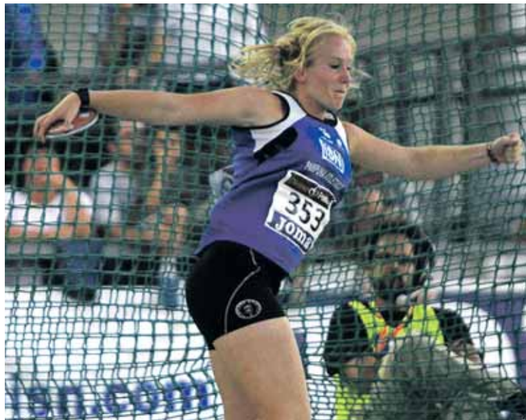
Kintanak helburuak bete ditu Junior Mailako Mundialetan.