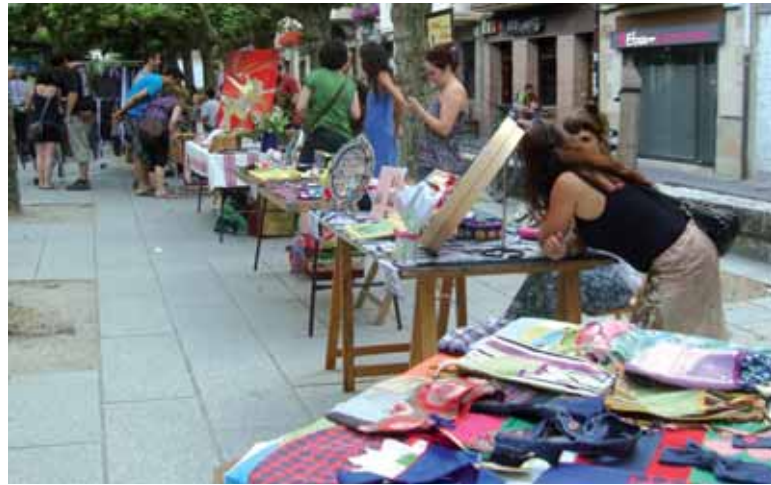
Arropa, artea, jakiak, apaingarriak... denetarik opa daiteke Zorri Azokan.

Erronka handiena, Aiestaranek, artea da. "Artearekin ez dugu gertuko harreman bat. Artea ikusteko, edo arteaz gozatzeko joan behar duzu museo, galeria batera edo... Azokaren espazioan artista batzuk euren koadroak, eskulturak... aurkeztu ditzakete. Niretako polita da arteari bere