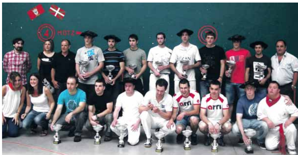
43. San Migel Pilota Txapelketako finalista guztiak, antolatzaile eta laguntzaileekin. UTZITAKOIA

Antolatzaileak pozik daude txapelketak izan duen erantzunarekin. Datorren urtean gehiago.