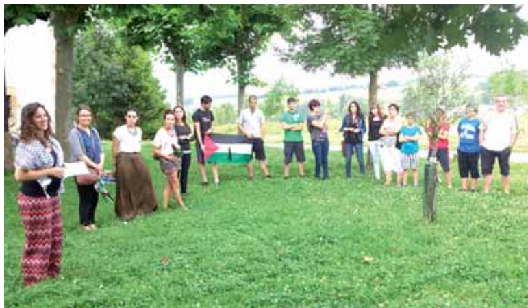
Palestinako Marda herriarekin Arbizuk duen senidetza aipatu zuen alkateak.

Ostiralean San Juan ermitako olibondoaren inguruan egindako ekitaldian jarri zuten Palestinako bandera Arbizuko udaletxean. 50 bat pertsona elkartu ziren udalak deitutako ekitaldian. Gazaren kon-