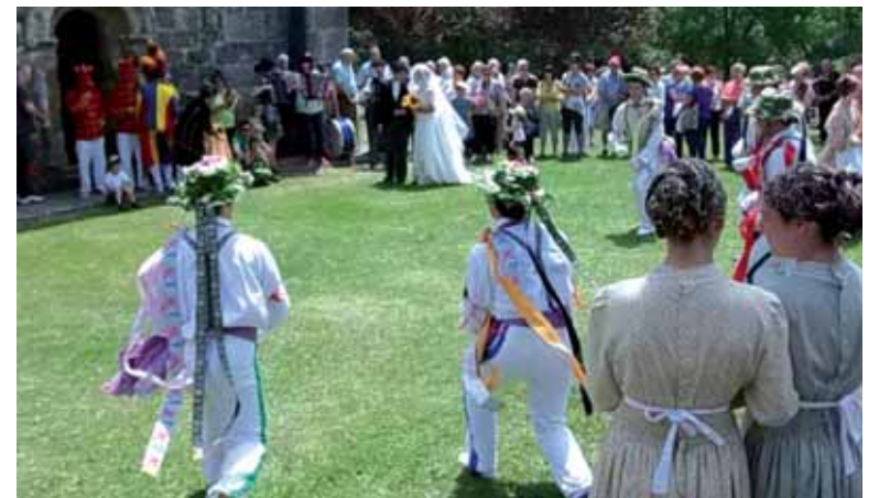
Orritzekoek ikuskizun ederra eskaini zuten, ezkontza tarteko.