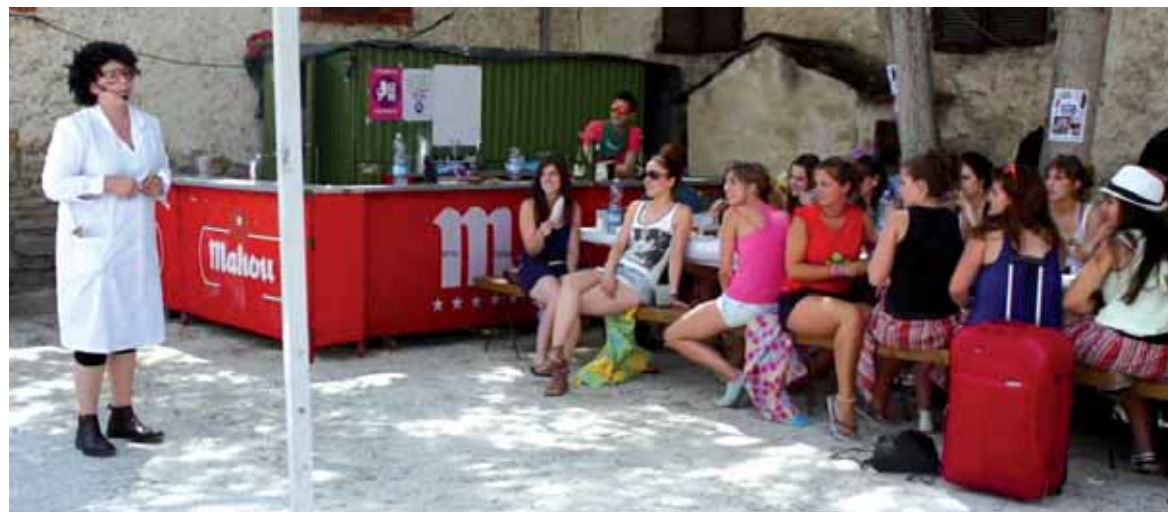
Sexismoaren aditua zenaren esanak adi-adi segitu zituzten Barazki-Gunean elkartu ziren 80 gazteak. UTZITAKOIA

Seximoan adituak despeditu aurretik Irurtzungeo gazteei aholkatu zien errespetua eta berdintasuna oinarri hartuta festetan denek gozatzeko aukera izanen