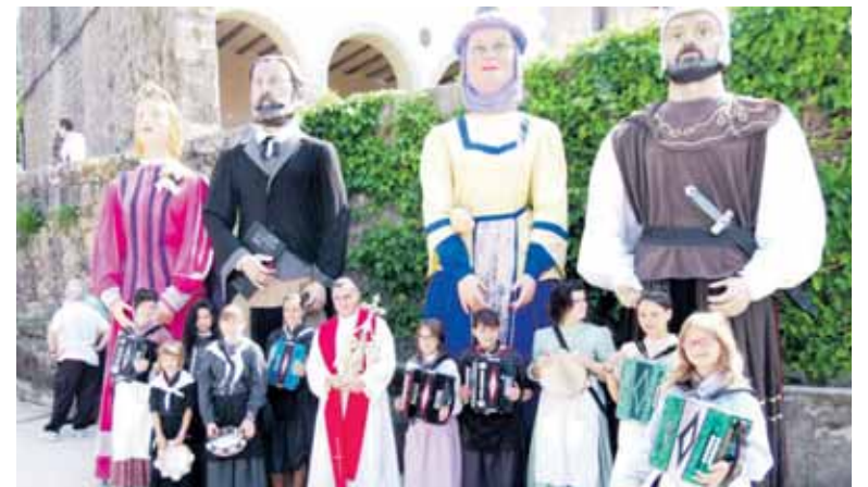
Mikel Garziandia San Migel aingerua eskuetan, erraldoi eta trikitilariak lagunduta.

Ostiralero SAIOA 9:30etik 10:30era Errepikapenak 14:00etan eta 19:00etan.