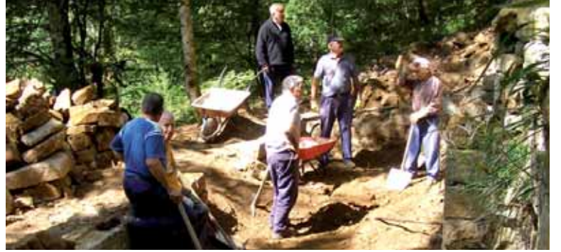
Uharteko boluntarioak Agiriko elizan lanean.

Arresek lan egingen duen beste eremua zenbatu dituzten 13 etxe-