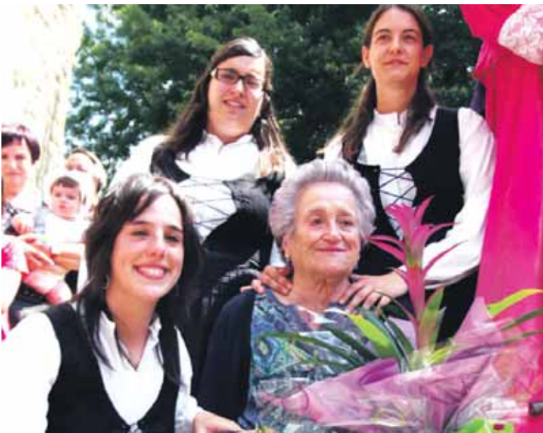
Ceferina Amondaraini bilobek dantzatu zioten aurrekua.