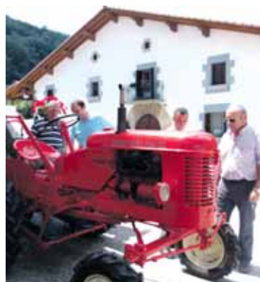
Traktore zaharren erakusketa.