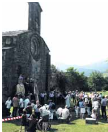
Giro polita izan zen Itxaspeirrin.

jaiotakoei omenaldia egin ondoren, Orritz taldeak emanaldia eskaini zuen. Auzatearen ondoren, Urritzolan bildu ziren, eta argazki lehiaketako lanak eta traktore zaharren erakusketaz gozatu ondoren, bazkaltzera eseri ziren. Ordu txikiak arte luzatu zen festa.