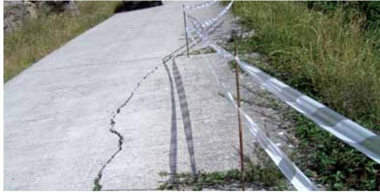
Aralarreko pista zenbait tokitan zartatuta dago.

Gauza jakina da pista egoera kaxkarrean dagoela, pitzaduraz eta zuloz beteta. Uharteko Udala sarritan saiatu da pista konpondu ahal izateko Nafarroako Gobernuaren laguntza eskatzen, baina ez du jaso. Nafarroako Gobernuaren erantzuna, betikoa: pista Uharte Arakilgo Udalararen jabetza dela eta udalari dagokiola konpontzea. Baina sekulako dirutza da eta Uharteko Udalak ezin dio aurre egin. Behin txirrindulari batek mina hartu zuen pistaren erorikoa izan eta gero, eta ordutik udalak zehaztu zuen pista ez dela egokia bertatik