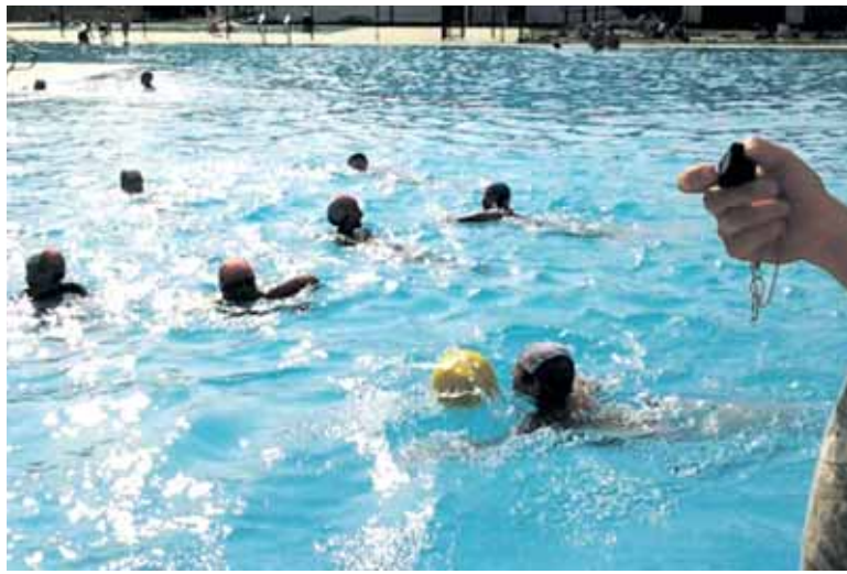
Aurreko urtean Etxarri Aranatzan burutu zen waterpolo jardunaldia.