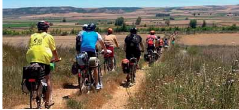
Txirrindulariek etapa bakoitzean martxaren manifestua irakurriko dute.

Petrolio merkea bukatzen ari dela eta "diruaren eta kontsumoaren totem asegaizta elikatzen segitzeko erregai fosilak edozein tokitan bilatu nahi dituzte". Suntsiketamaina gelditzeko garaiz gaudela diote Ekologistak Martxanekoek.