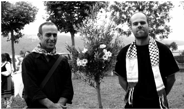
Palestinatik Arbizura behin baino gehiago etorri dira. Olibondoa erdia dago.

Arbizu 2005eko garagarriaren 14an Palestinako Zisjordanian dagoen Marda herriarekin senidetu zen. Senidetze horren ondorio izan dira gerora zenbait arbizuarrek Palestinara egindako bidaiak, palestinarraren eskaerari erantzunez udalak