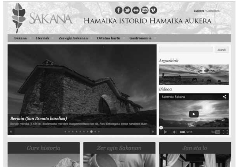
Web orrian irudiak garrantzi handia du.

tza eskatu die, sare moduan lan egingez, web orria eta Sakana ibarretik kanpo ezagutzera emateko. Horretarako, proposatu du sakandarrek sare sozialetan ematea, baita sare sozialetan jarraitzaile egitea eta edukiak partekatzea ere. Web orria bisitatu eta iradokizunak, ideiak, akatsak edo beste jakinarazteko eskaera ere luzatu dute Sakanako Garapen Agentzietatik, "denon artean hobetzeko". Horretarako sakondusakana@gmail.com e-postara zuzentzeko aukera dago.