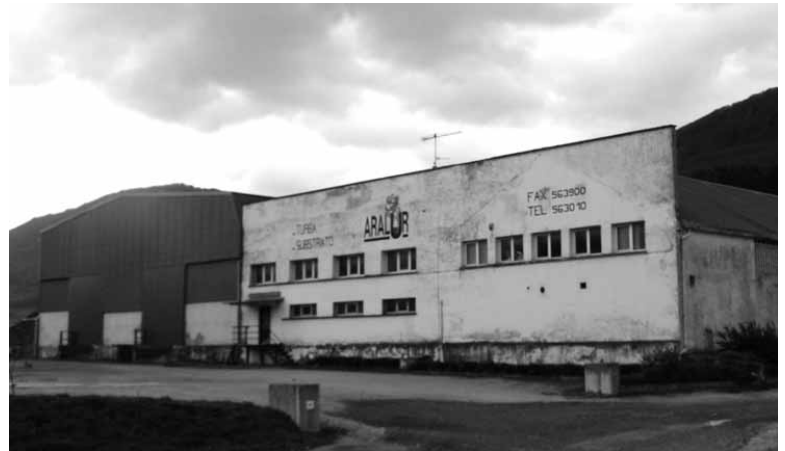
Aralur lantegiaren ezker eskubi eta atzeko aldean daude hondakinak.

ketarekin jasotako eta guztiz konpost bihurtu gabea zegoen materia organikoa tratatzeko ekartzen hasi zen 2012ko udaberri hasieran. Ziordiarrek usainengatik kexu azaldu eta udalak Nafarroako Gobernuari jakinarazi zion hondakinak behar bezala biltegiatuz ez zezudela. Foruzainen ikuskaritzaren ondoren, jarduera hori egiteko Aralurrek hainbat lan egin behar zituela adierazi zuen gobernuak. Gaur egun 30 tona inguru materia daude lantegi inguruan.