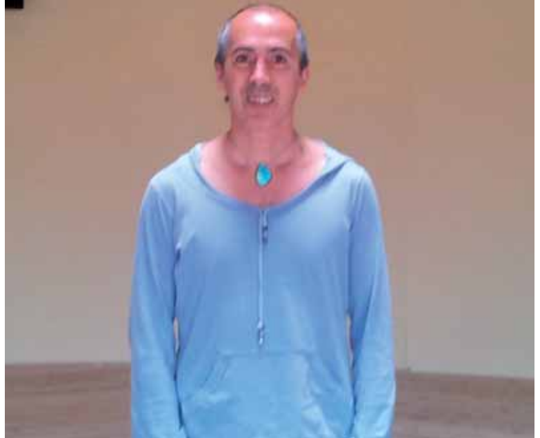
Arbizuko ekokanpinean Amari yoga magiko eskola zabaldu du.