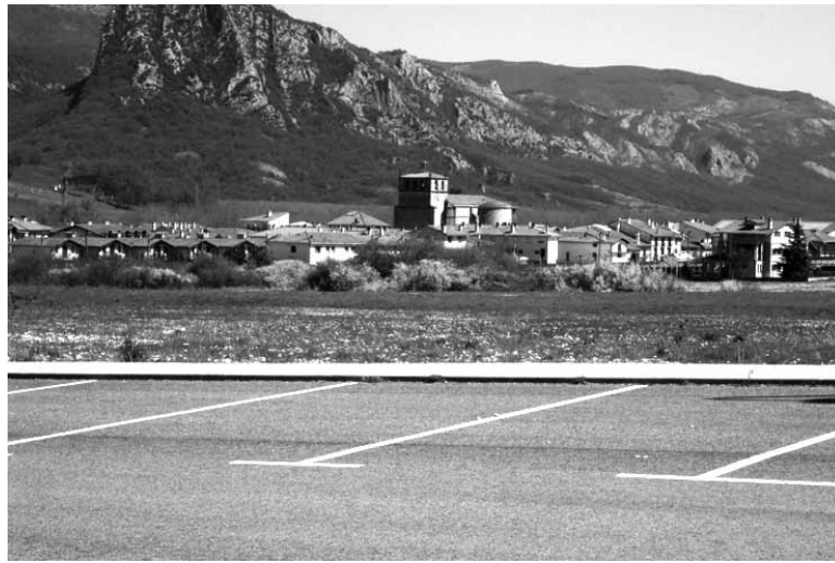
Uharte Arakilgo ikuspegia Iriburu industrialdeko urbanizaziotik.

Pasa den hileko bilkuran Uharte Arakilgo Udalak Iriburu eta Zubiaur-Mendikoa industrialdeen egoera desblokeatzeko erabakia hartu zuen. Lastailan erabakia bera hartu zuen Uharte Arakilgo Udalak, baina ilbeltzean Nafarroako Gobernutik akordio hura baliogabe uzteko eskatu zioten. Otsailean, bestalde, udalean jakin zuten Espainiako Auzitegi Gorenak atzera bota zuela industrialdearen sustatzaileek jarritako