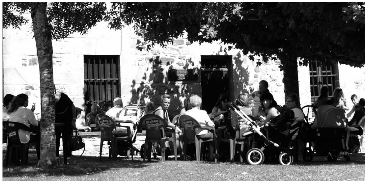
Ziordiarrek tabernako terrazan eserita.

Inbertsioen atalean kale konponketarako 40.000 euro daude aurrekontuan. "Diru horrekin eta