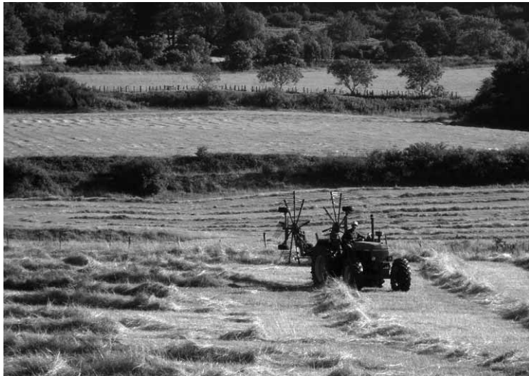
Belarra biltzen eta uzta biltzen, nahiko lan aste honetan.