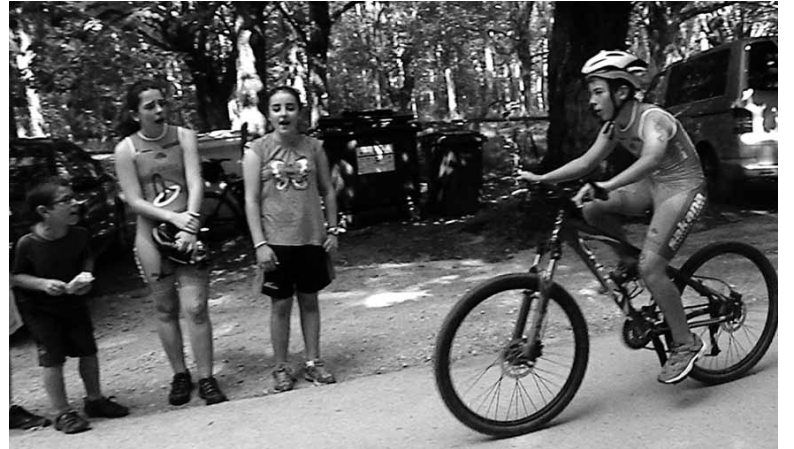
Aurreko urteko Sakanako Haur Triatloia.

Ondoko kategoriendako probak jokatu dira: aurre-benjaminak, benjaminak, kimuak, haurrak, kadeteak eta juniorrak. Bertan parte hartzeko aurretik izena emana beharra zegoen www.navarratriatlon.com web gunean eta atzo, ostegunean, bukatu zen epea. Erredakzioa ixterakoan 120 triatleta zeuden izena emanda. Nolanahi ere, informaziorako Mankeko Kirol Zerbitzura hots egin daiteke (948 464 866 telefonoa). Aurreko urtean 111 triatletek hartu zuten parte, horietatik 25 sakanadar. Tartean izanen dira Udako Triatloi Campusean dabiltzan sakandarrak.