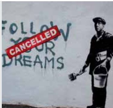
Banskyren lan bat.

Artistak, behar ekonomikoak direla eta, proiektu, maketa edo erakutsi eta saldu daitezkeen produktuak asmatzera behartuta daude (Christo artistak instalazio monumentalak sortzen dituen aldi berean, txikiagoak eta salgarriak diren beste batzuk egiten ditu). Beste batzuek bideoen bitartez erregistratzen dituzte obrak, salgai bihurtuko diren produktuak baitira. Gordon Matta-Clark-ek eraikinetan egiten zituen mozketen bidez, barneko elementu konstruktibo guztiak agerian uzten zituen, eta haien lekukotasun bakarra argazkien bitartez jaso dugu, Sophie Callen bizitzaren intimitatea eta gertaren berri dugun era berean. Fraçois Alÿs-ek hirian egiten dituen akzio-