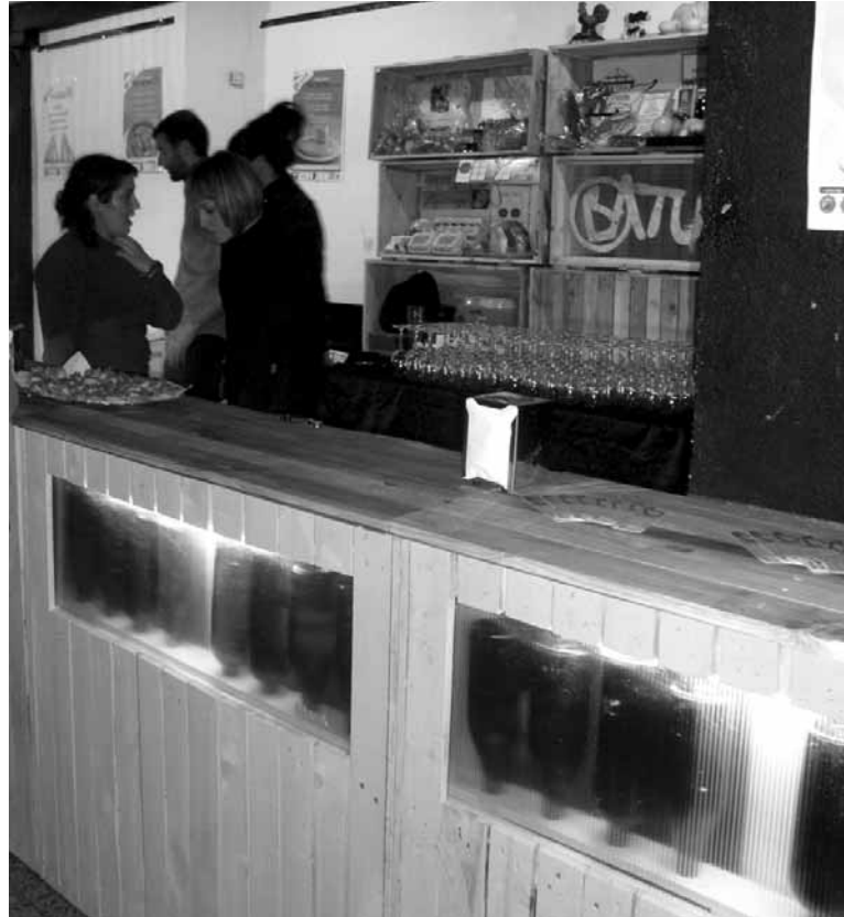
Ardo azokan euren altzarietako batzuk erakutsi zituzten Batutakoek.

Hezkuntza da Birziklatze Laborategiak duen laugarren eta azken atala. Lan jakin bat nola egin azalduko lukete Batutakoek. “Horregatik, birziklatzeari buruzko ikastaroak ematea pentsatzen ari gara”. Edo repair café modukoak antolatzea. “Tailer bat prestatu eta hitzorduak jartzen dira jendea biltzeko, hilean behin edo bitan. Jendeak konpondu beharra duten gauzak eramaten dituzte eta han