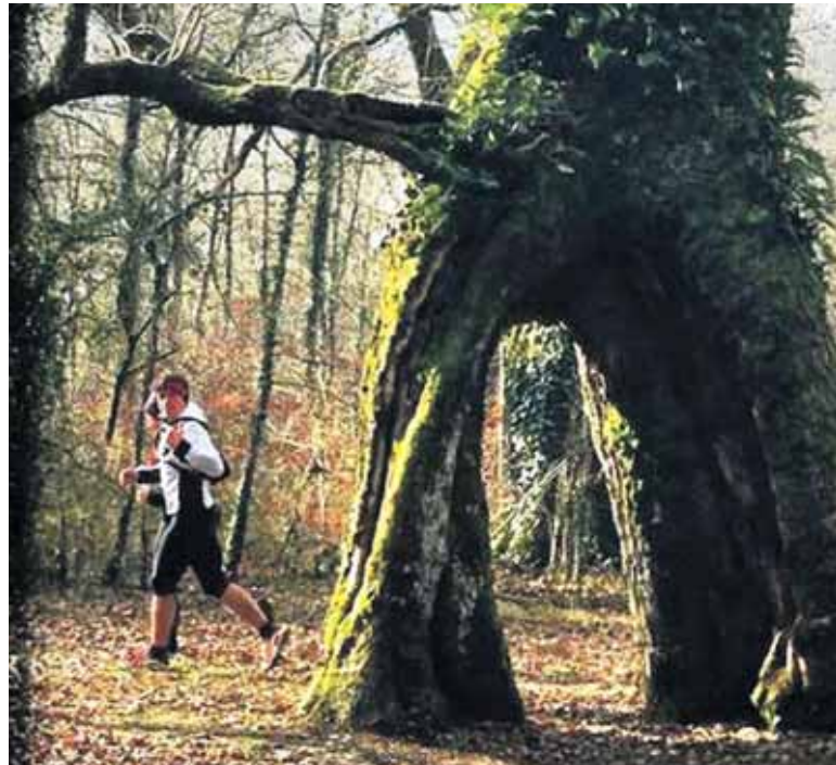
Proba paraje zoragarrietatik pasako da.

Horrela, kanpinetik aterata Maitzegurretik pasatuko dira korrikalariak, eta segidan Auntzetxetik. Ibilbidean aurrera eginez, Axioren putzua pasatu ondoren