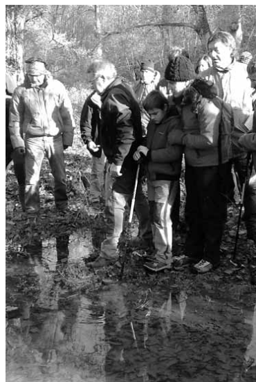
Beheko basoan ibili dira aurretik.

Ibilbidea joan nahi dutenek euren asistentzia konfirmatu beharko dute garilaren 3ra arte, 948 460 930 edo 606 239 008 telefonoetan edo kultura@etxarriaranatz.com postan. Antolatzaileek adierazi dutenez, euria barra- barra eginez gero, bertan behe- ra geratuko litzateke ibilbidea.