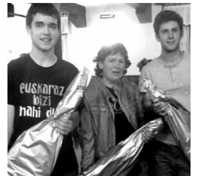
Lirainak taldeko txapeldunak.

Ostiralean lehenik eta behin 3. eta 4. postuak erabakitzeko partida jokatu zen. AHTrik Ez taldeak 20-6 hartu zuen menpean Erik-Agustino-Xabier. Eta ondoren final handiaren txanda heldu zen. Final