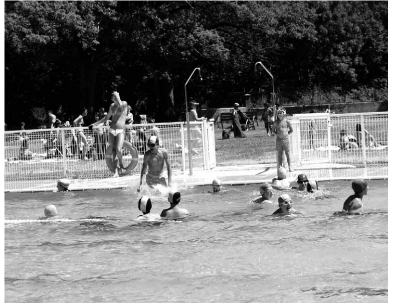
Ur festa goxoak igerilekuan gauez ibiltzeko aukera emanen du.

artearen sexualitateari buruzko hausnarketa eta arlo ezberdinen inguruko eztabaida sustatzea du helburu. Horregatik, publikoak eta ohikoak diren espazioetan sexualitatearen presentzia azaldu nahi du.