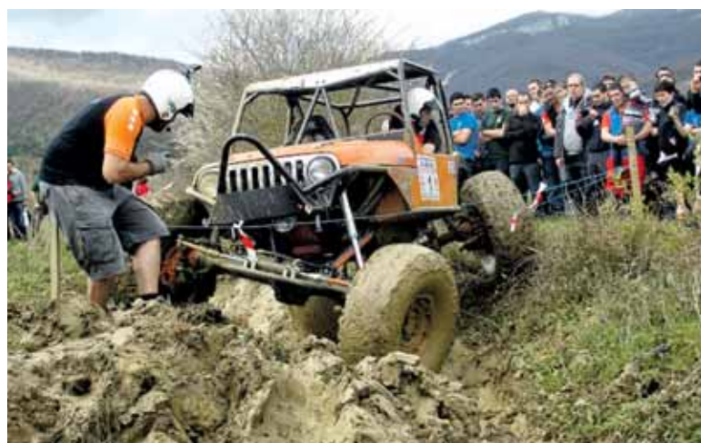
Pilotuek maniobra ikusgarriak egin beharko dituzte.

Autoen azkartasuna baino gehiago, egiten dituzten maniobrak saritzen ditu trialak. "Pilotuek ahalik eta maniobra gutxien egin beharko dituzte 5 guneak pasatzeko eta ahaliketa atzerako martxa gutxien egin. 5 guneak maniobra gutxien egiten pasatzen dituena izango da txapelduna" gaineratu digu Lakuntzak. Izan ere, pilotuaren trebetasuna da baloratzen dena, autoa nola mugitzen duen, aldapak nola igotzen dituen eta bihurguneak nola hartzen dituen.