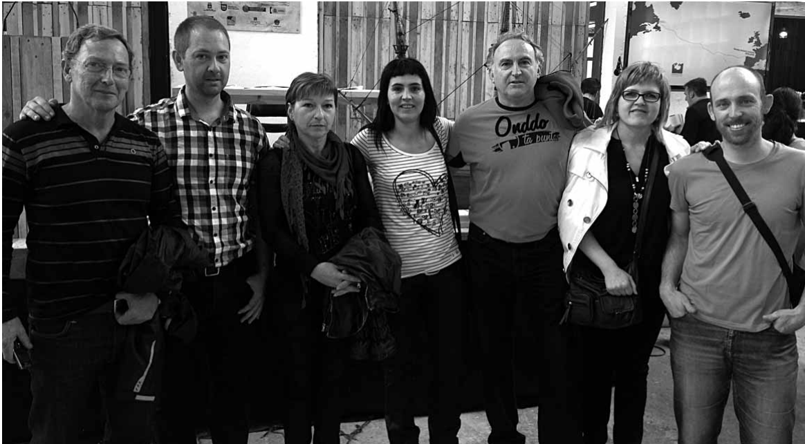
Herenegun sakandarrak Pasaian izan ziren, itsasontziaren gila kokatzeko lanak ikusteko.