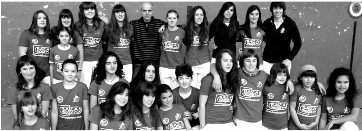
Etxarri Aranazko Gure Pilota Elkarteko palistak denboraldi hasieran ateratako argazkian.