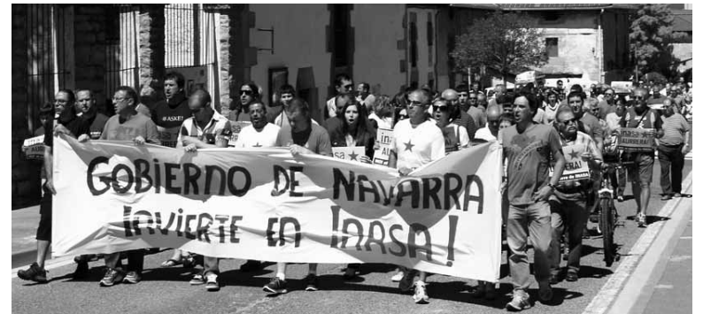
Inasaren itxieraren kontrako mobilizazioak ere zigortu zituzten.

ote den galdetu du udalak: “protesta baketsuari eta herritar izateagatik ditugun eskubideei uko egitea bilatzen da? Herritarren egoera politiko eta soziala lehertzeko