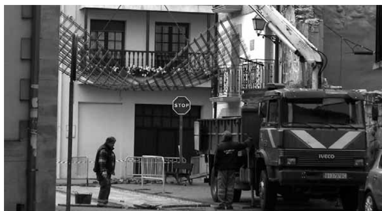
Zorua konpontzeko lanak Altsasun.

Zerbitzuen arloan pilatzen dira sakandar gehien lan eskaerak