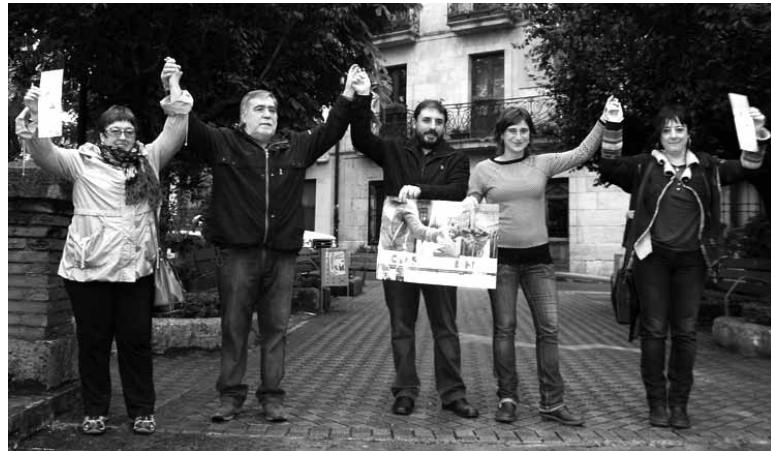
Gure Esku giza katean parte hartzea deitu dute alkate-ohiek eta alkateak.

Seiek aldarrikatu dute eskubidea dugula gure etorkizuna herri gisa erabakitze eta herritarroi