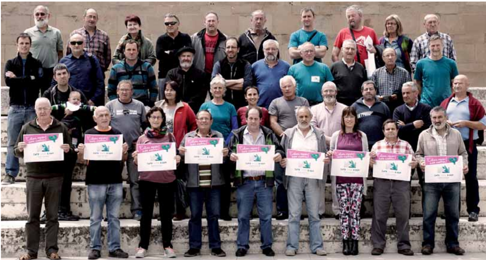
Arakilgo eta Irurtzungo hautetsiak eta izan direnak giza katean parte hartzera deitu dute. UTZITAKOIA