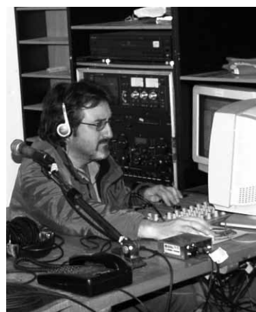
Garraxi irratiaren emisioan.

Garraxi Irratiak (FM 101,9) zuzeneko hiru saio ditu. Asteazkenetan, 18:00etan, hip-hop musika eta elkarrizketak eta beste eskaintzen dituen saioa dago. 20:00etan, berriz, ildo anarkistatik kontrainformazioa jorratzen duen saioa aireatzen da. Ostiral gauean, berriz, hainbat dj-k zuzeneko saioa egingen dute Garraxi irratiaren.