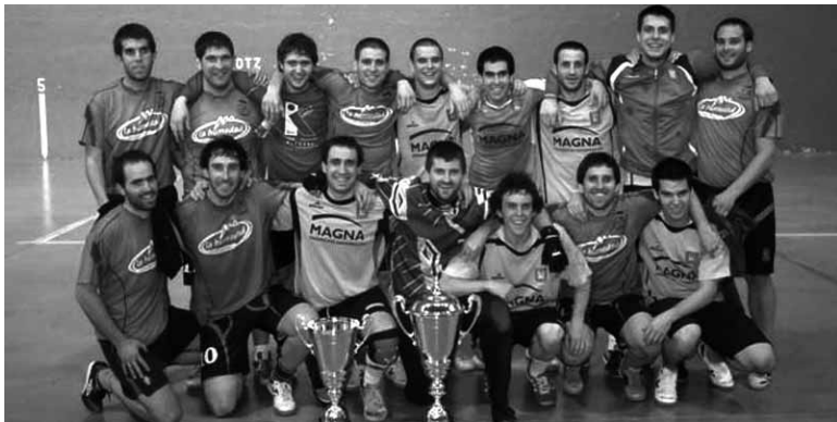
Bi finalistak jasotako trofeoekin.