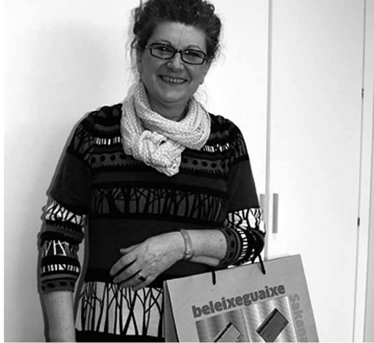
Aurreko Sakatxartel asteburuko irabazleetako bat.

Bierrik fundazioak Sakanan euskaraz ari diren hedabideak, Guaixe astekaria eta Belexe Irratia (FM 107,3) , sustatzen ditu. Haien lanarekin aurrera jarraitzeko ezinbestekoa bihurtu da Belexeguaixe Txartela, fundazioaren autofinantziazioa hobetzen duelako. Horren truke Bierrik fundazioaren laguntzaileek abantaila batzuk eskuratu ditzakete. Baina Belexe-