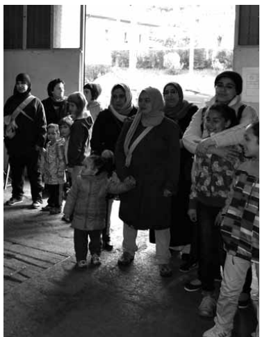
Elkar ezagutzuz, egun polita pasa zuten.