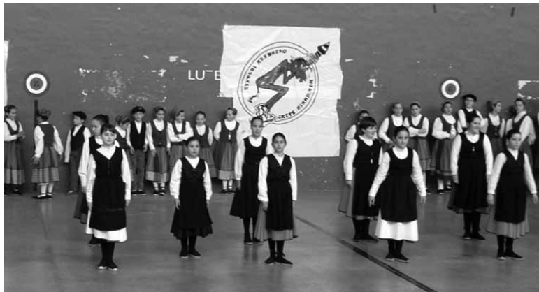
Ibarreko makina bat dantza taldeetako dantzariak emanaldia eskainiko dute.

Etxarri Aranazko Gazte Asanbladak egitarau polita prestatu du biharko