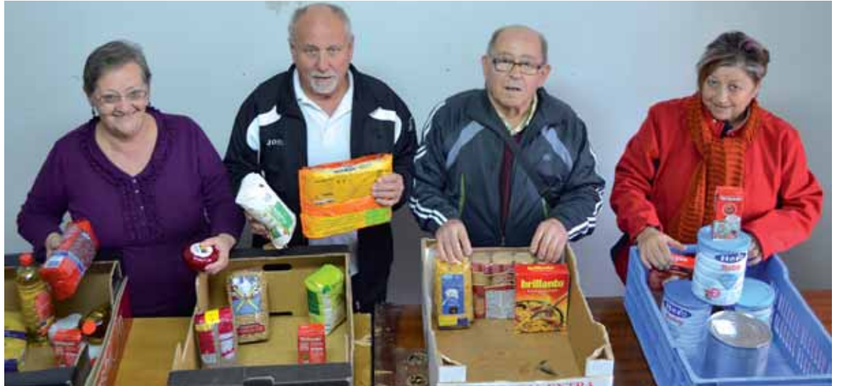
Elikagai bankuko boluntarioak.