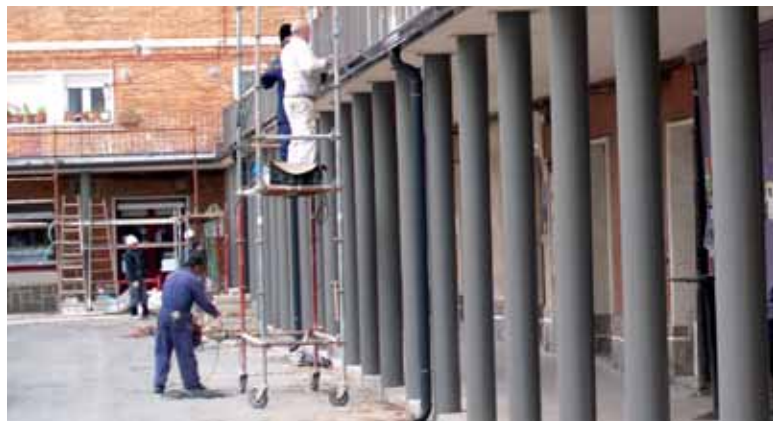
Zumalakarregi plazako konponketa lanetan.

Industrian lan egiteko prest %26,54 dago, 452 sakandar (3 gutxiago). Eskera kopuruaren aldetik erakuntza hirugarrena da %7,81 eta 133 eskaerarekin (4 gutxiago). Abeltzaintzak, azkenik, %1,76ren, 30 pertsonaren eskaerak jaso ditu (4 gehiago). Azkenik, aurretik lanik egin ez duten sakandarrak %6,11 dira, 104 (2 gehiago).