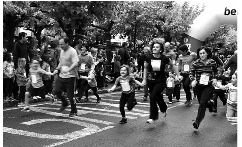
Txikiak eta helduak gustura aritu ziren korrika. MAIALEN HUARTE ARANO

Auzate batekin eman zioten amaiera ospakizunari. Antolatzaileak kontentua jendearen parte hartzearekin. Euriak, gainera, goiz osoan eutsi egin zion eta horrek bultzatu zuen jendea kalera ateratzera.