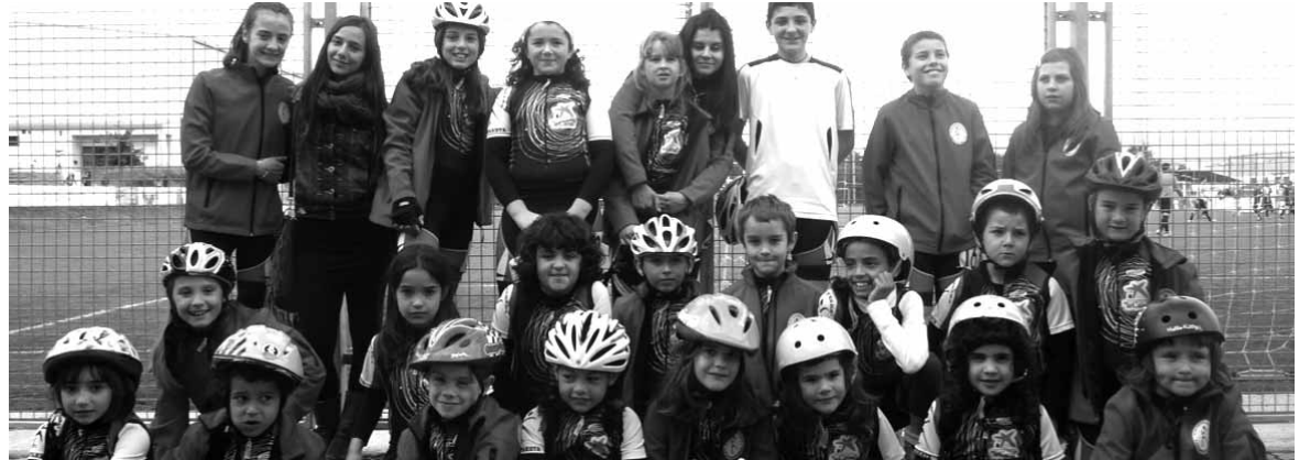
Sakana Irristaketa Taldeko kideak.