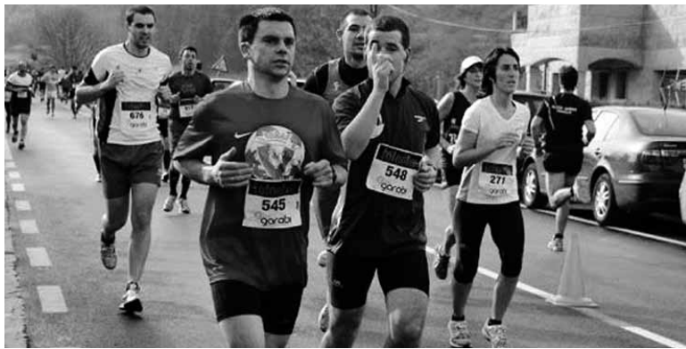
Ziordiarrek herrian korrika egiteko aukera izango dute.