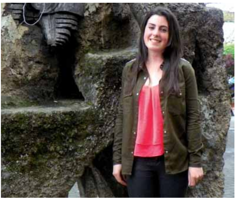
Elkarrizketa osorik: www.guaixe.net-en .