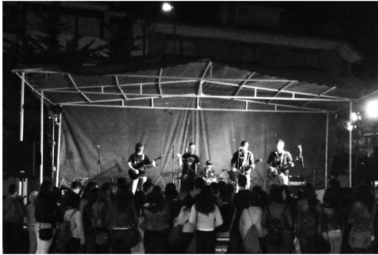
Aske taldekoen kontzertua, Gazte 2 Asteren barruan.

Asteburuan despedituko da Gazte 2 Aste programa, Altsasuko Udalararen Gazteria Sailak zortzigarrenez antolatu duena. Pasa den asteburuko hasiera indartsuaren ondoren 12 urtetik gorako gazte altsasuarrek Intxostiapunta gazte gunean jokoekin lotutako hainbat jardura izanen