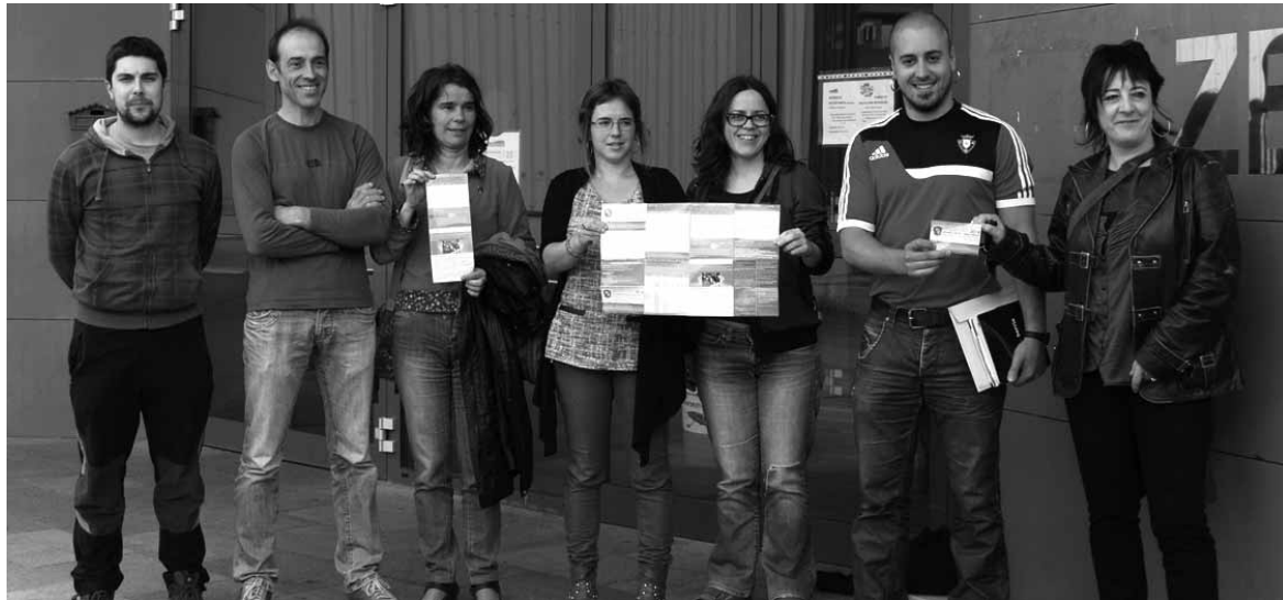
Altsasuko udal zinegotzi eta teknikariek aurkeztu zuten udarako eta ikasturte berrirako eskaintza.

Horregatik, udako eskaintzan berrikuntzak sartu dituzte eta kiroldegian aurki fisioterapia zerbitzua izanen da. "Langilea aukeratu dago, jarduera martxan jartzeko