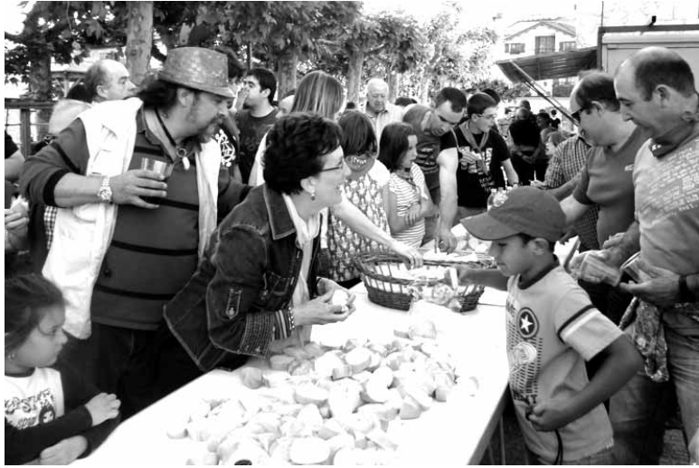
Arruazuarrak festetako auzatean.