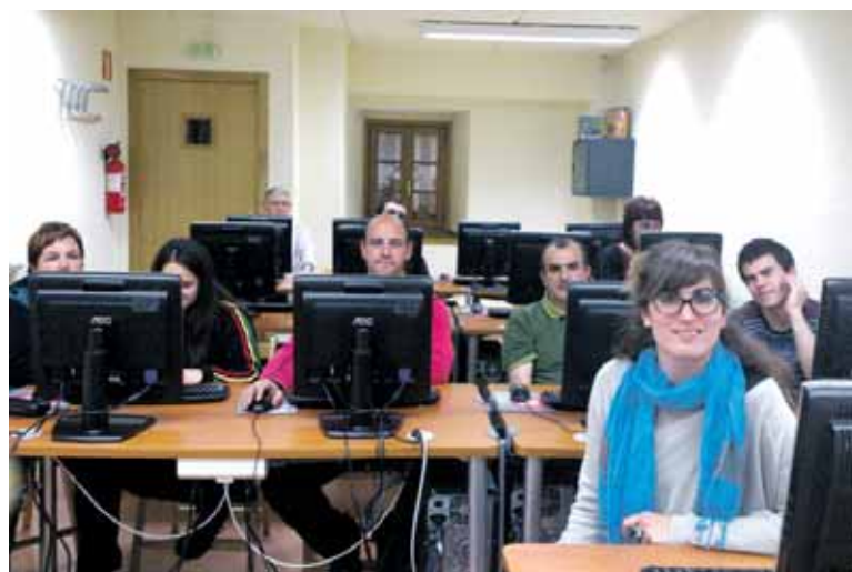
Guaixeko Komunitatea ezagutzeko aukera izan zuten talde olaztiarrek.

Asteartean egindako saioan parte hartu zuten olaztiarrek www.guaixe.net atariaren Komunitatea ezagutzeko aukera izan zuten. Sakana hedabidean parte hartzeari zabalik dagoen leihoa da Komunitatea. Edozein sakandari eta erakunderi zabalik dago eta haren bidez bere ekarpenak ibar guztira zabaldu ditzake klik batean. Hala frogatu ahal izan zuten asteartean Olatzagutian. Gainera, jabetuz ziren Guaixe.net-eko Komunitatera igotakoa hedabidearen sare sozialen