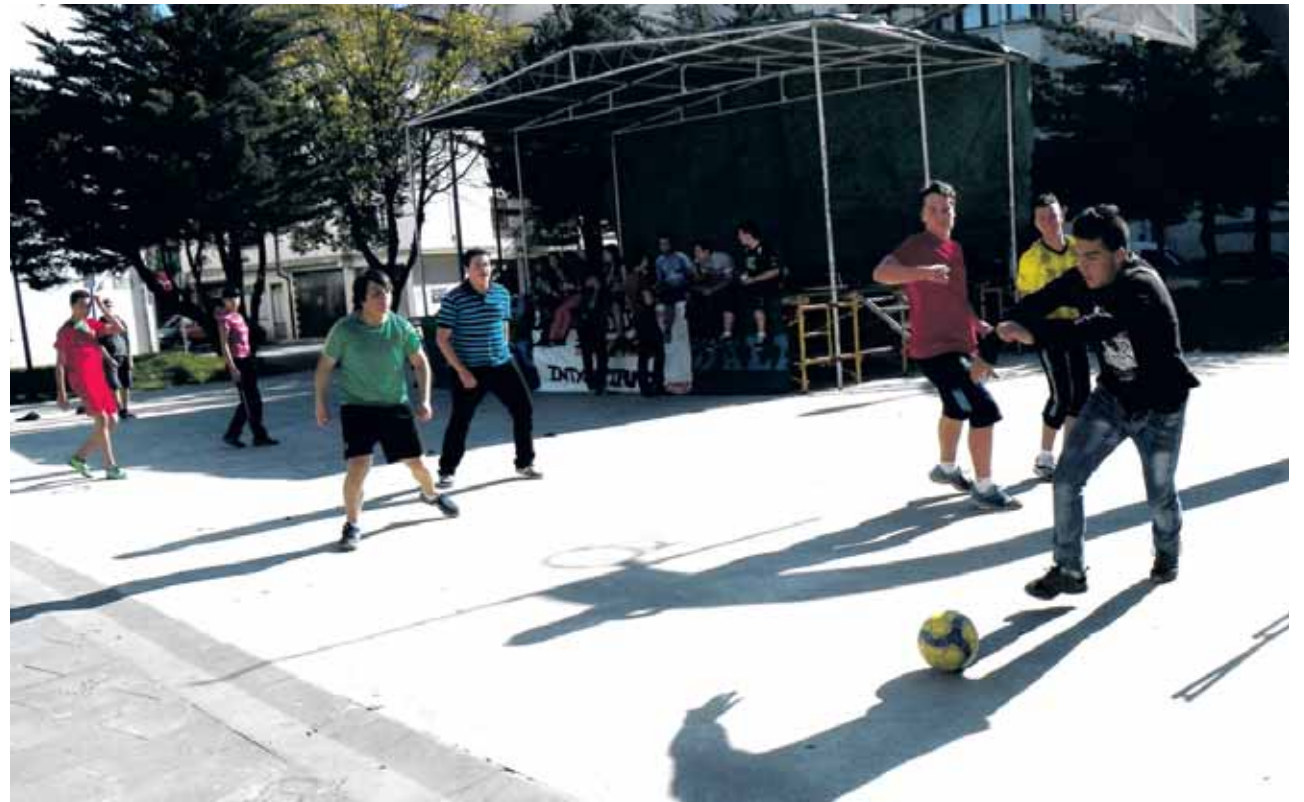
Altsasuko Gazte 2 Aste ekitaldien barruan areto futbol txapelketa antolatu zuten.

Koldo Arnanz arte eskola. Maiatzaren 31ra arte, astegunetan 18:30etik