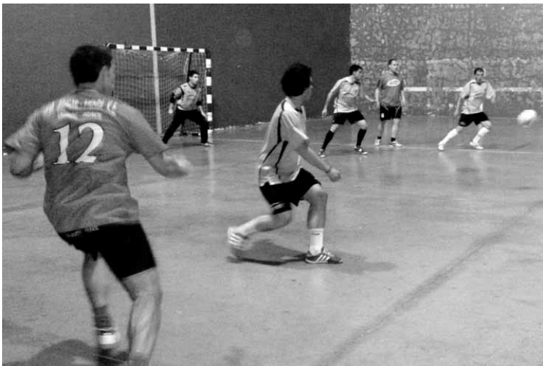
Arbizuk eta Racing San Migelek ligako finala jokatuko zutenekoa.

Arbizuk eta Racing San Migelek jokatuko dute Futsalsakana Kopa finala ostiralean, 20:00etan, Uhar-