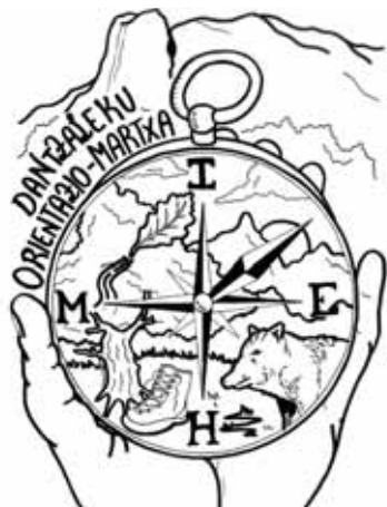
Orientazio probaren logotipoa.