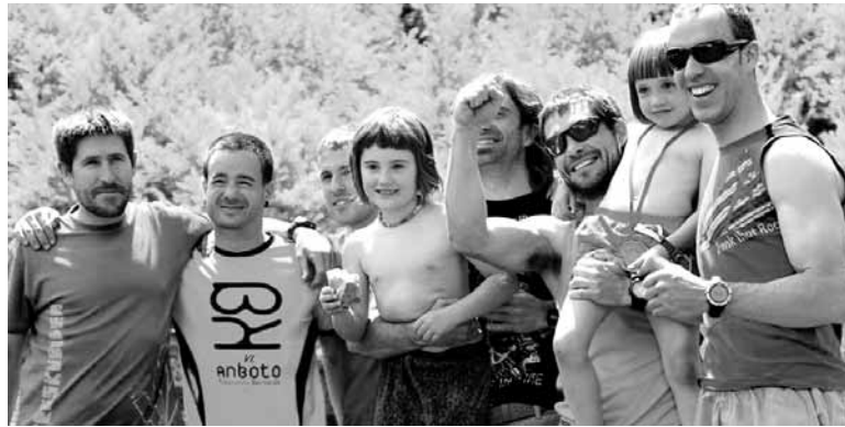
Sakana Bizirikekoak ospatzen. SAKANA BIZIRIK

Gauza jakina da mendi lasterketek zaletu ugari dituztela Sakanan. Zaletuak eta kirolariak. Geroz eta gehiago dira mendi lasterketetan aritzen diren sakandarrak, eta maila bikaina erakusten dute gure korrikalariak.