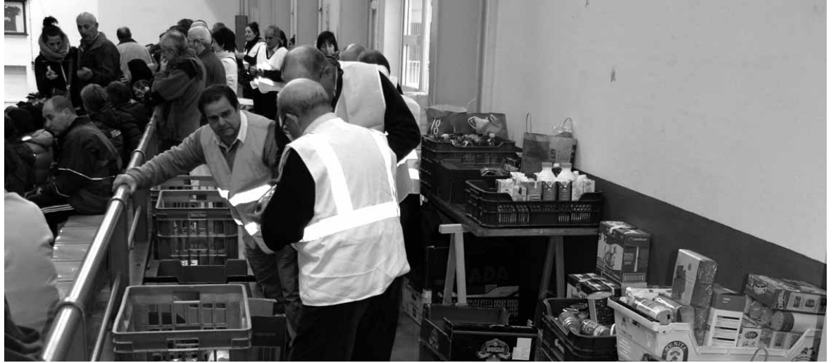
Irurtzunen jaki bilketa egiten.

Sakana erdialdeko dendetan poltsak utziko dituzte eta bezeroek haietan eman nahi dutena sartu beharko dute eta poltsekin zehaztutako tokietara joan beharko dute.