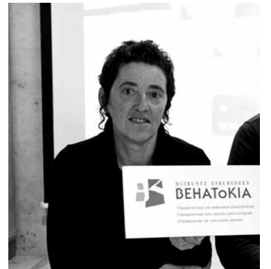
Behatoki Garbiñe Petriati.

duneko erakusten duen bazterketa eta gutxiespenaren aurrean, euskaraz kasi eta bizi nahi duten herritarren irmotasuna eta jarrera nabarmendu ditu Hizkuntza Eskubideen Behatokiaren zuzendariak.