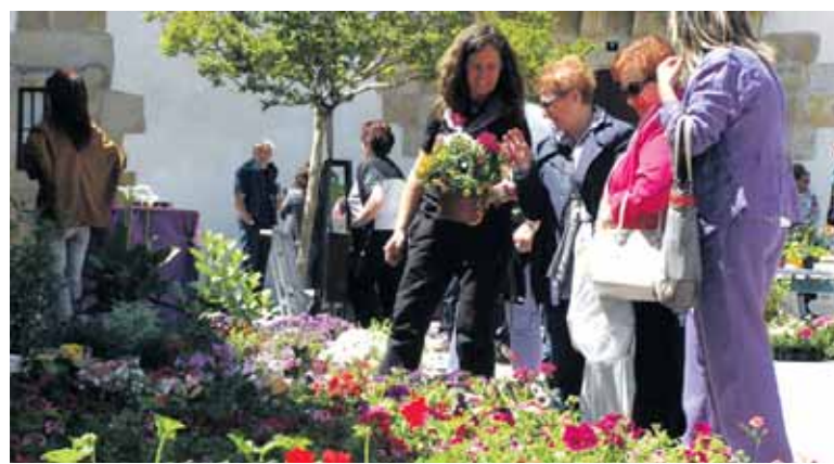
Emakumeak loreak gertutik ikusten.

den barreatuta. Eta haiekin batera, eskaintza zabala zuen Sakana Ezgaituen Elkarteara eta gehien bat gomazko eskumuturrekoak saltzen zituzten herriko haurrena. Txikiek, gainera, eskulanak egiteko aukera izan zuten ere. Kultur etxean ere jendearen joan-etorria nabaritzen, Lentzeria eta Literart erakusketek askoren arreta erakarri baitzuten.