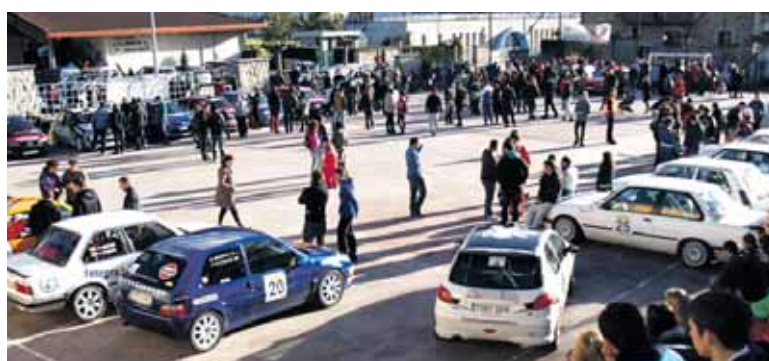
Futbito pista autoak ikusteko aukera izango da goizean.

Nahiz eta lehendabiziko autoa 13:30ean atera, goizetik zer ikusi egongo da Olaztin. Clinker aurreko futbito pista bilduko dira ibilgailu guztiak, egiaztapenak pasatzeko. Handik banaka-banaka joango dira irteera eremura (Ameztia kalea). Giroa lehen ordutik bermatuta dago. Ongi pasa, ingurunea zaindu eta segurtasun arauak errespetatu!