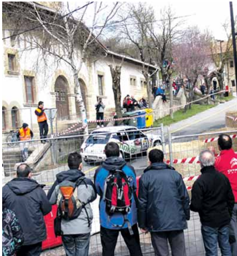
Olaztik kale estuetatik gora eta beheara ariko dira autoak.

Puntako ikuskizunak jendetza erakarriko duela uste du antolakuntzak. Zale ugari espero dira Olaztin. Proba gertu jarraitzeko aukera izango dute, antolakuntzak horretarako propio prestatutako erremuetan. Hortik kanpo ez koka-