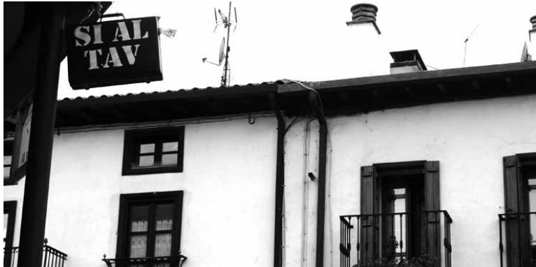
Larunbatean Maletin Deunaren eguna ospatu zuen Mugitu!-k.

MIMtik salatu dute AHTkolanak "Milaka milioiren xahuketa eta lurren txikizioa izateaz gain, AHTa proiektu hondatzaile bezala ari da indartzen, zein, osasungintzan, hezkuntzan eta zerbitzu sozialen murrizketasendoen testuinguruan geure poltsikoak hipotekatzen ari den harri pisutsua dugun". Maletekin "eraikuntza enpresa handien eta arduradun politiko batzuen elkar hartzea" salatu zuten. Eraikuntza enpresa handien lobbyak administrazioei egiten dien presioa ere nabarmendu du Mugitu!k.