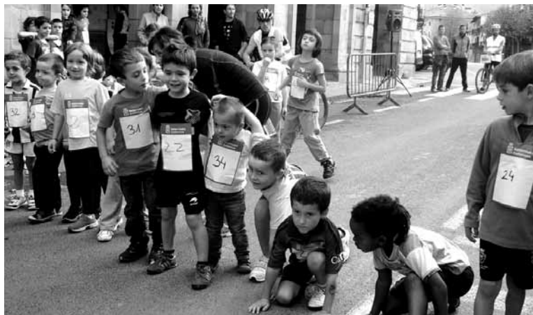
Txikienek helduekin batera parte hartu beharko dute.

Lasterketaren berezitasun nagusia binaka korrika egin behar izango dela da, hau da, haurrak heldu batekin batera egingo du laster. Bere gurasoa, osaba-izeba, lehengusua, bizilaguna, laguna edo dena delakoa izan daiteke.