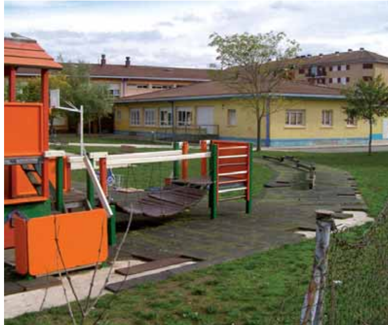
Zelandiko patioan estalitako eremua eta zorua konpondu beharra dago.

Gurasoen ordezkariak nabarmendu zuten familien bi herenek irakaskuntza publikoaren alde egiten dutela eta larritzat jo zuten gobernuak hezkuntza publikoari lehentasuna ez ematea. Hezkuntza Departamentuaren zenbait jokabide salatu zituzten. Batetik, zonifikazio bakarra, ikasleei bere herri edo auzoan hezkuntza publikoko plaza bermatzea zailtzen duena. Bestetik, eskolatzeko irizpideen malgutasuna, ikastetxe kontzertatuei ikasleak aukeratzeko aukera ematen diena eta ikasturtean zehar beste toki batzuetatik etorritako ikas-