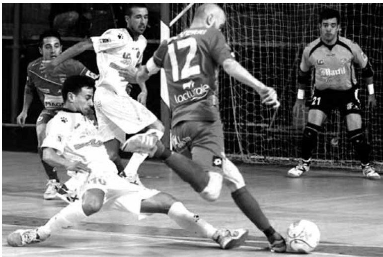
Imanol Ezeverrik gol bat sartu zuen.