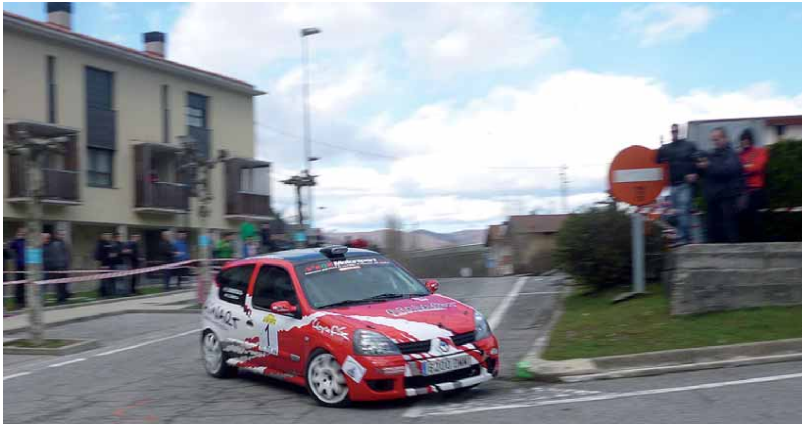
Bihar, 15:30etik aurrera, II. Guaixe Saria rallysprinta jokatu da Olatzagutian.

Arruazuko Udalak UEMAn sartzea erabaki du >>3