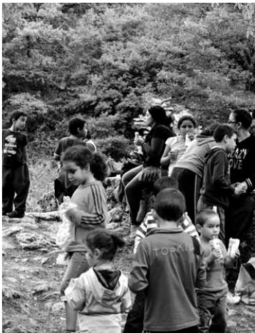
Aurreko urteko txangoa.

Guztiek ere Irurtzungo plazan dute hitzordua etzi, 9:00etan. Handik Izurdiagara abiatuko dira. Elizan harrera eginen die kontzejuko kide batek eta herriaren berri emanen die bildutakoei. Azalpen horien ondoren, forjaren interpretazio gunera bisita eginen dute. Brundarregandik beharrezko azalpenak jaso ondoren, eramandakoa bazkalduko dute. Horrek