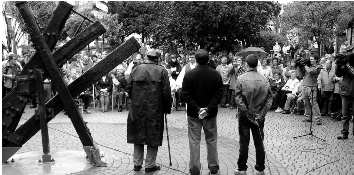
Langile soldaduen batailoietan ibilitakoak ormentzeko oroigarria mustu zen 2008ko maiatza akaberan.

Pixkanaka jasotzen joan direna aurkeztuko dute gaur jendarean Iortia kultur gunean, Altsasu Memoriaren helburuetako bat baita "gure historia guztiakin partekatzea". Taldeak gaur Altsasuko historiaren aurreko atala aurkeztuko du. Herriaren lehen aipamena egiten duen agiritik 1.950 urtera arteko tartea hartzen du lehen atalak. "Ezinezkoa zai-gunez jasotako guztia xehetasunez