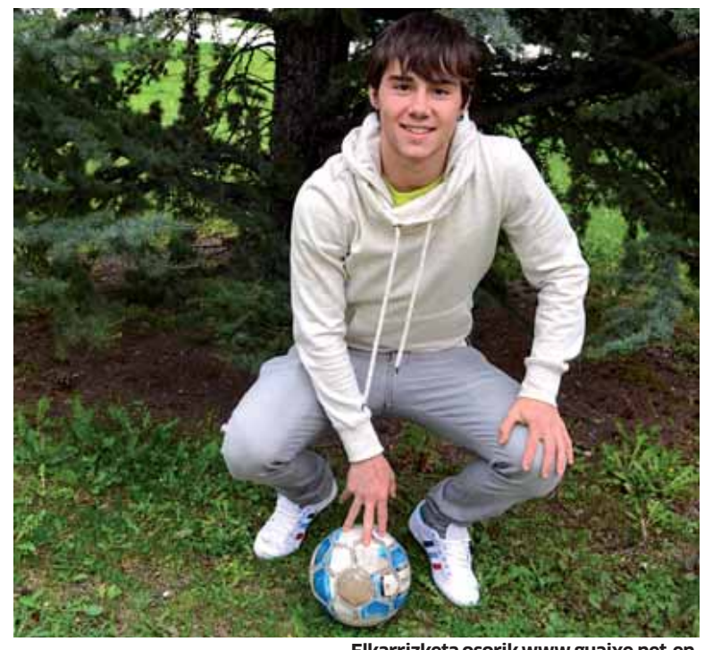
Elkarrizketa osorik www.guaixe.net-en .