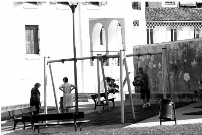
Haur eta gurasoendako txoko bat sortzea da proiektuetako bat.

Herrian barna jarritako hainbat kutxetan botoak sartuz edo preparirurtzun@gmail.com e-posta bidez ere egin daiteke. Aurrekontu parte-hartzaileak sustatzen dituen taldeak irurtzundarrak heldu den urterako proposamenak gehitzera animatu ditu, 2015erako baliagarriak izanen direlako.