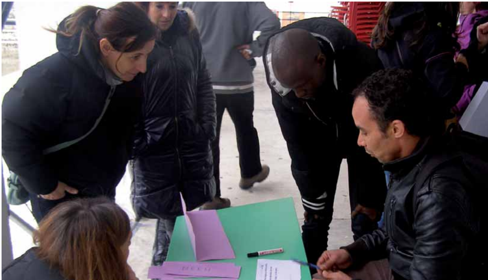
Kulturen arteko zubi lanak egiten dituzte boluntarioek.