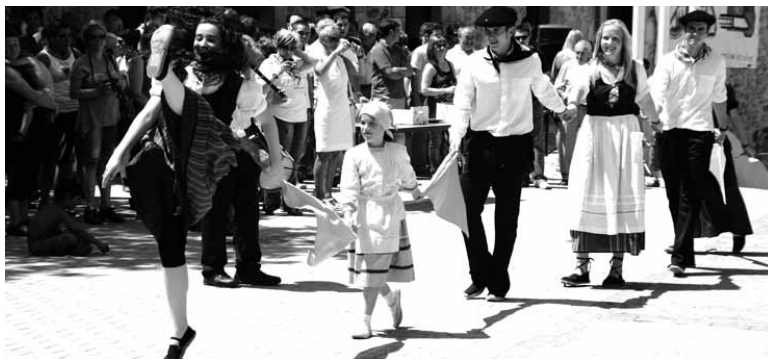
Ospakizunak nolakoak beharko luketen ere jasotzen da inkestan.

Bakaikuko Udalak herriaren 2025 urte bitarteko beharrei aurre egiteko plana osatu nahi du bakaikuarren laguntzarekin. Horregatik dinamika parte-hartzailea abiartu du. Lehen urratsa etxetara inkesta bat banatzea izan zen. Bakaikuarrek hainbat gairen inguruan iritzia eman eta ekarpenak egiteko aukera ematen du inkestak. Haiek aurkezteko epea apirilaren 4ra arte luzatzea erabaki du udalak. Inkestak udaletxeko bulegoan edo postontzian utzi ditzakete bakaikuarrek. Bitartean udala jubilatuko eta Bakarrekotxearen elkarteko ordezkariekin elkartuko da, beste eragile batzuekin egin duen moduan.