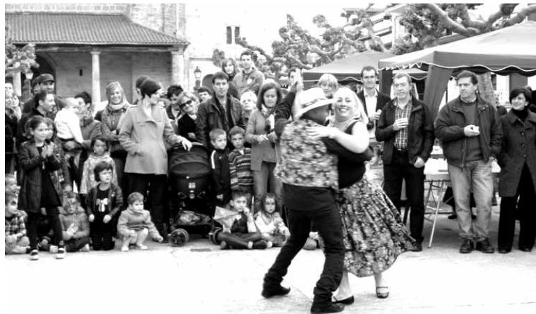
Makina bat kultura bizi dira Sakana, bakoitza bere bereizgarriekin.

Egoera ikusita azaroan eta abenduan jatorri magrebarreko 12 sakandar berri kultur bitartekari izateko trebatu zituen Immigrazio Zerbitzuak. Jasotako trebakuntza-aren ondoren boluntario gisa ari dira kultur bitartekari lanetan, batean eta bestean. Hala, prestakuntza saio horiei esker Bitartekaritza Zerbitzuaren jarraipena bermatuta dago, urte guztirako. Horrek Magrebetik Sakanara etorritako pertsonen elkar ulermena erraz-