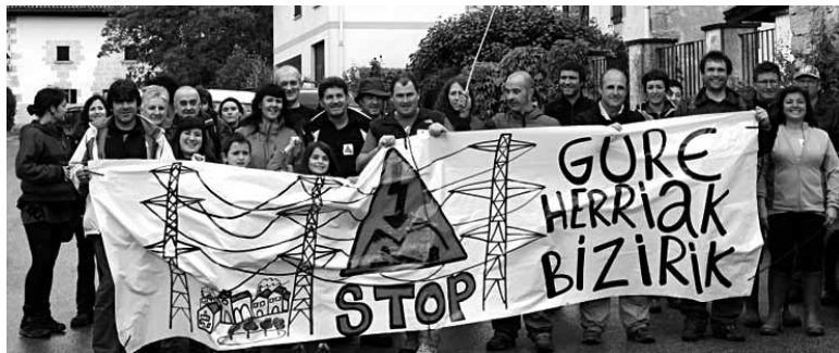
Argindar linearen kontra aurretik ere protesta egin dute

igandean Ezkio-Itsaso artean aurreikusitako lineako 247 dorreen kokalekuan protesta egingen dute lurkideek. Irurtzunen elkartuko dira ondoren