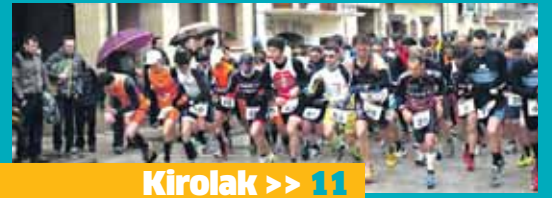
Kirolak >> 11

Bihar Arbizun egungo duatleta onenak lehiatuko dira. Goizez, haur duatloia izanen da, arratsaldean, berriz, helduena