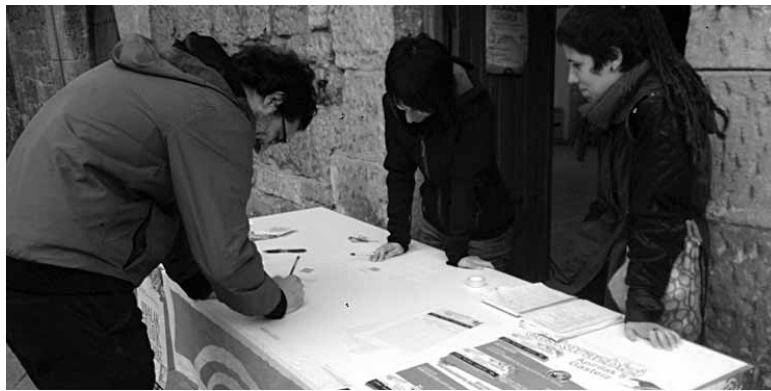
EHEkoen mahaian udalarekin euskarazko harremana izan nahi duela sinatzen.