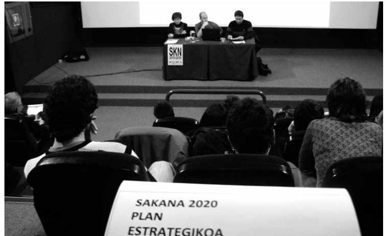
Plana ezagututa ekarpenak egiteko aukera dugu sakandarrok.

SPE www.sakanagaratzen.com -en kontsultatu daiteke. Atari berean prozesu parte-hartzailean zehar lan-talde bakoitzean egin diren diagnostiko osoak eta AMIA taulak kontsulta daitezke. SPE aberasteko sakandarrei ekarpenak egitea eskatu diete eta horretarako epea apirilaren 3ra arte dago zabalik. garapena@sakana-mank.com helbidera bidali behar dira ekarpenak. Lan batzordeak aztertu eta Sakanako Sozio-ekonomia Behatokiak apirilaren 12rako azken oniritzia emanen dio planari. Udaletan aurkeztuko da oniritzia emateko.