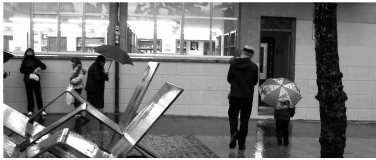
Etxarriarrak liburutegi atarian.