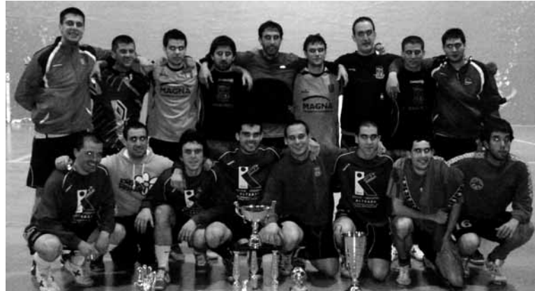
Arbizu txapelduna eta Racing San Migel txapeldunordea, elkarrekin.