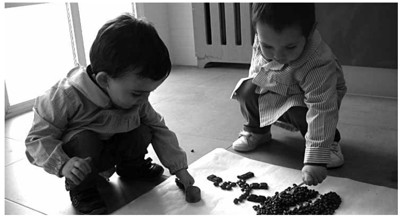
Umeak haur eskolan.

Pasa den asteko euriteek ibaiak berriro gainezka egitea eta Irañetarako errepidea ixtea ekarri zuten. Pasa den urtean uholdeak