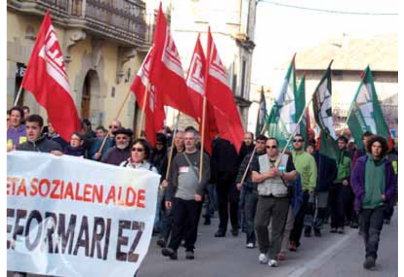
Gune plataforman euskal gehiengo sindikala eta hainbat erakunde daude.

Sektore publikoak oinarriko eskubideak bermatu behar dituela aldarrikatuko dute. Zerbitzu publikoen, kalitatezko enpleguaren, etxebizitza eskubidearen alde azaldu dira Guneko kideak. Sakanatik pasatzerakoan martxako kideek salatuko dute gero eta jende gehiago dagoela etxean jatekorik ez duena eta elkartasun beha-