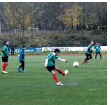
Topaketetako partida bat.