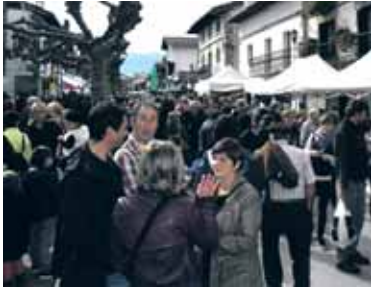
Jendea Arbizuko plazan.