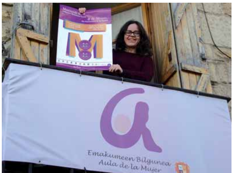
Elkarrizketa osorik www.guaixe.net-en .