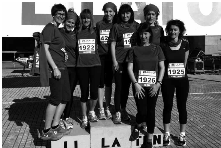
Igandean sakandar asko aritu ziren Lilatoian. Ea Lilasterketara animatzen diren!

Izan ere, berdintasunaren aldeko lasterketa hau ez da proba lehiakorra izango. Korrika, oinez, patinetan, bizikletan... norberak ahal duen moduan proba egiteko aukera izango du, helburua emakumeen