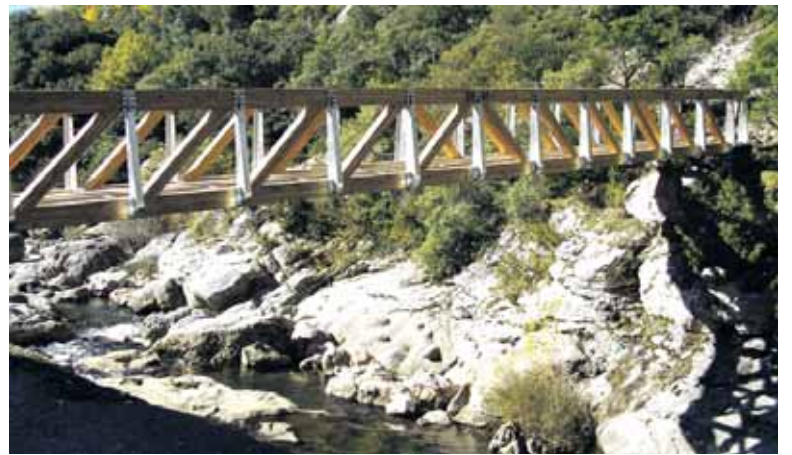
Arakilgo bide sarearekin bat egiteko aukera aztergai dute.

Biaizpetik nola pasa aztertzen ari dira gaur egun Plazaola turismo partzuegoan. Bi aukera aztertzen ari direla azaldu digu Ezkutarik. Lehena Larraun ibai ertzean dagoen arrantzaleen bidearekin lotzea litzateke. "Hala, Arakilgo ibilbideen sarearekin lotuko litzateke eta Irurtzunerajoateko aukera legoke. Oinezkoendako aukera ona da, baina ez txirringulariendako".