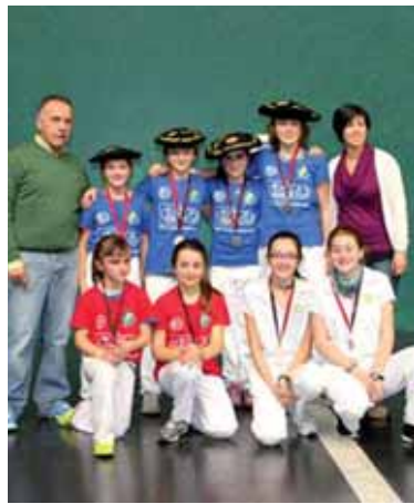
Nafar Kirol Jolasetako txapeldunak.

Jubenilak: Murillo-Lusarreta (Oberena) 25 - Ansotegi-Lasa (Gure Pilota) 15