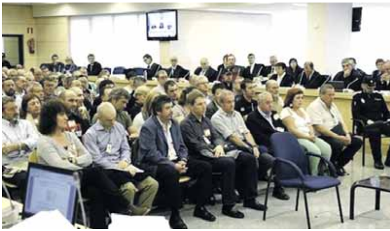
Madrilgo auzitegian izan da epaiketa.