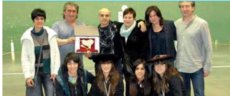
Larunbatean Euskal Herriko Elkarten arteko Ligako finalak jokatu ziren Zierbenan. Kadeteen mailako finala Etxarri Aranazko Gure Pilota elkarte bi bikoek jokatu zuten, Atxa-Uxue eta Andrea-Izar. Lehendabizikoak nagusitu ziren, 30-25. Zorionak!