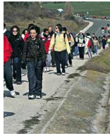
Jende ilarak sortuko dira atzera ere.