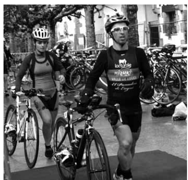
Aurreko urteko Arbizuko duatloia.