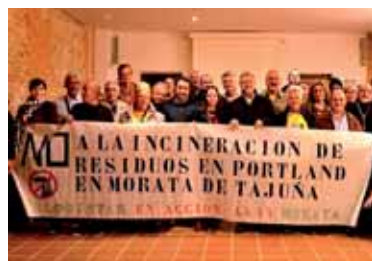
Parte hartu zutenetako batzuk.