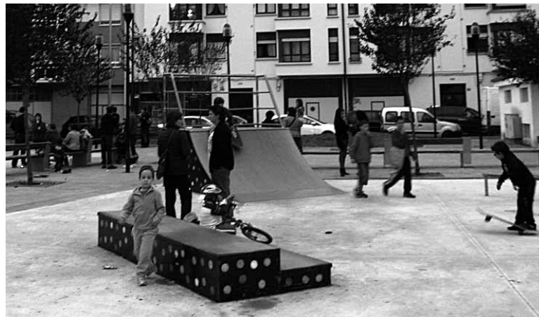
Haurrak jolasten.

Esperientzia duten begiraleekin ariko dira 3 eta 12 urte bitarteko haurrak alde batetik eta, bestetik, behar bereziak dituzten 12 urte-