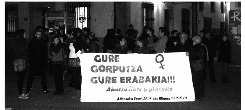
Abortatzeko eskubidea aldarrikatu zuten ostiralean Altsasan.

udaletxe parean. Espainiako Gobernuak proposatu duen legearen kontra protesta egin eta abortatzeko eskubidea defendatu zuten. Altsasuko Feministak eta Bilgune Feministak deitu zuten elkarretaratzea.