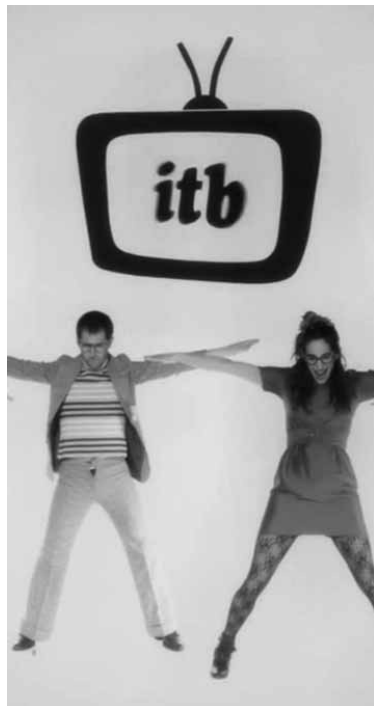
Sasoi berriarekin, irudi berritua.

Itxuraldatua etorri da Irurtzun Telebistaren denboraldi berria. Platoa eta saioaren irudia aldatzearekin batera, eduki berriak ere gehitu dituzte. Hala, azken saioan inauterien berri emateaz aparte, bi atal berri mustu dituzte. Bate-tik, atzerrian diren irurtzundarrek euren bideoak bidaltzeko atala eta, bestetik, bekariora bilatzeko tele-kastinga. Batera eta besterajendeak bere bideoak bidali ditzake (itb.irurtzuntelebista@gmail.com). Gainera, agenda atal bat sortu dute eta Facebook bidez harremanetan jartzeko bidea eman ere. Berrituta, beraz, ITB.