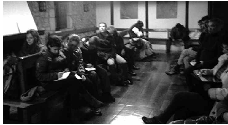
Gaztainondoez hitz egitera bildu zirenekoa. UTZITAKOIA

Basozainak, profesionalak eta herritarrak elkarlanean aritzea-